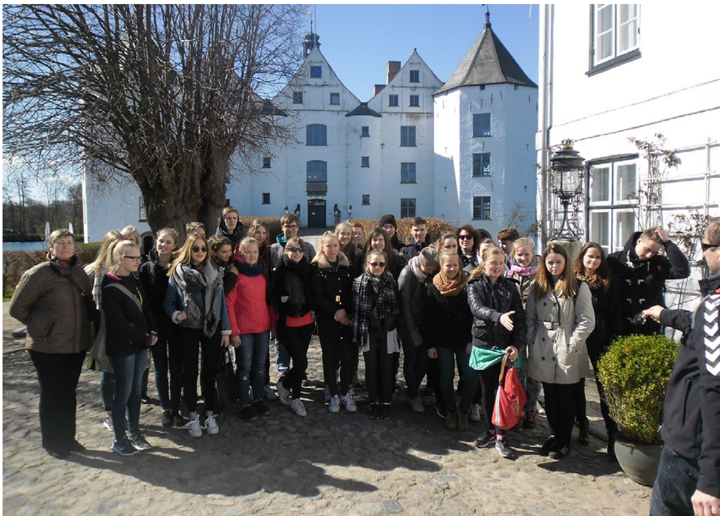
Glicksburgas pils apmeklējums vienmēr ir interesants un atraktīvās gides stāstījums - atmiņā paliekošs

burgas pili (renesanses laika pils ūdenī, ko sauc par Eiropas karaļnamu šūpuli, būvēta 16. gs.). Atraktīvā gide, ģērbusies atbilstoši pils tapšanas laikam, prata mūs aizraut ar saviem stāstiem.