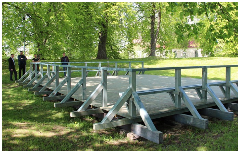
Pilskalnā nekas nav mainījies, tikai skatuve ir atjaunota