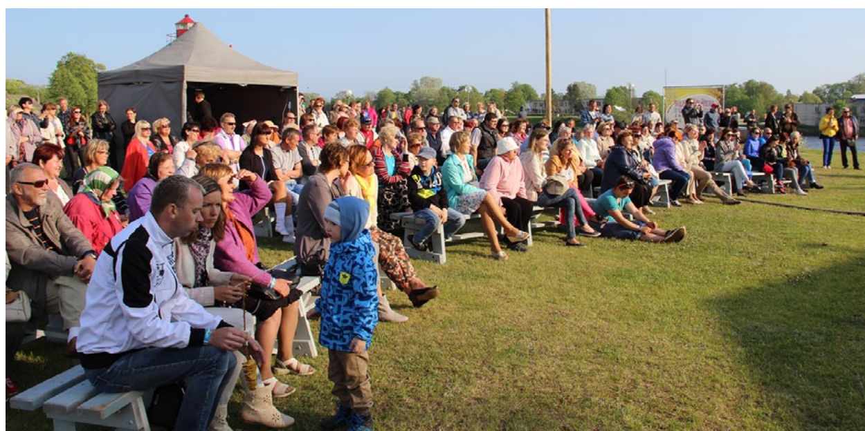
Skatītāju un klausītāju netrūka ne dienas, ne vakara koncertos