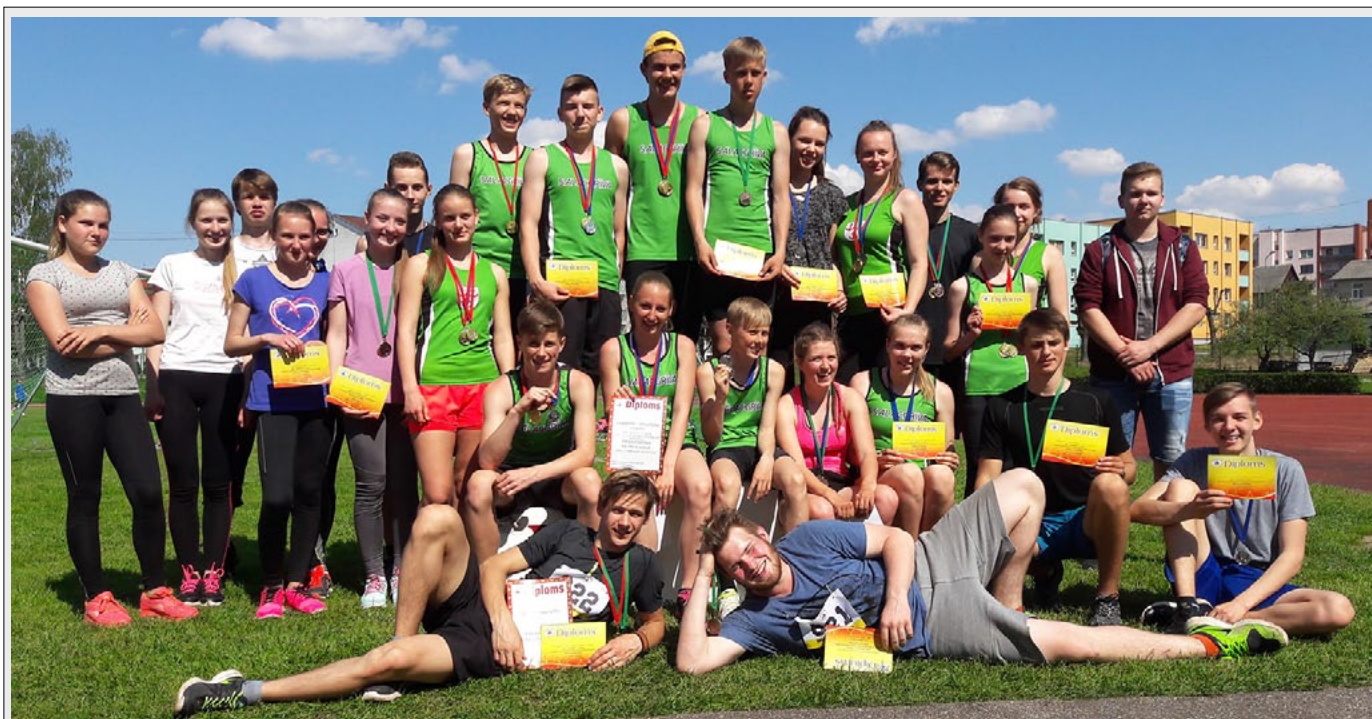
10. maijā Limbažos pulcējās Limbažu, Salacgrīvas un Alojās novada skolas, lai piedalītos gadskārtējās sacensībās vieglatlētikā 7. - 12. klašu grupā. Ļoti veiksmīgs bija Salacgrīvas vidusskolas audzēkņu starts - tika izcīnītas 56 medaļas dažādās vieglatlētikas disciplīnās.