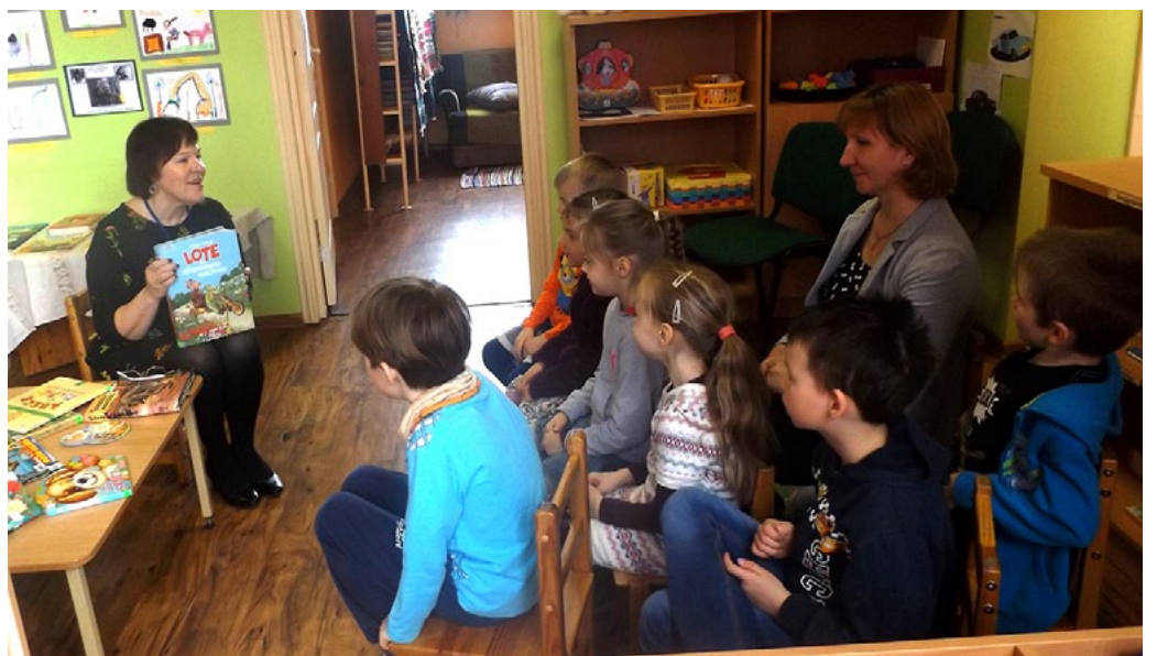
Snīpi ir bieži viesi Svētciema bibliotēkā

Svētciema bibliotēkai ir laba sadarbība ne tikai ar bibliotēkām, bet arī citām novada iestādēm un biedrībām. Par labu tradīciju šīs nedēļas laikā jau kļuvusi jaunāko sadarbības partneru ciemošanās bibliotēkā jeb Mazo ciemiņu diena. Pirmsskolas grupiņa Snīpi bibliotēkā jau bijusi vairākkārt, taču šoreiz sarunas bija pavisam nopietnas. Sākumā bibliotēkas iepazīšanas nolūkos vēlreiz izstaigājām un izložājām pa visām telpām un plauktiem, iepazīnāmies ar izstādēm, datoriem, žurnālu plauktu noslēpumiem, līdz sākām sarunas par grāmatām. Bērniem vairs nebija pārsteigums runājošās vai pikstošās grāmatas, jau iepazītas bija arī kinostāstu grāmatas. Jautrs notikums bija, kad nācās rokās turēt vissmagāko bibliotēkas grāmatu - fotoalbumu Zeme no putna lidojuma . Mazajiem ciemiņiem tika rādītas grāmatīņas, ko bērni bā lasījušas viņu omītes un opīši. Salīdzinājām ilustrācijas, runājām par grāmatu saudzēšanu, arī par pašas grāmatas tapšanu un uzbūvi. Vienmēr patīkami ir paņemt rokās jaunu grāmatu, ko neviens