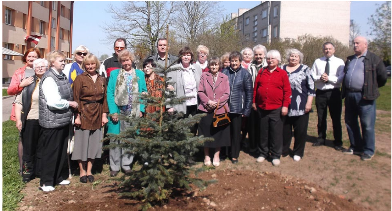
Liepupes bibliotēkas pagalmā tagad kuplos pašu stādītā egle