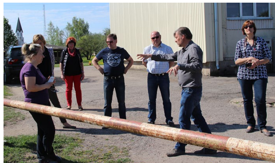
Vērtēšanas komisija kopā ar biedrības Vidzemes iela 5 projekta iesniedzēju apspriež, kā labāk labiekārtot mājas pagalmu

Šogad trīs projekti iesniegti no Ainažiem. Biedrība Zaļā māja savā projektā Bērnu sapņu valstība mājas pagalmā bija iecerējusi izveidot bērnu rotaļu un volejbola laukumus. Iedzīvotāju grupa K. Barona ielas 12 Zaļais pagalmis iecerējusi iekārtot atpūtas zonu, savukārt biedrība Ainaži-93 vēlējas nomainīt bojātās veļas žāvētavas jumtu, lai izveidotu vietu kopīgai atpūtai