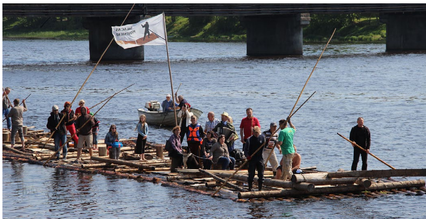
Plosti tuvojas savam galapunktam