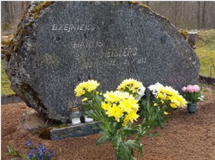
Pieminot un godinot dzejnieku jubilejā, viņa atdusas vietā - Stienūžu kapos Salacgrīvas pagastā - tika nolikti ziedi un aizdegta sveces

Harijs Heislers bija viens no populārākajiem dzejniekiem pagājušā gadsimta 60. - 70. gados. Viņa dzeja - trausmaina un publicistiska - rakstīta klasiskajā dzejas formā. Tajā dominēja idealizēts skatījums uz dzīvi, kā arī mīlestības, dabas un vientulības tēmas. Ar H. Heislera dzeju tapušas vairākas latviešu estrādes dziesmas, piemēram Sapņu bites, Piedod man, jūra, Tev jāatnāk, Laimes putns . Trīs dzejoļu grāmatas sarakstītas arī bērniem. Tajās liriski atainojis bērnu ikdienu, pārdzīvojumus, vārsnās dominē humors, ironija un smaids.