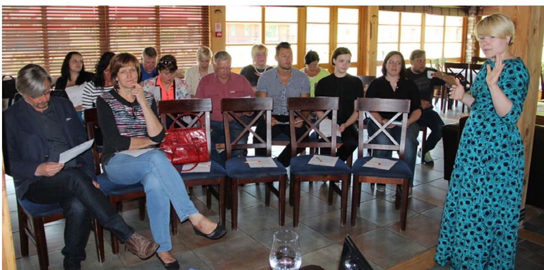
Tūrisma jomas pārstāvji tiekas Rakaros

jūsu profesionālais viedoklis mums ir svarīgs. Novēlu veiksmīgu sadarbību! Mēs esam gatavi jūs uz klausīt un priecāsimies par kopīgi labi pieņemtiem lēmumiem. Domes priekšsēdētājs ir gatavs piedalīties jaunās padomes sēdēs, lai informētu par novadā notiekošo un uz klausītu viedokļus.