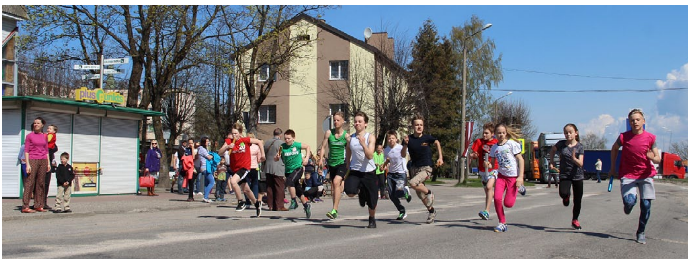
Maija skrējienā piedalījās novada skolēni un arī pieaugušie

2. - 3. klašu grupā stafetē piedalījās piecas komandas (katrā 4 meitenes un 4 zēni), 600 m garā distance tāpat bija sadalīta