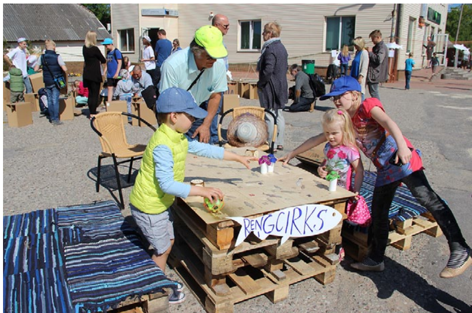
Rakaru murdiņā Bocmaņa laukumā mazie varēja uzspēlēt Reņģu cirku un ne tikai...