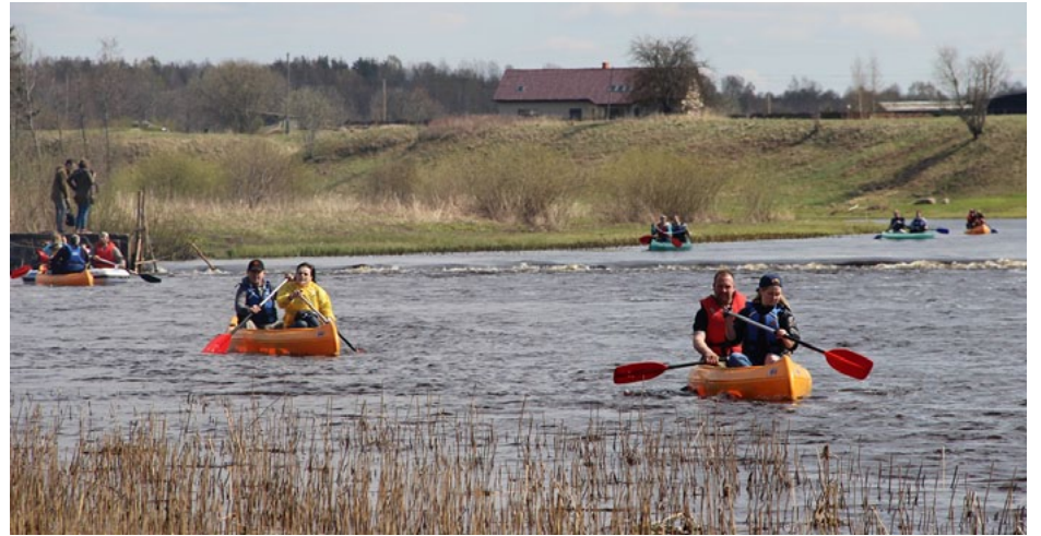
Laivošanas sezonas atklāšanā piedalījās liels skaits laivotāju - aptuveni 80!

Lai popularizētu aktīvās atpūtas iespējas Salacgrīvas novadā, īpašu uzsvāru liekot uz mūsu ūdeņu bagātībām, 2016. gada pavasaris tika izvēlēts Salacas laivošanas sezonas atklāšanas pirmā notikuma organizēšanai. Izvēle izrādījās trāpīga, jo 30. aprīļa diena bija saulaina un neseno lietu dēļ upes straume bija tik ātra, kā vēl nekad. Arī laivotgribētāju bija gana - ierindā bija 8 piedabas.lv kanoe laivas, 20 Lāču laivas kanoe, 4 Tubers piepūšamās laivas un 1 peldkamera. Tajās sēdās aptuveni 75 laivotāji. Tas pārsniedza gaidīto, tādēļ prieks par saulaino dienu bija vēl lielāks.