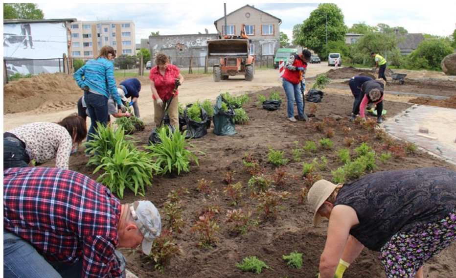
Dienu pirms Reņģēdāju festivāla Jahtu laukumā notika lieli stādīšanas darbi. Paldies talciniekiem!