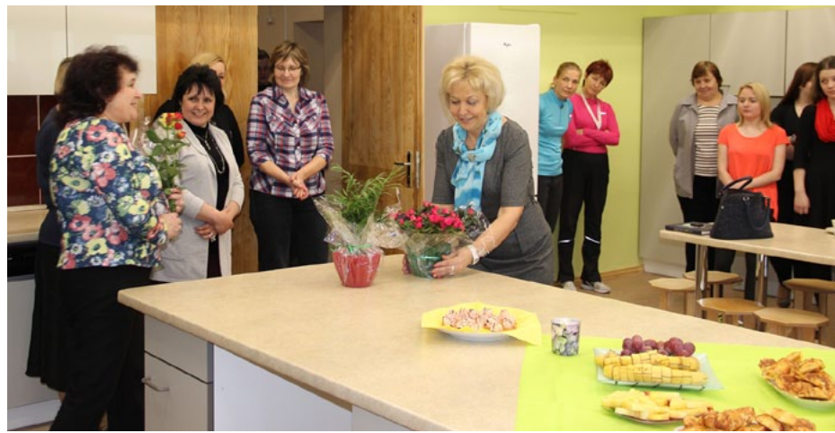
Jaunā skolas mācību virtuve atklāšanas dienā dāvanās saņēma krāšņus ziedus

skolēni, skolotāji un, protams, mājturības skolotāji, kuri jau pavisam drīz iemēģinās virtuves jaunās iekārtas.