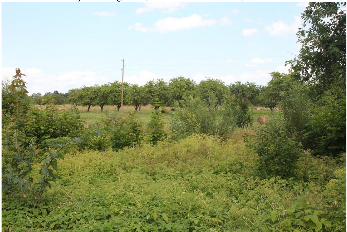
6.attēls. Īpašums „Pašvaldības ābeļdārzs“. Priekšplānā ruderāls biotops ar podagras gārsas audzi.