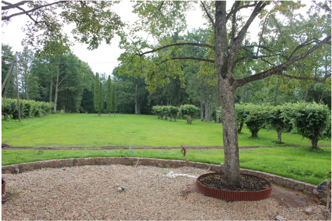
3. attēls. Skats uz parka līdzeno daļu.