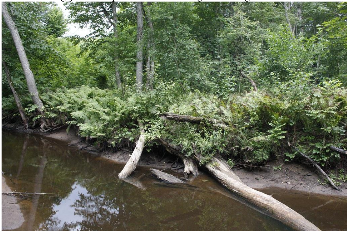
8.attēls. Liepupes krastos veģetācijas sezonas laikā jānosaka aizsargājamo meža biotopu klātbūtne. Spriežot pēc attēla, šeit varētu būt ES nozīmes prioritāri aizsargājams biotops - 91E0* Aluviāli krastmalu un palieņu meži.