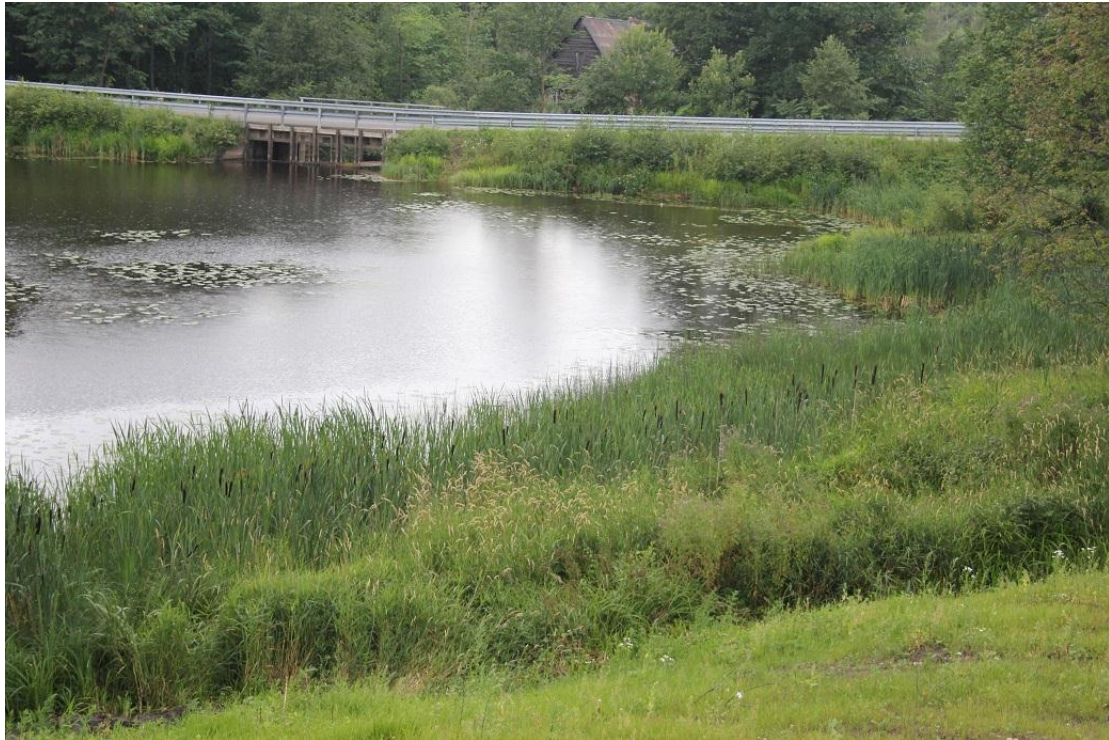
7.attēls. Liepupes uzpludinājums. Tā krastos iespējami dabisku pļavu fragmenti un ES nozīmes aizsargājams biotops – 6430 Eitrofas augsto lakstaugu audzes.