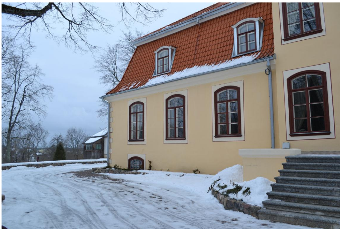
1.attēls. Liepupes muižas ēka.

par Salacgrīvas novada Liepupes pagasta detālplānojuma „Liepupes muižas parks un tam pieguļošā teritorija“ daļēju augu sugu un biotopu izpēti.