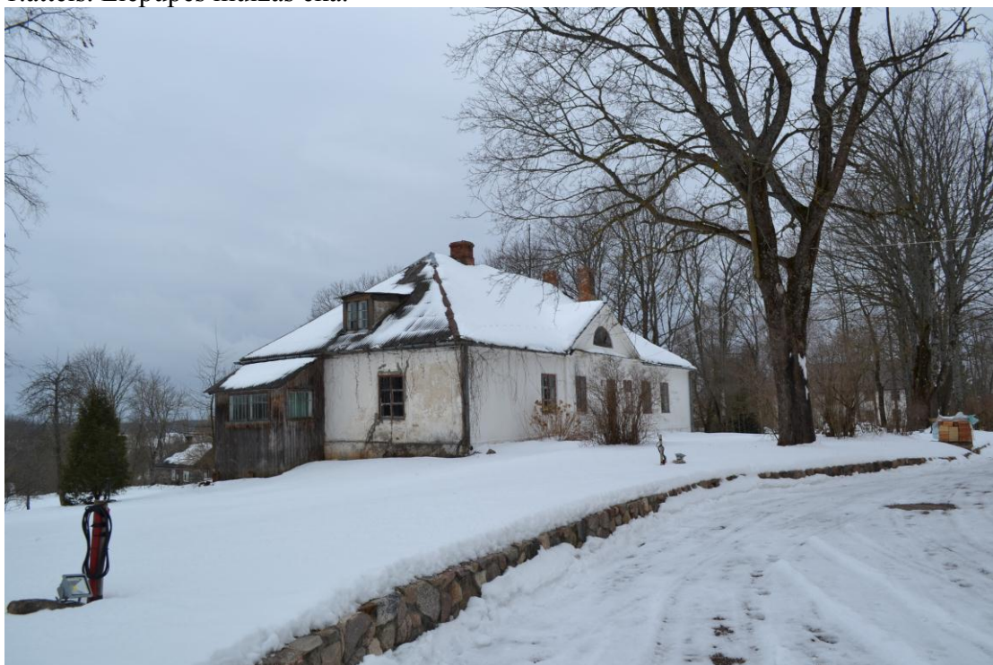
2.attēls. Ēka īpašumā „Liepupe 2”.