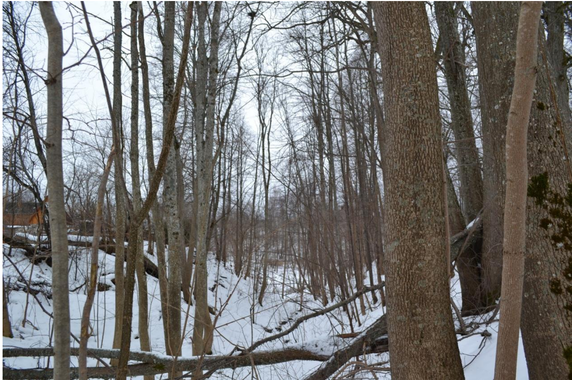
5.attēls. Neliela grava īpašuma „Muižas parks“ austrumu malā. Attēla kreisajā malā redzama ēka kaimiņu zemes gabalā (kad. Nr. 66600090019).