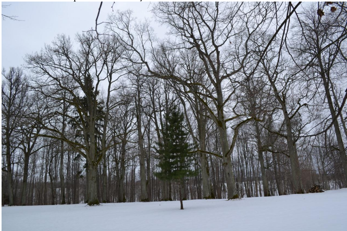
4. attēls. Parka pāreja mežā Liepupes krasta nogāzē.