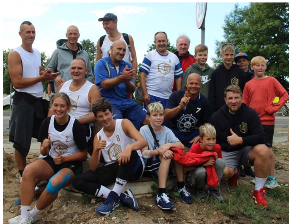
Uzvarētāju nevilgotais prieks