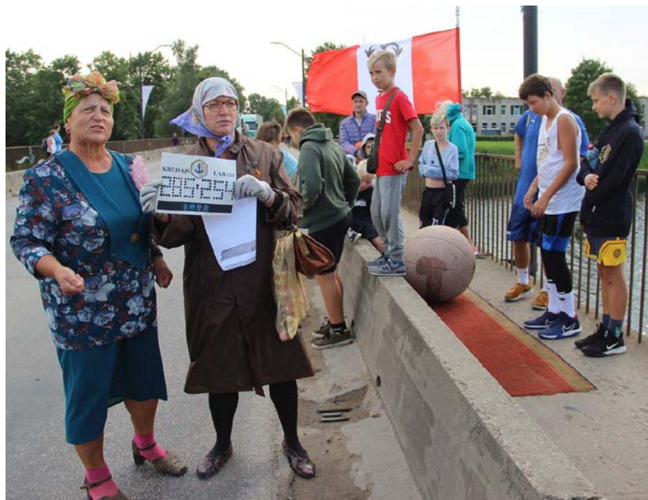
Olgas un Alms paziņo rezultātu – šogad uzvarēja kreisais krasts