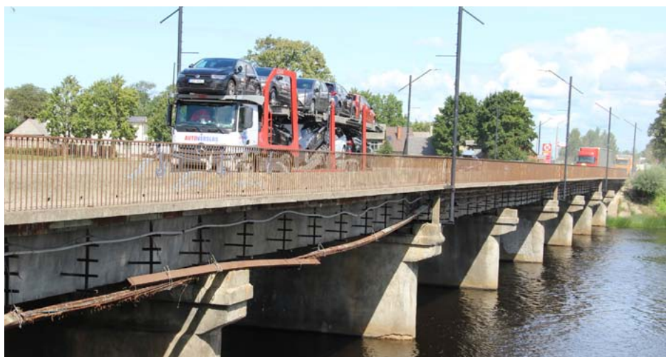
Tilts pār Salacu Salacgrīvā gaida savu remontu

Limbažu novada pašvaldības sēdē 29. jūlijā pieņemts lēmums par tilta pār Salacu autoceļa A01 Rīga–Ainaži 91,20. km būvprojekta izstrādei nepieciešamo finansējumu. Novada pašvaldības iestāde Salacgrīvas administrācija plāno veikt tilta pār Salacu, kas iekļauts valsts galvenā autoceļa A1 maršrutā, būvprojekta izstrādi.