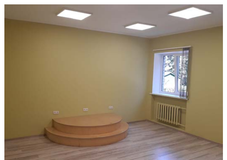
Ainažu bibliotēkas zālīte pēc remonta kļuvusi gaiša un saulaina

28. jūlijā pabeigti remontdarbi Ainažu bibliotēkā. Tos veica SIA BAL-TIC GROWTH . Divās telpās viņi remontēja grīdu, sienas un griestus, demontēja vecās sienas flīzes, notīrīja un nokrāsoja radiatorus, uzmontēja ventilācijas restes, nomainīja izlietnes virsmu, sakārtoja elektroinstalāciju un pēc sienu un griestu remonta uzlika atpa-