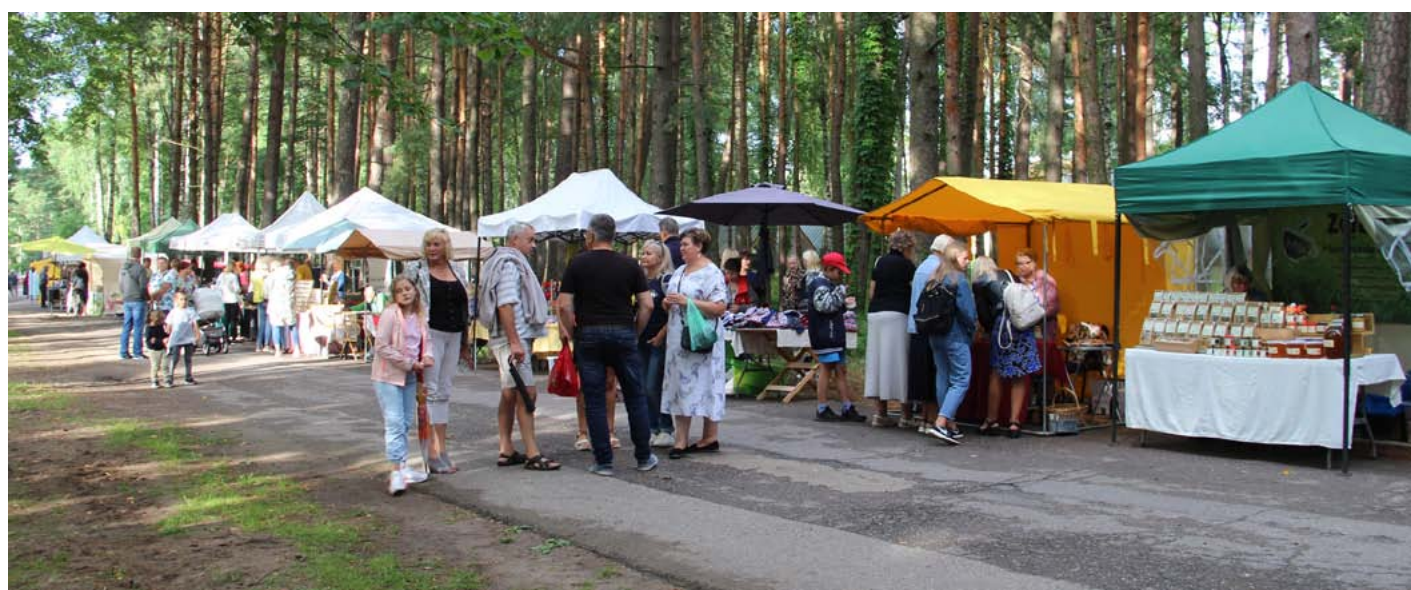
Tirgotāju un arī pircēju festivāla tirdziņā netrūka