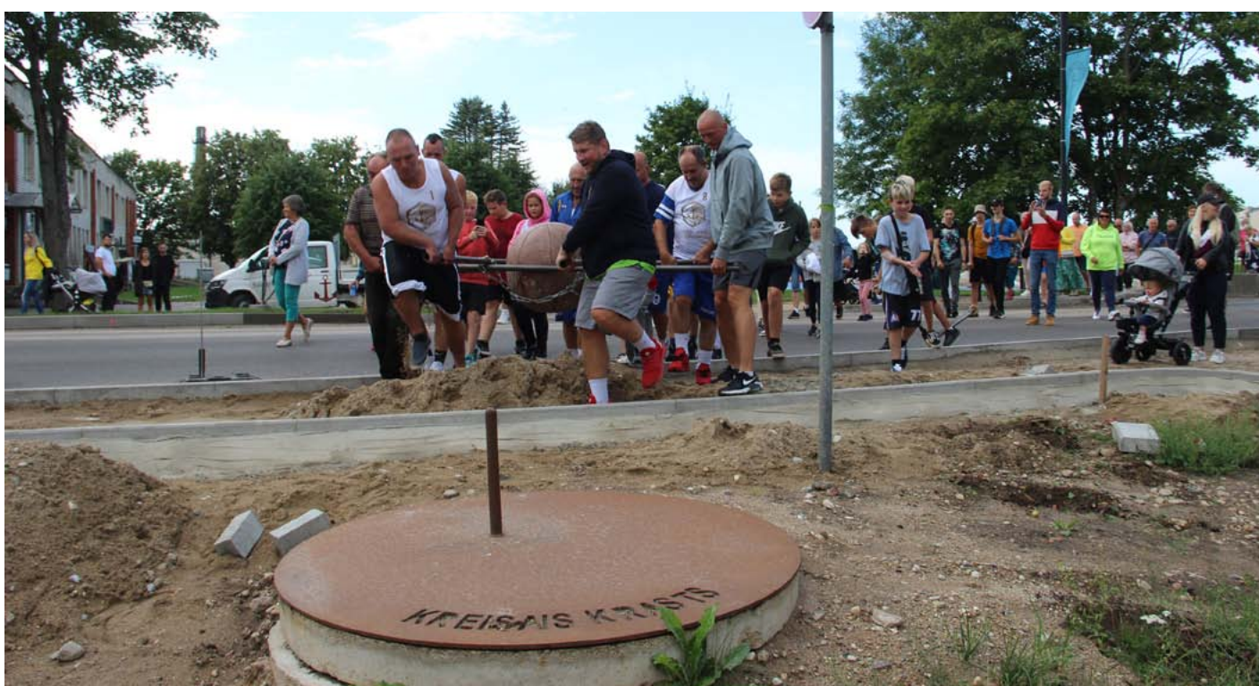
Pārvarot ceļa remonta šķēršļus, Krastu mača uzvarētāji nes novietot bumbu goda vietā

Pirmie laukumā devās paši jaunākie U-13, tad U-15 basketbolisti. Pusdienlaikā sacentās jaunieši, bet tad jau sekoja vīru un kungu spēles. Pēcpusdienā notika izšķirošā un viena no interesantākajām un spriedzes bagātākajām spēlēm, kurā tikās vecmeistari. Šī kā vienmēr bija viena no azartiskākajām spēlēm, un šo komandu duelis bija ļoti principiāls. To gaidīja ne tikai spēlētāji, bet arī skatītāji. Kurš krasts ir uzvarējis, noskaidrojās