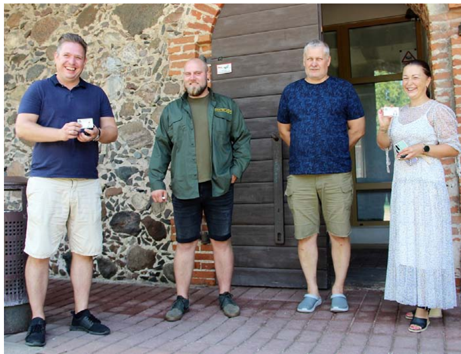
VVD Vidzemes reģionālās vides pārvaldes birojā Salacgrīvā apliecības saņēma divi jaunie sabiedriskie vides inspektori