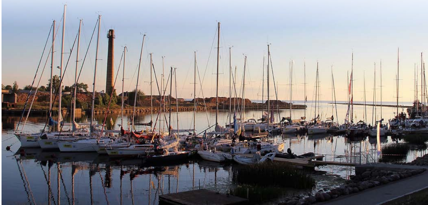
Jūlijā Salacgrīvu apmeklēja liels skaits jahtu

No 27. jūnija līdz 2. jūlijam Rīgas līcī notika regate Gulf of Riga Regate 21 (GoRR 21) – Latvijas atklātais jūras burāšanas čempionāts 2021 un Livonijas kausa izcīņa. 30. jūnija vakarā Salacgrīvas Jahtu ostā noslēdzās viens no regates posmiem.