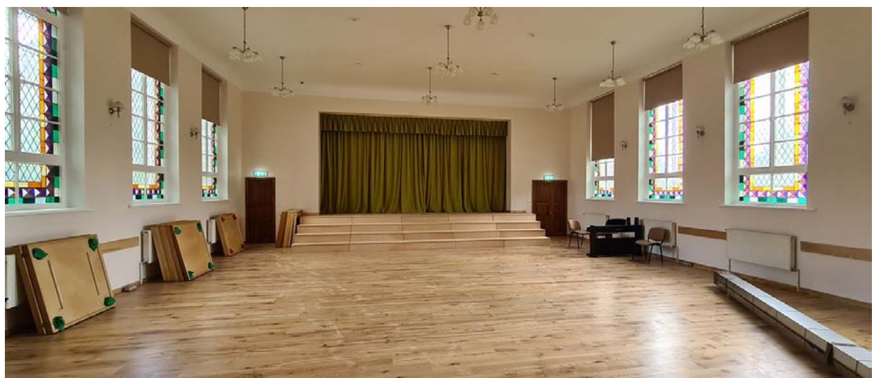
Izremontētā Vilzēnu tautas nama zāle