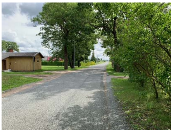
Jaunais rotaļu laukums pie jūras un jūlijā pabeigtā Brīvības ielas (no Valdemāra ielas līdz A1) dubultā virsmas apstrāde ar šķembiņām un bitumena emulsiju

Nereti satiekoties, cits citam uzdodam jautājumu: – Kas jauns jūsupusē? Ainažu pilsētas pārvalde var atbildēt uz šo jautājumu.