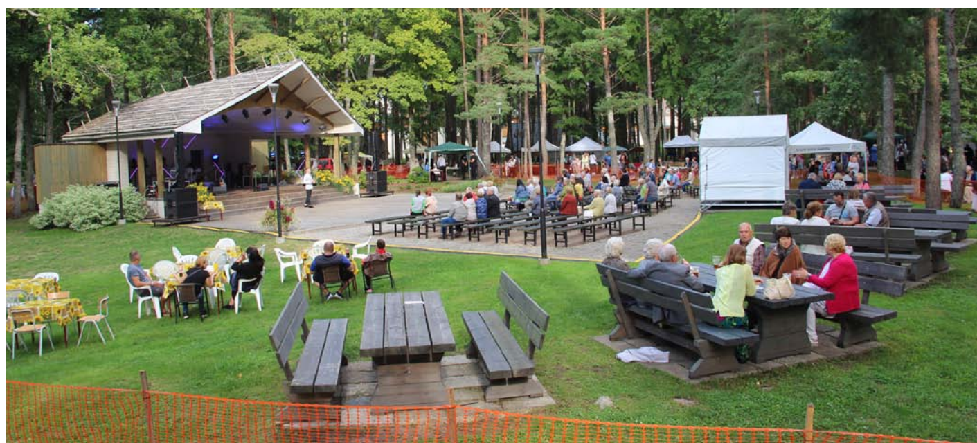
Ziemeļlivonijas festivāla notikumiem sekoja līdz skatītāji abpus norobežotās teritorijas