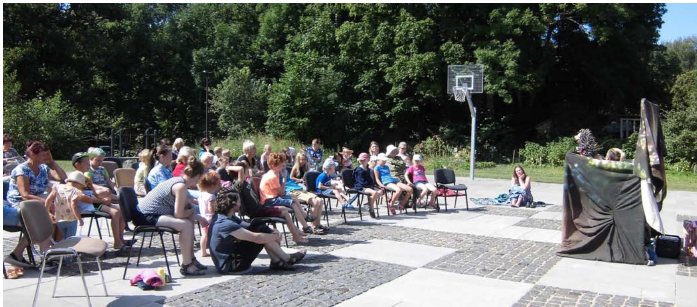
Improvizācijas leļļu teātra studijas ILze pirmizrādei brīvdabas kino un sporta laukumā pie Tūjas bibliotēkas skatītāju netrūka

Saulainajā 22. jūlija rītā brīvdabas kino un sporta laukumā pie Tūjas bibliotēkas