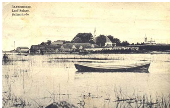
Skats uz luterāņu un pareizticīgo baznīcām. 20. gs. sākums.