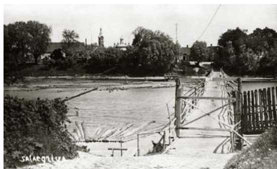
Kājnieku tilts pār Salacu. 1920. gadi