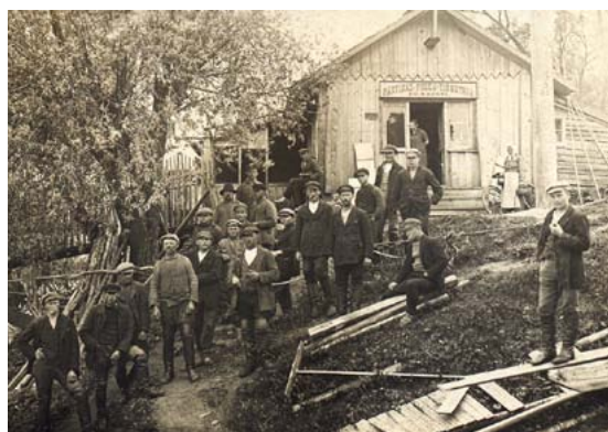
Tilta būvnieki Salacas kreisajā krastā. 1920. gadi