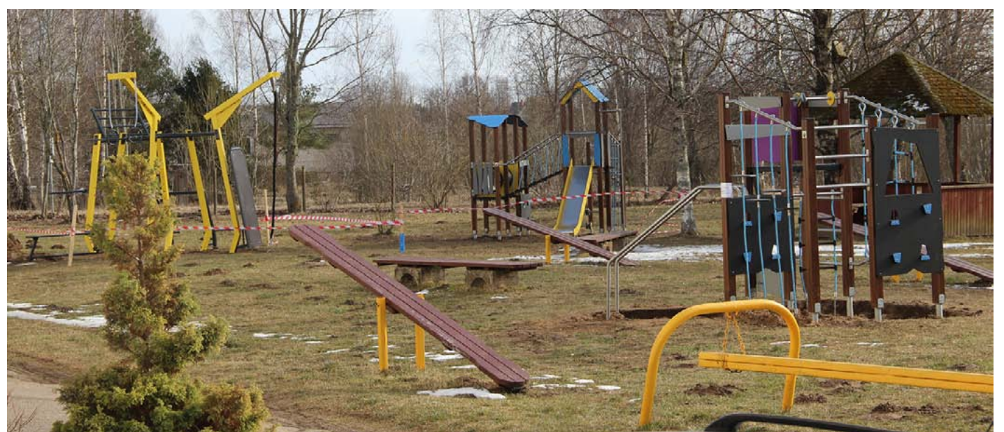
Vēl tikai nedaudz jāpagaida, un jaunus treniņierus varēs izmantot

Otra vēlme, ko, tiekoties ar pašvaldības vadību, izteica Liepupes skolas padome, bija kādreizējā meiteņu mājturības kabineta pārveidošana. Arī šim mērķim nova-