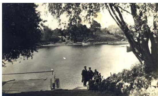
Pārceltuve. 20. gs. sākums