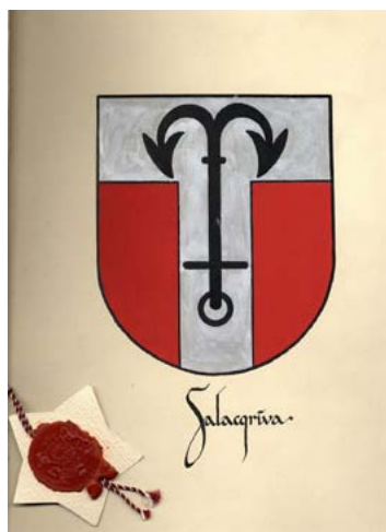
Salacgrīvas ģerbonis – apstiprināts paraugs. 1925. g.