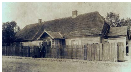
Anšmitu nams Rīgas ielā 10, kur vēlāk izvietojās miesta valde. Pie vārtiem mājas saimnieki. 20. gs. sākums