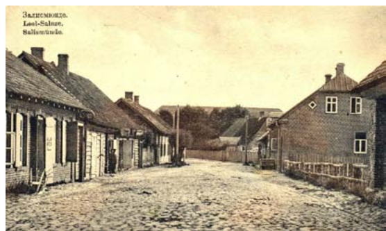
Rīgas iela. 20. gs. sākums.