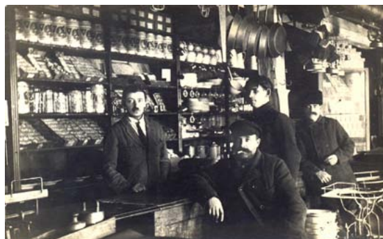
Patērētāju biedrības veikals. 1920. gadi