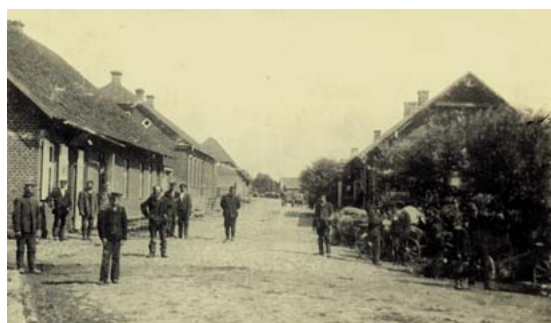
Rīgas iela ar skatu uz tirgu. 1920. gadi