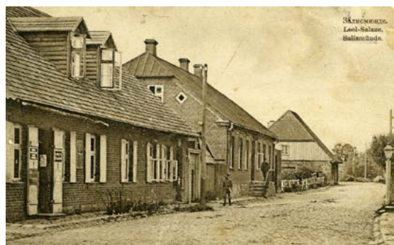
Salacgrīva, Rīgas iela. 20. gs. sākums, kad Salacgrīvai bija vēl citi nosaukumi.