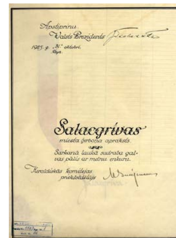
Salacgrīvas ģerboņa apstiprinājuma dokuments ar Valsts prezidenta Jāņa Čakstes parakstu. 1925. g.