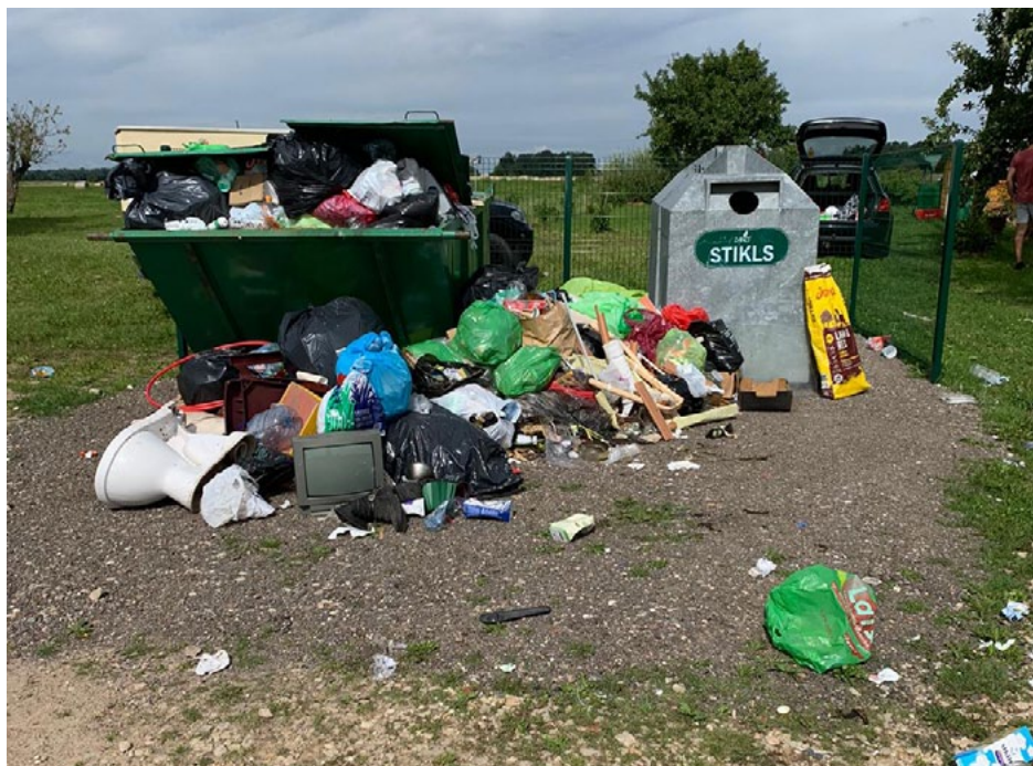
Šķirotu atkritumu apsaimniekošanas laukums Liepupē ir slēgts

Liepupes ciemā 2019. gada septembrī tika izveidota šķirotu atkritumu konteineriem paredzēta vieta, kurā SIA Ziemeļvidzemes atkritumu apsaimniekošanas organizācija (ZAAO) novietoja šķirotu atkritumu ievietošanai paredzētus konteinerus. Diemžēl redzams, ka tajos nonāk sadzīves atkritumi, elektrotehnika, kā arī kompostējama materiāls. Skaidri redzams, ka konteineros iemesta arī netīra tara, kurā ir pārtikas pārpalikumi.