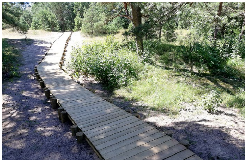
Salacgrīvā atjaunotas laipas līdz pludmalei

Ir pabeigta atjaunoto laipu uzstādīšana Salacas kreisā krasta pludmalē, darbus veica SIA Nobe par 5115,65 eiro (ar PVN). 14. jūlijā pabeigta jauno kāpņu