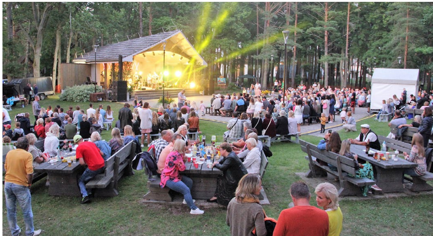
Lieliskais Raxtu raxti vakara koncerts pulcēja daudz klausītāju un skatītāju