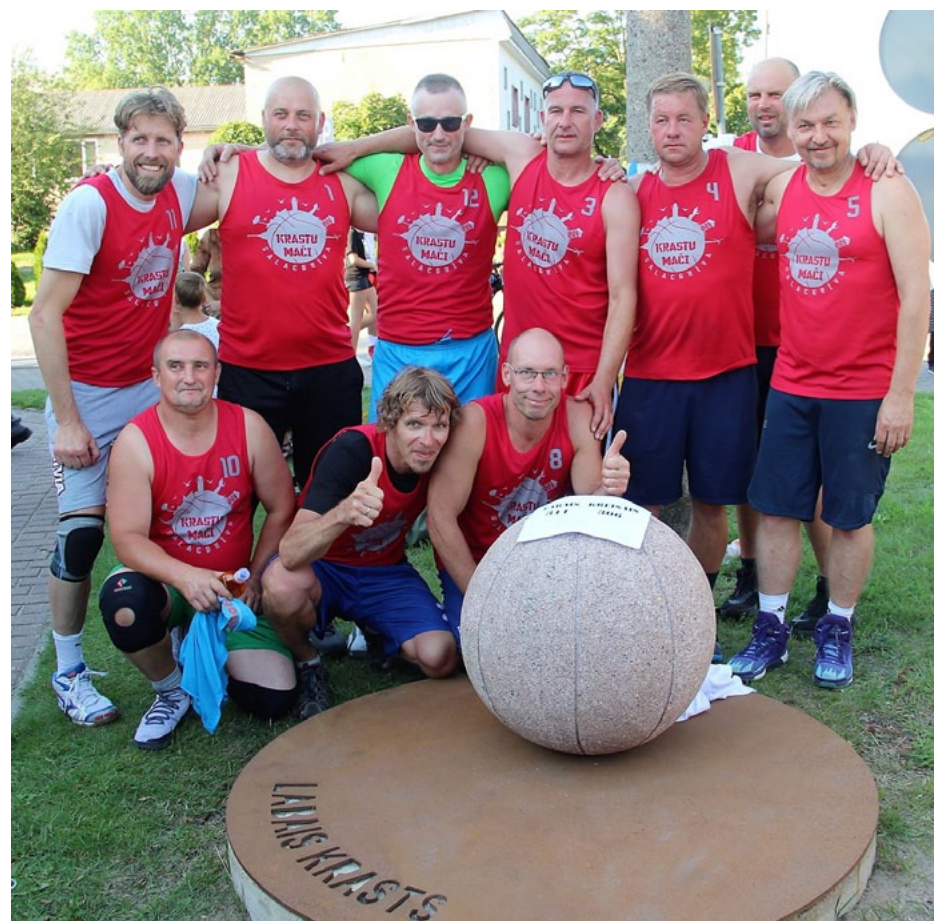
Labais krasts uzvar otro reizi pēc kārtas. Pie akmens bumbas labajā krastā pēdējās spēles uzvarētāji – vecmeistaru komanda

Pie svarīgākā darba – bumbas velšanas – pirmie ķērās labā krasta jaunākie spēlētāji, bet velšanu, celšanu un nostiprināšanu veica finālspēles dalībnieki. Kad