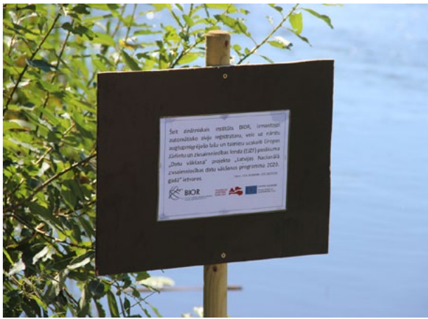
Tā Salacas upē izskatās lašu skaitītājs. Laivotājiem ieteicams kāpt krastā pirms trešā nēģu tača, jo tā šķērsošana var būt nedroša