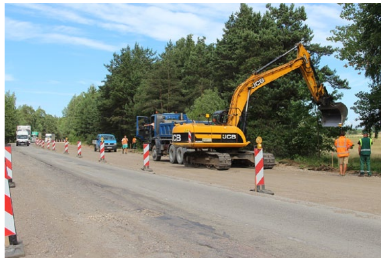
Remontdarbi uz A1 ceļa Salacgrīvā

Ceļu būves firma SIA Binders Salacgrīvā veic pilsētas tranzītielas pārbūvi (izņemot tiltu pār Salacu). Tranzītiela (Vidzemes, Viļņu un Pērnavas iela) šķērso pilsētu visā tās garumā, līdz ar to projektā paredzētais būvdarbu apjoms aptvers vairāk nekā 2 km. Projekts paredz ielas pārbūvi no Vidzemes un Valmieras ielas krustojuma līdz Pērnavas un Dzeņu ielas krustojumam jeb no katoļu baznīcas līdz Zvejnieku parkam.