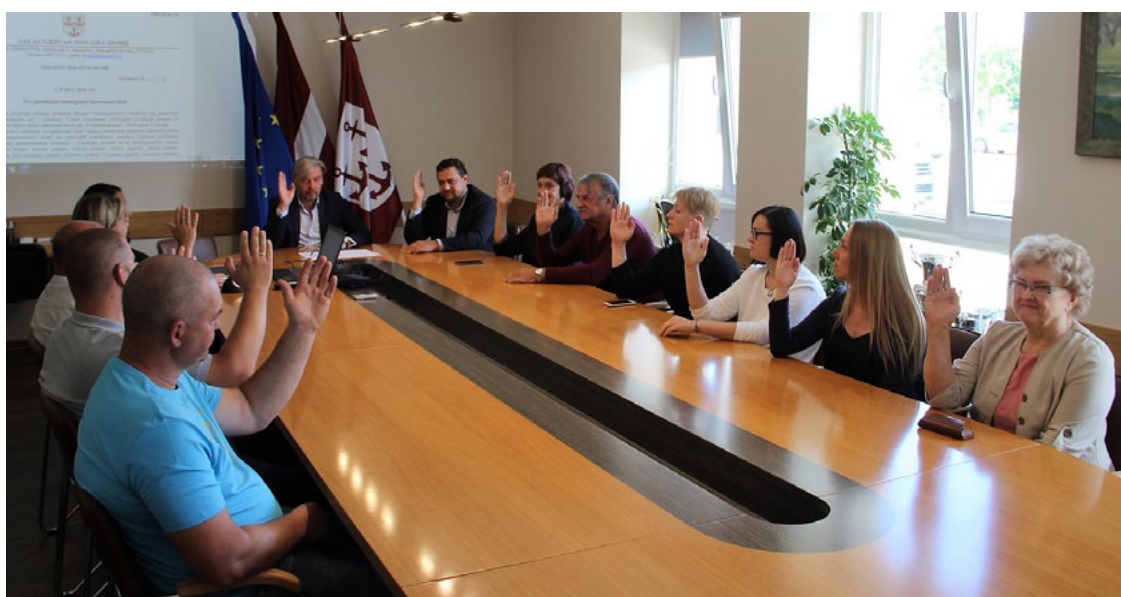
Deputātu lēmums ir vienbalsīgs – pieteikums Satversmes tiesā ir jāiesniedz