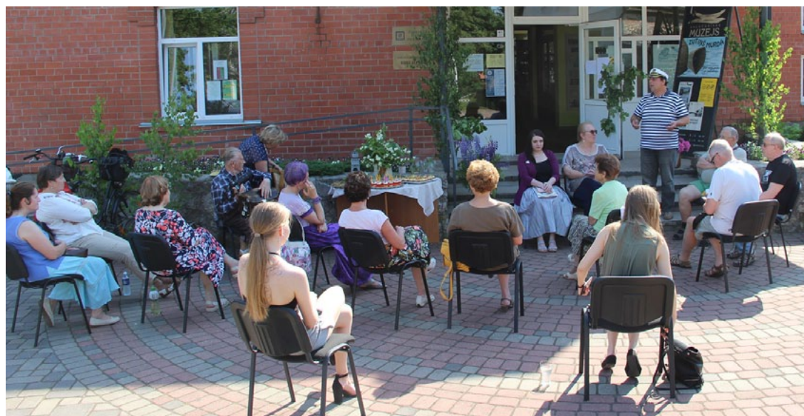
Brūveri brūvē pie Salacgrīvas bibliotēkas

Klausoties dzejā un Pētera dienasgrāmatas lasīju-