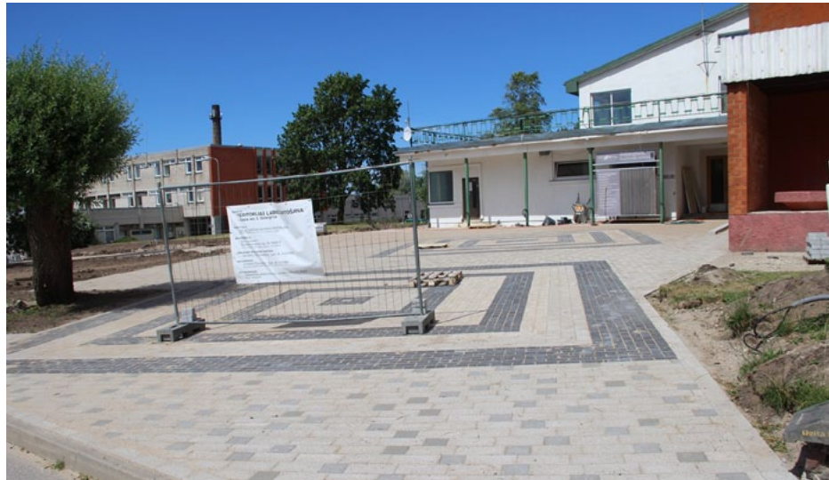
Kultūras nama teritorijas labiekārtošana tuvojas noslēgumam

Noslēgumam tuvojas Salacgrīvas novada kultūras centra apkārtnes labiekārtošana, ko veic SIA Sanart . Pašvaldība šiem darbiem atvēlējusi 255 tūkstošus eiro.