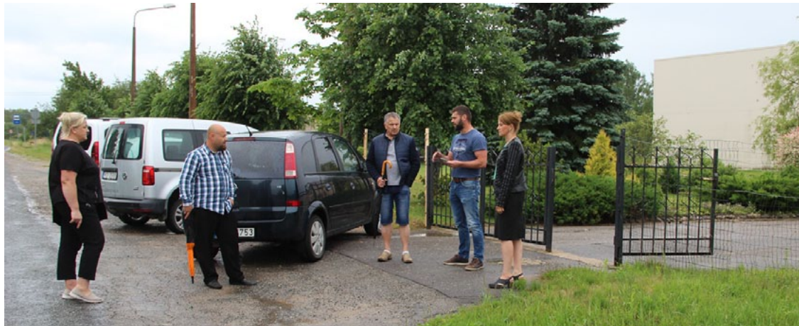
Pašvaldības pārstāvji kopā ar būvnieku apspriež veicamos darbus

Salacgrīvas novada dome noslēgusi līgumu ar SIA Kvinta BCL par gājēju ietves, stāvlaukumu, ielas apgaismojuma un pieturas paviljona rekonstrukciju pie Liepupes pamatskolas.