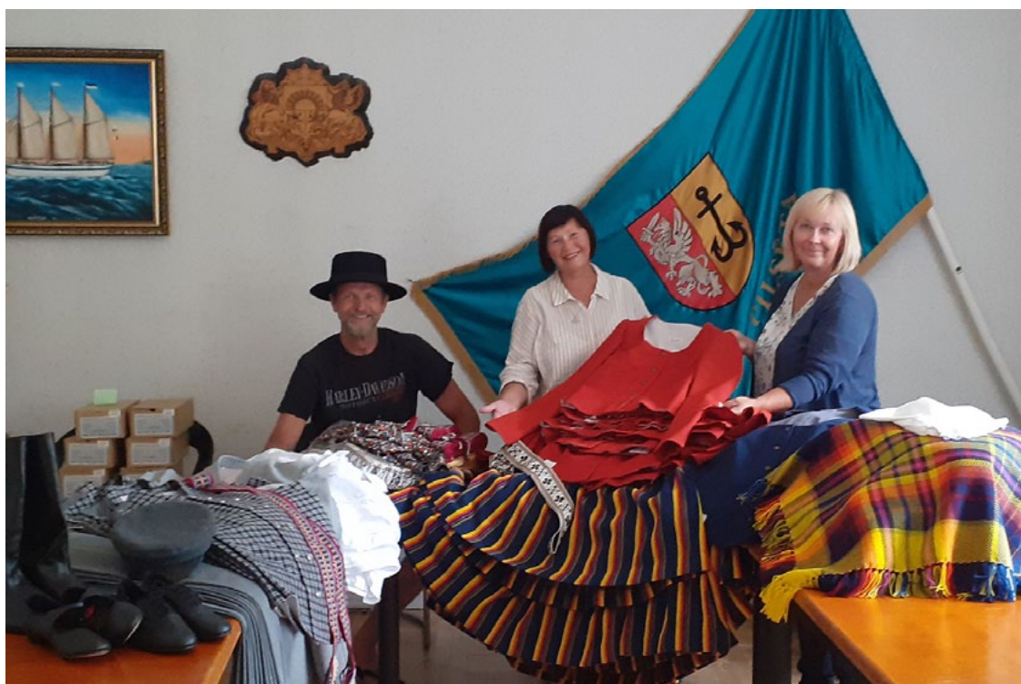
Ainažnieki ar lepnumu izrāda jaunus tautastēpus

Liels bija mūsu un dejotāju prieks, kad pērn 17. septembrī saņēmām lēmumu no Ziemeļvidzemes reģionālās Lauksaimniecības pārvaldes, ka mūsu rak-