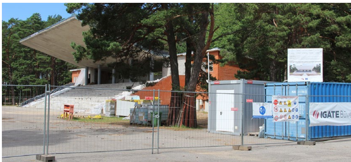
Turpinās remontdarbi Zvejnieku parkā