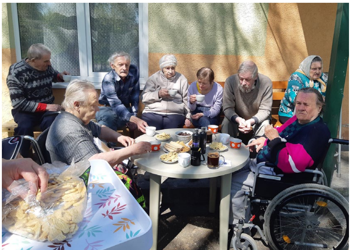
Tik jauki ir dzert tēju un sildīties pavasara saulītē!