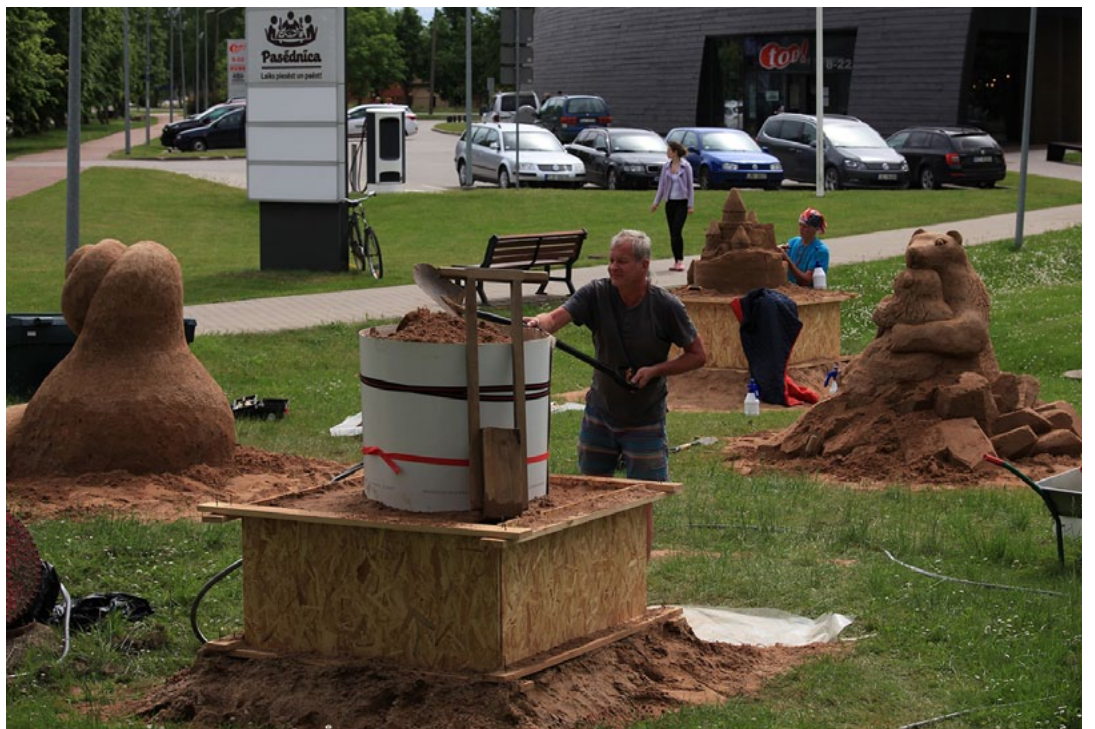
Salacgrīvā smilšu mākslas simpozijs Zelta smilšu grauds pie veikala top! strādā tēlnieki

Smiltis, kas tiek izmantotas skulptūru veidošanā, ir īpašs materiāls, tālab simpozijs organizatori aicina ievērot iero-