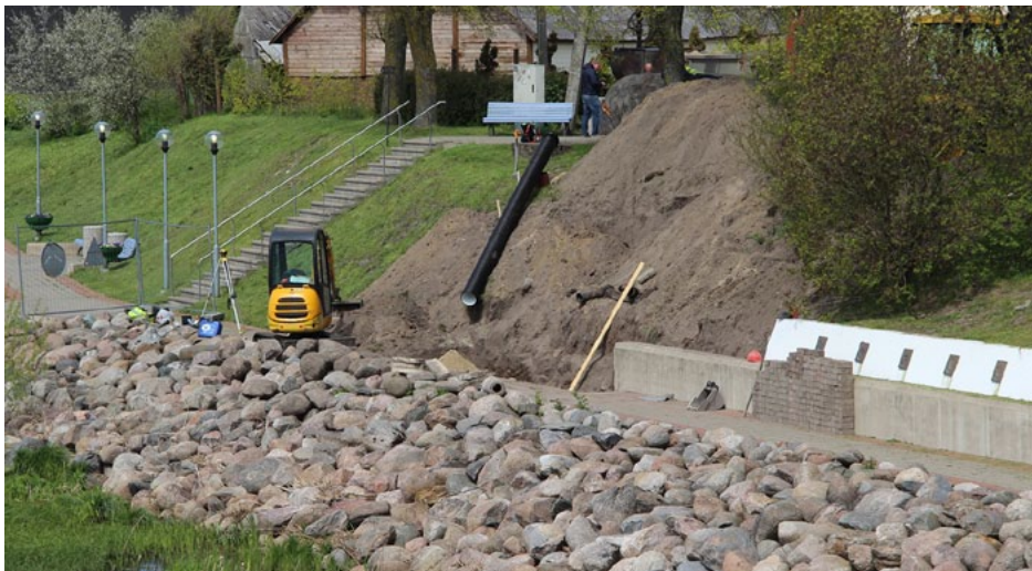
Notiek Slavas alejas paplašināšana un labiekārtošana

Droši vien daudzi salacgrīvieši un pilsētas viesi, ejot vai braucot pa Salacas tiltu, ir ievērojuši upes labajā krastā notiekošo zemes rakšanu. Saskaņā ar noslēgto līgumu SIA ALANDMA Salacas promenādē veic Slavas alejas sakārtošanu un paplašināšanu. Projektā paredzēts: