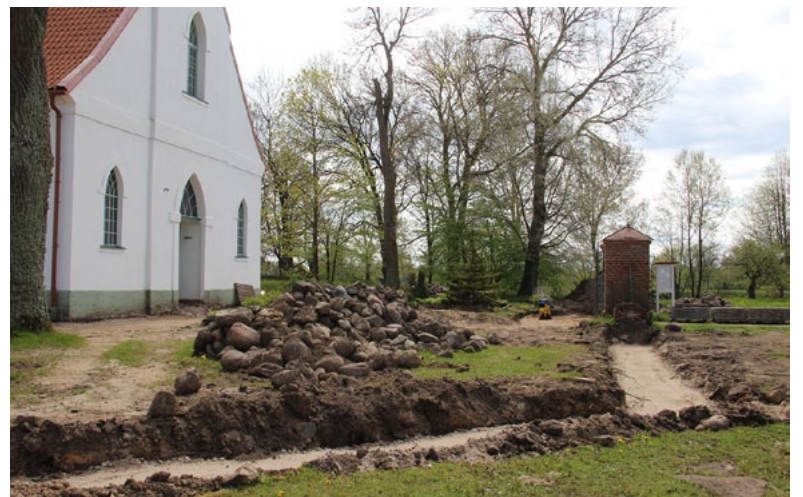
Vērienīgi darbi pie Lielsalacas evaņģēliski luteriskās baznīcas

Uz visu kopumā skatoties, manuprāt, šis nav tikai mūsu baznīcas teritorijas labiekārtošanas projekts vien, jo tajā ir iestrādātas