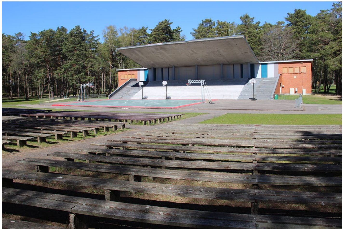
Šajā bildē vēl viss mierīgi, bet nu darbi Zvejnieku parka estrādē jau sākušies

Projekts paredz, ka estrāde taps no nerūsējošā tērauda plāksnēm, kas radīs atspulgu no priedēm un dabas. Līdz ar to