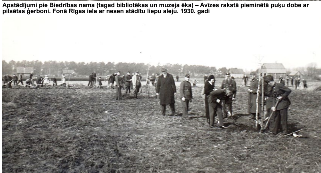
Avīzes rakstā minētās 15. maija birzs stādīšanas talka netālu no Grīvu mājām. 1935.g. 5. maijā