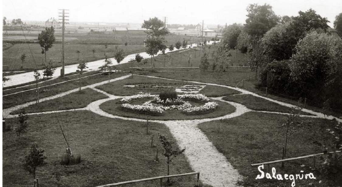
Apstādījumi pie Biedrības nama (tagad bibliotēkas un muzeja ēka) – Avīzes rakstā pieminētā puķu dobe ar pilsētas ģerboni. Fonā Rīgas iela ar nesen stādītu liepu aleju. 1930. gadi