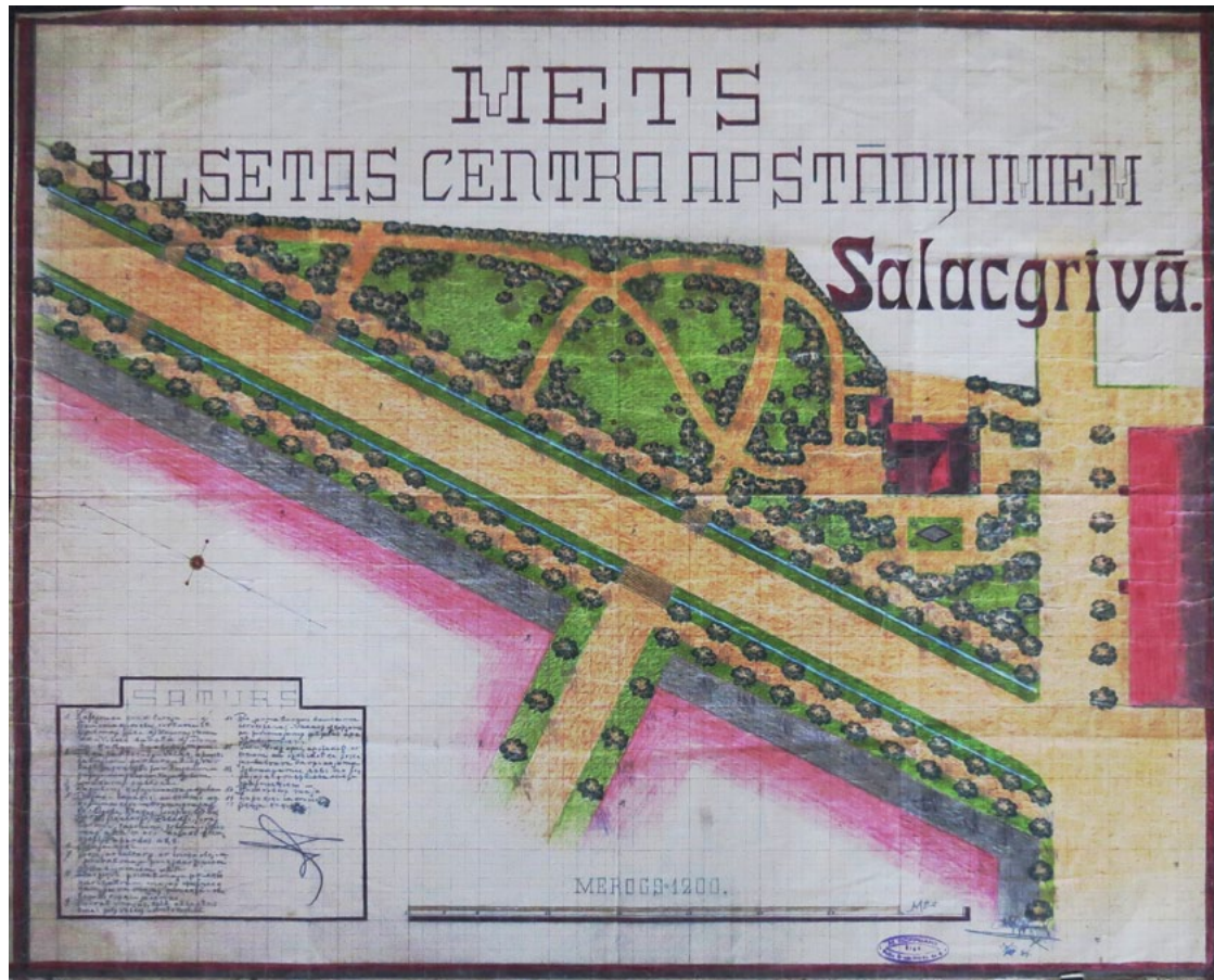
Pilskalna apzaimošanas plāns. Attēla augšmalā kāpnis, kas varētu būt arī šosejas ceļš, pretim kāpnēm plānots paviljons. Pārējais paskaidrojums minētais ir 40 koku un krūmu dažādi nosaukumi latviešu un latīņu valodās. Zīmējis M. Roppmans Rīgā 1935. g.

Salacgrīvas muzeja dārgumi ir divi apzaimošanas plāni, kas nav tikuši realizēti, un kāds žurnālists, iespējams, redzot šos plānus, būtu jau rakstījis: – Cik jauki ir Salacgrīvā!