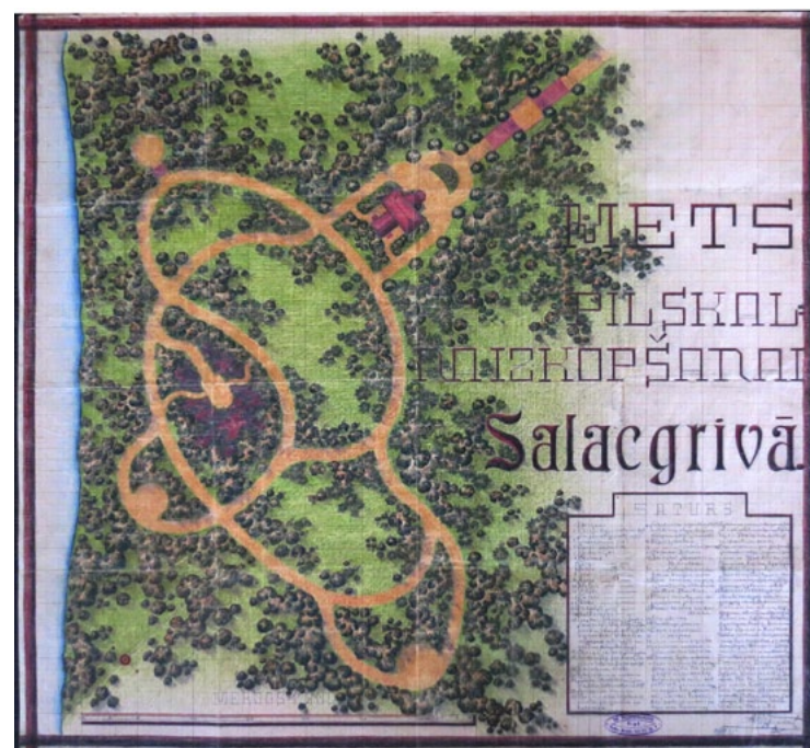
Apstādījumu plāns skvēram pie Biedrības nama (plānā – labajā pusē sarkans jumts) Rīgas un Sila ielas krustojumā. Nelielā ēkā plānā ir kafējnīca-konditoreja, kur paredzēts arī ekonomas dzīvoklis, vasaras terase un dāmu un kungu tualete. Attēlā redzamais brīvais laukums Biedrības mājas galā minēts kā Jaunais tirgus laukums. Tāpat uzskaitītas, kādas koku un krūmu šķirnes būtu jāiestāda tām paredzētajās vietās. Zīmējis M. Roppmans Rīgā 1935. g.