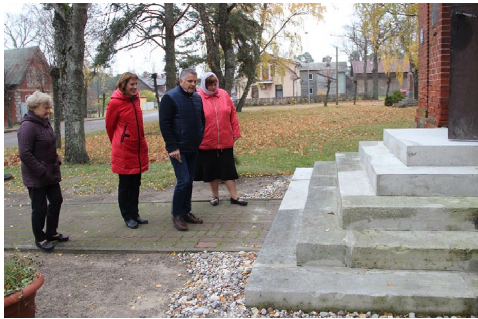
Vērtēšanas komisija apskata Ainažos īstenoto projektu

Jāpiebilst, ka pavasarī, izvērtējot iesniegumus, komisija lēma visiem daudzdzīvokļu māju projektiem piešķirt sa-