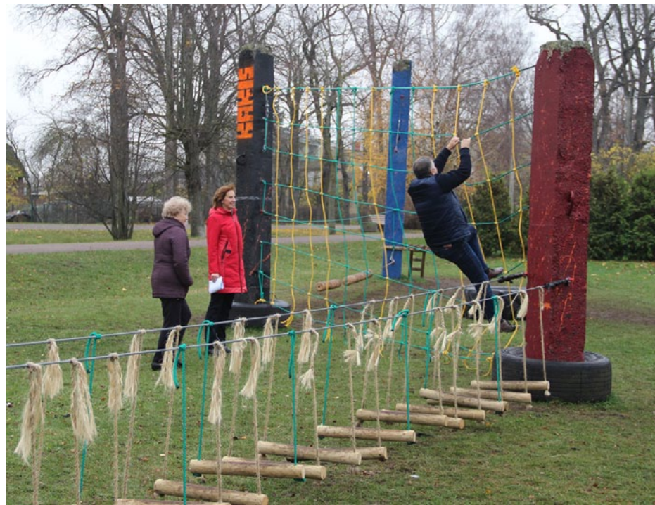
Vērtētāji iemēģina pilsētas trasi

mazinātu finansējumu, t.i., mazāk, nekā projekta pieteicēji vēlējas, lai atbalstītu iespējami vairāk projektu. Tomēr visi atbalstītie projekti realizēti, ieguldot vairāk pašu līdzfinansējuma. Tikai vienā pagalmā