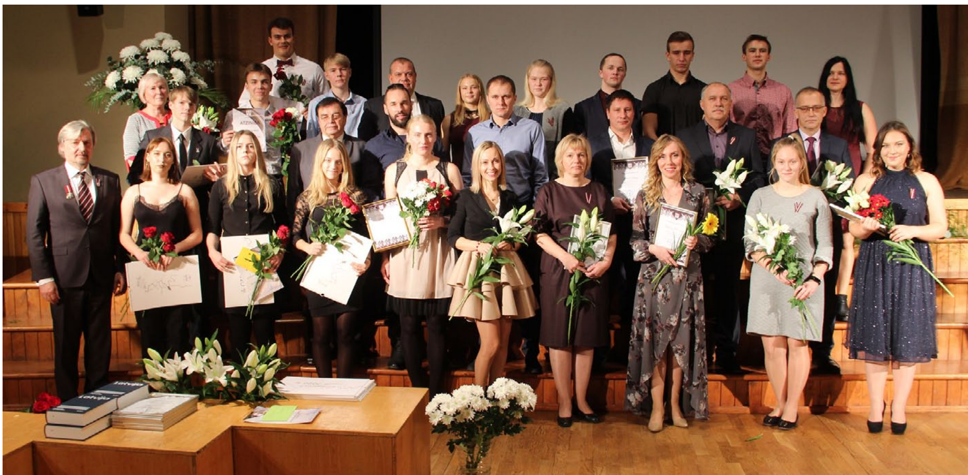
Paldies Salacgrīvas novadniekiem par darbu!

Novembra trešās nedēļas nogalē Salacgrīvas novadā un visā valstī svinēja Latvijas Republikas proklamēšanas 101. gadskārtu. Valsts svētkiem veltīts sarīkojums Salacgrīvā notika 16. novembrī. Todien sveica aptaujas Gada salacgrīvietis 2019 uzvarētājus, sumināja novada labākos uzņēmējus, pateicās novada sporta laureātiem un godināja mūzikas un mākslas skolu audzēkņus un pedagogus.