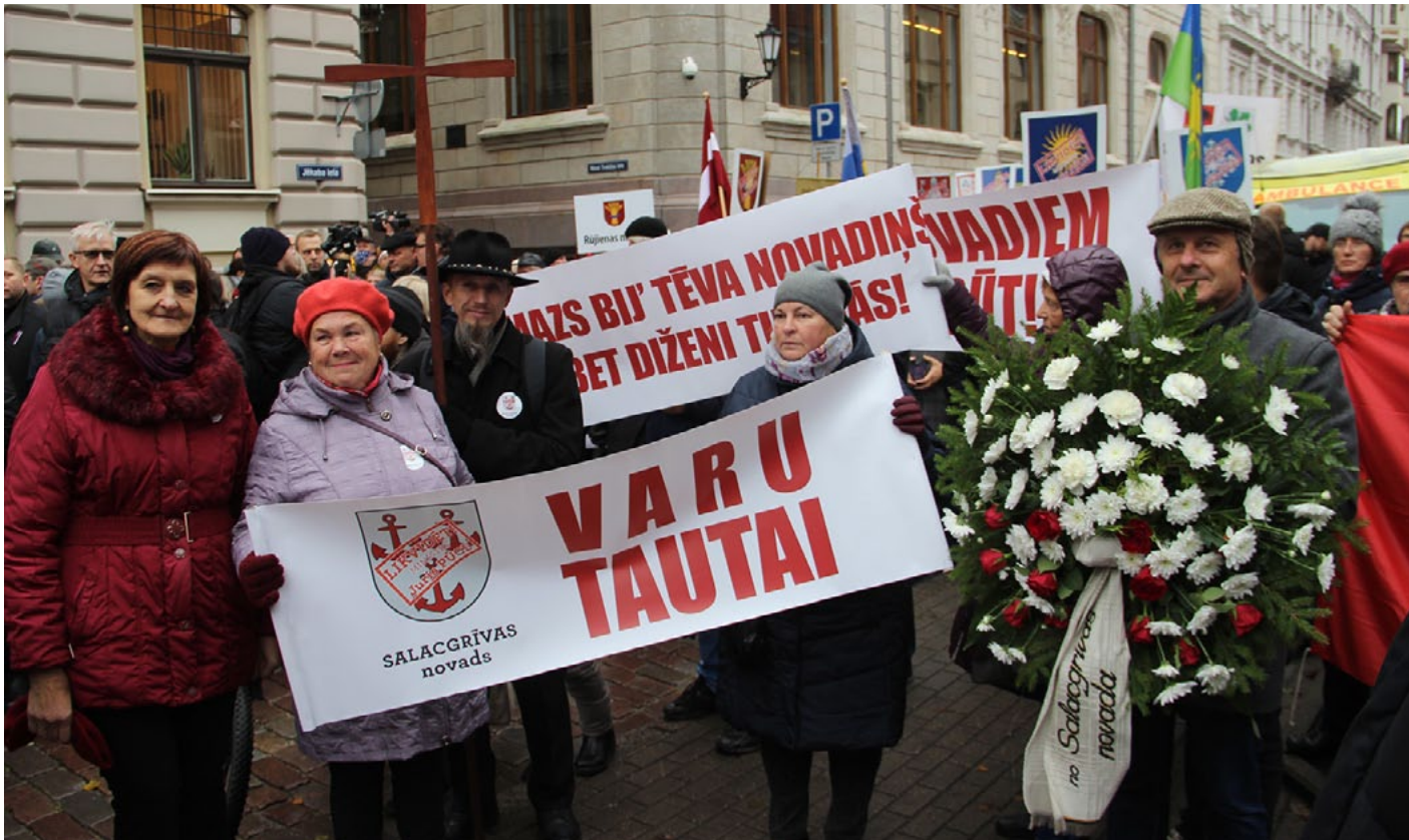
Salacgrīvas novadam būt!

7. novembrī uzreiz pēc mediķu pike-ta pie Saeimas pulcējās protestētāji, kuri pauda neapmierinātību ar valstī iecerēto administratīvi teritoriālo reformu. Sabraukuši gan no Latvijas mazpilsētām, gan Pierīgas, protestētāji iebilda pret jauno reģionālo sadalījumu, uzskatot, ka tas vēl vairāk iztukšos laukus. No Salacgrīvas novada šajā protesta akcijā piedalījās vairāk nekā simts dalībnieki.