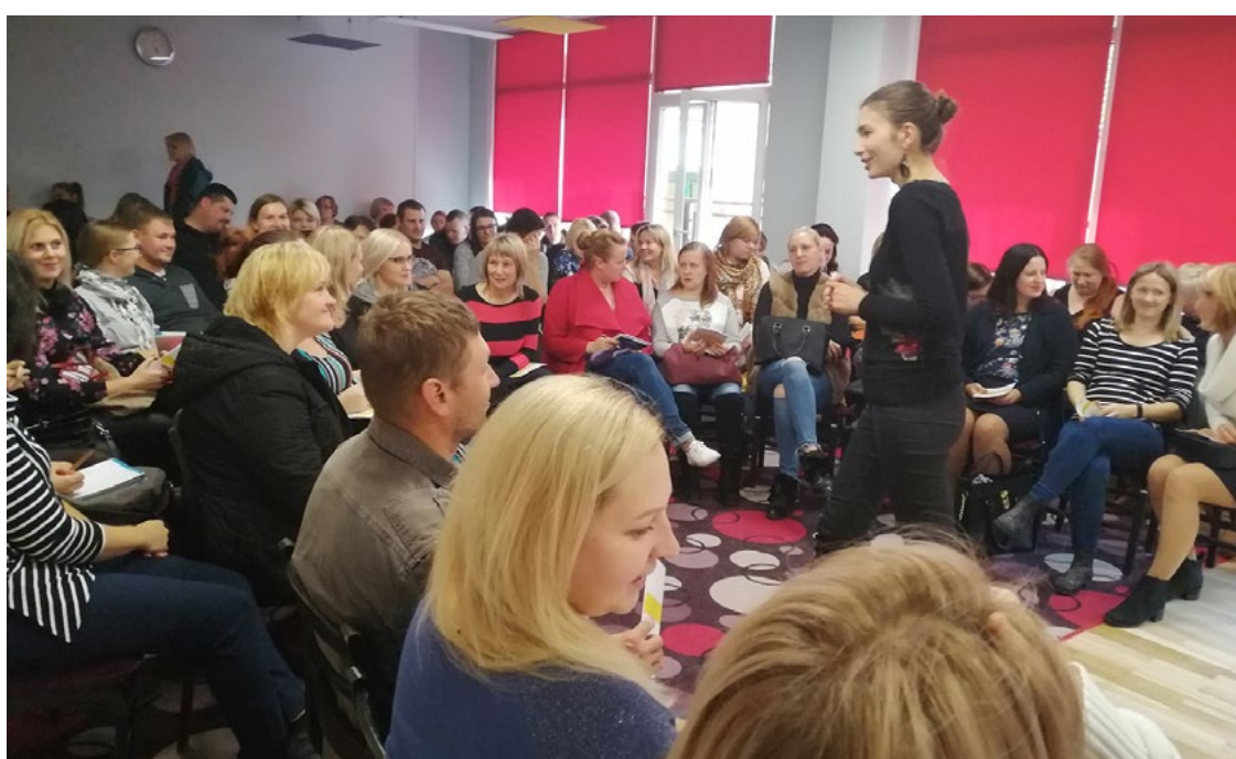
Seminārs bija interesants un iedvesmojošs

Bērnu audzināšana mūsdienās ir liels izaicinājums gan ģimenē, gan izglītības iestādēs, jo mainās pasaule, mainās sabiedrība, mainās tās kopējā attieksme pret bērnu. Tāpat mainās bērnu vajadzības, līdz ar to jāmainās arī pieejai audzināšanā. Audzināšanas metodes, kas bija aktuālas pirms divdesmit, trīsdesmit gadiem, mūsdienās nereti vairs nav pieņemamas, un uzskats Tā audzināja mani, un tā es audzināšu savus bērnus ne vienmēr nāk par labu jaunajai paaudzei.