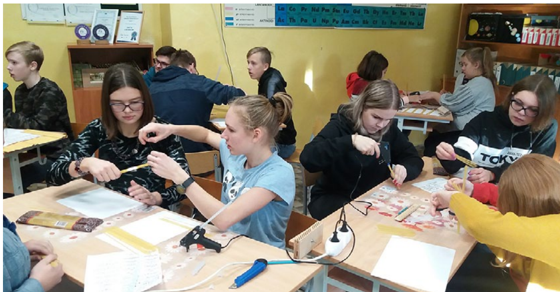
Krišjāņa Valdemāra pamatskolā top makaronu tilti

Krišjāņa Valdemāra Ainažu pamatskola par projektu Rokasgrāmata skolotājiem, skolēniem un sliņķiem par siltumu ieguva eTwinning Nacionālo balvu. Kā balva skolēniem par projekta veikumu 1. novembrī bija SIA ASPIRED (viena no vadošajām tehniski radošo darbnīcu