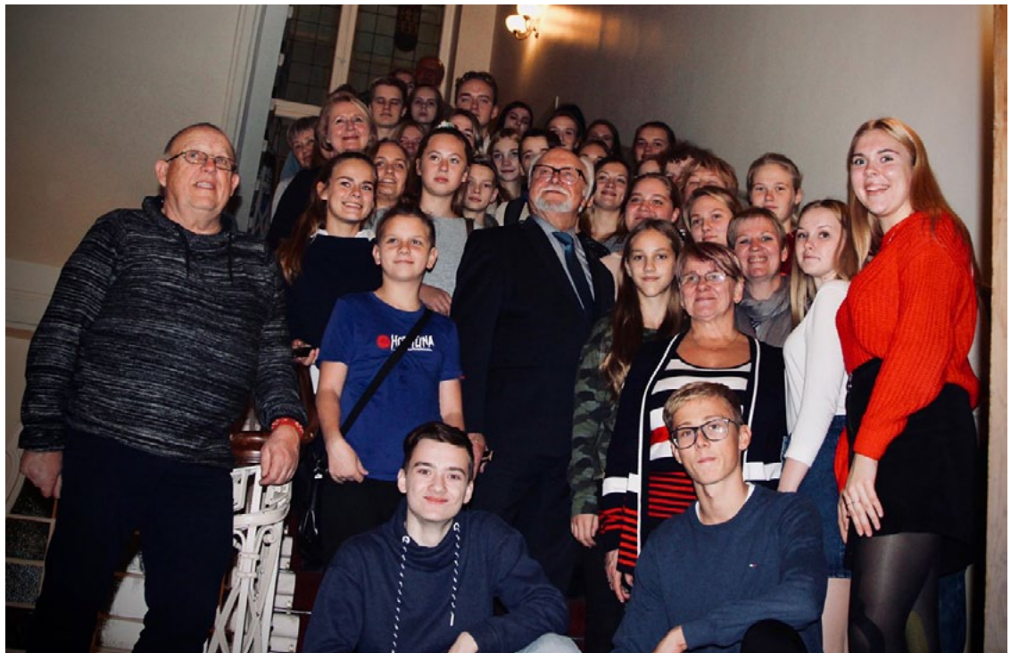
Salacgrīvieši Rīgas Latviešu biedrības namā