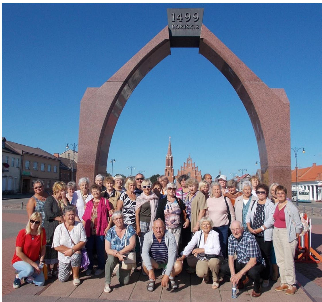
Salacgrīvas novada seniori Rokišķos

Rokišķu muižas komplekss, tai skaitā grāfu Tīzenhauzenu pils, celts 1801. gadā klasicisma stilā. 19. gs. muiža bija ievērojams kultūras centrs, kur grāfu ģimene bija savākusi daudzus izcilus mākslas darbus. Gides vadībā izstaigājām visas telpas, bet lielajai, grezna-