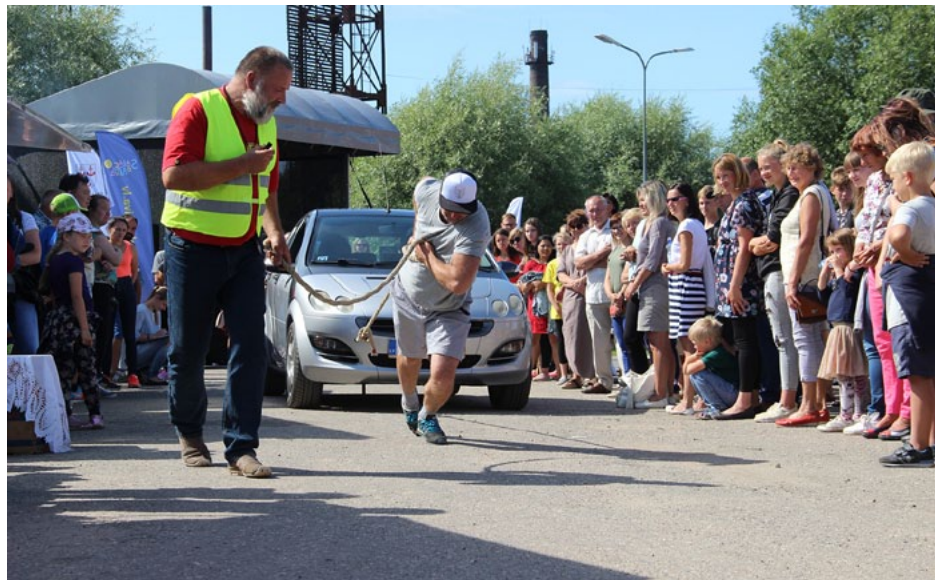
Auto vilkšanas sacensības jau kļuvušas par tradicionālu Jūras svētku dienas daļu noslēgumu