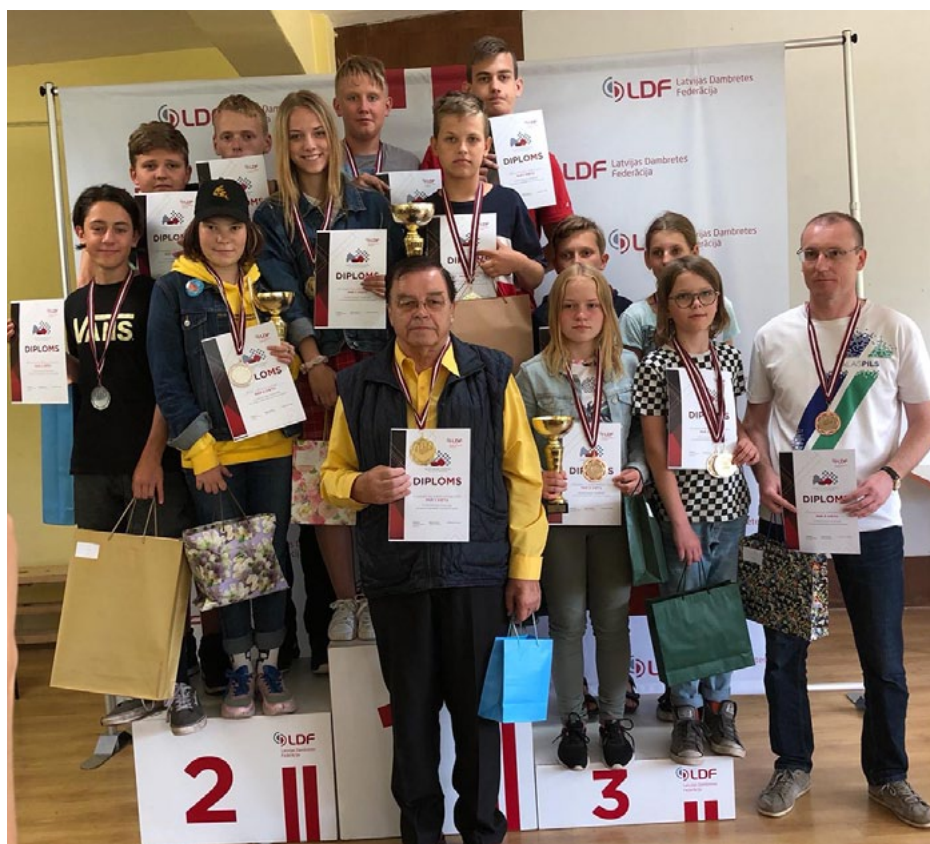
Limbažu un Salacgrīvas novada sporta skolas komanda šajās sacensībās startēja vareni!