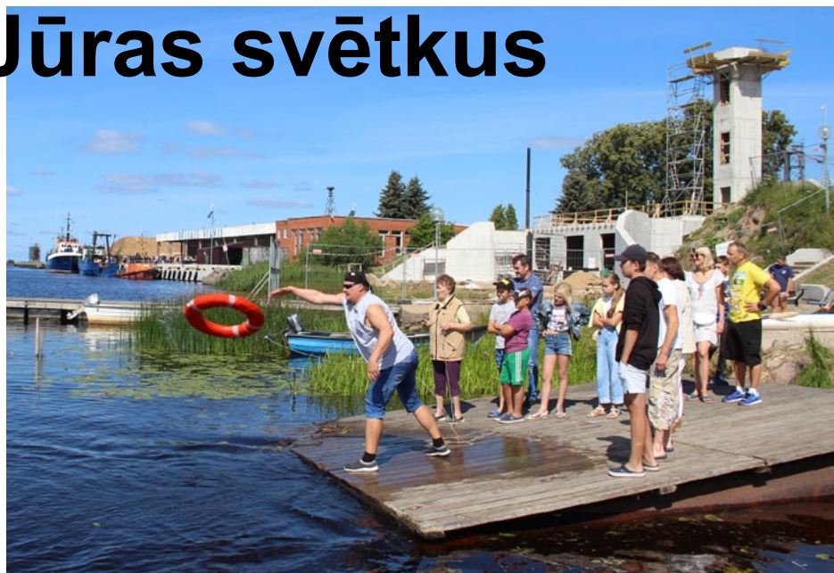
Glābšanas riņķa mešanas sacensības vienmēr ir jautras un atraktīvas