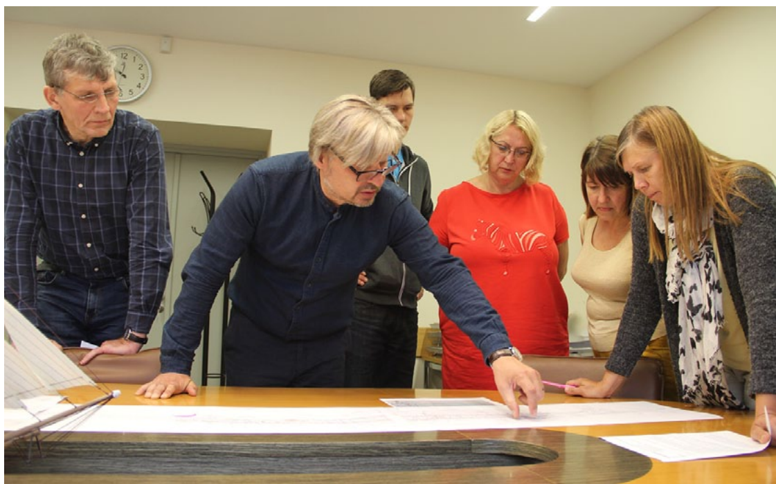
Pašvaldības speciālisti vēlreiz apskata plānoto darbu projektu šosejas Via Baltica pilsētas posmā

Aptuvenās tranzītielas Salacgrīvā rekonstrukcijas darbu izmaksas ir 3,4–3,5 miljoni eiro.