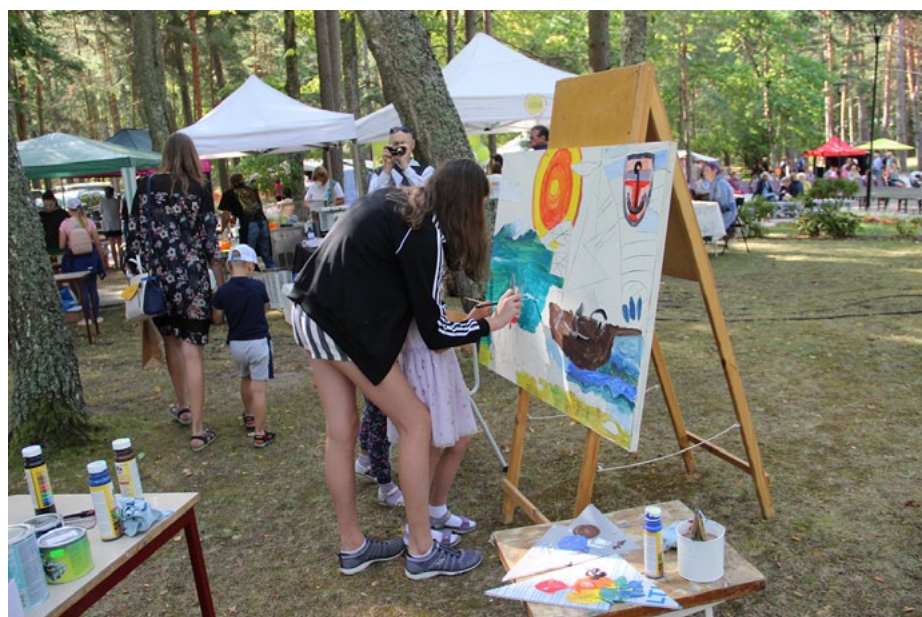
Top Ziemeļlivonijas festivāla glezna

tapa glezna, kuras veidošanā varēja piedalīties ikviens, pieliekot savu otas triepienu.