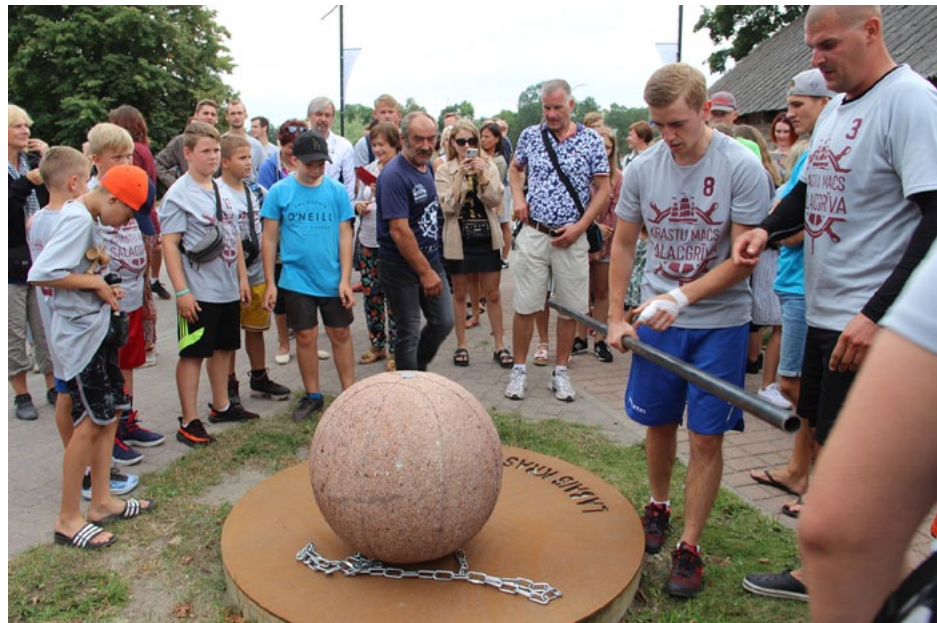
Ar aplausiem un ovācijām krastu mača bumba ieņēmusi goda vietu labajā krastā