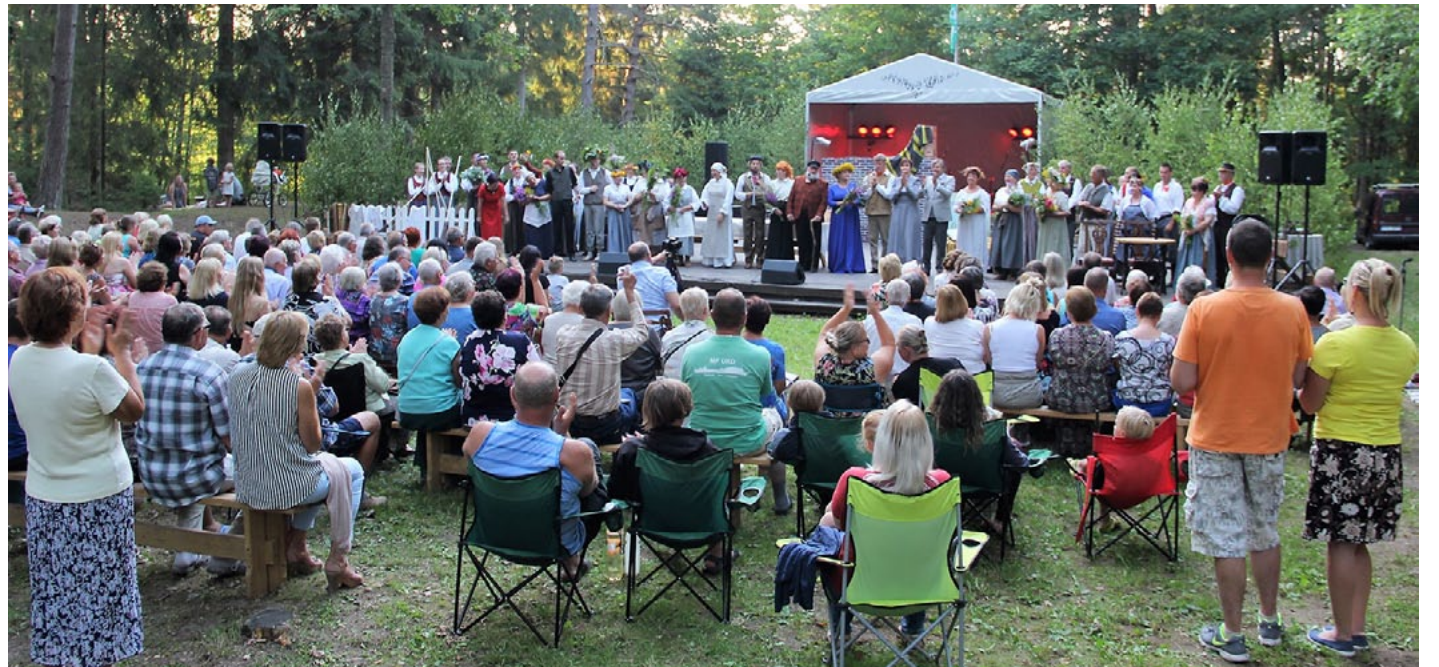
Skroderdienas Silmačos Liepupes pilskalnā