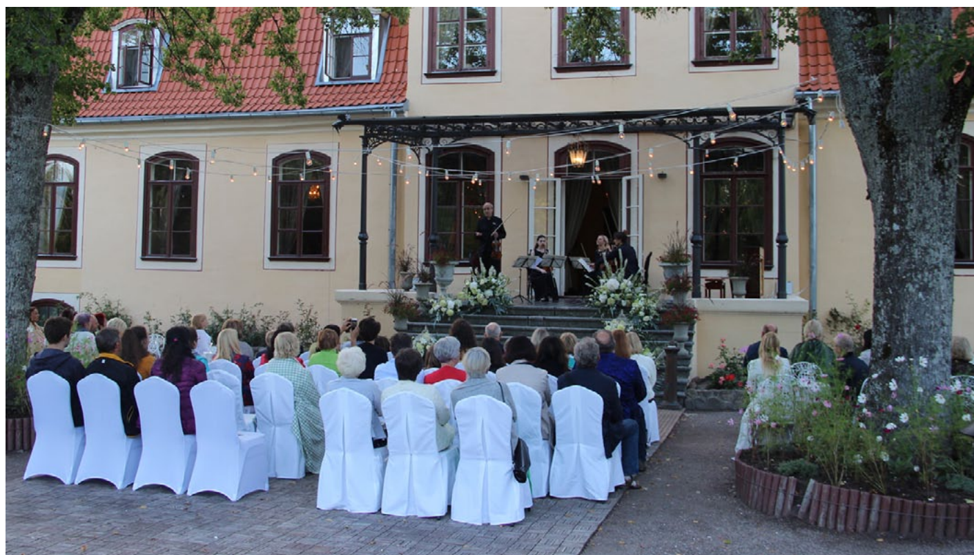
Īpašs bija koncerts Liepupes muižā