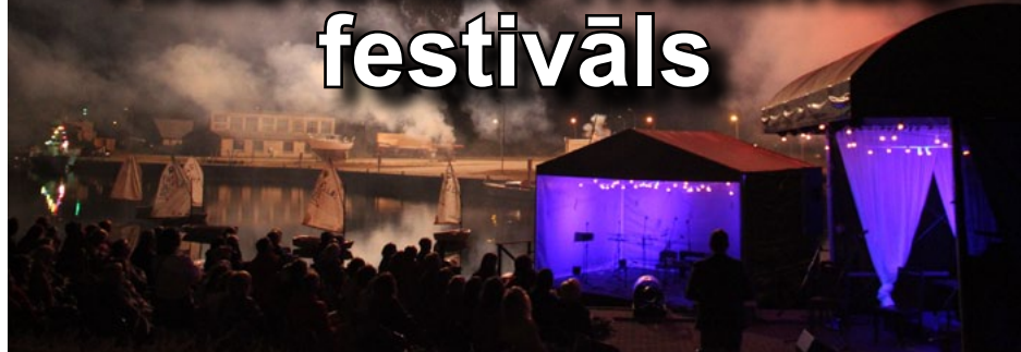
X Salacgrīvas klasiskās mūzikas festivāls izskanējis!

Nu jau desmit gadu jūlija pēdējā nedēļā un augusta pirmajās dienās Salacgrīvas novadā skan klasiskā mūzika. Šogad 10. Salacgrīvas klasiskās mūzikas festivāls noslēdzās 4. augustā ar meistarklašu audzēkņu koncertu.