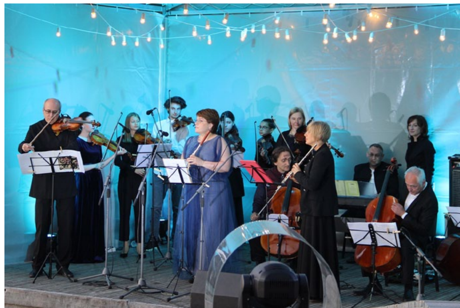
Noslēguma koncertu atklāj festivāla meistarklašu audzēkņu un pedagogu kopīga uzstāšanās

Salacgrīvas klasiskās mūzikas festivāla laikā bija iespēja apmeklēt piecus koncertus, kas notika dažādās novada vietās –