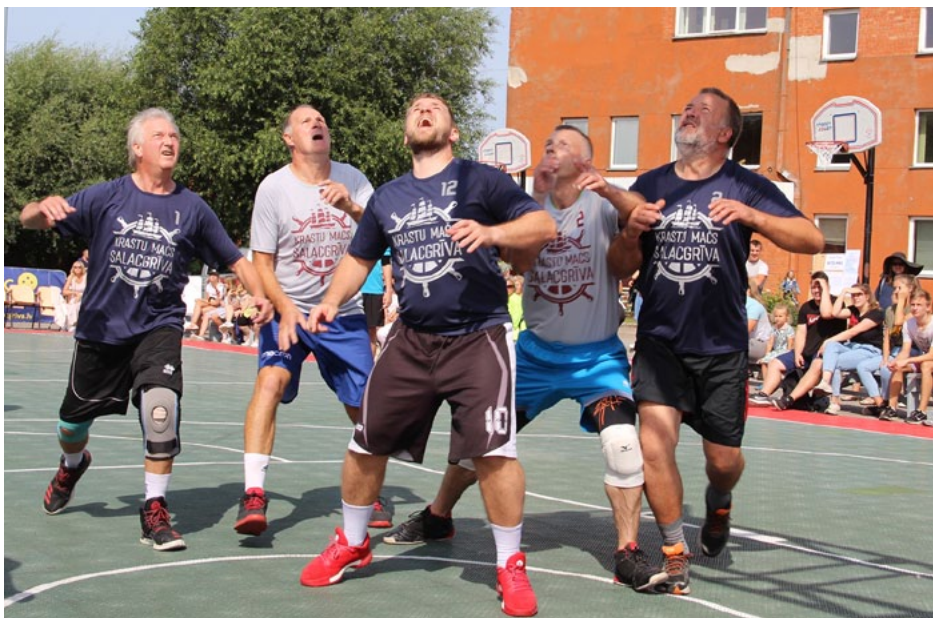
Leģendu spēle dienas vidū bija atraktīva, spraiga un interesanta