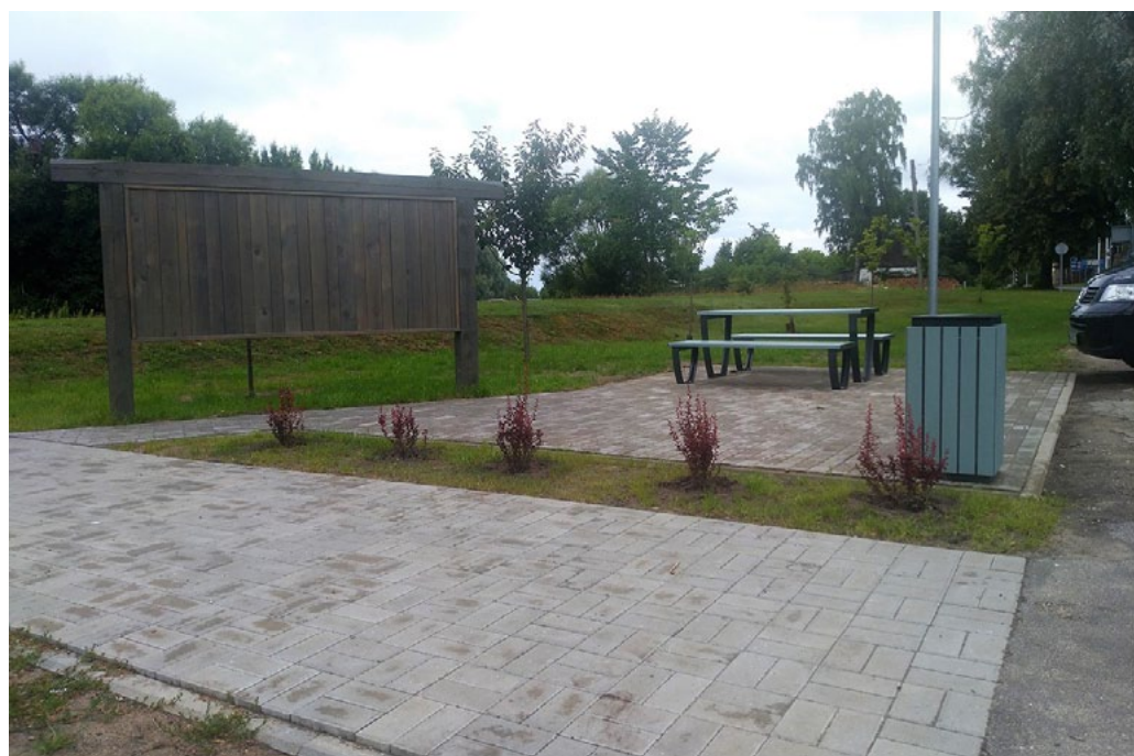
Labiekārtojums Ainažos, pie Igaunijas–Latvijas robežas

Vēl šogad pieliks punkts teritorijas pie Ziemeļu mola Ainažos sakārtošanai. Jau pērn jaunu skatu ieguva zīme Latvija valsts pierobežā, tika atjaunota laipa uz molu, tagad arī nobruģēts laukumiņš ar galdu un soliņiem. Tuvākajā laikā Salacgrīvas novada Tūrisma informācijas centrs sola uzstādīt informatīvo planšeti. Pašsaprotami, ka tur jāvalda kārtībai, jo