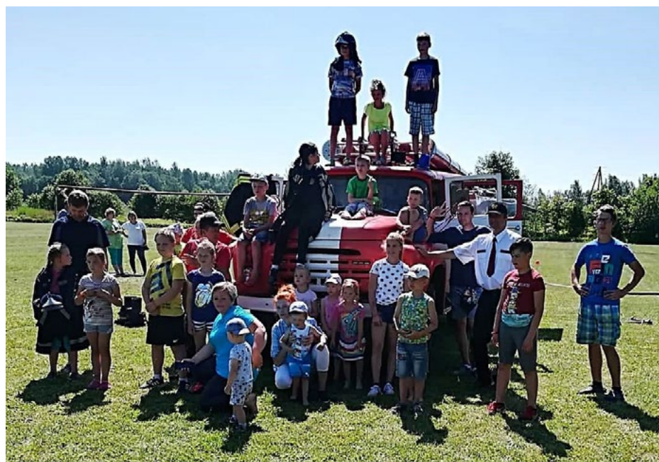
Ciema svētku viesi – brīvprātīgie ugunsdzēsēji – bija ļoti gaidīti!

Pēc brītiņa, sirēnām skanot, stadionā ieradās arī mājās palikušos ārā izvil-