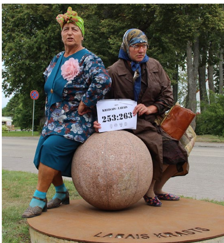
Olgas un Alms neslēpj prieku par sava krasta uzvaru!