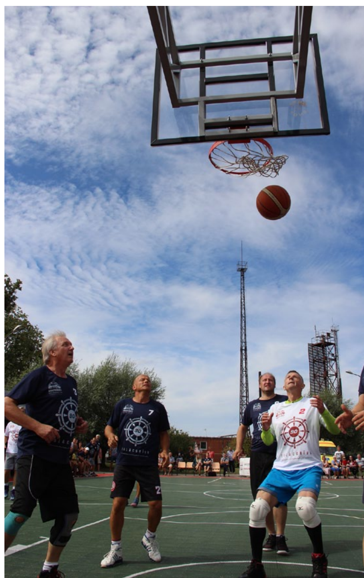
Tiksimies Krastu mačā!