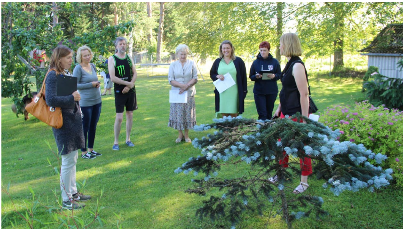
Vērtēšanas komisija Ainažu pagasta Jaunbrantos