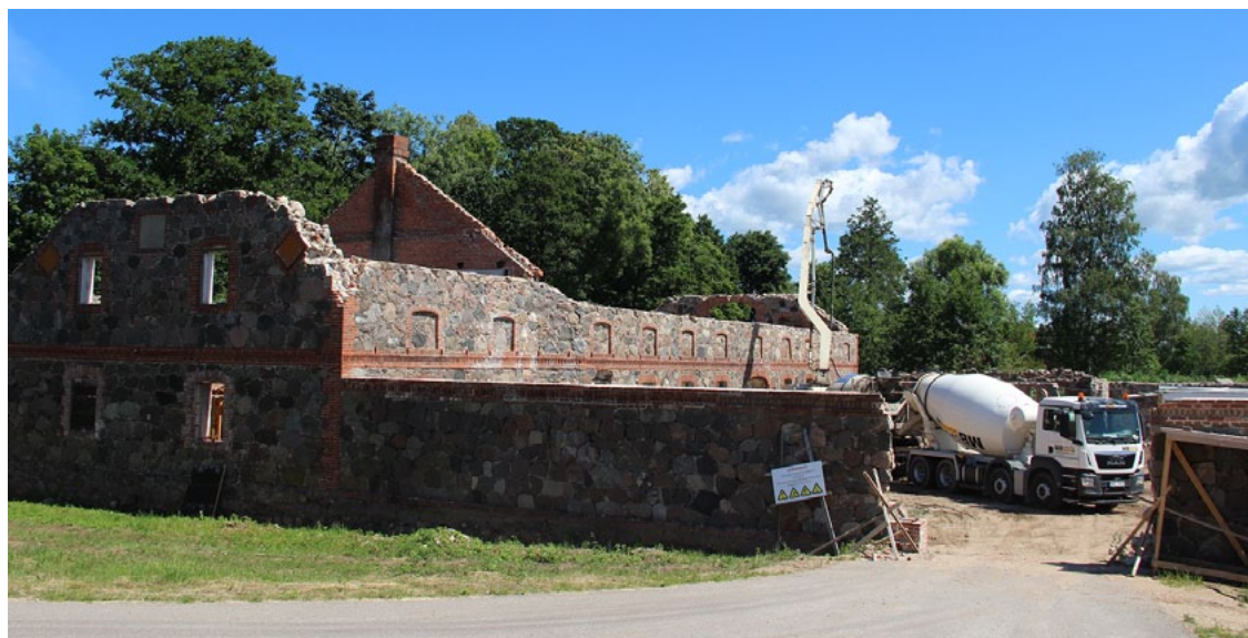
Svētciema muižas stallī notiek betonēšanas darbi