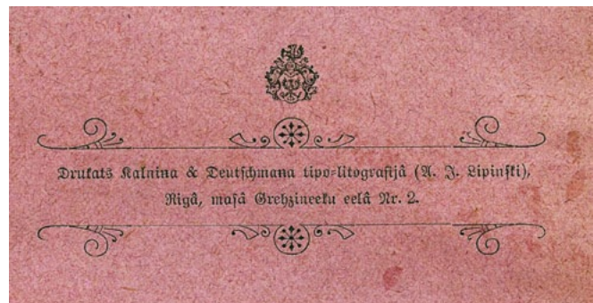
Aizmugurējā vāka fragments