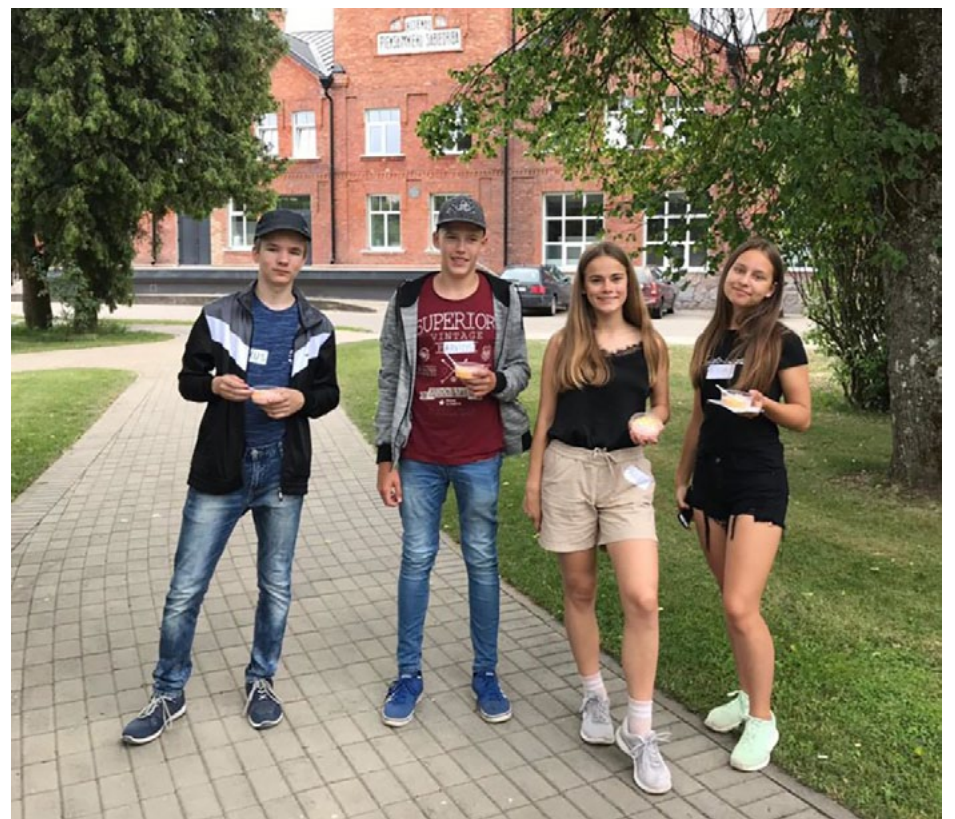
Salacgrīvieši BSP vasaras skola 2019 seminārā Rūjienā

Ekskursijas beigās visi panašķējās ar gardu tēju, rabarberu plātismaizi un maizītēm. Tad devāmies uz Igaunijas robežas