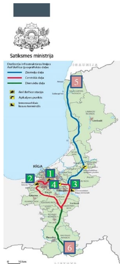
Karte ar apstiprināto trases novietojumu