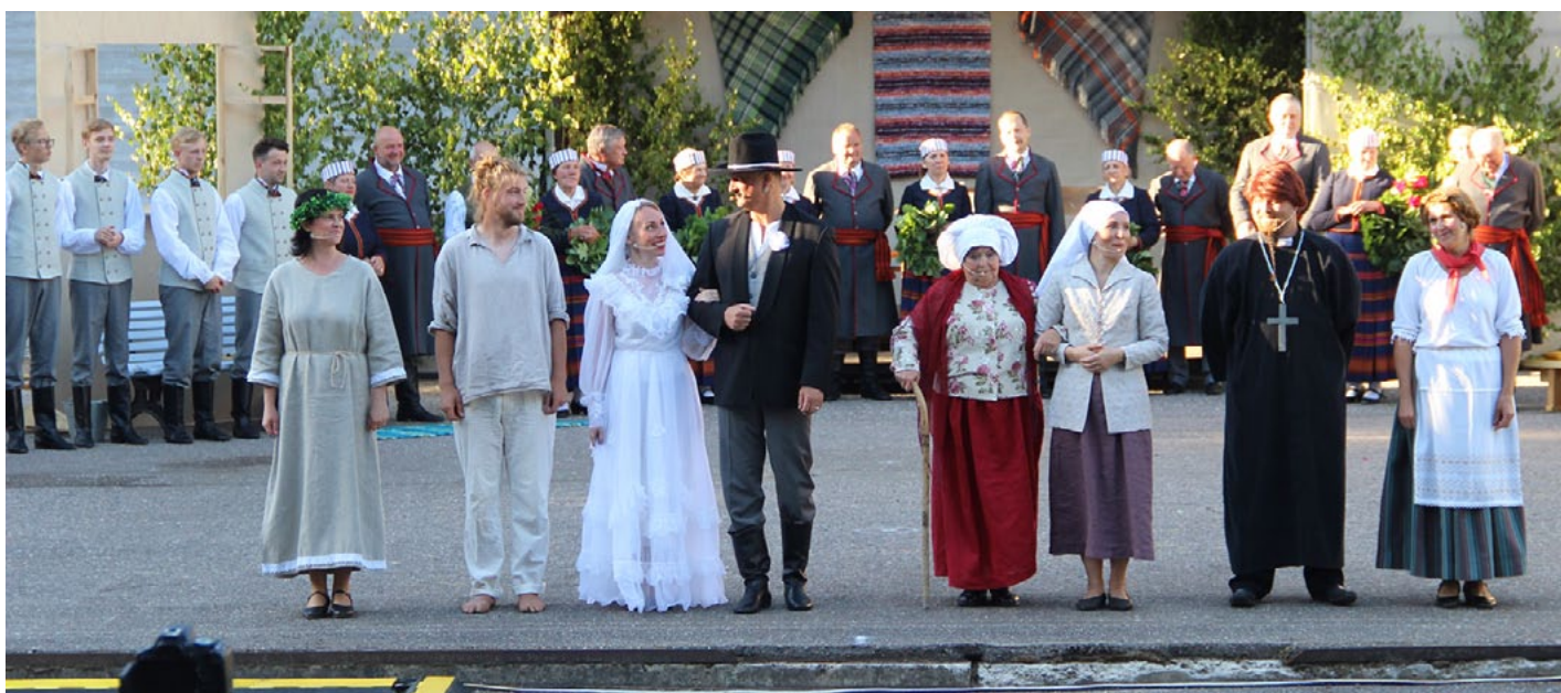
Šī gada teatralizētā uzveduma aktieri un dejotāji