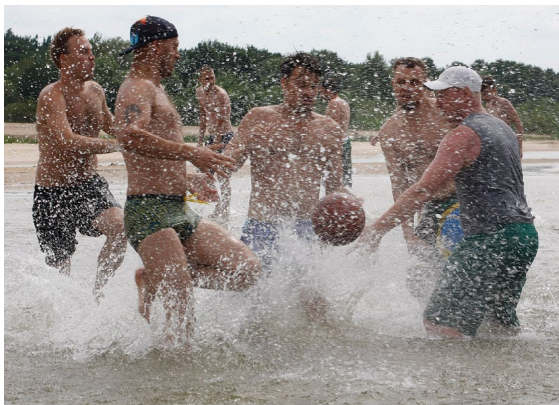
Spēlējām pludmales strītbolu