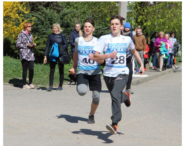
Finišē 8.–9. klašu skrējēji