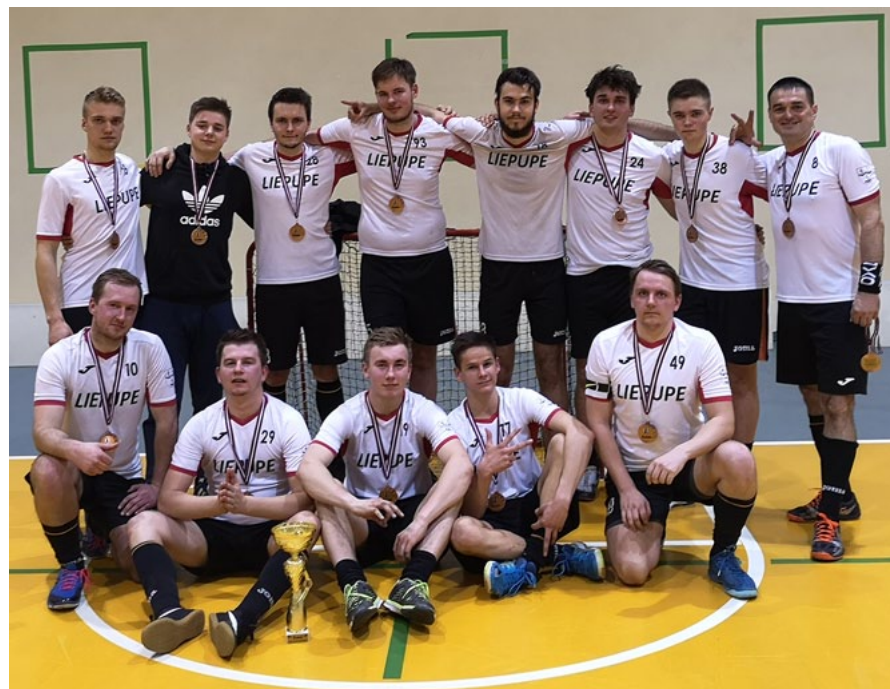
Sporta klubs Veixmes pēc veiksmīgi pavadītās sezonas