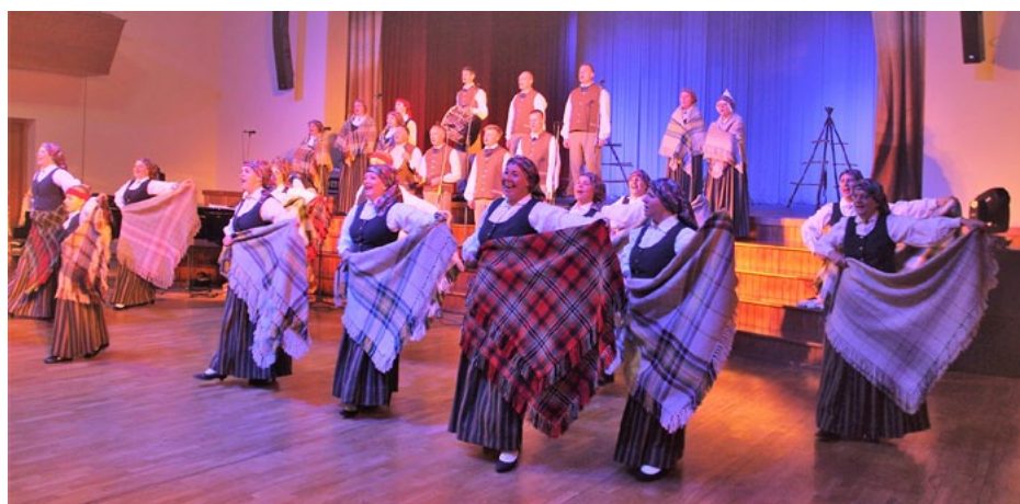
Jubileja tika svinēta gana atraktīvi