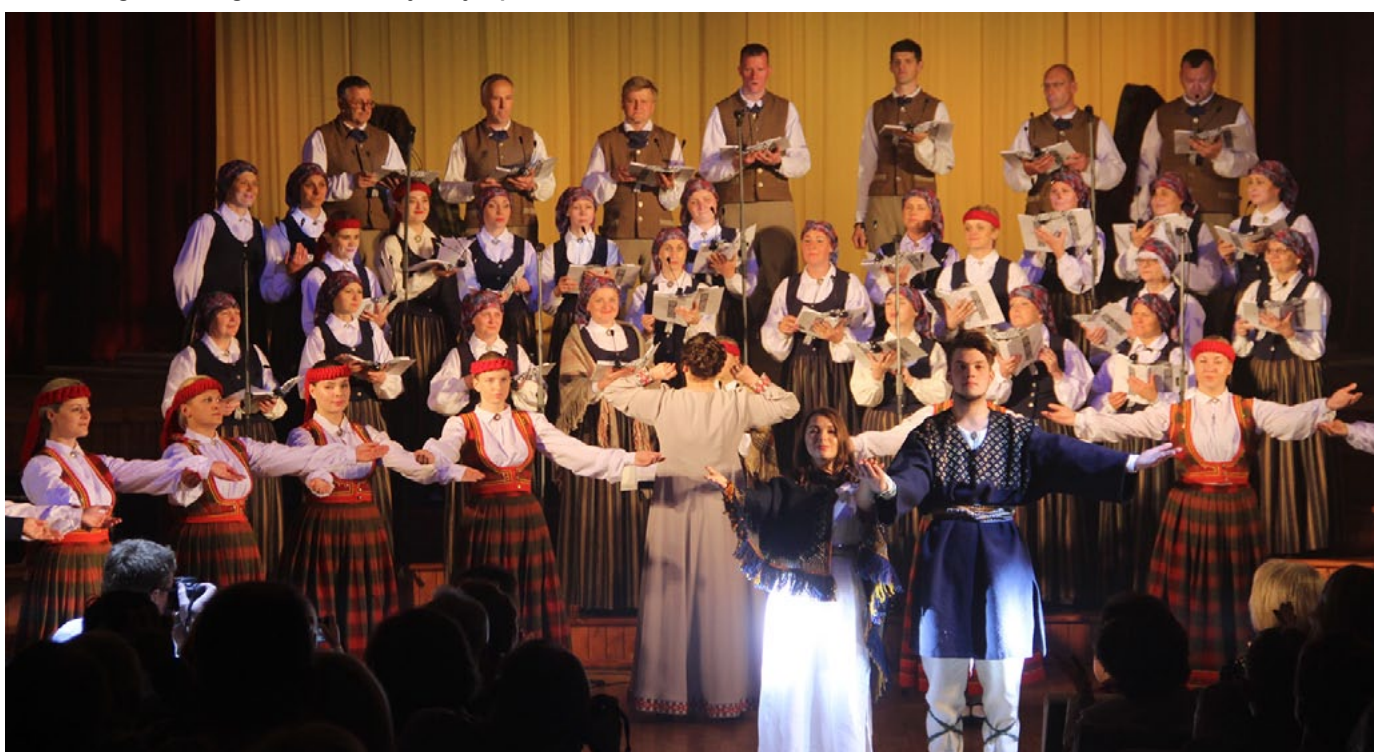
Salacgrīvas kultūras namā koncerts izskanēja emocionāli spēcīgi