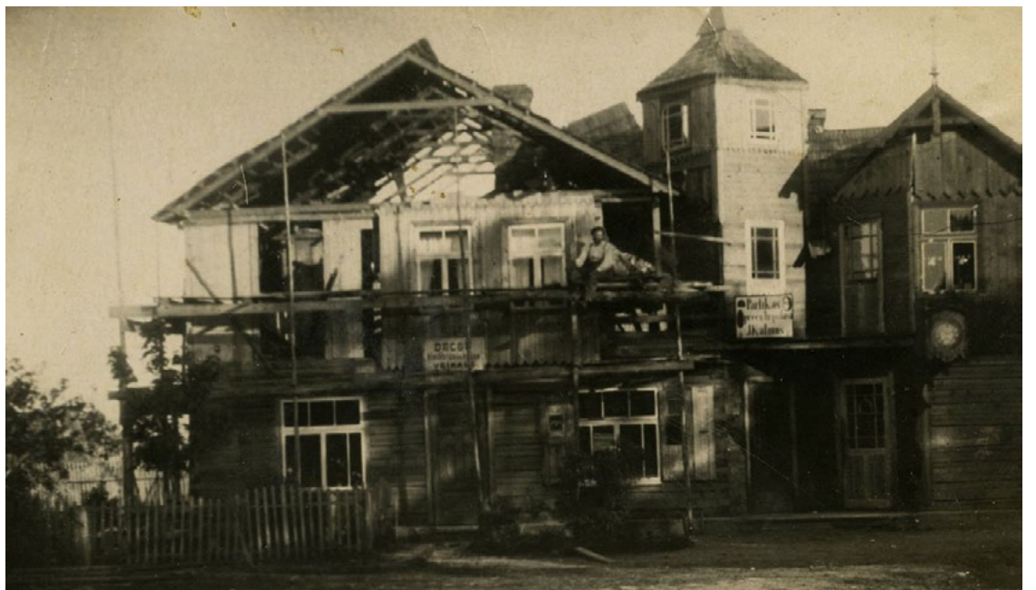
Šajā fotogrāfijā redzams, ka notikusi vērienīga ēkas paplašināšana, un pie durvīm jau divu veikalu izkārtnes