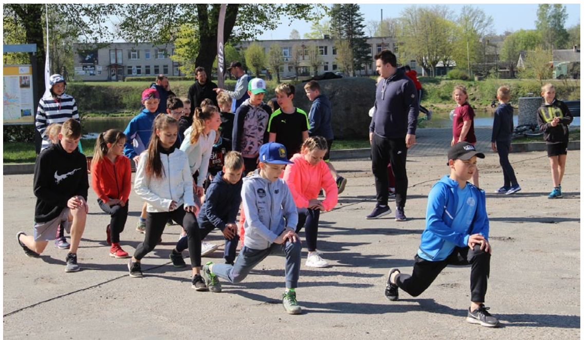
Iesildīšanās pirms stafetes