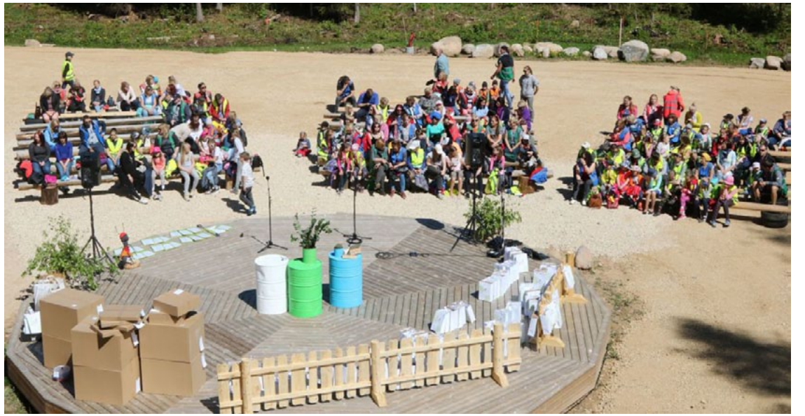
Mācību gada noslēguma pasākums dabas un tehnoloģiju parkā Urda