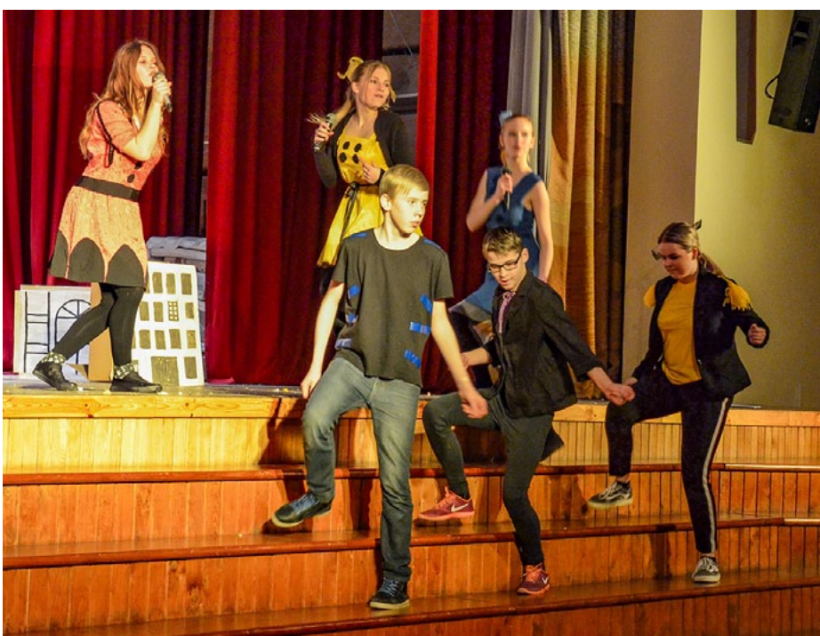
Uzstājas Krišjāņa Valdemāra Ainažu pamatskolas audzēkņi

1. marta pēcpusdienā uz lielās skatuves redzējām un dzirdējām daudzus. Salacgrīvas vidusskolas 9. b klases atrādīja Mma-ma Crazy Loop izpildījumā, Krišjāņa Valdemāra Ainažu pamatskolas 7. klase prezentēja Džeisona Derulo dziesmu If I'm lucky Part 2 , Liepupes pamatskolas 3., 4., 5. klases jeb Bermudu divstūris bija izvēlējušies dziesmu Ballplēsis . Spice Girls ar jautro Wannabe attēloja Salacgrīvas vidusskolas 8. a klase. Kaimiņvalsts pārstāvi Geteru Jāni ar viņas trešo singlu Rockefeller street priekšnesumā atainoja Krišjāņa Valdemāra Ainažu pamatskolas 8. klase.