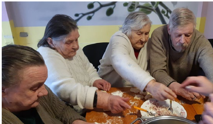
Top pīrādziņi Sprīdīšos