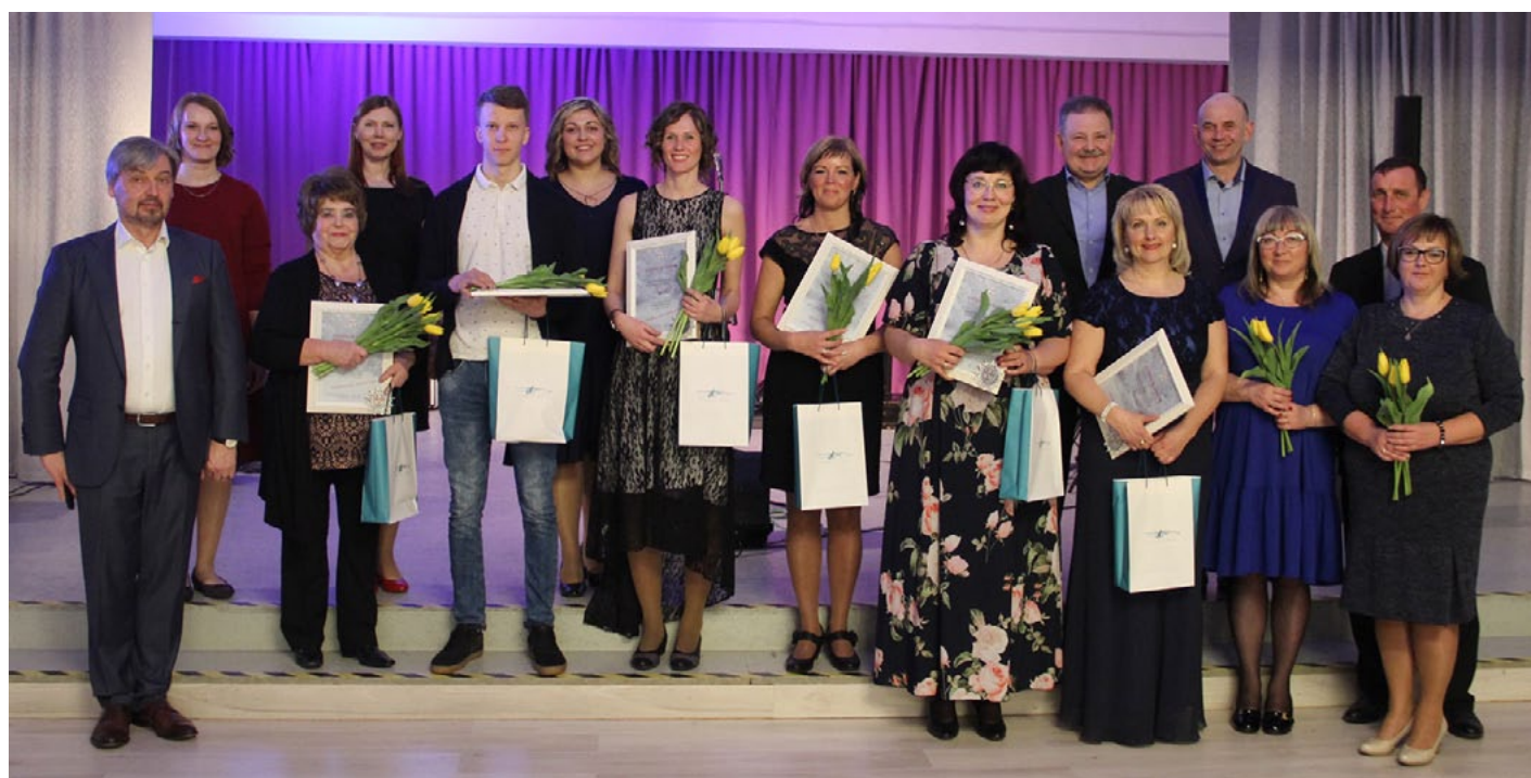
Konkursa Ziemas rota uzvarētāji un vērtēšanas komisija