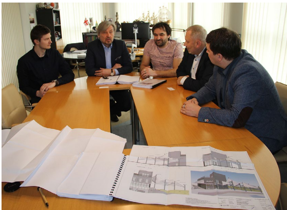
Rīt sarunas par jauno Jahtotāju servisa ēku