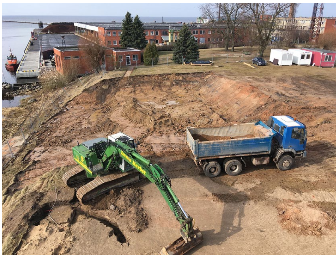
Būvlaukums Salacgrīvas centrā