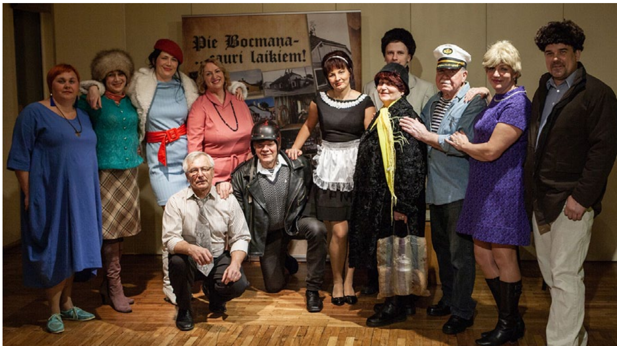
Teātra studijas Visa veida versijas aktieriem diktī patika izspēlēt ainīņas iz Bocmaņa dzīves...