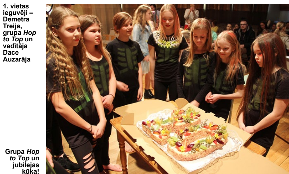
Grupa Hop to Top un jubilejas kūka!