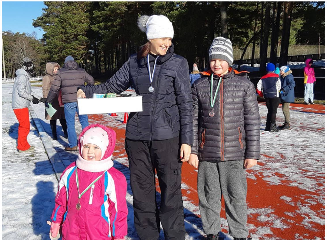
Trešās vietas ieguvēji – Smalko ģimene

Pašā februāra vidū, kad ziema ar sniegu vēl nedaudz mūs palutināja, sporta un atpūtas kompleksā Zvejnieku parks notika ikgadējā Sniega diena. Uz to bija sanākušas gan ģimenes, gan bērni.