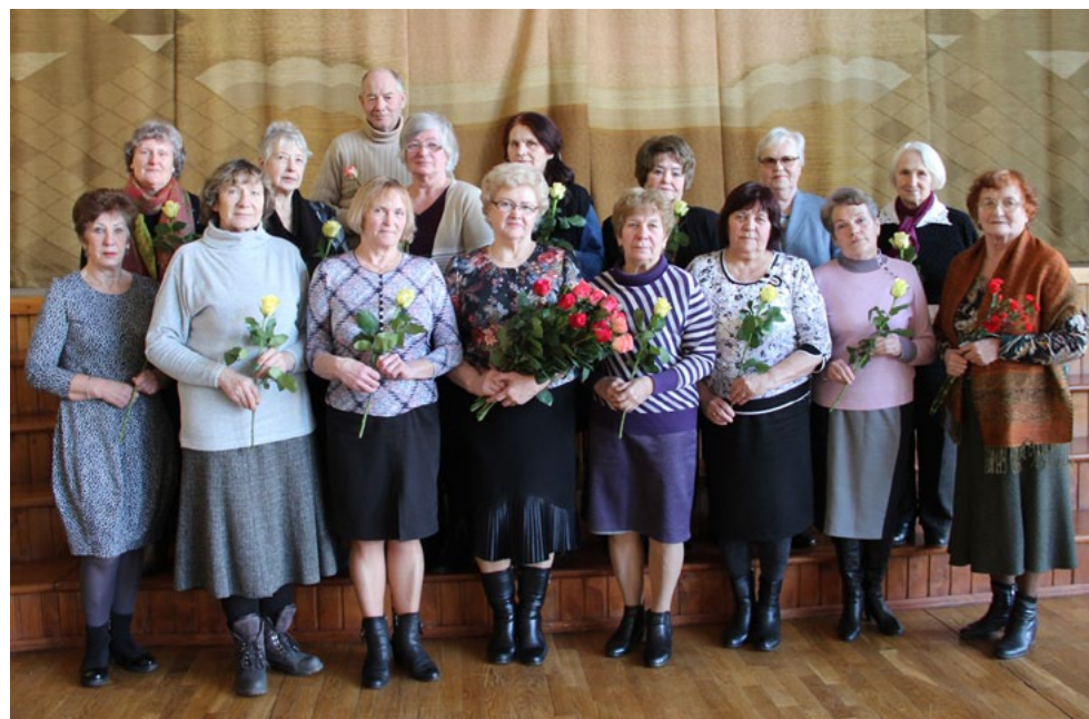
Salacgrīvas novada jaunievēlētā pensionāru biedrības valde un revīzijas komisija