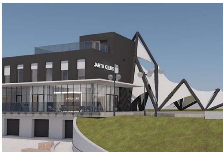
Topošās ēkas vizualizācija