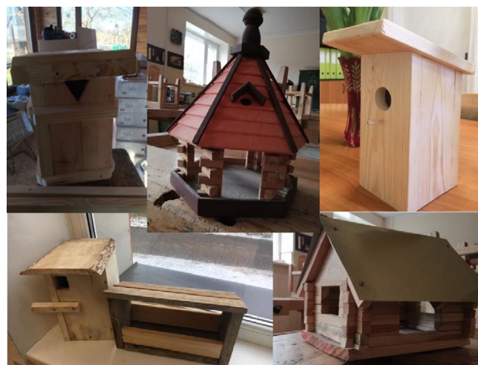
5. a klases gatavotie putnu būriņi un barotavas

Mūsu skolēniem patīk ne tikai izglītoties, bet arī pārbaudīt, cik daudz zina citi, turklāt papildināt viņu zināšanas. Tāpēc 6. b, 7. b, 8. b un 9. b klases skolēni ir izveidojuši vairākas erudīcijas spēles. 9. b klase sagatavoja viktorīnu un nodarbību 4. un 6. klašu skolēniem, bet 7. a klase izveidoja spēli par klimata pārmaiņām. Ir labi, ja laikapstākļus, klimata pārmaiņas un dabā notiekošo sāk apzināties jau jaunībā! Tā rodas cerība uz izaugsmi. Ūdens ir neatņemama dzīves sastāvdaļa, tāpēc 7. a, 7. b un 10. klase izvēlējās papētīt šo tēmu. Viņi atrada gan interesantus faktus par to, cik patiesībā daudz ūdens patērē viena augs-