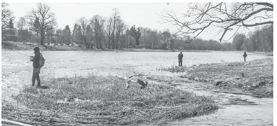
Salacā makšķerēšanas sezona sākas pavasarī, kad upē ienāk zivis no jūras

Salacas ūdeņiem ir arī savs bezgalīgais stāsts par maliķiem. Valsts vides dienesta inspektori lašu un taimiņu zvejas lieguma laikā ik gadu no upes izņem nelikumīgi ieliktus murdus un tīklus. Tāpat ne mazāk aktīvi ir nēģu maliķi. Taču konstatēto pārkāpumu statistika ir ar lejupejošu tendenci.