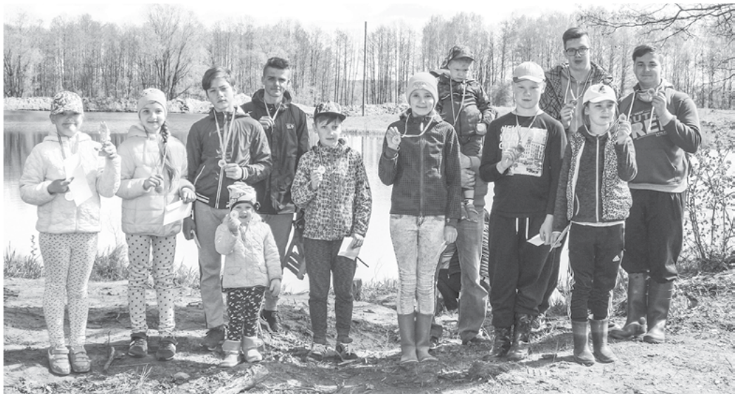
Ozolaines dīķa karpu makšķerēšanas čempionāta godalgotie dalībnieki