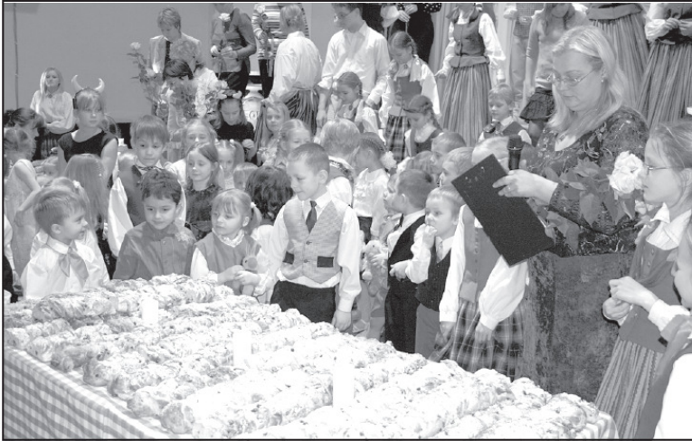
Devītā vilņa jubilejas klīngeri - 3 svecītes!

Nedēļi pirms jubilejas koncerta Salacgrīvas kultūras namā bija skatāma skolēnu radošo darbu izstāde. Interesentu apskatei bija izlikti visdažādākie darbi - Salacgrīvas un Korģenes skolās apgleznotās zīda šalles, stikla trauki un audumi, kokapstrādes pulciņos Korģenē un Salacgrīvā tapušie darbiņi. Korģenes mazo dabas draugu paveiktais, Salacgrīvas vizuālais mākslas pulciņa zīmējumi un Korģenes pamatskolas rokdarbu pulciņa radītais.