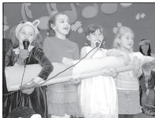
Dzied Vilniša jaunie talanti