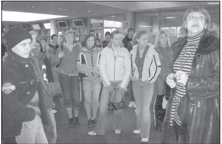
Skolēni ekskursijā lidostā

teātri Rīga noskatīties filmu Rīgas sargi , jauniešiem tas bija īpaši noderīgi, lai nostiprinātu zināšanas Latvijas vēsturē. Filma bija ļoti savijojosa, pēc tās noskatīšanās mājupceļā vēl ilgi par to runājām. Visu braucēju vārdā vēlamies pateik-