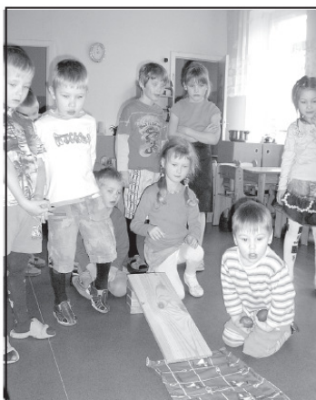
Olu rīpināšana pirmsskolas grupiņā