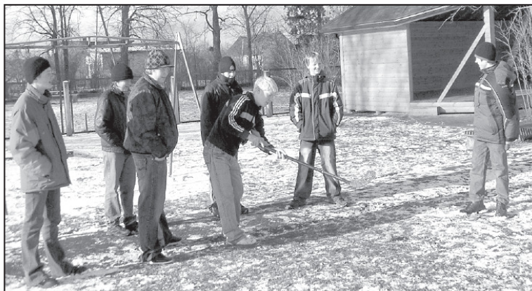
7. klases komanda stafetē Cūciņas ķeršana

Pēc drūmās ziemas visi ar nepacietību gaida pavasari un, protams, Liendienas. Par to liecināja arī izstāde Ola-Lieldienu simbols .