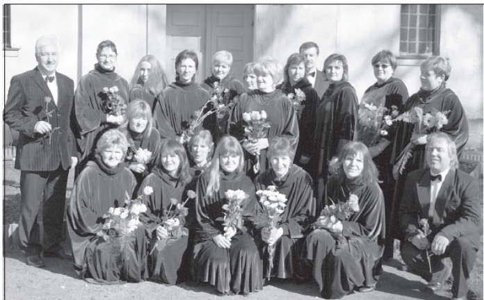
Koris Dvēseles dziesma