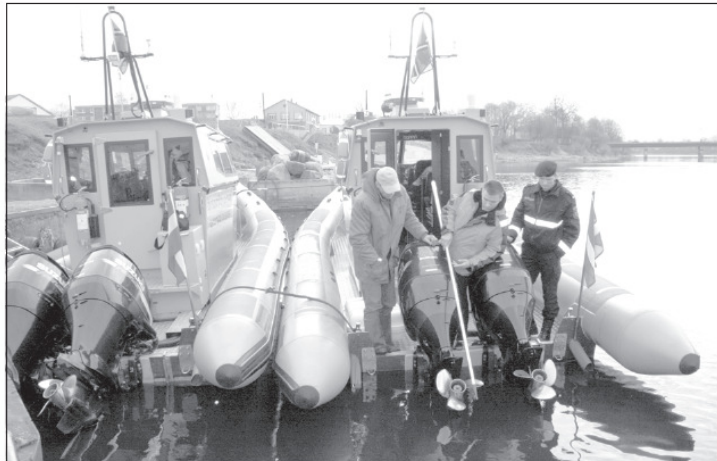
Abi robežsardzes kuteri Salacgrīvas ostā