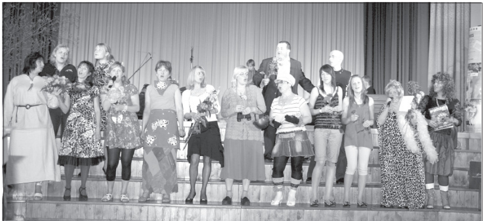
Te nu ir viss kopkoris