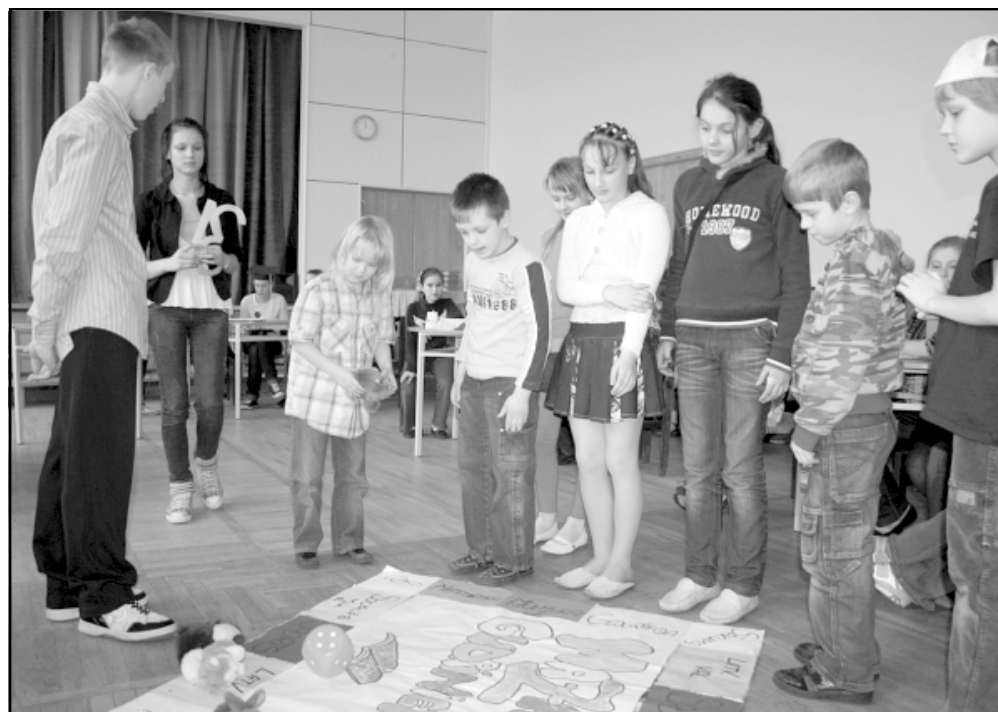
Lai zinātu, uz kādu jautājumu būs jāatbild, mazie izspēlēja spēli ar metamo kauliņu