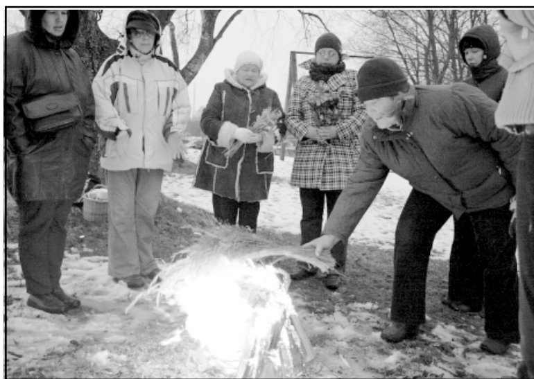
Saulīti gaidot Salacgrīvas pilskalnā

Lai arī kalendārs vēstīja, ka astronomiskais pavasaris sākās jau piektdien, 20.III, pulksten 13.44, sestdienas agrā rītā ap pulksten 6 Salacgrīvas pilskalnā pulcējās folkloras kopas Cielava lielās dziedātājas un mazie Zēģelītes dalībnieki, lai ar skanīgām dziesmām, rituāla ugunsgrūdi un rotaļām sveiktu pavasara saulgriežus un saulīti. Nomākusies debess nemaz negribēja rādīt saulīti, bet dziesmiņa Es sakūru uguntiņu no deviņi žagariņi, sildās Dieviņš, sildās Laima, mana mūža licējiņi! Trejdeviņas dzirkstelītes pret saulīti uzlekušas... sildīja gan lielo, gan mazo sirdis. Ziedojo ugunij Jāņos pītu vainadziņu, rudzu maizes gabaliņu un trejdeviņas dzīpariņus, ikviens vēlēja labu sev, saviem tuvajiem un viens otram. Kopā dziedot spēka vārdus Lai bij vārdi, kam bij vārdi, man pašam bij stipri vārdi , mazie un lielie dziedātāji deva spēku viens otram tikt pāri grūtībām.