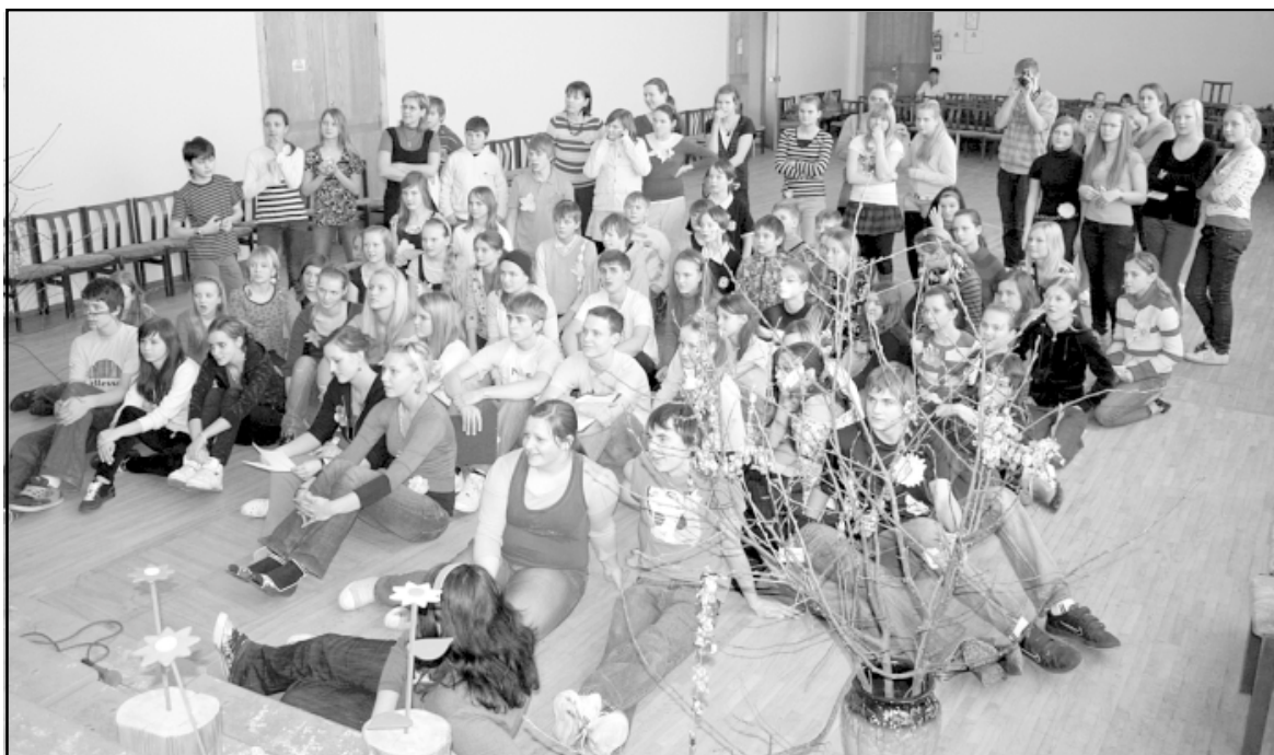
Pēc pasākuma skolēni noskatījās konkursam veidoto videoklipu Vardarbībai jāpieliek punkts

Skolēni un skolotāja bija gandarīti par paveikto. - Lai kāds būs konkursa rezultāts, darbi bija ļoti interesanti, mēs esam kļuvuši draudzīgāki. Man pašai ir liels prieks, ka skolēni no janvāra ar pieauguša cilvēka acīm skatās viens uz otru, ar liela cilvēka vārdiem runā cits