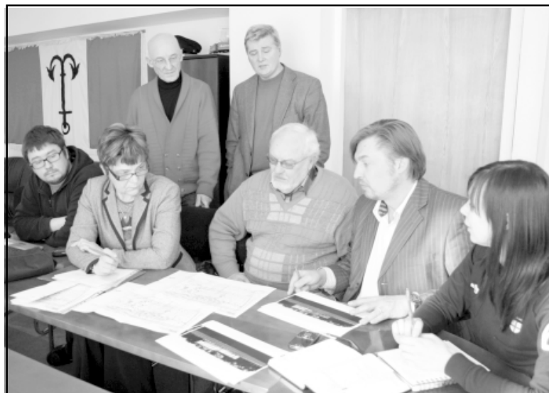
Projektētāji un Salacgrīvas domes pārstāvji apspriež sporta halles skīču projektu