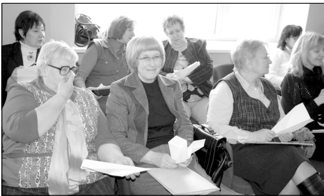
Sociālā dienesta darbinieku seminārā Salacgrīvā

Salacgrīvā uz kopīgu Limbažu rajona sociālo darba speciālistu profesionālās pilnveides semināru Klientu motivācijas veidošana un darbs ar nemotivētiem klientiem pulcējās vairāk nekā 20 rajona sociālo darbinieku no Ainažiem, Umurgas, Pāles, Staiceles, Liepupes, Limbažiem, Skultes, Vidrižiem, Brīvzemniekiem un Salacgrīvas.