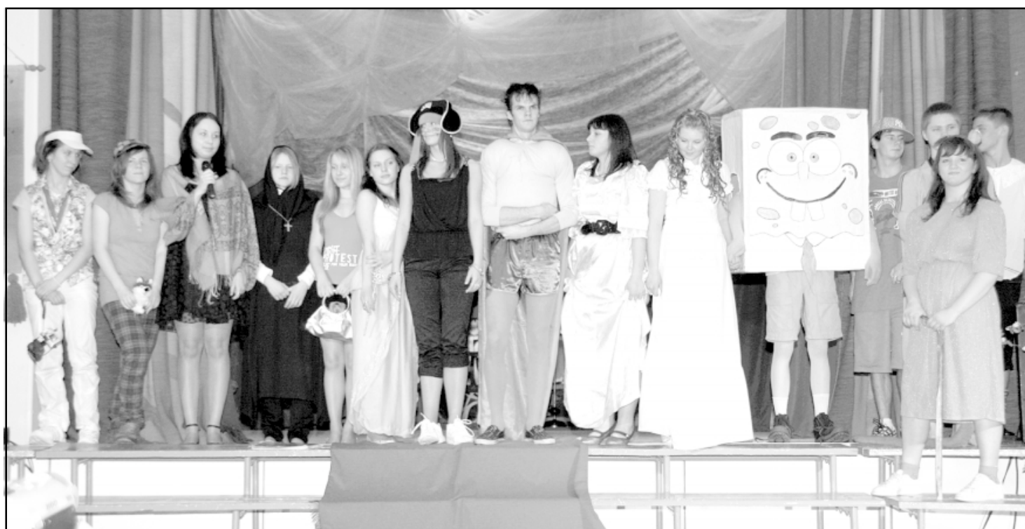
12.b klases teātra uzvedums