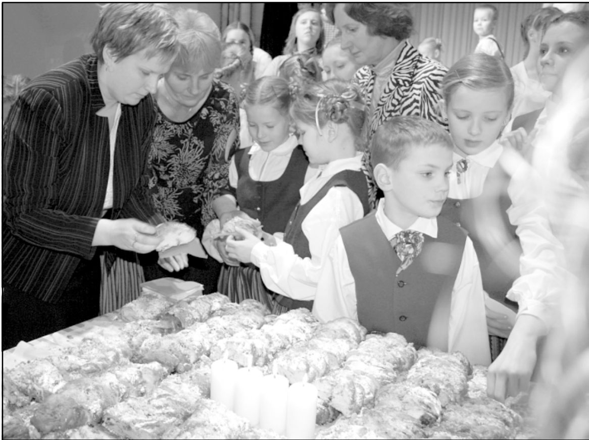
Pēc padarīta darba kopīga pacienāšanās!

Pirms četriem gadiem - 2005. gada 7. janvārī tika dibināta interešu izglītības iestāde Devītais vilnis , kur ikviens bērns vai jauniešs var izkopt un attīstīt spējas, talantus un intereses mākslinieciskajā pašdarbībā, sportā, arī datorzinībās, tēlotājmākslā un citos interešu virzienos, nostiprinot veselību, iemācoties sadarboties, pilnveidojot iegūstamās prasmes un iemaņas, pavādot brīvo laiku saturīgi neatkarīgi no vecuma un iepriekš iegūtās izglītības. Tādēļ katru gadu ap šo laiku kolektīvs svin dzimšanas dienu, un katrs pulciņš parāda savus sasniegumus.