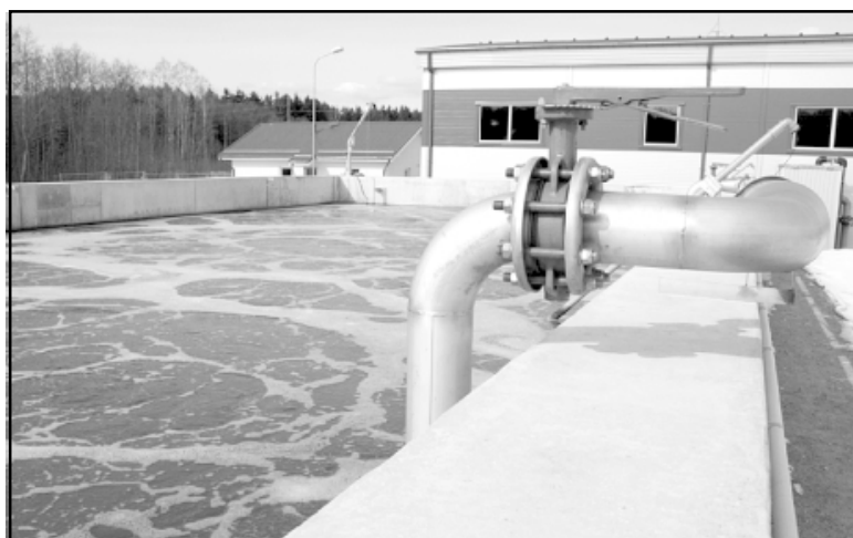
Testa režīmā darbojas ūdens attīrīšanas stacija Lauteros

Tuvākajā laikā plānojam atrisināt KSS elektropieslēguma problēmas, un tad varēsim sākt sūknēt uz NAI notekūdeņus arī no Kuivižiem, un nepieciešamības gadījumā pieņemt notekūdeņus arī no Salacas labā krasta iedzīvotājiem. Lai gan NAI nav vēl nodota ekspluatācijā, jau tagad ir redzams, cik kvalitatī-