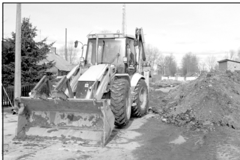
Sila ielā rit dzeramā ūdens atdzelžošanas stacijas un ūdensvada izbūve