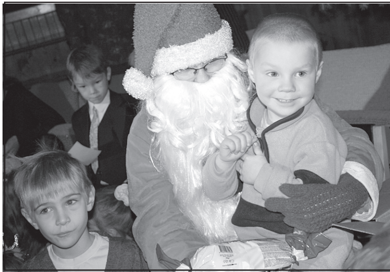
Svētki kopā ar Svētku rūķi labdarības pasākumā No sirds uz sirdi

atpakaļ svētku dalībniekus uz Salacgrīvu vizināja autobuss, kopā pasākumā piedalījās 120 bērnu. Labdarības akcijas organizatori - Salacgrīvas pilsētas ar lauku teritorijas domes Sociālais dienests, Sarkanā Krusta Salacgrīvas nodaļa un Salacgrīvas kultūras nams - teic paldies uzņēmējiem, kuri šogad labdarības pasākumam un skolēnu braucienam uz Rīgu saziedoja Ls 660. Ar skatījumiem aplausiem mazie salacgrīvieši un viņu vecāki teica lielu paldies gan labajām tantēm, gan dāsnajiem onkuļiem. Tikai tā - palīdzot cits ci-