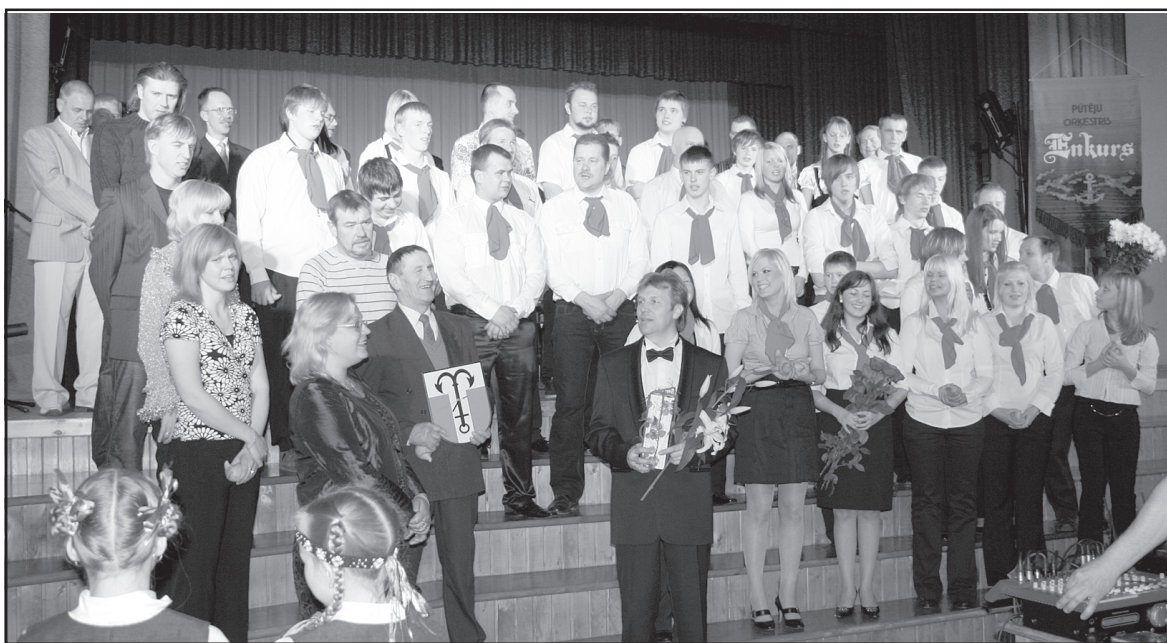
Pūtēju orķestris Enkurs jubilejas reizē