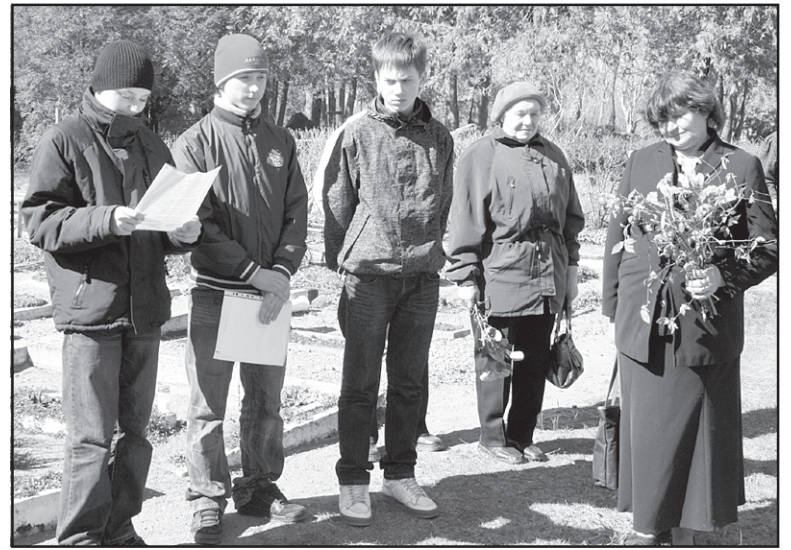
Dzeju lasa jaunieši