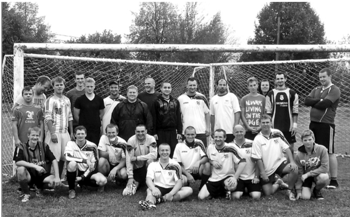
Izšķirošajā spēlē starp jauniešiem un vecajiem uzvarēja draudzība!

Vasaras sākumā Liepupē sanāca kopā futbola cienītāji un lēma, ka reizi mēnesī visi satiksies, lai spēlētu futbolu. Tā kā daudzi liepupieši, tūjieši, duntieši ikdienā strādā un mācās Rīgā, spēles dienas tika noliktas sestdienās, kad visi sabrauc mājās. Tā arī visu vasaru Liepupē spraigi spēlēja futbolu. Liels paldies A. Baumanim par zālāja pļaušanu futbola laukumā!