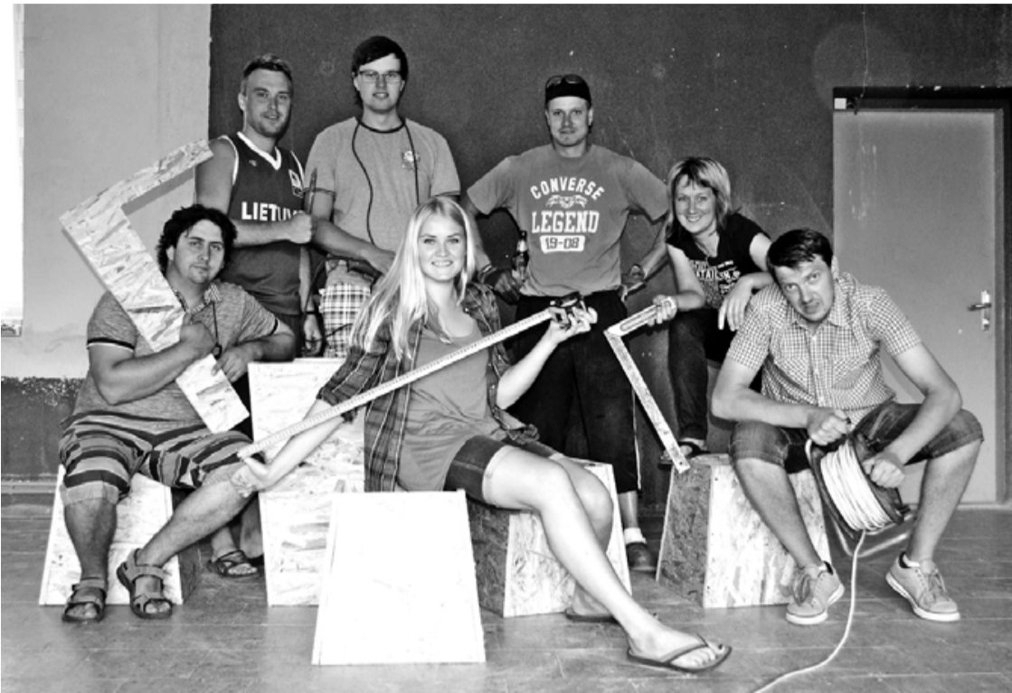
Vietējo iedzīvotāju iniciatīvu grupa Mēs – Salacgrīvai , sākot projekta realizāciju

Pateicoties programmas Sabiedrība ar dvēseli projektu konkursam, ko finansē Salacgrīvas novada dome un Holandes asociācija Koninklijke Nederledsche Heidemaatschappij , un vietējo iedzīvotāju iniciatīvu grupai Mēs – Salacgrīvai , septembra sākumā