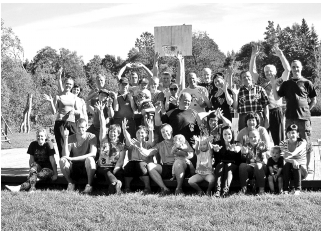
Jaukā dienā jauka biedrības Sprints A atpūta viesu namā Kraukļi

Tuvojoties vasaras sporta sezonas noslēgumam, 8. septembrī biedrības Sprints A biedri un atbalstītāji pulcējās uz sporta un aktīvās atpūtas pasākumu viesu namā Kraukļi , kas piedāvā savā teritorijā piedalīties dažādās sporta spēlēs un aktīvi atpūsties.