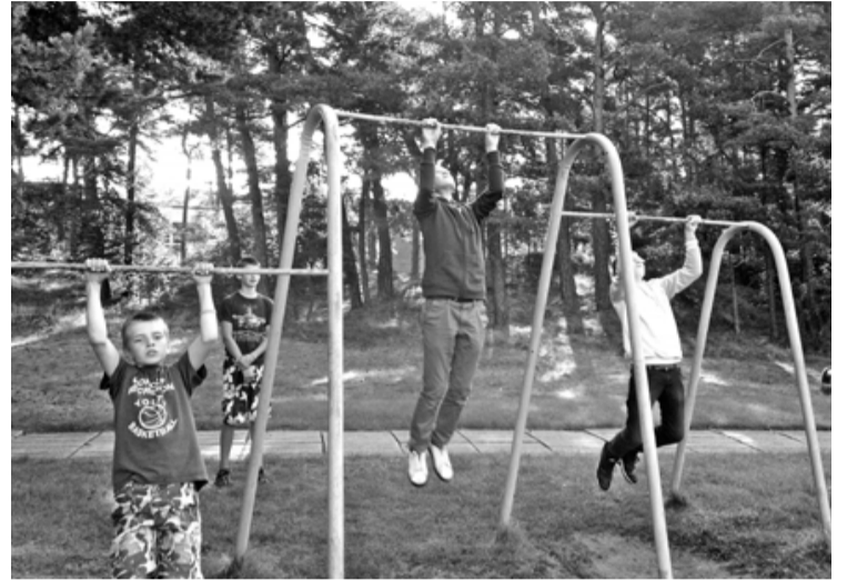
Jaunie salacgrīvieši Zvejnieku parkā iemēģina savus spēkus Vislatvijas spēka dienā

15. septembrī notika Vislatvijas Spēka diena, ko rīkoja VAS Latvijas Dzelzceļš sadarbībā ar Latvijas Neatkarīgo televīziju un Latvijas Ielu vingrošanas sporta biedrību. Šāds pasākums notiek jau otro gadu, taču pirmo reizi tas notika arī Salacgrīvas Zvejnieku parkā. Kopumā Latvijā tika izveidoti 60 spēka punkti, kuros ikviens varēja piedalīties pievilksnās sacensībās, taču sacensībai ir vairāk simboliska nozīme, jo svarīgākais ir piedalīšanās nevis uzvara.