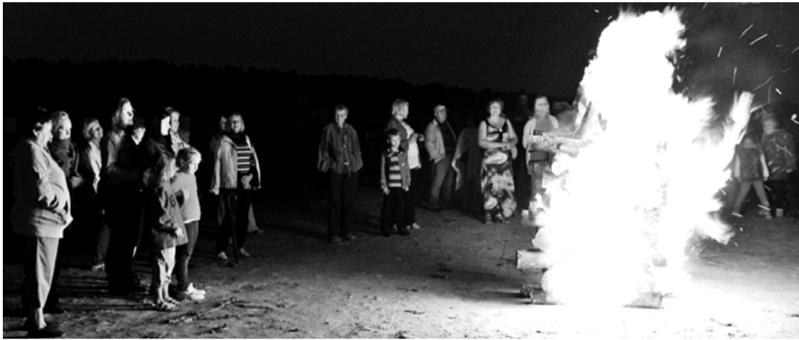
Uguns kuri dega un dziesmas skanēja arī Salacgrīvas pludmalē