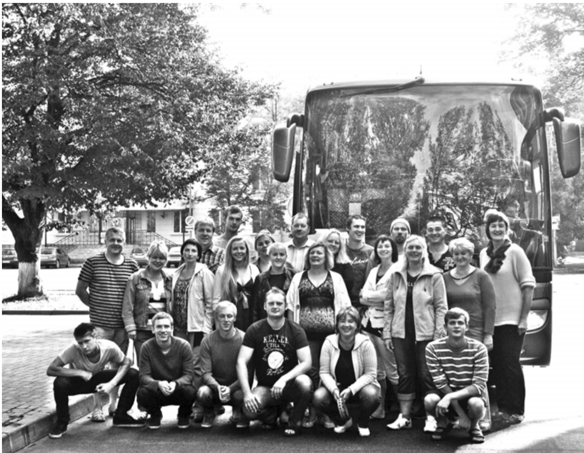
Mūsu novada pašdarbnieku kopbilde Volhovā

Augusta beigās Salacgrīvas novada delegācija kopā ar Limbažu novada pārstāvjiem devās trešajā, noslēdzošajā braucienā uz Volhovas pašvaldību Krie-