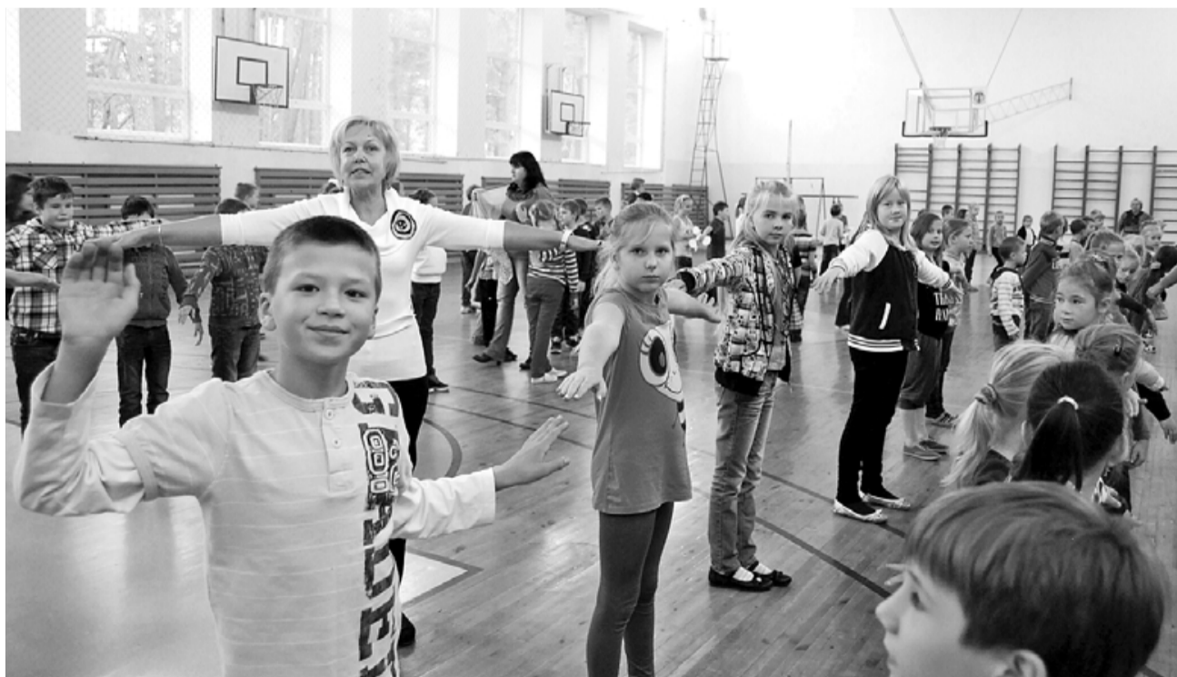
Olimpiskā rīta vingrošana Salacgrīvas vidusskolas sporta zālē

Starptautiskā Olimpiskā komiteja, atzīmējot savu dzimšanas dienu, ik gadu aicina visu valstu nacionālās Olimpiskās komitejas organizēt Olimpisko dienu, popularizējot Olimpisko kustību, kuras pamatā ir nezdodās vērtības – draudzība, cieņa