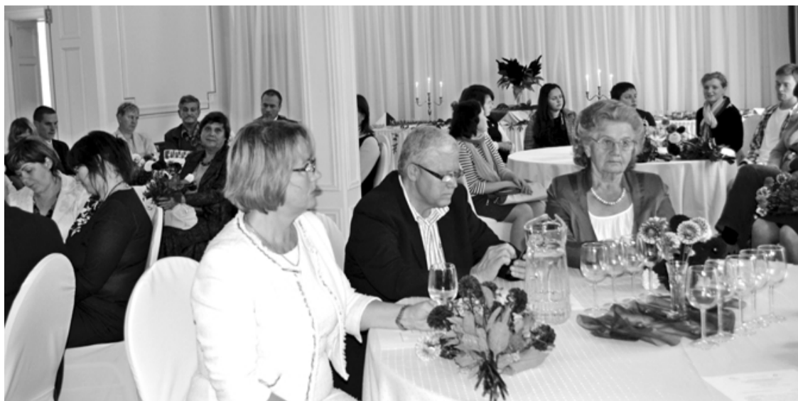
Limbažu fonda seminārs Igates pilī