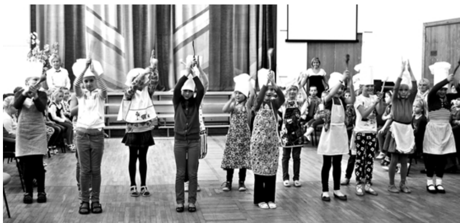
Mazo trešklasnieku dejas parādīja - putru ēdot, var dejojot un nemaz nenogurt

10. oktobrī ar plašām aktivitātēm visā pasaulē tiek svinēta Starptautiskā putras diena. Daudzās valstīs šo dienu velta labdarībai, lai ar dažādām aktivitātēm sniegtu atbalstu trūcīgajiem cilvēkiem. Latvijā putras ēšanai ir senas tradīcijas, mūsdienās tās ieguvušas jaunu veidolu. Putras ir gan vienkārši, gan garšīgi pagatavojamas, turklāt uztura speciālisti ir vienprātīgi, ka graudaugu putras ir enerģijas un spēka avots, jo satur saliktos ogļhidrātus, kas organismā nodrošina lēnu cukura līmeņa paaugstināšanos – tāpat pakāpenisku un ilgstošu enerģiju.