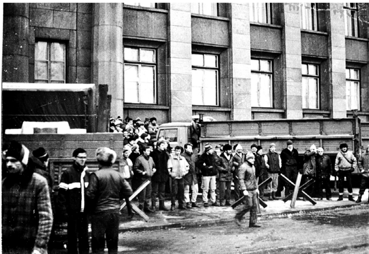
Mūsējie bija tur pie Augstākās padomes. 1991. gada janvāris