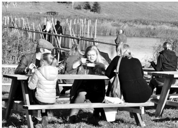
3. tači Mirdzas Sprinces nēģu zupa bija garda jo garda