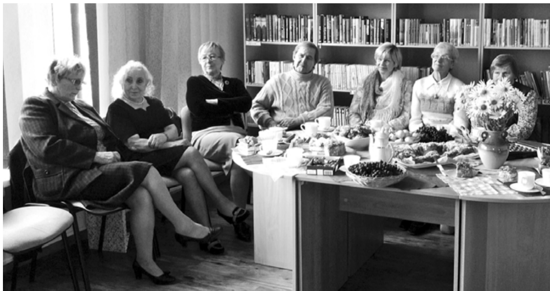
Jauka, sirsnīga un jautra bija šī atkalsatikšanās!

Jau otro gadu Svētciema bibliotēkā bijušo apkārtnes skolu pedagogi tika ielūgti uz Skolotāju dienas Atkalsatikšanās pēcpusdienu. Kā jau svētkos pienākas, apsveikumam bija uzaicināts īpašais viesis. Šoreiz sveiciens bija pārdomu pilns ar lielo, dziļo un visiem mums