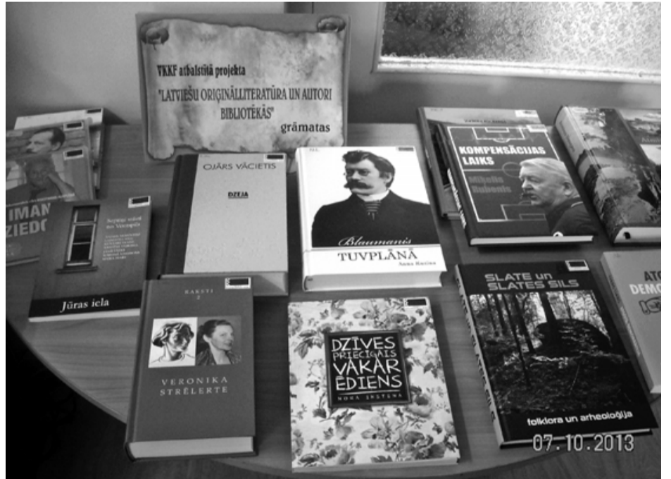
Daļa no jaunās oriģinālliteratūras kolekcijas Salacgrīvas bibliotēkā

Salacgrīvas novada bibliotēkas septembrī saņēma atbalstu latviešu oriģinālliteratūras iegādei. Šāda iespēja radās, jo Latvijas publiskās bibliotēkas tika aicinātas iesniegt projektus Latvijas Bibliotekāru biedrības un Latvijas Nacionālās bibliotēkas izsludinātajā projektu konkursā Latviešu oriģinālliteratūra un autori bibliotēkās . Projekta mērķis ir sekmēt vērtīgāko latviešu oriģinālliteratūras izdevumu pieejamību publiskajās bibliotēkās. Finansiāli šo kultūras projektu atbalsta Valsts kultūrkapitāla fonds (VKKF).