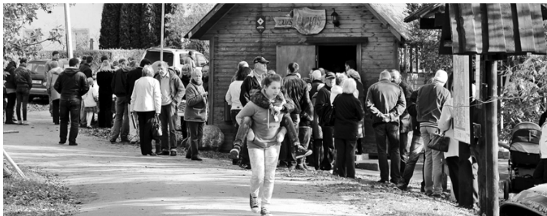
Nēģu svētkos šogad apmeklētāju bija īpaši daudz