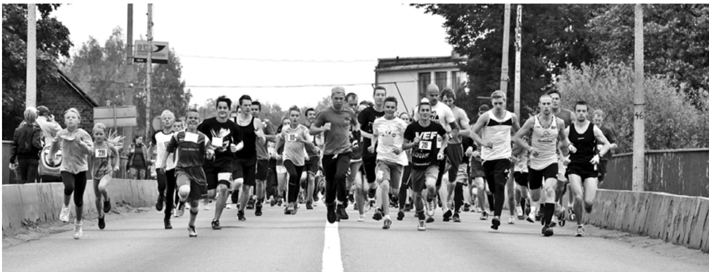
Skrīet pāri Salacas tiltam pa braucamo daļu var tikai vienreiz gadā - Trīs tiltu skrējiena laikā

21. septembris bija tradicionālā Trīs tiltu skrējiena diena, kad 6,5 km garajā trasē devās lieli un mazi – 56 meitenes, jauniešas, sievietes un 80 zēnu, jauniešu, vīriešu. Tikuši pāri Salacas tiltam, skrējiena dalībnieki pa Krasta ielu devās Jaunupes virzienā, lai vispirms šķērsotu tiltu pār Jaunupi un tad Annasmuižas tiltu. Gar upi skrienot, lēnāk vai ātrāk viņi tuvojās finišam – Salacgrīvas pilskalnā, siltai tē-