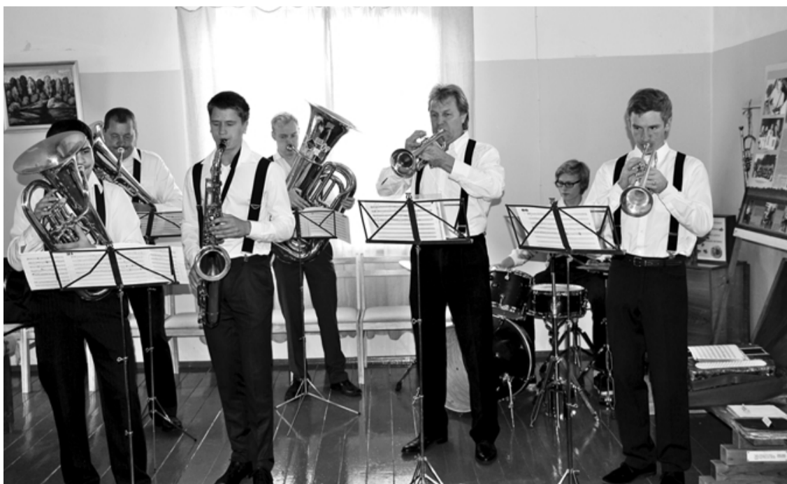
All Remember puīši radīja īstu svētku noskaņu, paldies viņiem par to!