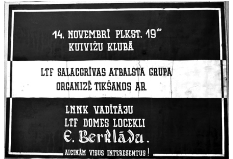
Aicinājums tikties ar Eduardu Berkļavu