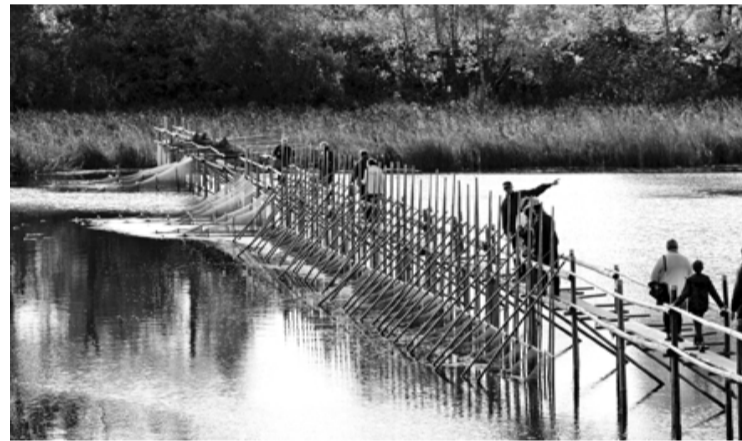
Tačus šajā dienā izstaigāja ne tikai zvejnieki. Foto redzams 1. tačis