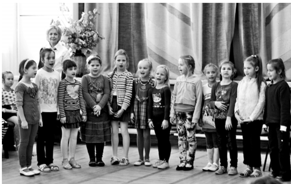
1.a klases skolēni runāja dzejolišus par putru

Skolēniem bija iespēja sekot projekta gaitai un aktivitātēm, kā arī iepazīstināt ar savām gaitām sociālajos tīklos draugiem.lv/profesorsgrauds un facebook.lv lapā Profesors Grauds . Mūsu skolā visu septembri un oktobra pirmajās dienās sākumskolas klasēs bija vērojama liela rošība. Reizēm pa skolas gaiteniem klejoja gardu putru smaržas. Tas liecināja, ka kādā klasē skolēni mīlojas ar pašu izvērtām putrām. Tika izziņātas dažādas receptes no skolēnu ģimeņu pūra. Kā lai tās nepagaršo? Vienā no tā-