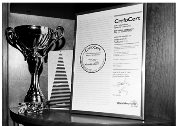
Šādu sertifikātu saņēma Salacgrīvas novada uzņēmums SIA Kubikmetrs

Uzņēmumi var pretendēt uz 2 veida sertifikātiem - Standarta un Zelta klases, kuri tiek piešķirti uz 1 gadu. Ja gada laikā būtiski pasliktinās maksātspējas rādītāji, sertifikātu anulē. Maksātspējas aprēķinos izmanto vairāk nekā 30 dažādu faktoru, ieskaitot finanšu datus, uzņēmuma kredītvēstures analīzi un speciālu CrefoScore indeksu. Sertifikāta izsniegšanas kritēriji izstrādāti pēc īpašas metodoloģijas sadarbībā ar Creditreform