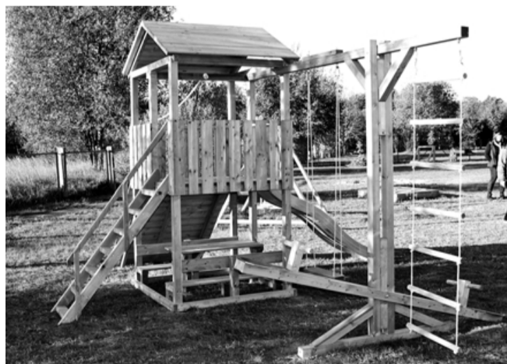
SIA JMK LUX jaunais rotaļu namiņš nu priecē mazos svētciemiešus un atgādina par uzvaru makulatūras un izlietoto bateriju vākšanas konkursā

Vēl it kā pavisam nesen, maijā, Salacgrīvas PII Vilnītis Svētcieņa filiāles bērni, vecāki un darbinieki piedzīvoja satraucošus un prieka pilnus mirkļus, kad Brīvdabas muzejā svinīgi tika apbalvoti uzvarētāji makulatūras un izlietoto bateriju vākšanā. Pateicoties neat-laidīgiem un darbotiesgribošiem vecākiem, I un II vietas ieguvēji bijām tieši mēs – Svētcieņa filiāles mazie un lielie bērni, vecāki, radi un draugi. Bērniem šis bija neaizmirstams piedzīvojums, jo paši varēja visu vērot un piedalīties.