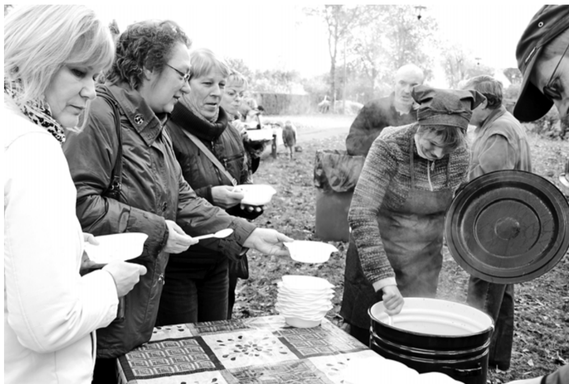
1. tači Mežābeles sievu vārītā zupa līdznešanai dota netika - vispirms lai tiek atbraukušajiem!