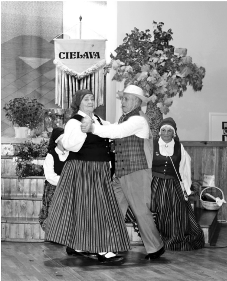
Kas tad jubileja bez kārtīga danča! Tā nu Lielie putni spēlē un jubilāri danco