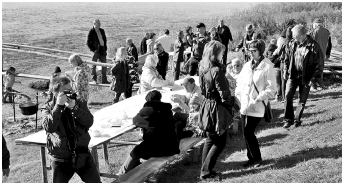
Zivju zupa, cepti nēģi un nesteidzīgas sarunas 2. tači