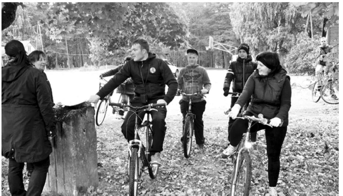
Šogad velofotoorientēšanās sacensības bija starptautiskas - vairāki kontrolpunkti brauciena dalībniekiem bija jāatrod Igaunijā

Vēl lielāks prieks, ka šoreiz uzvarējam un tikām pie lieliskām balvām – biļetēm uz motofrīstaila čempionāta posmu Rīgā.