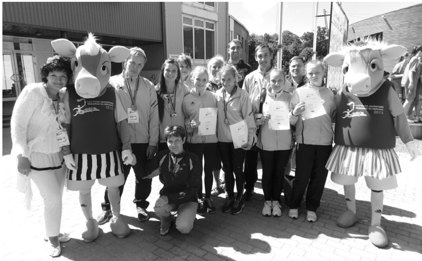
Novada komanda Ventspilī