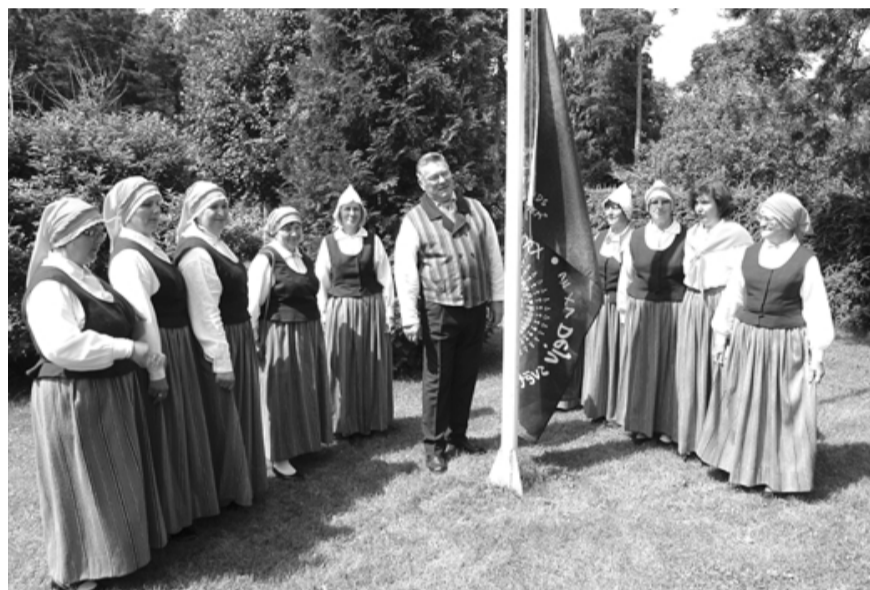
Pie Ainažu kultūras nama Dziesmu svētku karogs augšup cēlās ar kora Krasts dziedātāju roku un dziesmu spēku