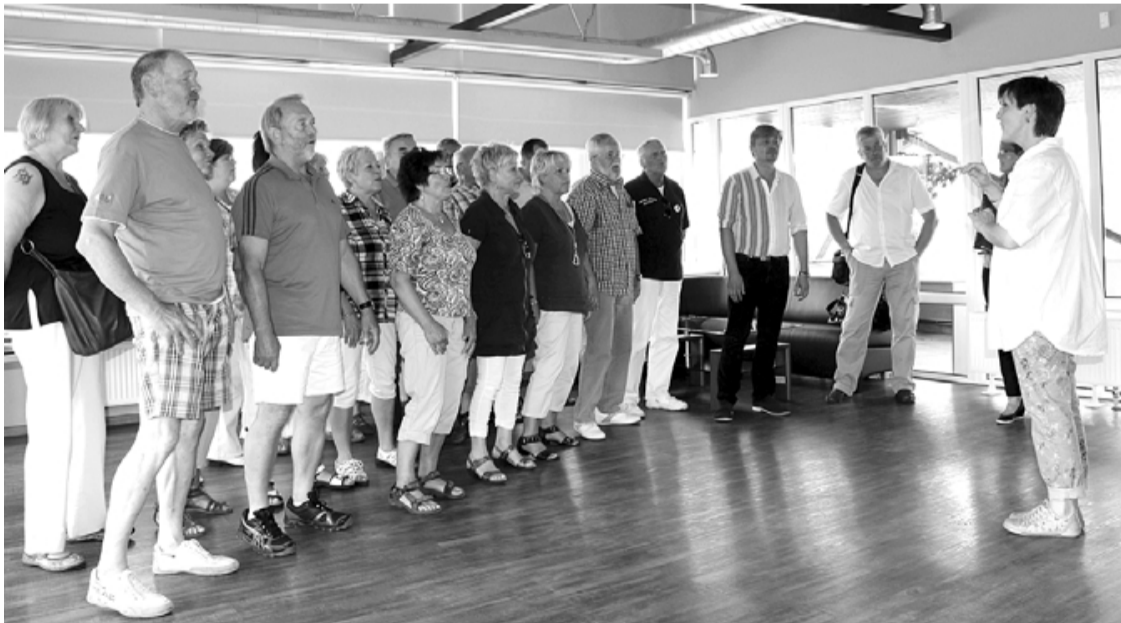
Atvadoties jaunatnes iniciatīvu centru piepildīja kopīgi dziedātā dziesma Mazā kaija

4. jūlijā Salacgrīvas novadā viesojās mūsu draudzības pašvaldības Vācijā Handevitas jauktais koris Ellunder Nordlichter . Pirmo reizi tas pie mums ciemojās 2006. gadā, kad pirms koncerta Salacgrīvas kultūras namā pasniedza ziedojumu nelaimē nonākušajai Ķeipiņu ģimenei.