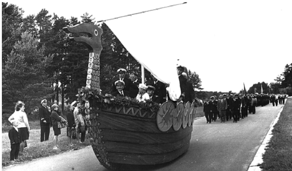
1967. gada Zvejnieku svētku dalībnieku gājiens uz jauno estrādi. Priekšā sēž tālbraucējs kapteinis Aleksandrs Bērziņš