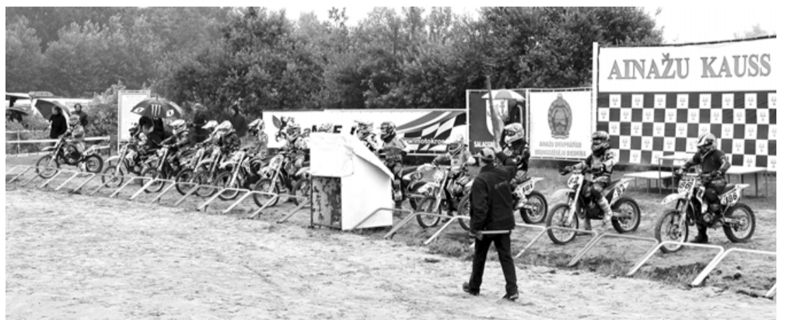
Startē MX 85 un dāmu brauciens

Arī šogad organizatori bija ieguldījuši lielu darbu sacensību rīkošanā un trases uzlabošanā. Izbūvēti jauni elementi un uzlabots segums, lai braukšanu padarītu drošāku. Pēc braucēju lūguma sacīkstēs