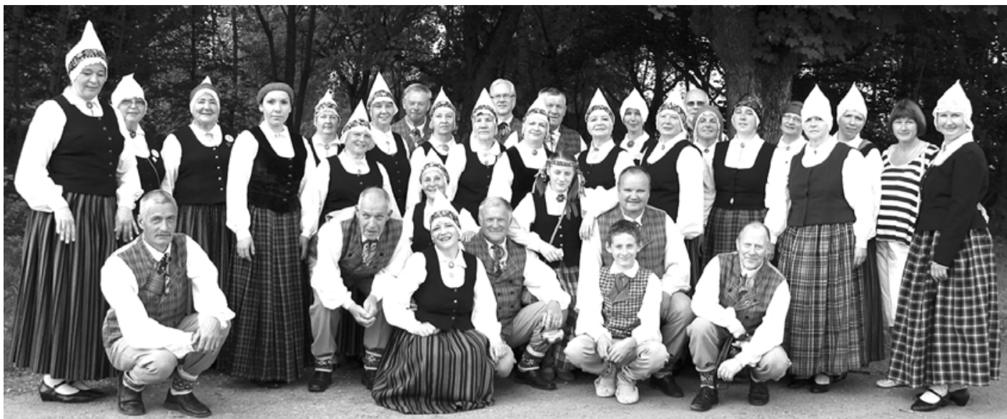
Tādi apmierināti un smaidīgi mēs bijām Aksvallas festivālā!

8. jūnija priekšpusdienā pagāja mēģinājumos, jo pēcpusdienā notika festivāla