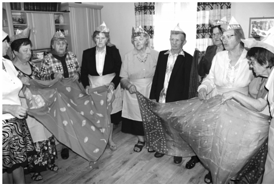
Redzes invalīdu grupas dalībnieki Jūras svētkiem iemācījušies un iestudējuši kustības dziesmai Jūriņ' prasa smalku tīklu