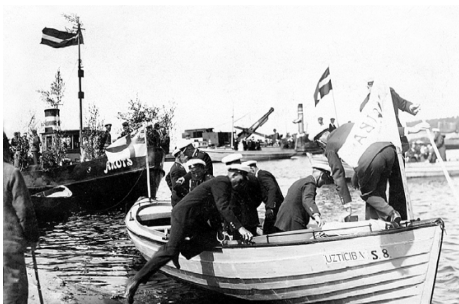
Salacgrīvas jūras aizsargu grupas motorlaiva Uzticība . 1936.g. 24. maijs