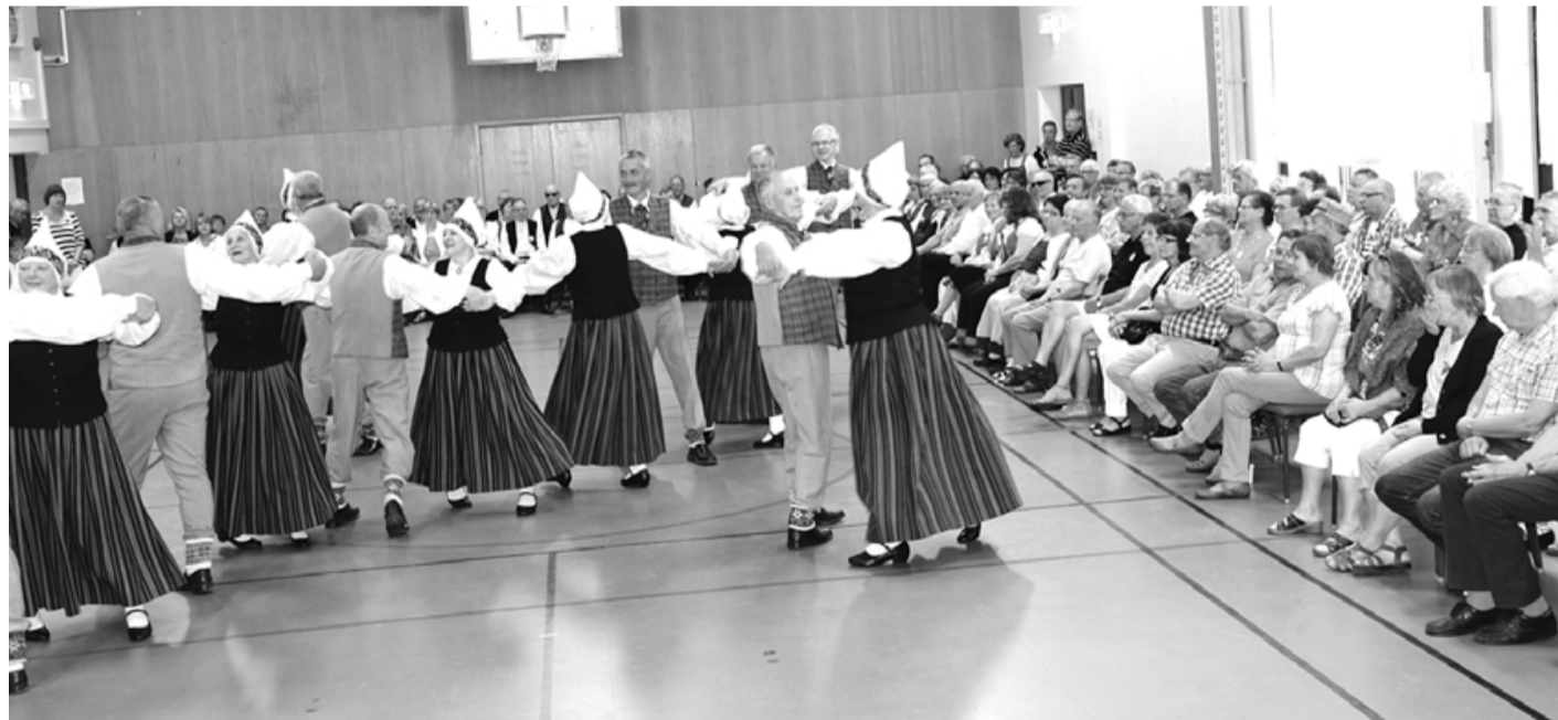
Festivāla dalībniekiem salacgrīviešu uzstāšanās patika