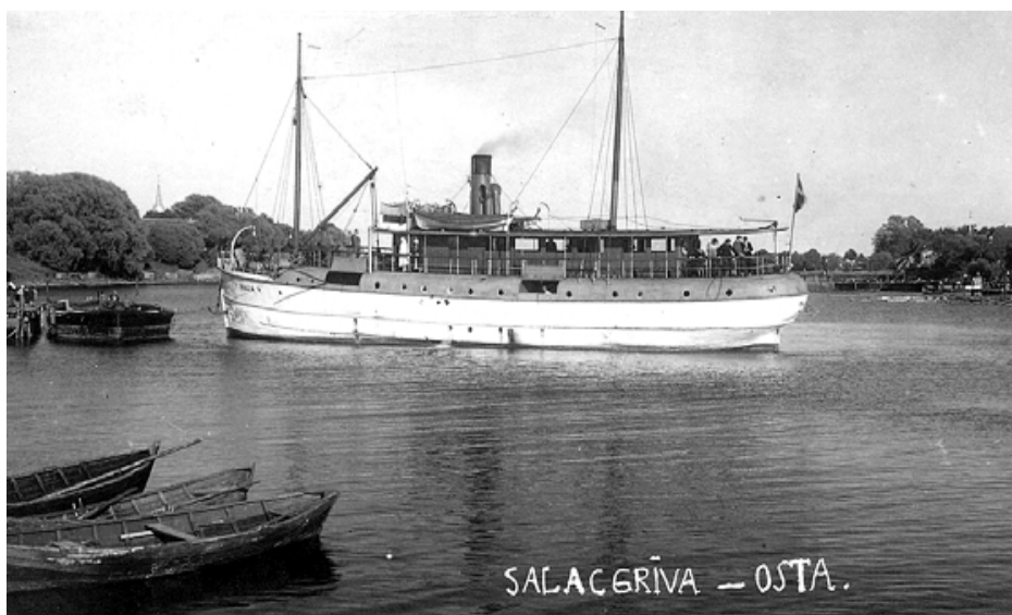
Tvaikonis Kaija Salacgrīvas ostā