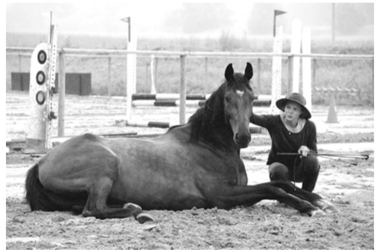
Dalībnieki iepazīstas ar vadības maršrutu