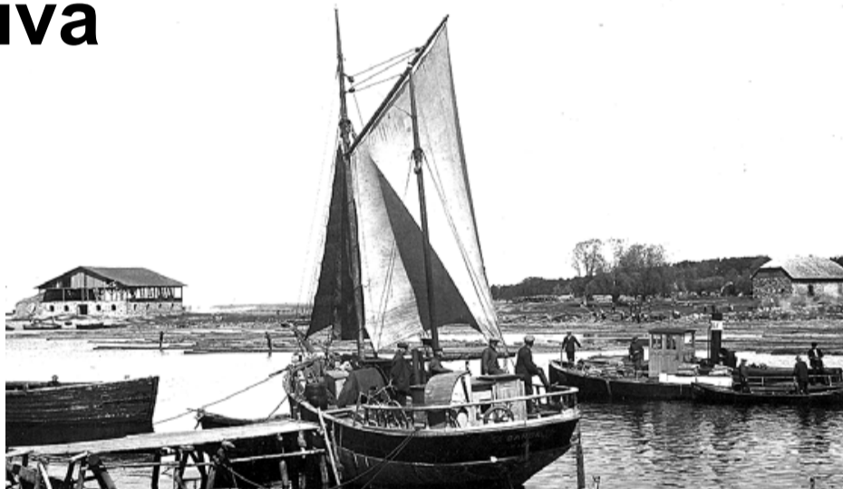
Divmastu burinieks Banga un velkonis Vera Salacgrīvas ostā. 1920. gadi