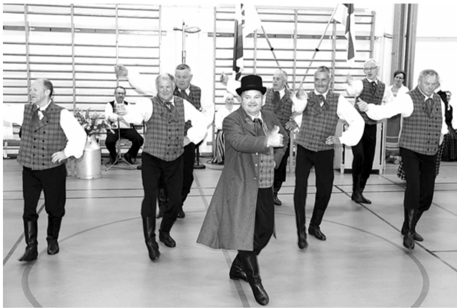
Deja par saimniekpu izpelnījās nedalītas skatītāju aplausus

Svarīgākā festivāla diena bija 9. jūnijs kad sporta hallē pulcējās visi starptautiskā festivāla dalībnieki: 2 kolektīvi no Latvijas, 1 no Somijas un 5 no Zviedrijas. Viņus uzrunāja galvenā svētku orga-