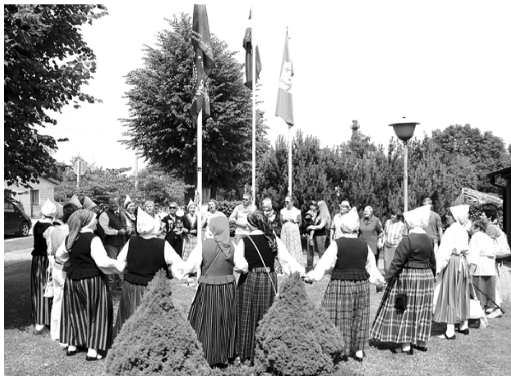
Paceļot svētku karogu Salacgrīvā pie domes, spēcīgā Cielavas dziedātā lībiešu dziesma radīja patiesu kopības un vienotības sajūtu

30. jūnijā, kad saule bija pašā zenītā, Salacgrīvā, Ainažos un Liepupē pulcējās cilvēki, lai kopā ar visas Latvijas iedzīvotājiem paceltu mastā XXV Vispārējo latviešu Dziesmu svētku un XV Deju svētku karogu.