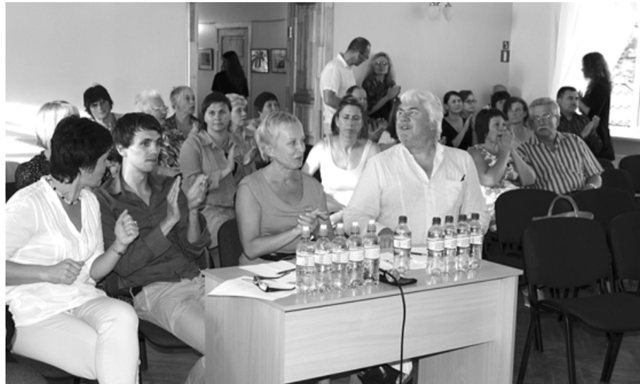
Festivāla uzvarētāji - grupa Mati