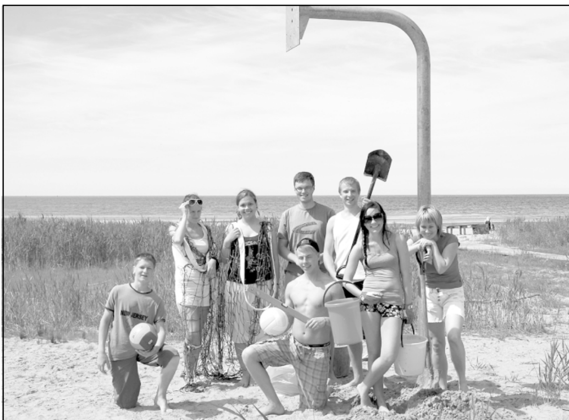
Jaunatnes konsultatīvā padome pēc kārtīgi padarītā darba - basketbola grozs pludmalē ir uzstādīts!

Vasara ir sākusies un pludmales sezona rit pilnā sparā, tāpēc Salacgrīvas novada jaunatnes konsultatīvā padome (SNJKP) nolēma nedaudz parūpēties par aktivitātēm Salacgrīvas jūrmalā.