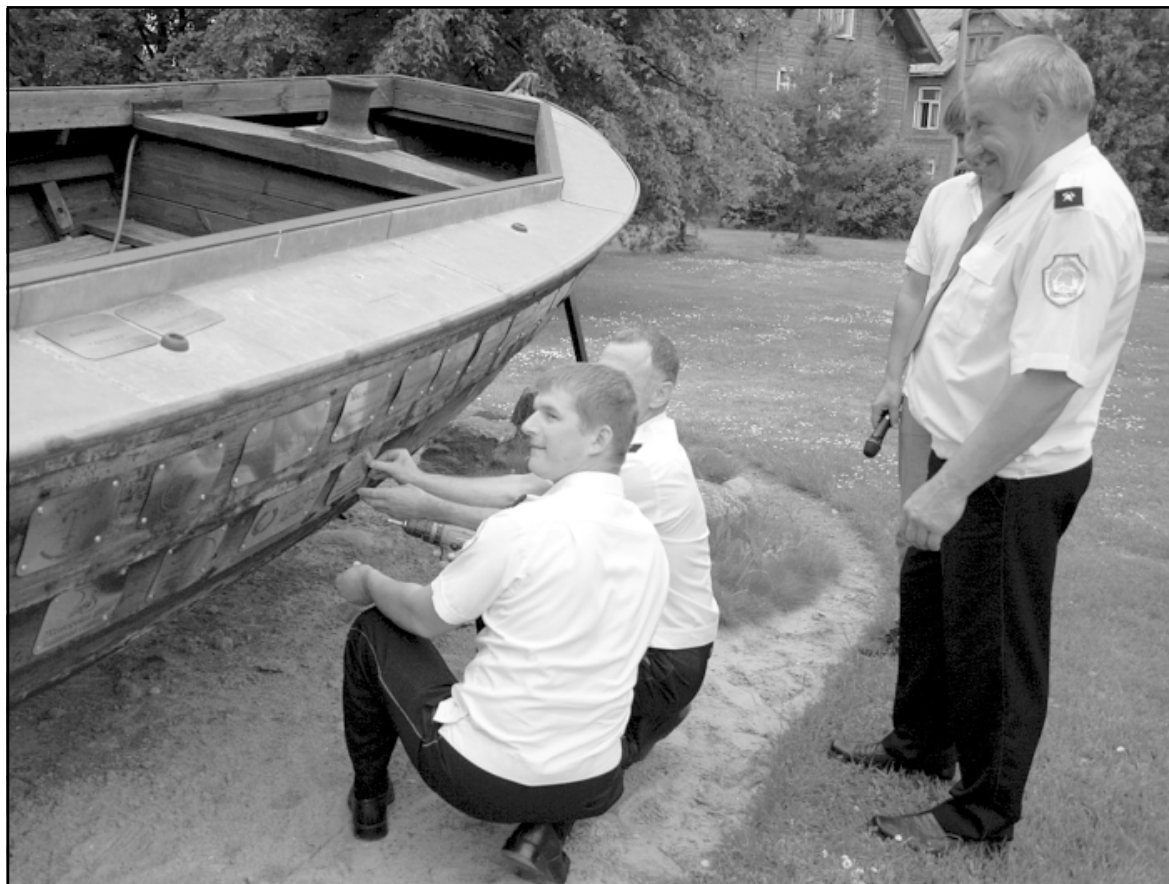
Pie darba ķērušies Ainažu Brīvprātīgās ugunsdzēsēju biedrības vīri