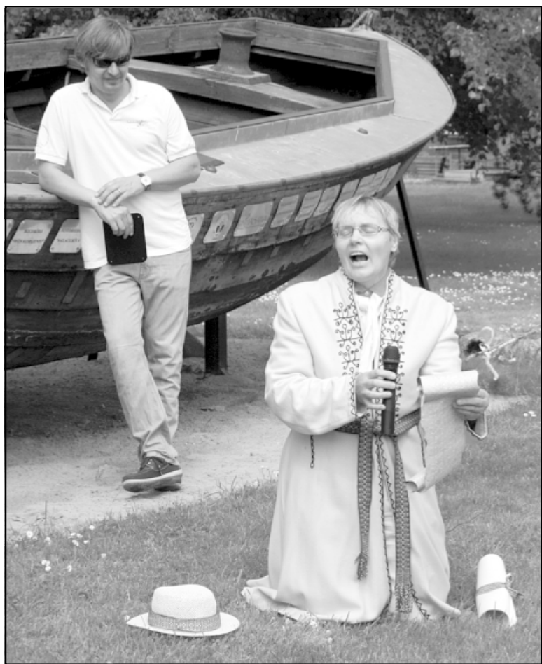
Ķenča lūgšanu uzklausa ne tikai novada domes priekšsēdētājs...

Jau trešo gadu reizē ar Vasarsvētkiem Salacgrīvā svin novada Biedrību dienu. Tad kopā sanāk novadā no jauna dibinātās un jau esošās biedrības, savstarpēji iepazīstas, stāsta par padarīto, dalās pieredzē un plāno nākotni.