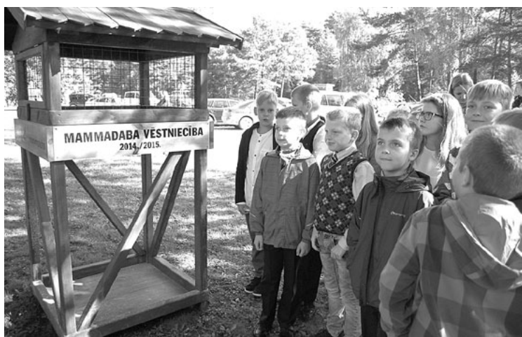
Salacgrīvas vidusskolas skolēni pie putnu barotavas, kas uzstādīta skolas tuvumā

Lolita Valaņina, Salacgrīvas vidusskolas skolotāja