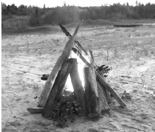
Ainažnieku iedegtais uguns-kurs deva gaismu un siltumu līdz pat agram nākamās dienas rītam