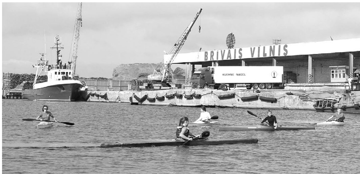
Salacgrīvas kausa pretendenti pirms starta

13. septembrī Salacas upē Salacgrīvā kā ik gadu notika sacensības smailošanā un kanoe airēšanā Salacgrīvas kausā . Tajās piedalījās Limbažu un Salacgrīvas sporta skolas jaunie airētāji. Daudzi dalībnieki bija vecumā no 8 līdz 12 gadiem.