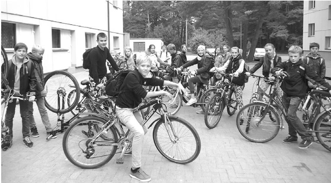
6.b klases skolēniem mērķis ir skaidrs - Kraukļi!