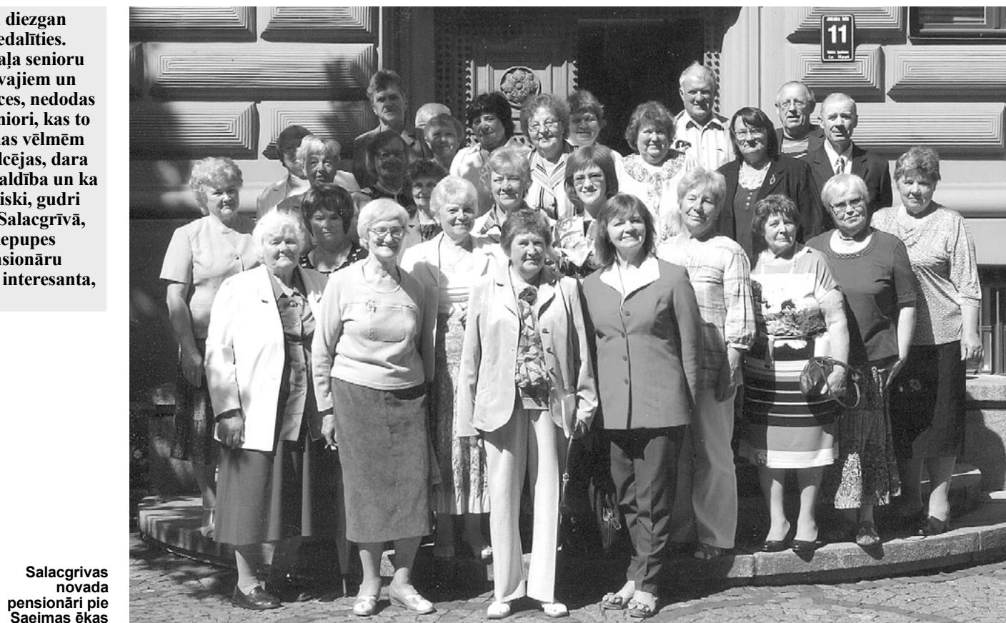
Salacgrīvas novada pensionāri pie Saeimas ēkas

Atstājot Saeimas namu, nofotografējāmies uz ieejas kāpnēm un devāmies uz Latvijas Televīziju. Pazīstamais, daudzkārt medijos redzētais ēkas apveids, plašās telpas, studijas ar augsto griestu krēslā manāmām prožektoru virtenēm un kamerām, kas gatavas darbam... Dažu iecienītu raidījumu dekorācijas studijā liekas itin niecīgas un neizteiksmīgas. Šeit veido raidījumus 100 g kultūras , Sastrēgumstunda , Panorāma u.c. Neliela raidījuma galviņa , neliels galds un daži krēsli, bet visu pārējo - attēla plašumu un dziļumu, gaismu un krāsu rotaļas - panāk ar optisko ierīču palīdzību. Apskatījām pirmās TV raidījumu uzņemšanas iekārtas - smagas un grūti pārvietojamas, pirmos televizorus ar niecīgiem ekrāniņiem. Lai attēlu padarītu lielāku, tiem priekšpusē novietots stikla rezervuārs ar ūdeni vai liela lēca. Bija daudz tādu televizoru, kādus atceramies redzējuši savā jaunībā. Nu tie te glabājas kā muzejiska vērtība par izbrīnu mūsu mazbērniem, kuri jau pieraduši vērot planos lielformāta plazmas ekrānus.