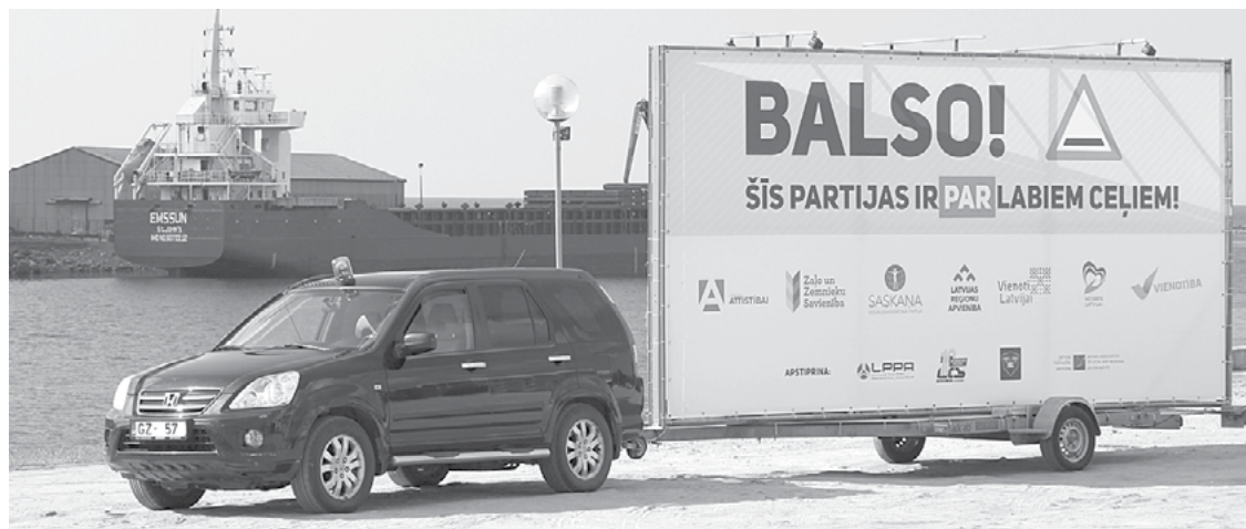
Uz neilgu brīdi mobilās reklāmas piekabe piestāja Salacgrīvā, Jahtu ostas laukumā