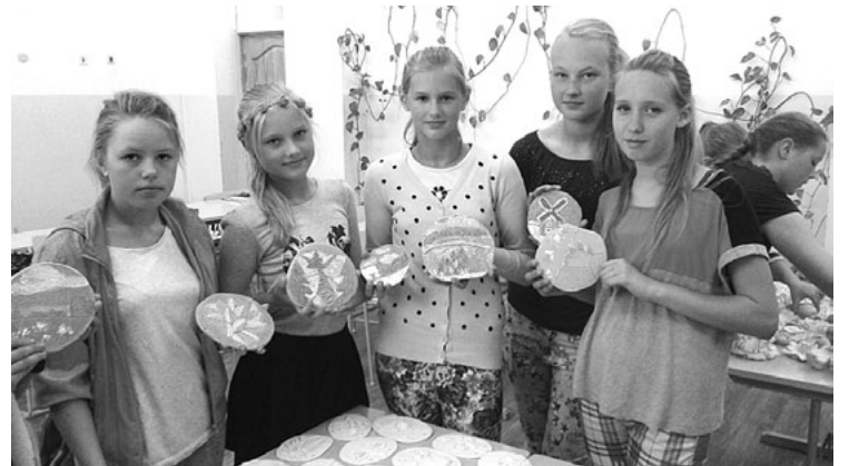
Mākslas skolas audzēknes ar saviem pagājušajā mācību gadā tapušajiem darbiņiem