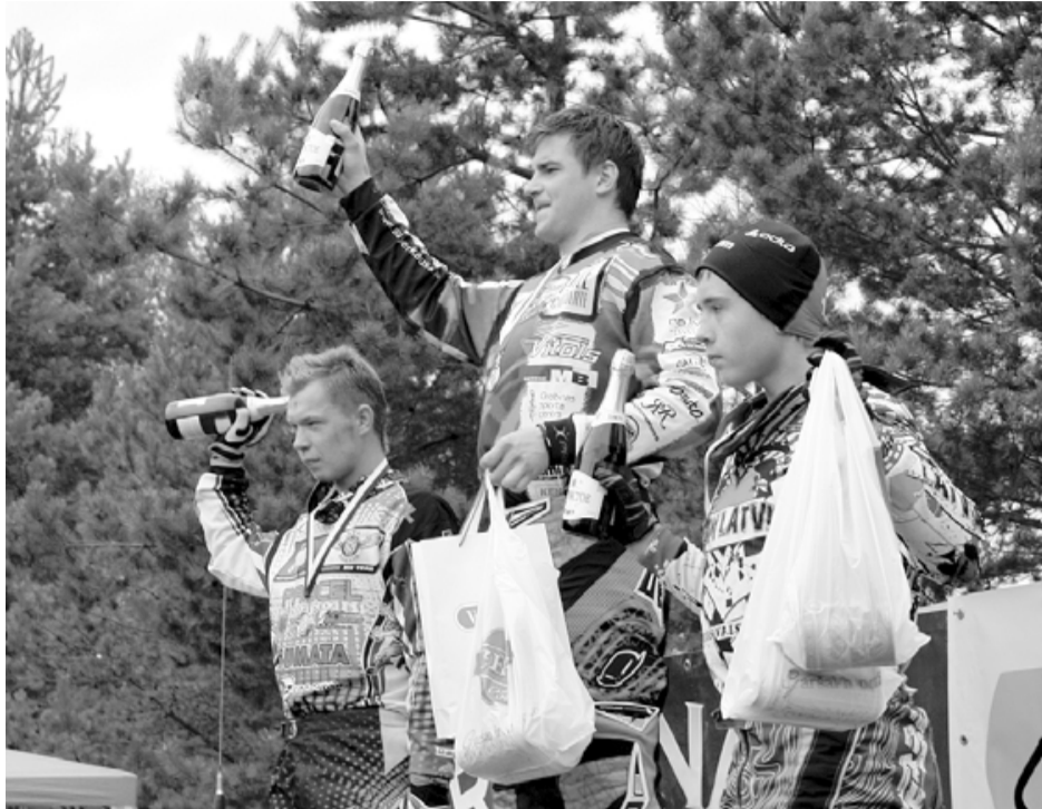
MX1 klases uzvarētāji

22. septembrī Adināju mototrasē notika biedrības Superaktīvs organizētais m-trase.lv priekšpēdējais (6.) posms motokrosā. Par spīti tam, ka laikapstākļi bija rudenīgi, lietus nelija, un 5 klasēs uz starta stājās 60 dalībnieku.