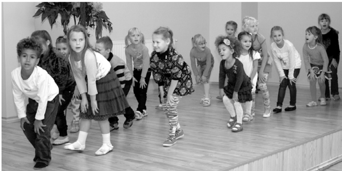
Skatuvi iemēģina mazie dejotāji