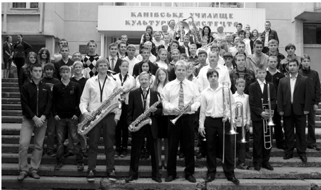
Salacgrīvieši kopā ar Kaņevas kultūras koledžas audzēkņiem un pedagogiem

Pirmdienas rītā kravājam mantas un pošamies uz autobusu, jo nu tas 2 dienas atkal būs mūsu mājas. Kaņevas kultūras un mākslas koledžā mūs sagaida pedagogi un audzēkņi, kuri skolas pagalmā ar līdzdziedāšanu un aplausiem pavada katru spēlētu skaņdarbu. Pēc koncerta mājiniēki – Kaņevas mūzikas un mākslas koledžas pūtēju orķestra vadītājs