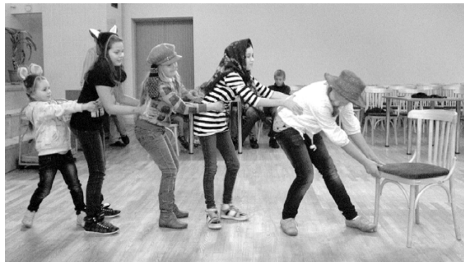
Mazie ainažnieki izspēlēja pasaku par rāceni

Pirms pašas Miķeļdienas Ainažu skolēni pulcējās kultūras namā, lai aktīvi, jautri, radoši pavadītu brīvo laiku, izzinātu Miķeļdienas tradīcijas, ticējumus, paliektos ar saviem interesantajiem atradumiem dārzeņu ražā. Tos izlika izstādē, un 3 interesantāko atnesēji tika pie balvām.