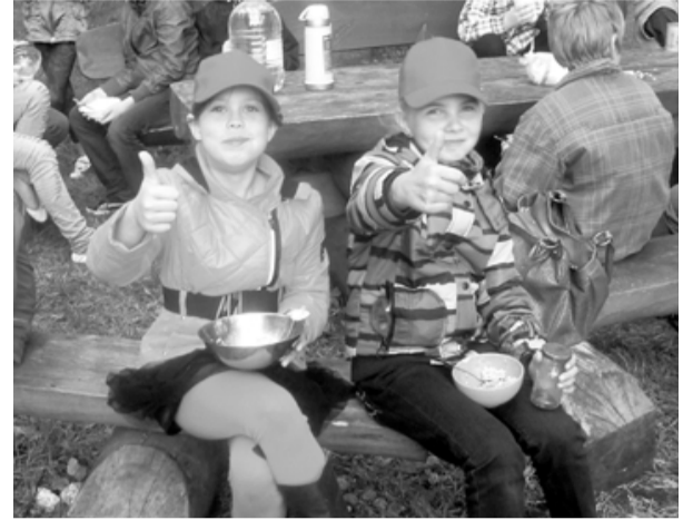
Kas var būt labāks par gardu putru svaigā gaisā pēc labi padarīta darba!

Kārtīga izvingrošanās skolas pagalmā palīdzēja pamosties un sagatavoties Miķeļdienas svinībām