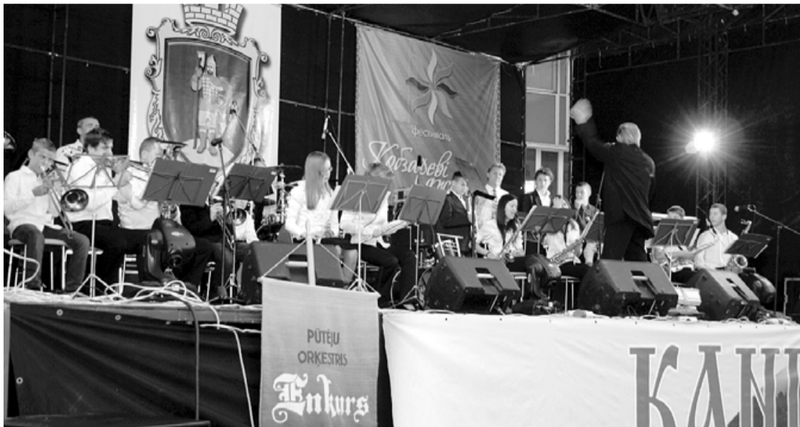
Enkurs uzstājas Kaņevas pilsētas svētkos