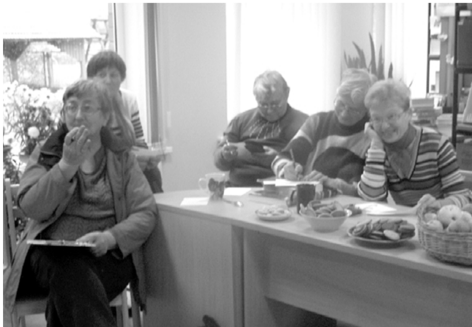
Risinot kopīgo krustvārdu mīklu, jautrība sīta augstu vilni