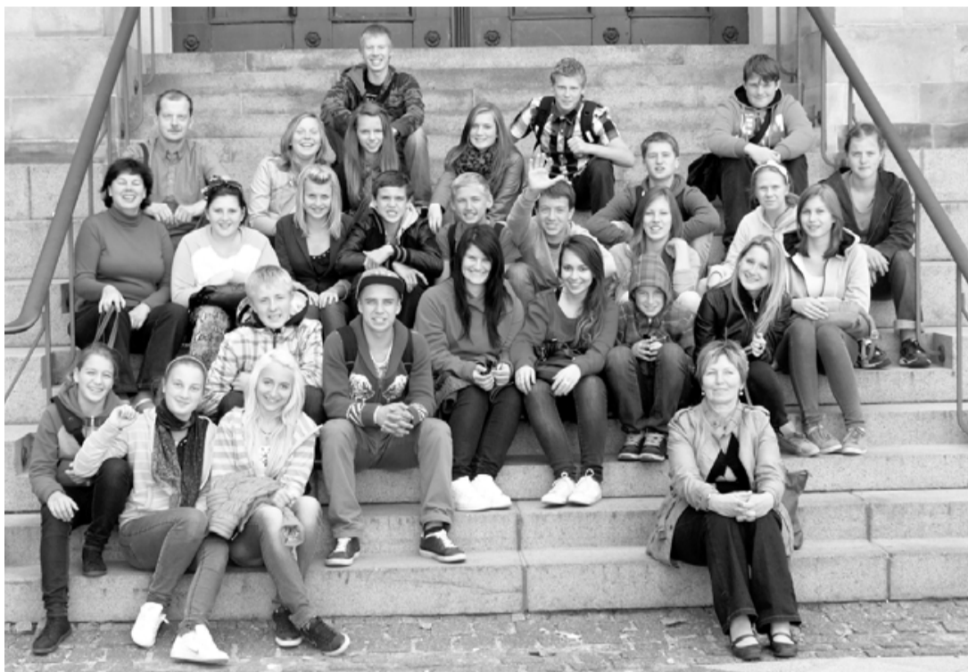
Tādi priecīgi salacgrīvieši atgriezās mājās no Dānijas

Protams, notika arī sportiskas aktivitātes – devāmies braucienā ar velosipēdiem, iepazīnām apkārtni, bija īpaša sporta pēcpusdienā. Apmeklējām zinātnes centru Flensburgā (Vācijas pilsēta 35 km attālumā no mūsu projekta vietas), kur interaktīvā veidā iepazīstina apmeklētājus, kā darbojas dažādi fizikas un matemātikas likumi. Katrs objekts uzdod jautājumu, bet atbildi nesniedz – katram jāizmēģina pašam. Pēdējā dienā kopā cepām picas un izbaudījām vakaru pašvaldībai piederošā Tīņu klubā, dejojot,