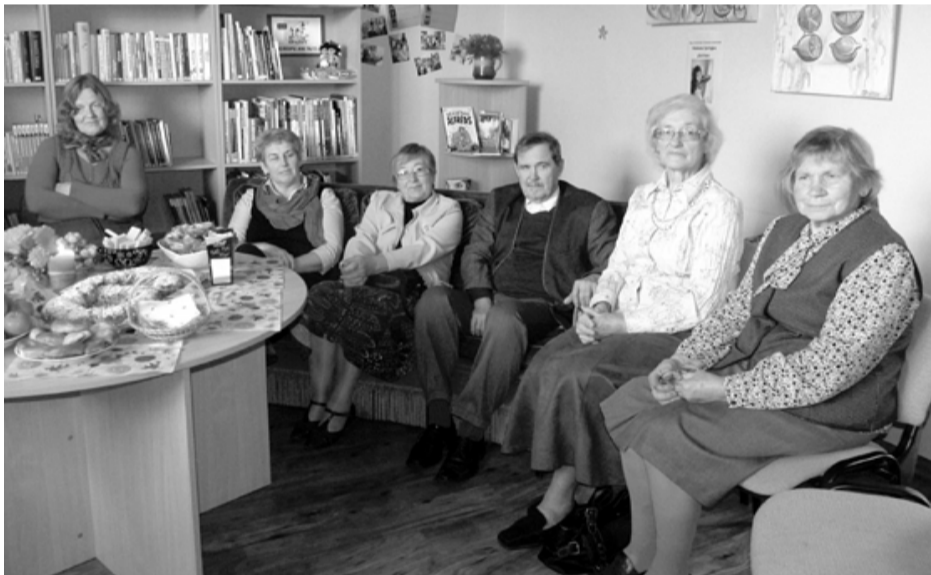
Svētciema bibliotēkā Skolotāju dienu svinēja apkārtnes bijušo skolu pedagogi, kuru ikdienas darba gaitas ar skolu vairs nesaistās

Kā ierasts, ik gadu oktobra pirmajā svētdienā svinam Skolotāju dienu. Jau ierasts, ka skolās par godu tai stundas vada skolēni, pedagogus sveic ar krāšņiem ziediem, tiek plānotas ekskursijas vai teātra izrādes. Svētciemā šie skaistie svētki noritēja bibliotēkā. Uz Atpalredzēšanās pēcpusdienu bija aicināti apkārtnes bijušo skolu skolotāji, kuru ikdienas gaitas ar skolu vairs nesaistās.