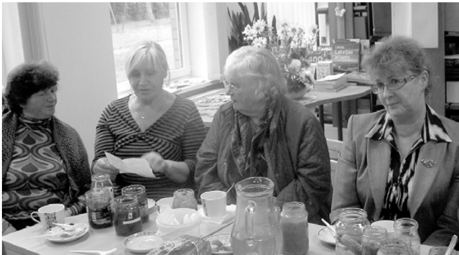
Rudens ballītē netrūka pašu korģeniešu sarūpēto gardumu ziemei. Par receptēm varat interesēties Korģenes bibliotēkā

22. septembra pievakarē, kad vēl skaitījās vasara, Korģenes bibliotēkā sanāca gan lieli, gan mazi, lai sagaidītu astronomisko rudeni jaukā kompānijā.