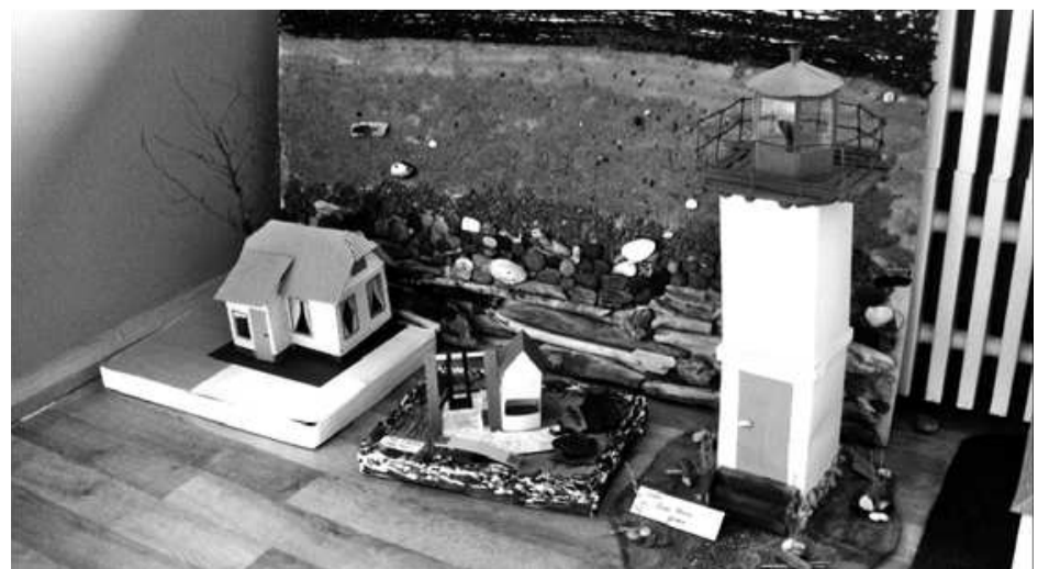
Vilnīša audzēkņu un viņu vecāku veidotās izstādes Mana Salacgrīva eksponātus var apskatīt arī tagad