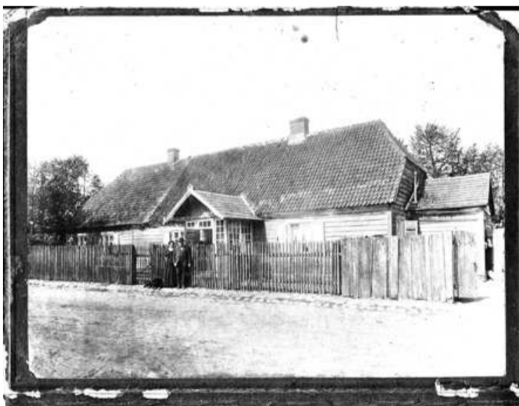
Nams celts 19. gs. beigās vai 20. gs. sākumā un saukts īpašnieka vārdā – par Anšmītu māju. Redzams, ka tolaik jumta klājums daļēji bijis no dakstiņiem. Fotogrāfijā redzams pats īpašnieks tirgotājs Rihards Anšmīts un viņa 25 gadus jaunākā kundze Emma. Anšmīti 1917. gadā aizbrauca uz Pēterburgu