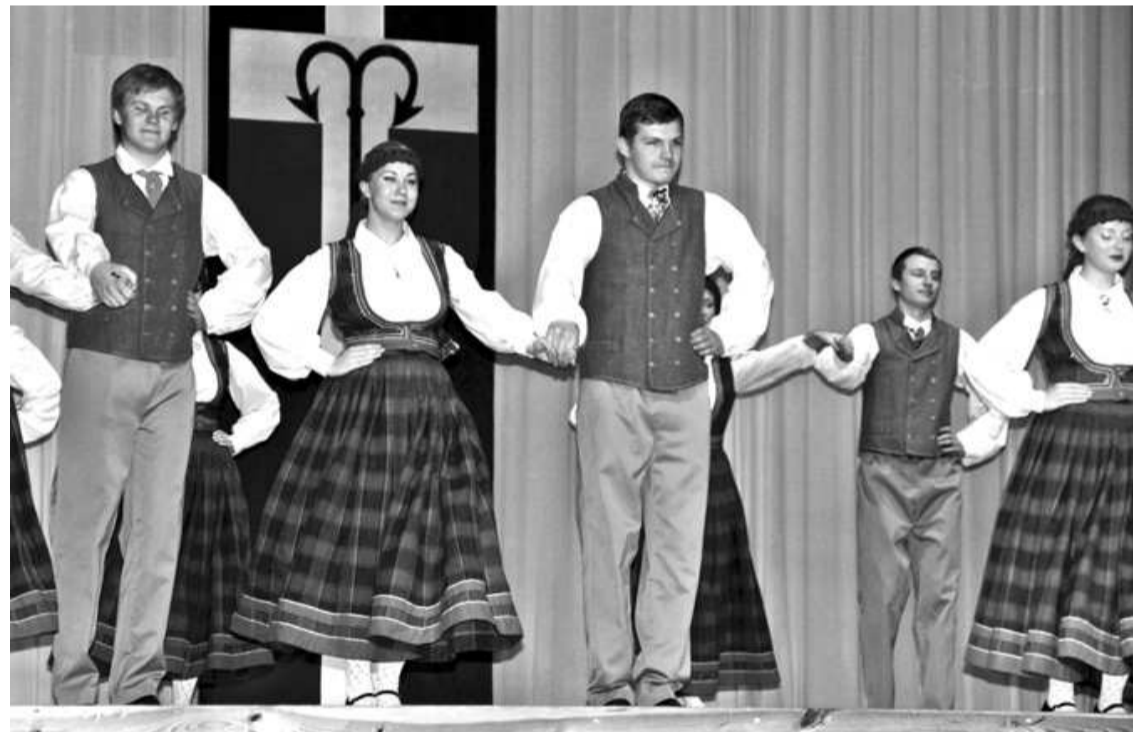
Savējo pašdarbības kolektīvu koncerts radīja lepnumu un patiesu svētku sajūtu

Neraugoties uz svinīgo un jauko gaisotni, pasākumam ilgu laiku pietrūka tāda kā punkta uz i. Visiem bija zināms, ka tovar godinās Salacgrīvas Goda pilsoni Nr. 3, bet tas nenotika un nenotika. Tiesa, koncerta vadītājs jau bija brīdinājis par godināmā ķibelēm ar lidojumu. Un tā gluži neordināri sanāca, ka īpaši svinī-