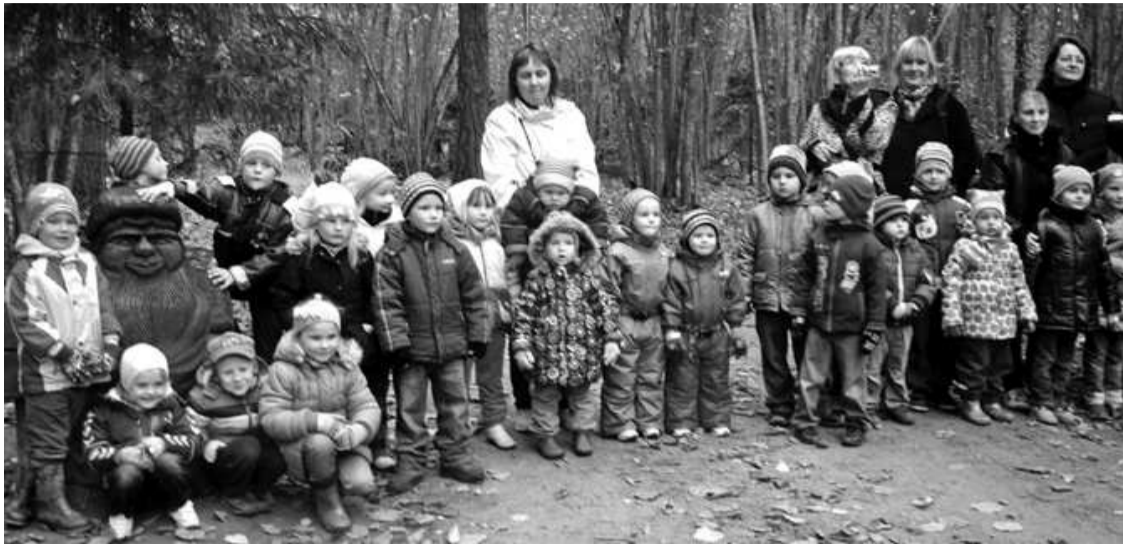
Svētciema mazie snīpi un snīpēni Tērvetē

Lai gan ārā jau rudens un laiks visai nemīlīgs, PII Vilnītis Svētciema filiāles Snīpi un Snīpēni 17. oktobra rītā uz bērnu dārzu nāca ļoti priecīgi, jo beidzot bija klāt ilgi gaidītā ekskursija.