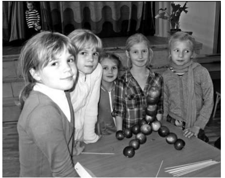
3. vietas ieguvējas, komandas Ābolīši dalībnieces, ir apmierinātas ar paveikto

Rudentiņi, bagāts vīrs, Daudz tu mums dāvināji: Pilnas klētis labībiņas, Pilnas ķešas sudrabiņa.