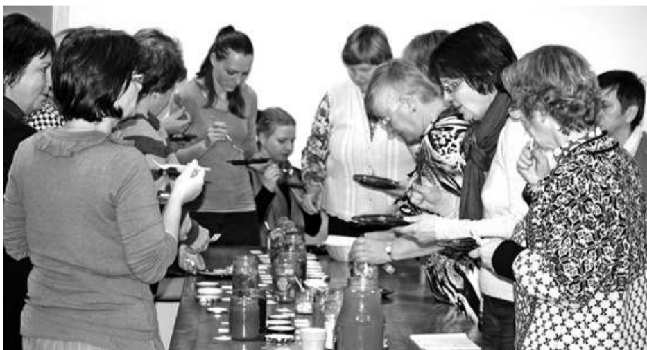
Gan saldo, gan sāļo konservējumu un ievārījumu degustēšana notika, minot to sastāvdaļas, domājot interesantus nosaukumus un vērtējot garšīgākos