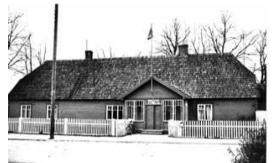
Salacgrīvas darbaļaužu deputātu padomes izpildu komiteja ar sētiņu un Latvijas PSR karogu. 1970. gadi