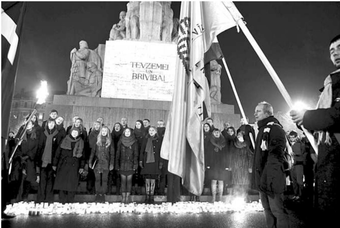
Koris Pernigele un Salacgrīvas puīši dzied pie Brīvības pieminekļa

Šogad 11. novembris mani aizveda uz Rīgu, lai kopā ar Salacgrīvas vidusskolas 12. klases puīšu ansambli un Liepupes jaukto kori Pernigele atzīmētu Lāčplēša dienu galvaspilsētā.