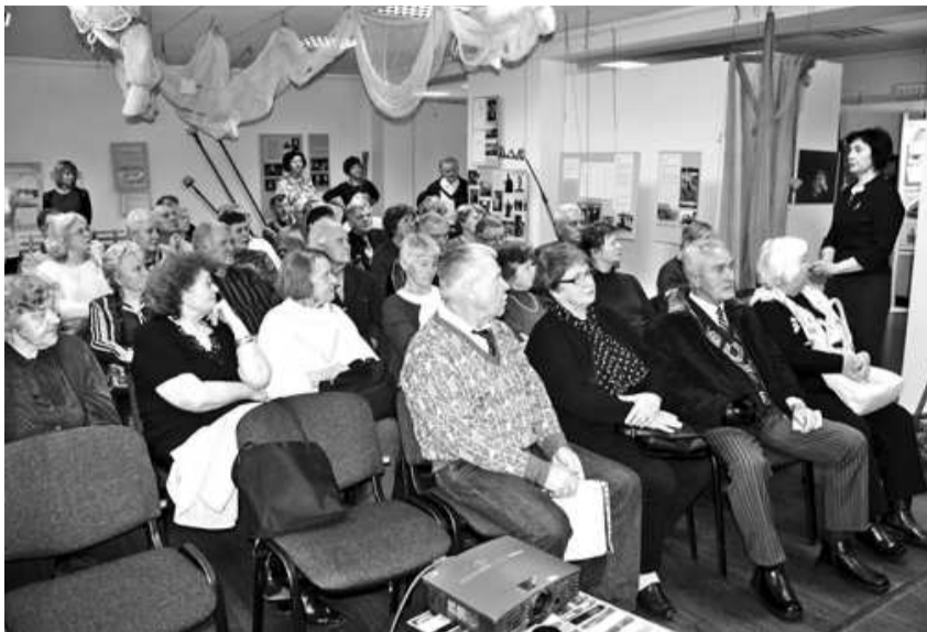
Pēc izstādes apmeklētāji ar lielu interesi noskatījās Gunāra Pieša un Mika Zvirbuļa 1961. gadā veidoto dokumentālo filmu par Salacgrīvu