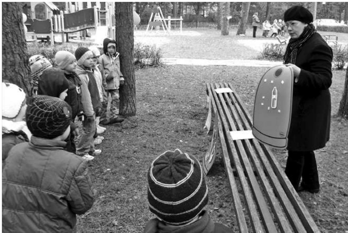
Ekoloģijas pieturā bērni pazina dabai nedraudzīgus objektus un mācījās tos pareizi sašķirot