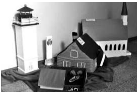
Īpašu interesi svētku dienās izraisīja vecāku un bērnu kopdarbībā tapusi instalāciju izstāde Mana Salacgrīva , kurā skatāmi dažādi pilsētas infrastruktūras objekti