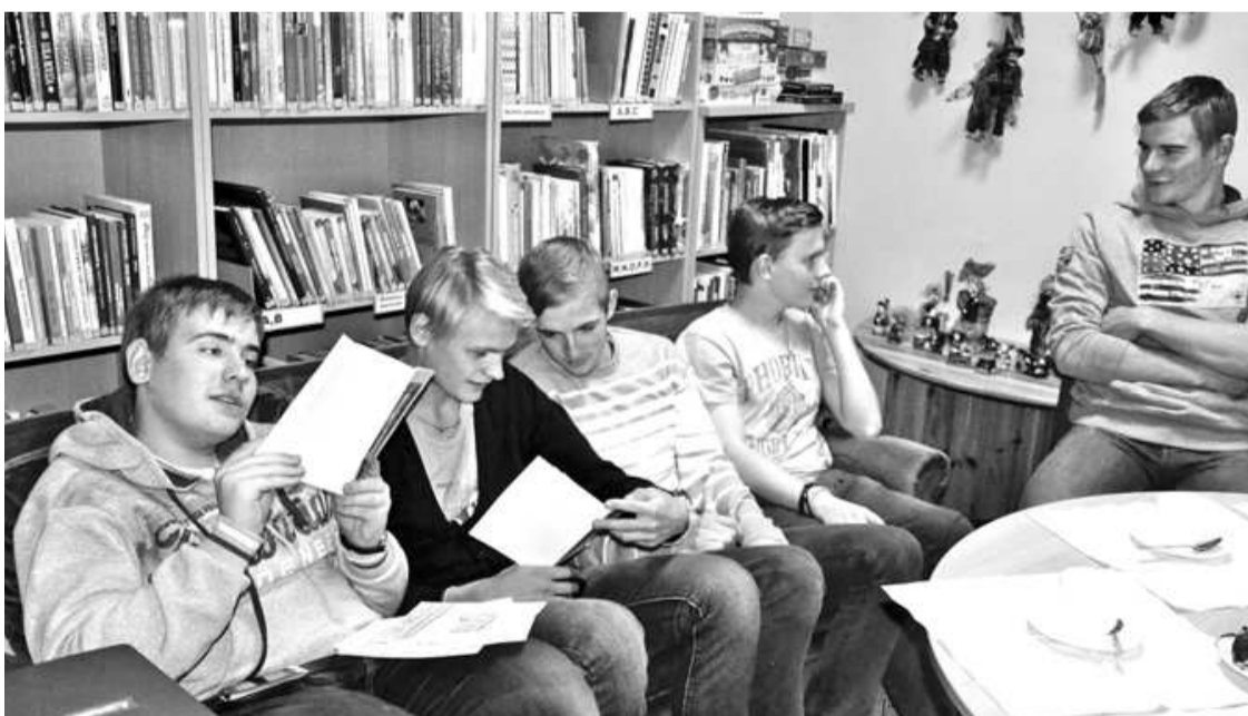
Jaunieši lasīja savus mīļākos dzejoļus - mazāk dzirdētus, dziļdomīgus, arī skeptiskus, ironiskus

Novembri šogad iekrāso ne tikai Latvijas 95. gadadienas sarkanbaltsarkanās krāsas, bet arī dzejnieka O. Vācieša 80 gadu jubileja visdažādākās noskaņās. 13. novembrī, dzejnieka dzimšanas dienā, Svētciena bibliotēkā tika aizdedzinātas svečtes,