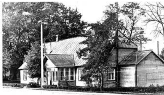
Darbaļaužu deputātu padomes izpildu komiteja 1985. gadā. Tikai šoreiz gaiši krāsota. Pēdējā zināmā ēkas fotogrāfija.