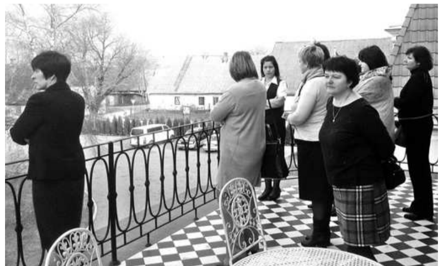
Salacgrīvas novada pedagogi, ciemojoties Liepupē, apskatīja arī Liepupes muižu

Skolēnu rudens brīvdienās skolās neskan zvans uz stundu, no rītiem novada skolu visi loģi nav izgaismoti. Skolās neierasts klusums, bet tas nenozīmē, ka nenotiek nekāda darbošanās. Tur vienkārši neskan skolēnu balsis, bet skolotājiem nav rudens brīvdienu, viņi strādā un izglītojas.