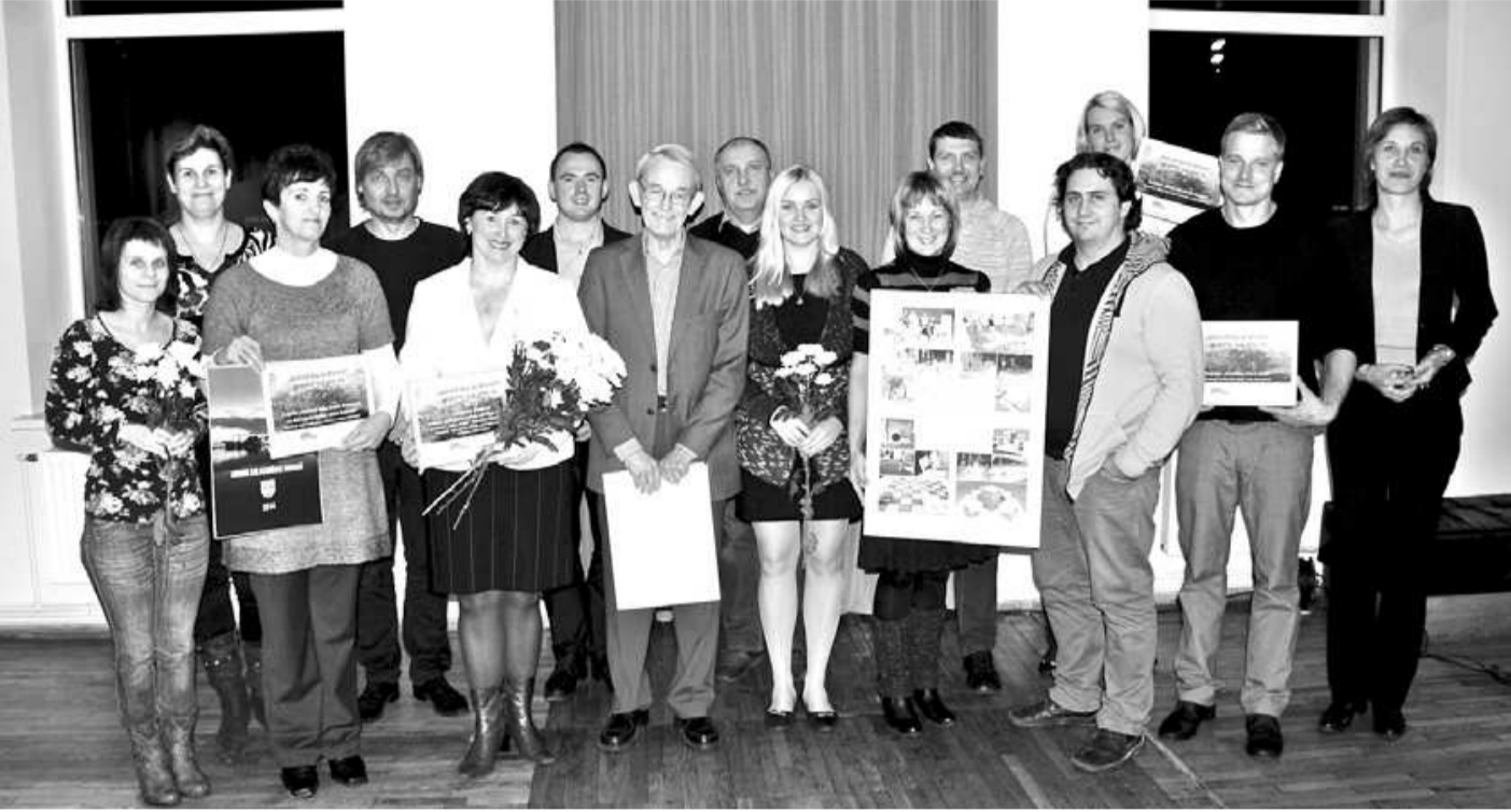
Pēc iepazīšanās ar projektu realizācijas gaitu piemiņai tapa kopbilde - vērtēšanas komisija kopā ar atbalstīto un realizēto projektu iniciatīvas grupu un biedrību pārstāvjiem

22. novembrī Salacgrīvas kultūras namā notika projekta Sabiedrība ar dvēseli noslēguma pasākums. Tajā piedalījās gan vērtēšanas komisija, gan atbalstīto projektu iesniedzēji. Konkurss Sabiedrība ar dvēseli Salacgrīvā norisinājās otro gadu un šogad tā 50% finansējumu nodrošināja nīderlandiešu biedrība Koninklijke Nederlandsche Heidemaatschappij (KNHM) un 50% Salacgrīvas novada dome. Kopējais pieejamais finansējums 1 projekta īstenošanai bija līdz 1000 eiro.