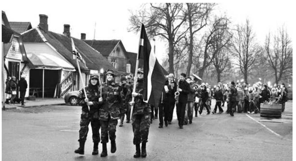
Lāpu gājienā no Bocmaņa laukuma uz Salacgrīvas kapiem