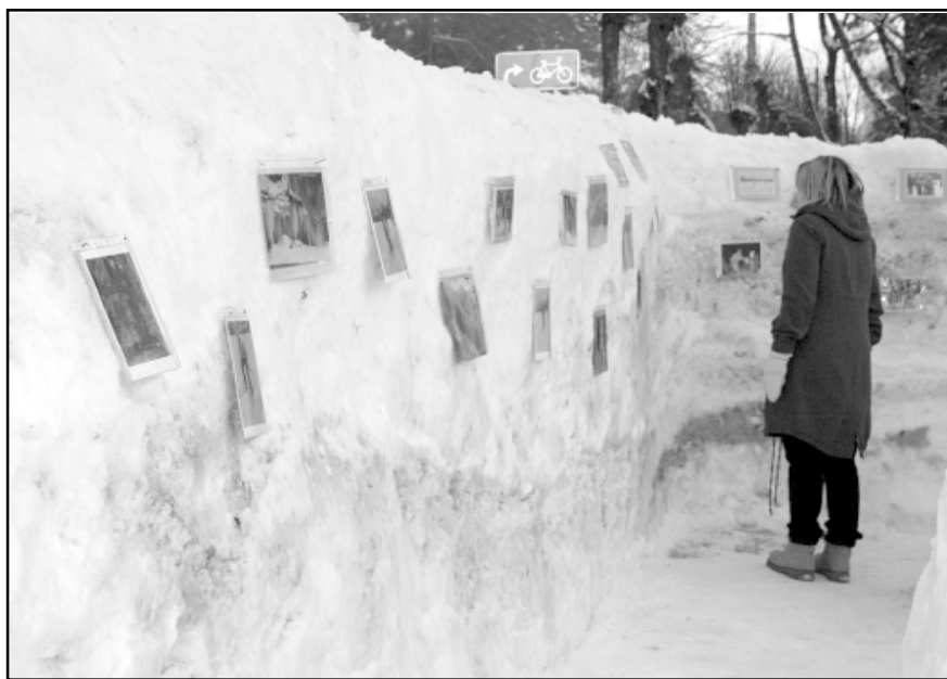
Sniega labirints un tajā skatāmā bilžu galerija pie Ainažu kultūras nama