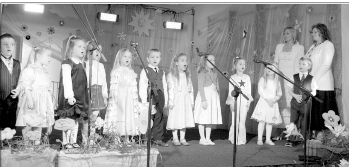
Zaķēnu grupiņas bērni sveic Vilnīti jubilejā