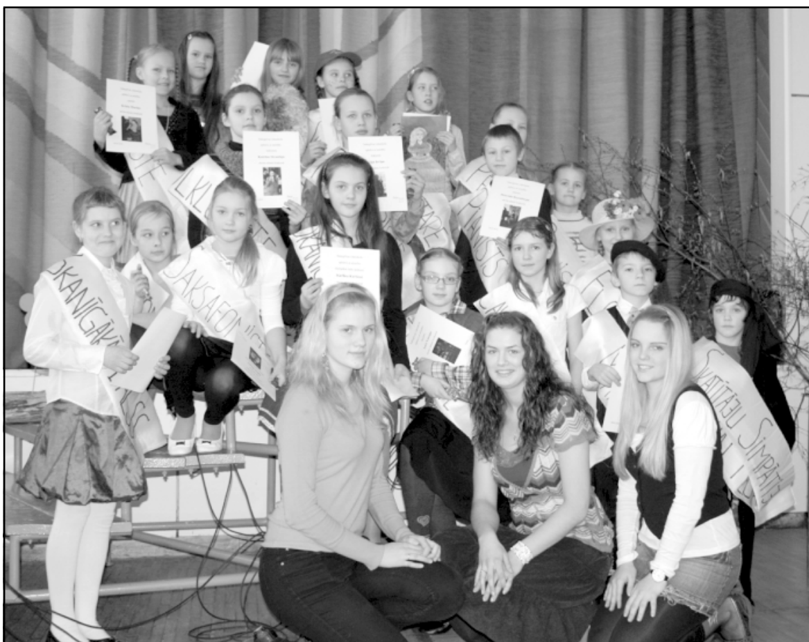
Pēc konkursa tapa kopīgs dalībnieku un vadītāju fotoattēls