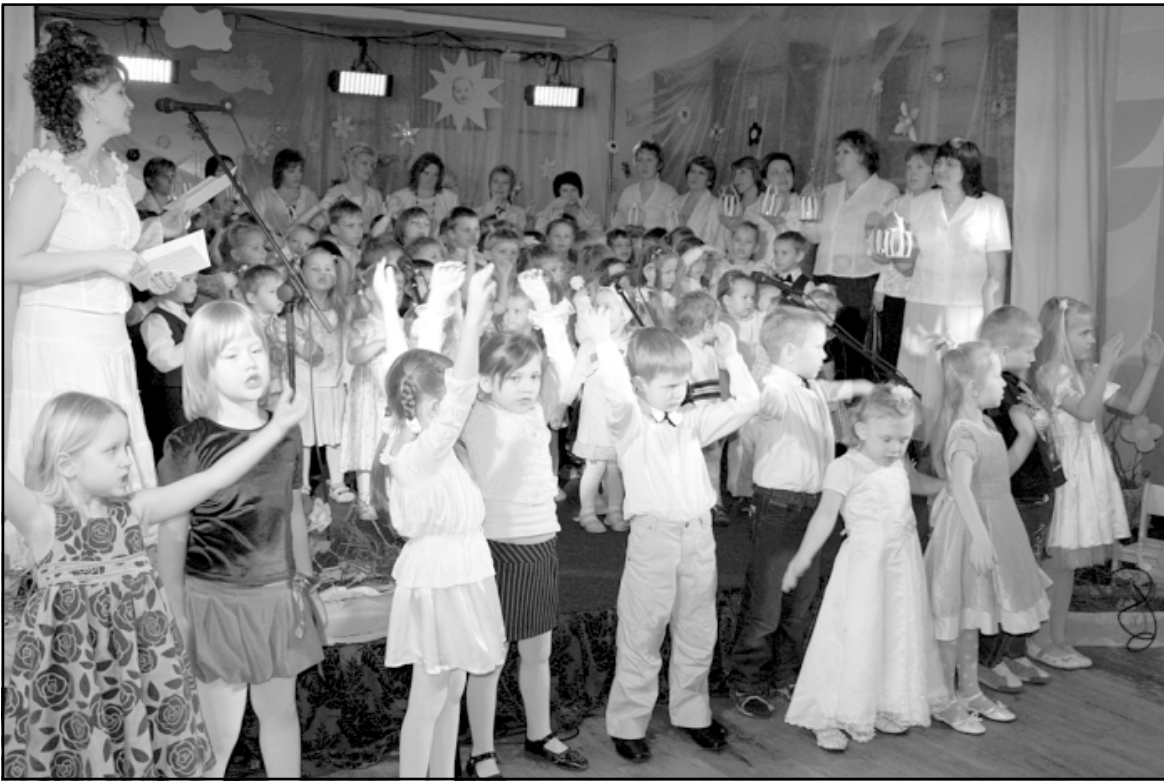
Kopīga dziesma, kopīgi svētki, kopīgs gaišums sirsniņās

Marta otrā nedēļa pirmsskolas izglītības iestādē (PII) Vilnītis pagāja svētku noskaņās.