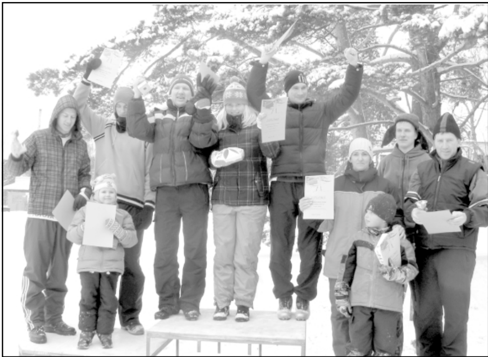
Stafetes uzvarētāju komandas: 1. vietas ieguvēji veiklie Sniega zaķi, komanda Vienalga, kas cīnījās tā, it kā par to tiktu maksāta alga, un 3. vietas laureāti Dūsmīgie bebri, kuri prot ne tikai grauzt, bet arī labai slēpot