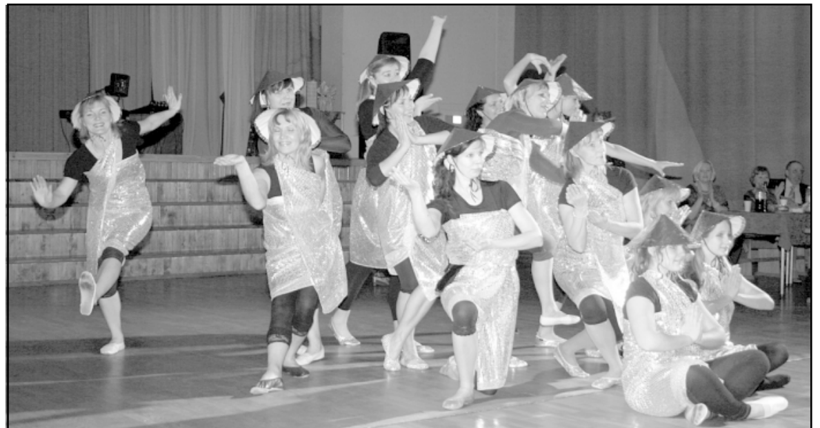
Austrumu deju studijas Hasana deļotājas nupat atgriezušās no ceļojuma nākotnē