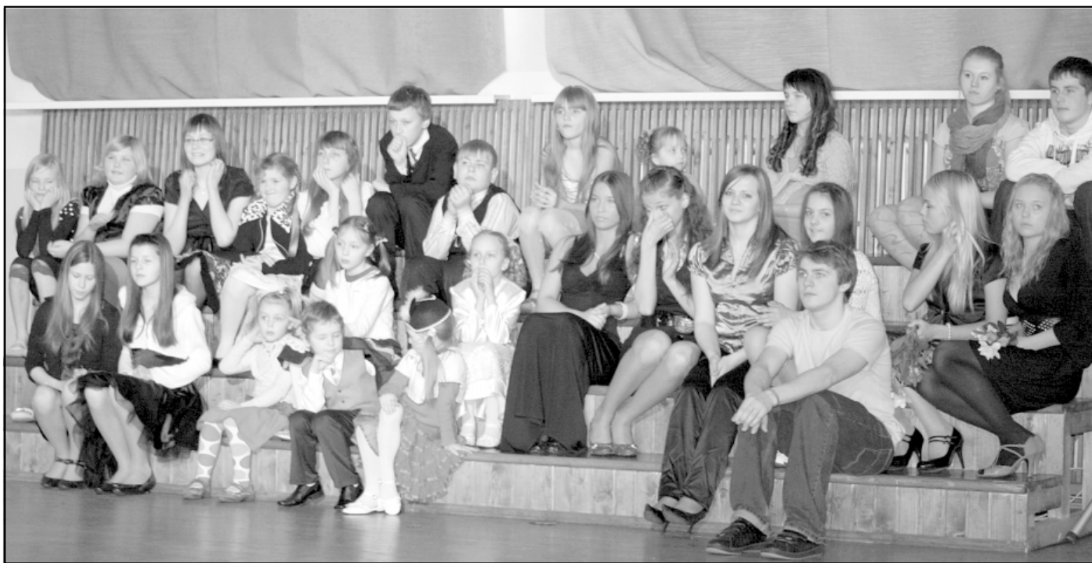
Konkursa dalībnieki pacietīgi gaida žūrijas vērtējumu