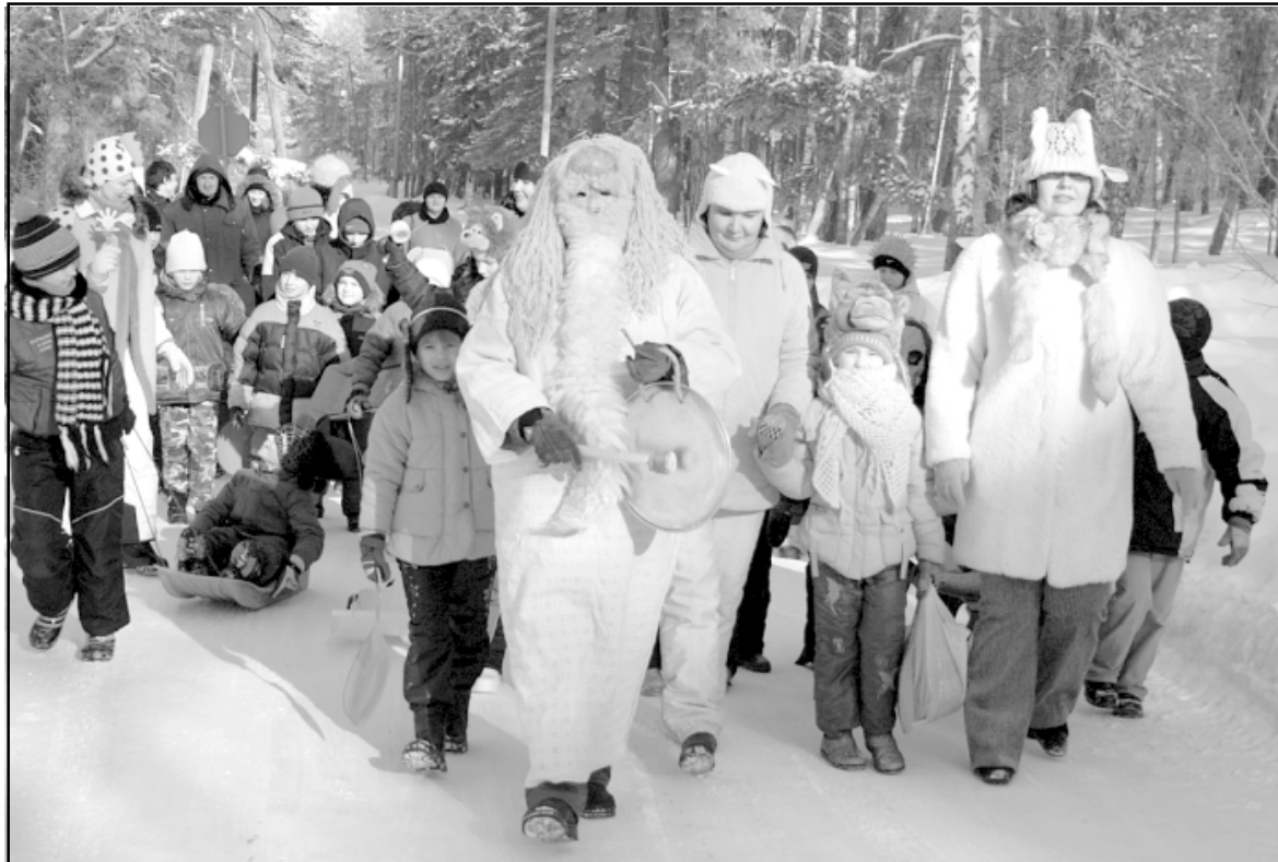
Metēņu dienas gājiens no Ainažu pamatskolas uz kalniņu