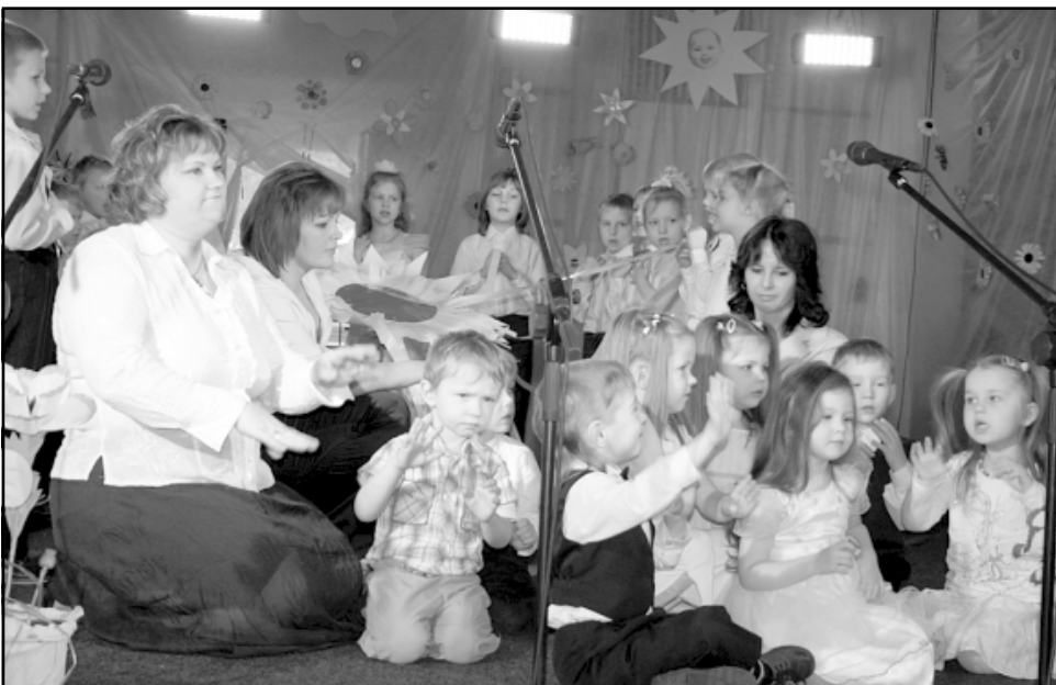
Apsveikums Vilnītīm no mazajiem putnēnu grupiņas bērniem un audzinātājiem