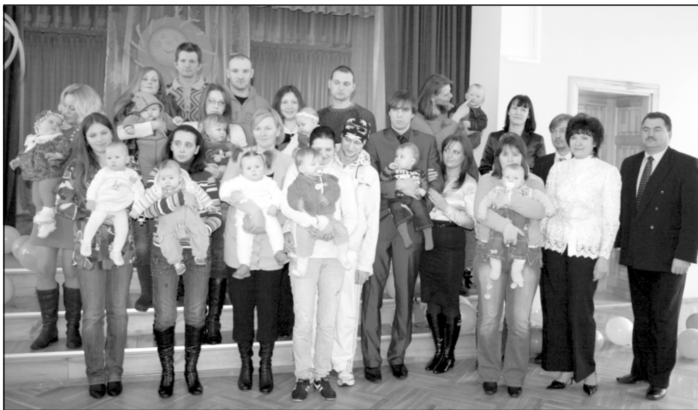
Visi Liepupes mazuļi, viņu vecāki un sveicēji kopīgā bildē

Arī Ainažos, šķiet, visi ir noilgojušies pēc pavasara, tieši tādēļ februāra beigās, kad laiks atmetas siltāks, kultūras namā, ievērojot sentēvu ieražas, tika atzīmēta Meteņdiena. No latviskajām tradīcijām izriet, ka ar šo dienu noslēdzas masķu gājieni no sētas uz sētu, kas sākas Mārtiņos.