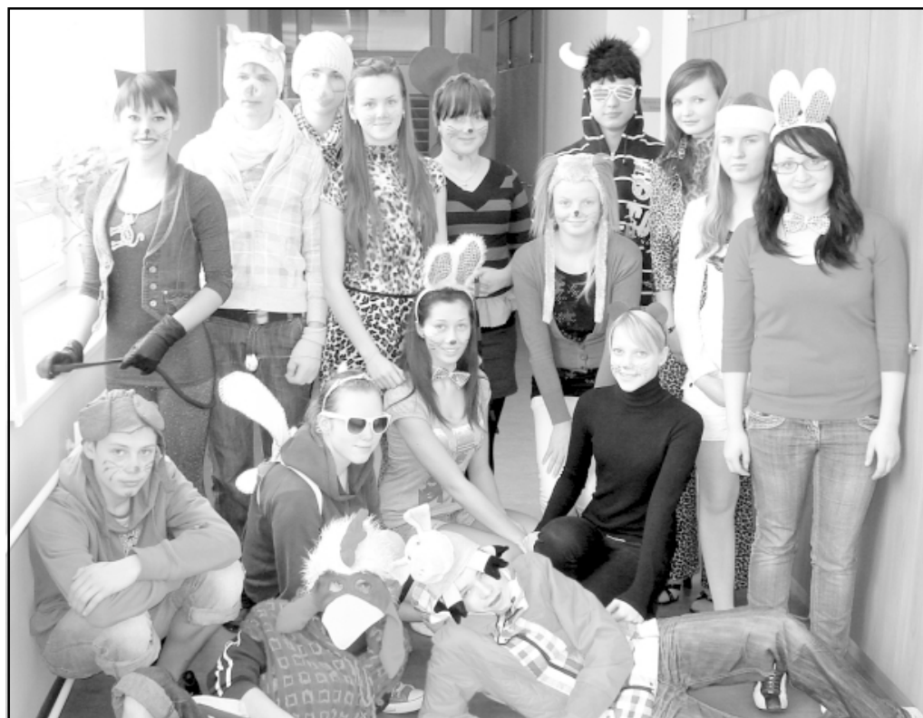
Jautrās nedēļas Zvēru diena Ainažu pamatskolā