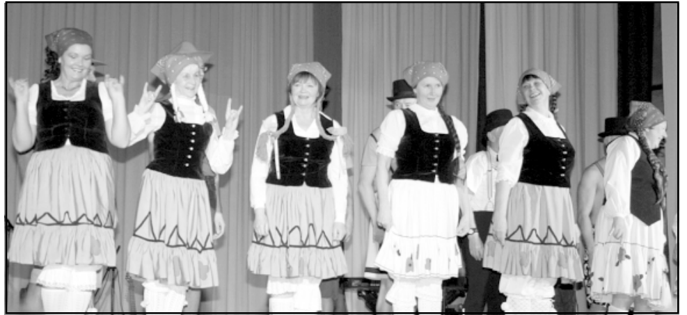
Senioru deju kopa Saiva pēc kārtīgas izceļošanās