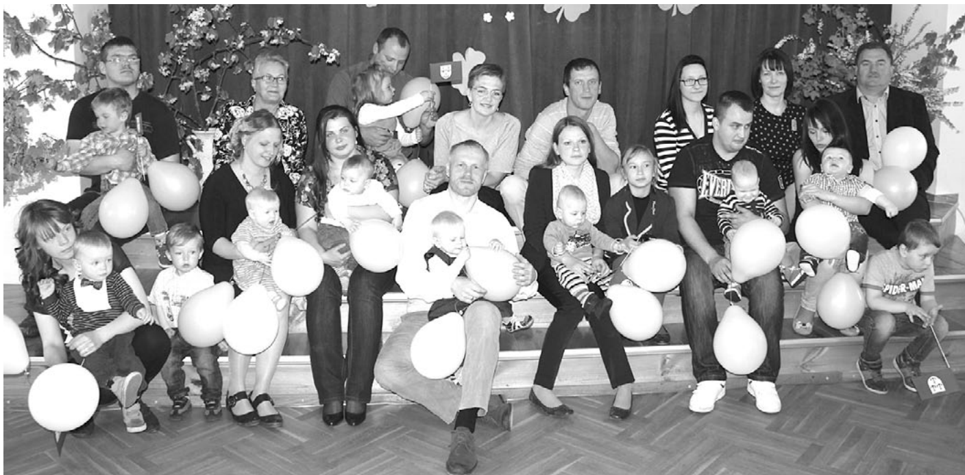
Pēc pasākuma mazie novadnieki Liepupē ar saviem vecākiem kopīgā bildē

Liepupē mazo novadnieku sumināšana notika 16. maijā. Kopā ar mazuļiem, viņu