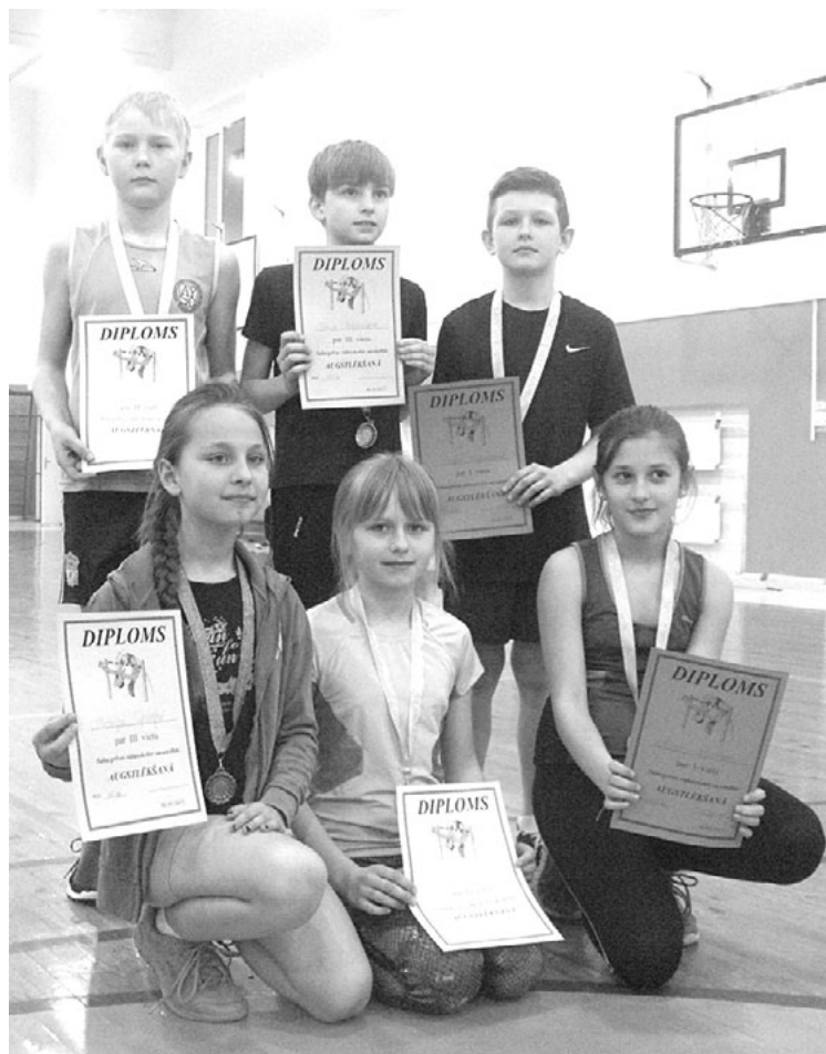
Šajos attēlos tikai daļa no Salacgrīvas vidusskolas augstlēcšanas sacensību uzvarētājiem. Paldies visiem un veiksmi startos!