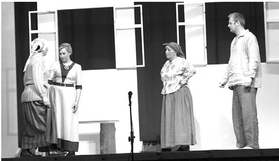
Skats no izrādes Pirkta laime

5. jūnijā Salacgrīvas kultūras namā notika teātra studijas Visa veida versijas iestudētās Elīnas Zālītes lugas Pirkta laime pirmizrāde. Šoreiz izvēlēts nopietns stāsts: - Viņai ir viss laimīgai dzīvei - jauna māja, mīlošs vīrs, stāvoklis sabiedrībā un pārtikusī dzīve, bet pilnai laimei trūkst tikai bērna. Lai iegūtu vēlamu, viņa ir gatava to pirkt par naudu. Bet vai laimi var nopirkt par naudu?