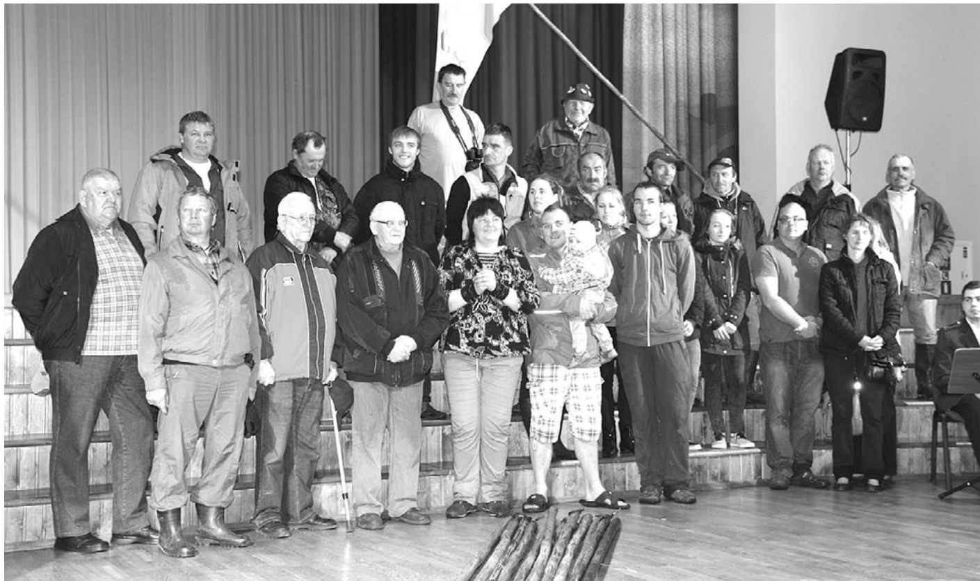
Šoreiz plostnieki tiek sumināti kultūras namā - siltāk un no gaisa nekas nepil virsū...

Jāpiemin, ka rīta pusē līdz pat plostu sagaidīšanai Jahtu laukumā notika amatnieku tirdziņš, kurā muzicēja All Remember , Labi, ka tā , Vecpilsētas dziedātāji un ansamblis Dziedātprieks .