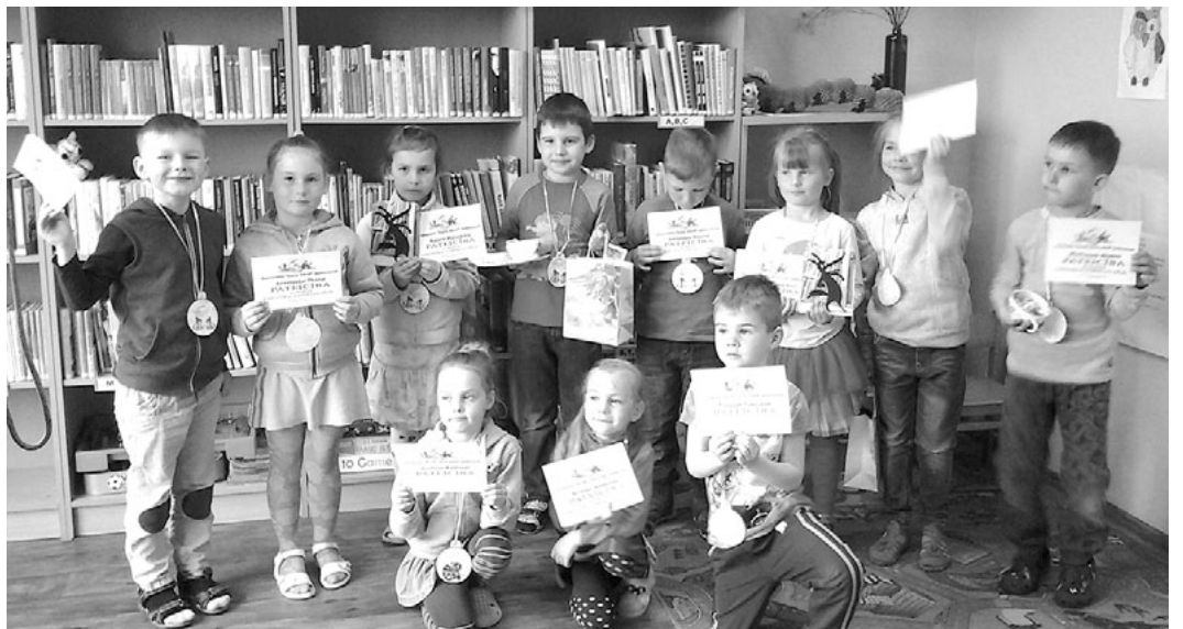
Par dalību otrajās Olimpiskajās spēlēs bērni saņēma ne tikai pateicības rakstus un saldumus, bet arī gandarījumu par savām veiksmēm

Sacensību laikā neiztrūka iepazīšanās arī ar jaunākajām bērnu grāmatām. Vienu - Vilks, kurš izvēlās no grāmatas , arī palasījām. Tā kā šī grāmatiņa iekļauta