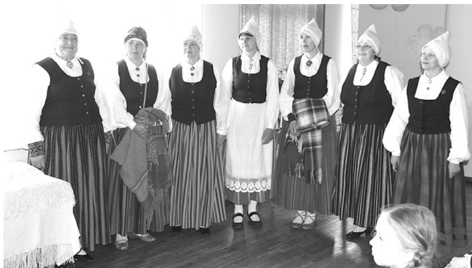
Salacgrīvā arī šogad mazos salacgrīviešus iešūpoja folkloras kopas Cielava dalībnieces