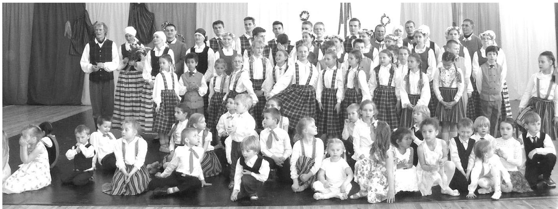
Liepupītes mazie un lielie dejotāji gandarīti par padarīto