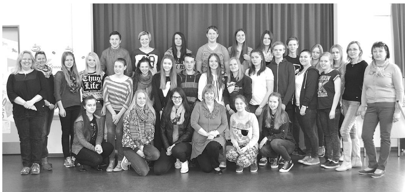
Salacgrīvieši kopā ar Vācijas skolēniem un skolotājiem Handevitā