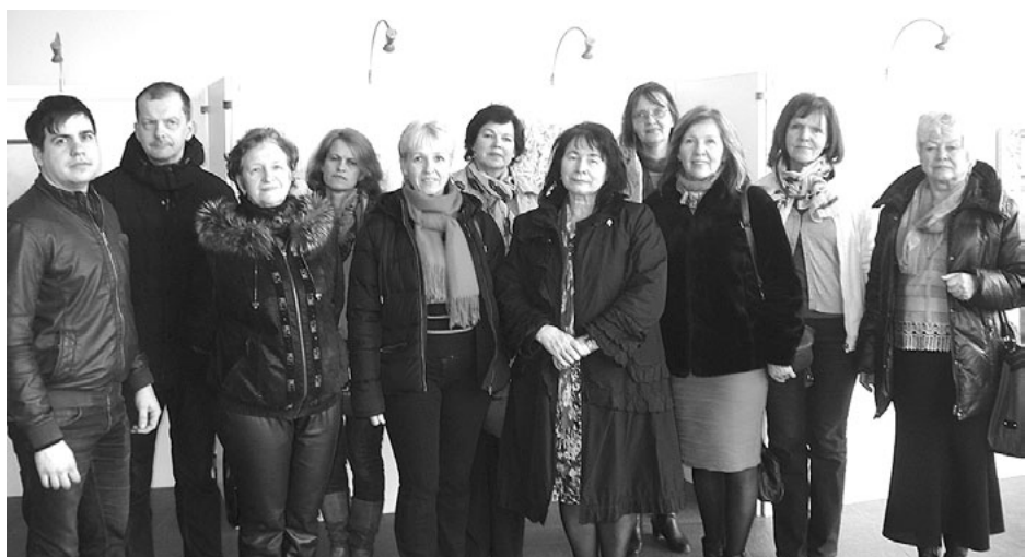
Salacgrīvas novada mūzikas, mājturības un tehnoloģiju un vizuālās mākslas skolotāji Latgales vēstniecībā Gors