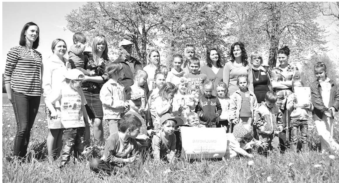
Nominācijā Vislielākais savāktais bateriju daudzums uz vienu audzēkni balvu saņēma PII Vilnītis Svētciema filiāles audzēkņi. Kopā Snīpu un Snīpīšu bērni un pieaugušie savāca 458 kg bateriju

Paralēli radošajām darbnīcām, konkursiem un citām aktivitātēm, apmeklētājus priecēja Ralfs Eilands, grupa Musiqq un Jānis Lūsēns, kā arī bērnu un jauniešu vo-