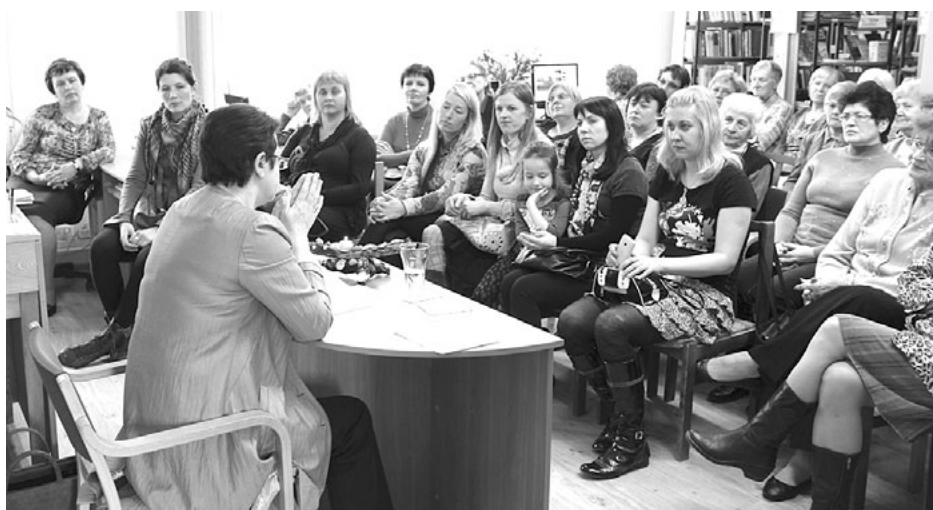
Tikšanās ar dzejniecei Māru Zālīti Salacgrīvas bibliotēkā bija sirsniņa un pārdomu pilna

Salacgrīvas bibliotēkā Valsts kultūrkapitāla fonda atbalstītā un Latvijas Nacionālās bibliotēkas realizētā projektā Tikšanās Latvijas novadu bibliotēkās Salacgrīvas novadā viesojās dzejniece un publiciste Māra Zālīte. Pēcpusdienā dzejniece apmeklēja skolu un tikās ar skolēniem un skolotājiem, bet jau vakarpusē viņa gaidīja dzejas cienītāji Salacgrīvas bibliotēkā. Interesentu bija tik daudz, ka lasītavā nebija brīvu vietu un sanākušie ar nepacietību gaidīja tikšanos.