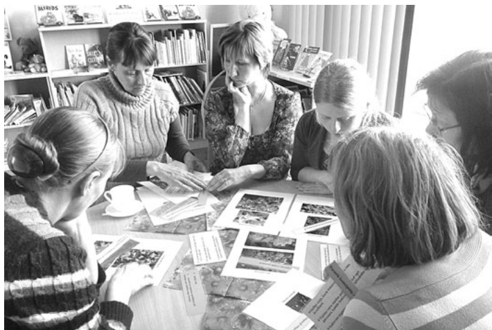
Šoreiz tika iepazīti pļavas augi