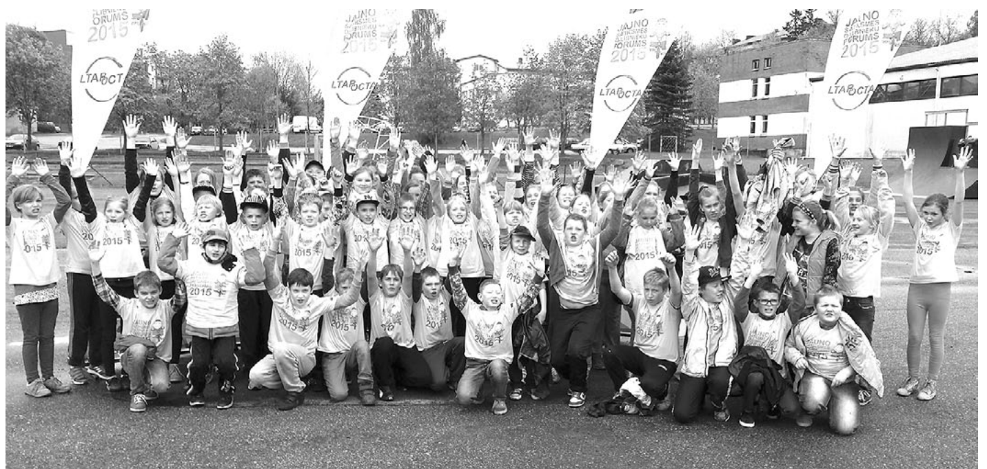
Ainažnieki jauno satiksmes dalībnieku forumā Limbažos

21. maijā Limbažos norisinājās Ceļu satiksmes drošības direkcijas (CSDD) rīkotās tradicionālās Jauno satiksmes dalībnieku foruma pirmās kārtas sacensības. Pavisam tajās piedalījās 11 komandu - 4 no Viļķenes, 2 no Pāles, pa vienai no Lādežera, Vidrižu un Limbažu 3. vidusskolas, tāpat tajās savas zināšanas un prasmes pārbaudīja K. Valdemāra Ainažu pamatskolas 4. un 5. klases skolēni. Visi rādīja savas teorētiskās zināšanas par satiksmes noteikumiem, pirmās palīdzības sniegšanu, velosipēda tehnisko uzbūvi. Bija jāveic arī praktiskās riteņbraukšanas divi posmi. Tiesnesu pienākumus atraktīvi veica Latvijas Sporta pedagoģijas akadēmijas studenti. Kaut laikapstākļi bija nepatīkami, sacensības izvērtās interesantas un aizraujošas.