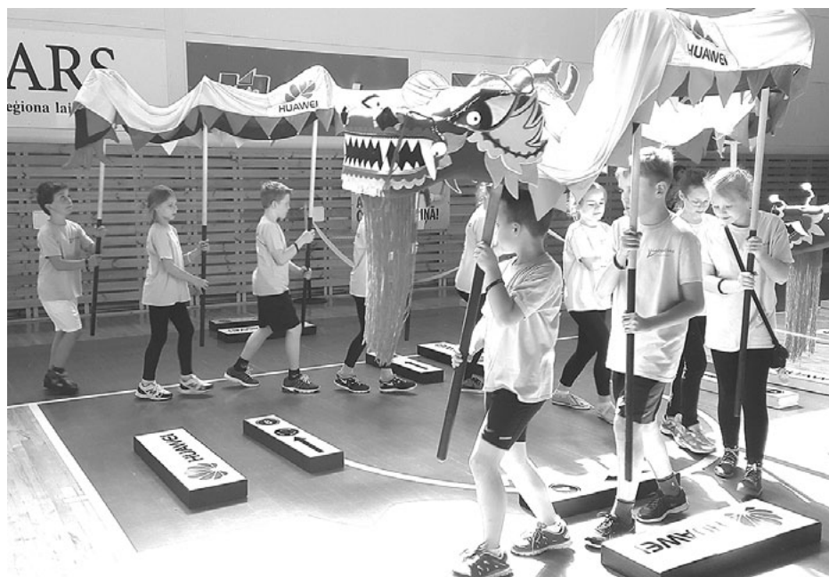
Ar kārtīgu komandas darbu salacgrīvieši izcīnīja vietu finālā

Viss likās ļoti vienkārši - tikai jāizpilda pieteikuma veidlapa, jāizpilda mājasdarbs, kas šogad tas bija par tēmu Mana novada dārgumi , jāpareklamē kāda vieta savā novadā, lai arī citi skolēni no Latvijas par to uzzinātu un gatavais video jānosūta Zelta Zivtiņai . Taču tā vis nebija. Laikapstākļi mūs nelutināja, brīvo brīžu mums ir diezgan maz, jo visi piedalāmies kādā ārpusstundu pulciņā. Nolemām, ka Lielajā piektdienā, spītējot slapjajam sniegam un lietum, brauksim uz novada iecienītāko atpūtas vietu Kraukļi , ko izvēlējamies kā sava novada dārgumu, un filmēsim video mājasdarbam. Viss iznāca ļoti labi - ar scenāriju skolotāja mūs iepazīstināja uz vietas,