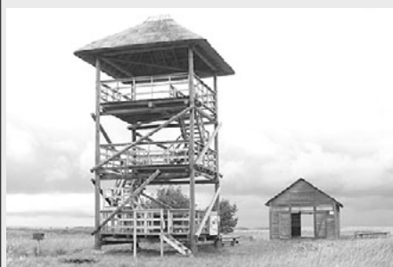
Tāds tagad ir jaunais randu pļavu skatu tornis

Dabas lieguma Randu pļavas dabas takā pēc remonta apmeklētājiem atvērta putnu vērošanas tornis. Tas celts 2006. gadā un tehniskā stāvokļa dēļ tika slēgts no pērnā gada. Šis bija pirmais lielais torņa remonts, kura laikā tas ieguva jaunu, randu pļavu ainavai atbilstošu izskatu. Objekta atjaunošana veikta ar Latvijas vides aizsardzības fonda finansiālu atbalstu pēc vietējās sabiedrības - biedrības Silva Fortis - iniciatīvas.