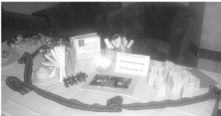
Ilggadējo baleta studijas vadītāju atceroties