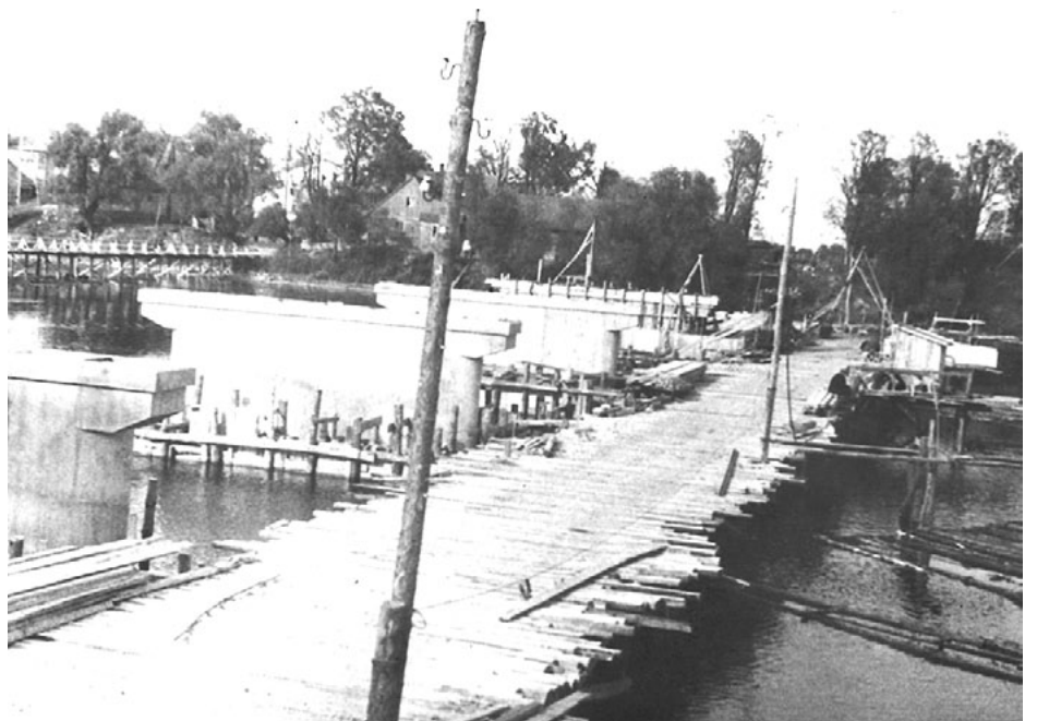
Šajā fotogrāfijā redzami 3 tilti: pagaidu tilts, jaunā tilta balsti un vecais koka tilts