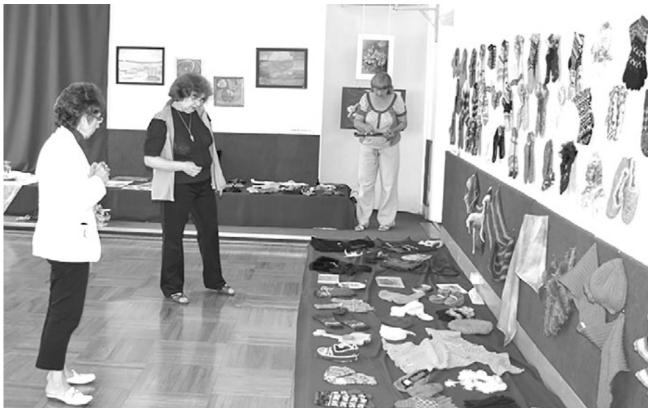
Nodibinājuma Limbažu fonds rīkotā labdarības izstādē arī Salacgrīvas mākslas skolu audzēkņu un pedagogu veidotie darbi