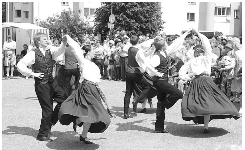
Ansambļa Pērle koncerts Milēt, dejot, atkārtot priecēja skatītājus ar jautrām un krāšņām dejām

Ap vienpadsmitiem vakarā balles starp laukā notika loterija, kurā piedalījās vakara pasākuma ieejas biļetes. Balvās tika izlozētas divas ieejas biļetes uz Positivus festivālu, divritenis no SIA Baltic Forest un galve-