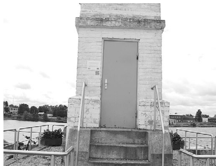
Publiskā interneta pieejas punkti Salacgrīvā, jahtu laukumā un Korģenes bibliotēkā