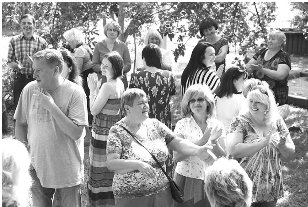
Divu dienu apmācība sākās ar iepazīšanos