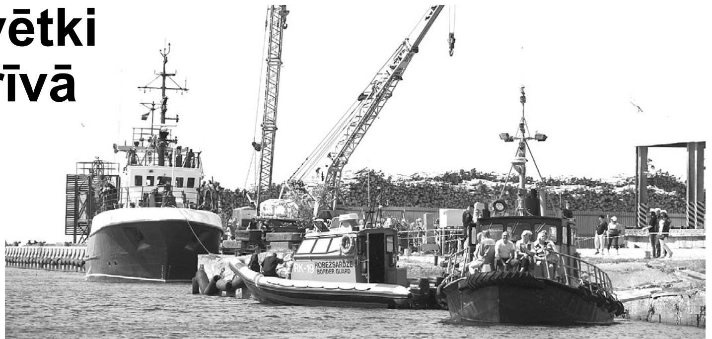
Vizināšanās jūrā ar zvejas kuģiem ir Salacgrīvas jūras svētku neiztrūkstoša tradīcija