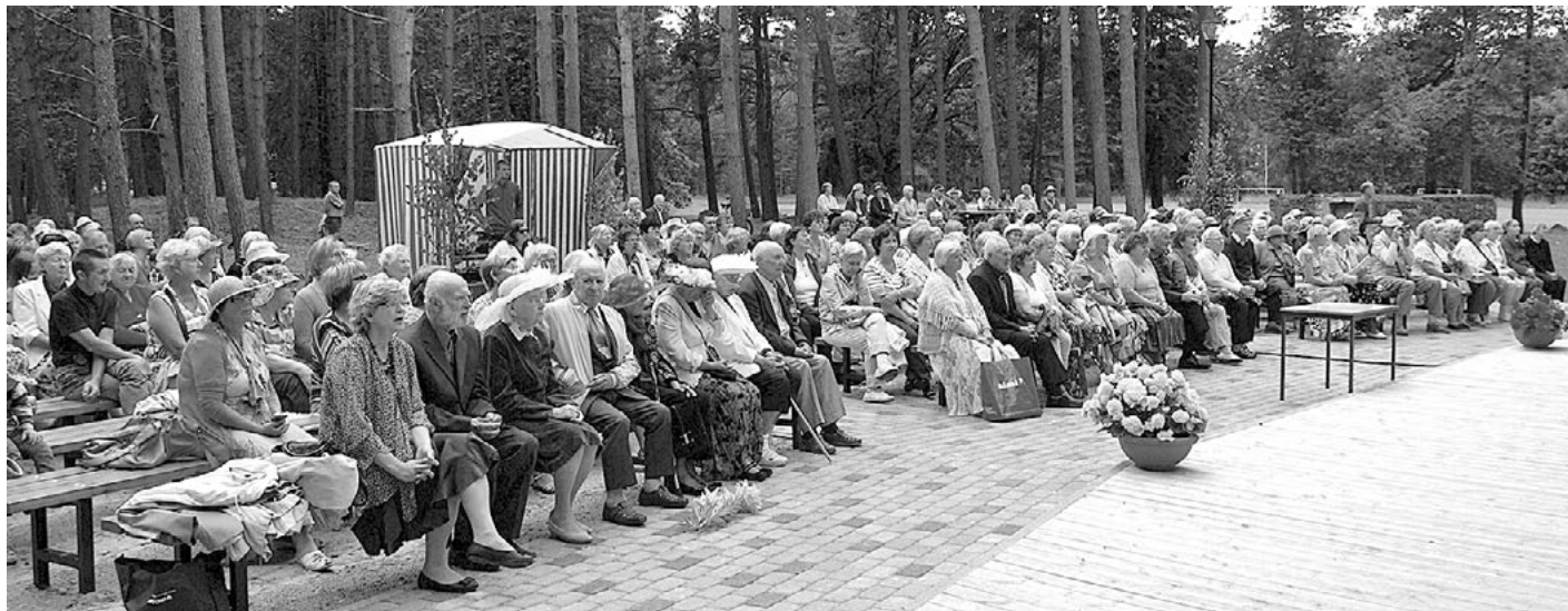
Senioru svētki Ainažos bija kupli apmeklēti. Estrādē valdīja priecīga atkalsatikšanās noskaņa

2. augustā Ainažu estrādē notika Salacgrīvas novada senioru svētki. Tie sākās ar rītarosmi un dažādām jaustrām aktivitātēm sportiskā un radošā garā. Devīzes Lecam pa vecam, lecam pa jaunam! iedvesmotas, sacentās 6 komandas - 5 vietējās un 1 viesu no Rīgas. Lielais stadions, piepalīdzot biedrībai Sprints A , bija sadalīts sektoros, katrā bija iespēja mēroties spēkā, atjautībā un veiklībā, izejot labirintu, makšķerējot, piedaloties stipro skrējienā un darot dažā-