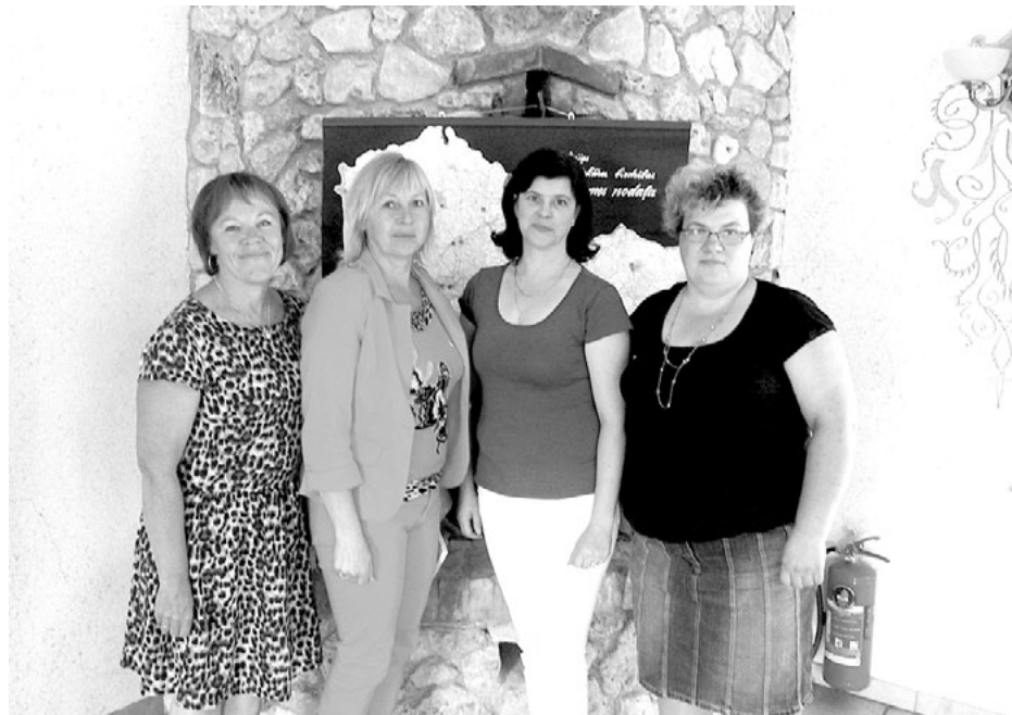
Salacgrīvas novada bibliotekāres no Ainažiem, Korģenes un Svētciema divas dienas pavadīja radošā konferences gaisotnē netālu no Cēsīm - Amatas novada Drabešu pagasta viesu namā Billes