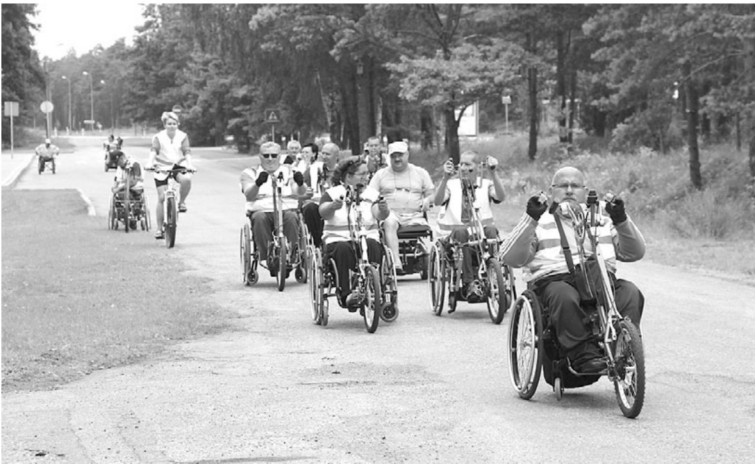
Brauciena dalībnieki Salacgrīvā

No 22. līdz 31. jūlijam Baltijas valstīs notika Lietuvas asociācijas cilvēkiem ar īpašām vajadzībām organizēts brauciens cilvēkiem ratiņkrēslos. Tā mērķis bija, apceļojot Igauniju, Latviju un Lietuvu, skatīties, izmēģināt un pārlicināties, kā tiek ievēroti universālā dizaina principi kultūr- vēstures objektos.