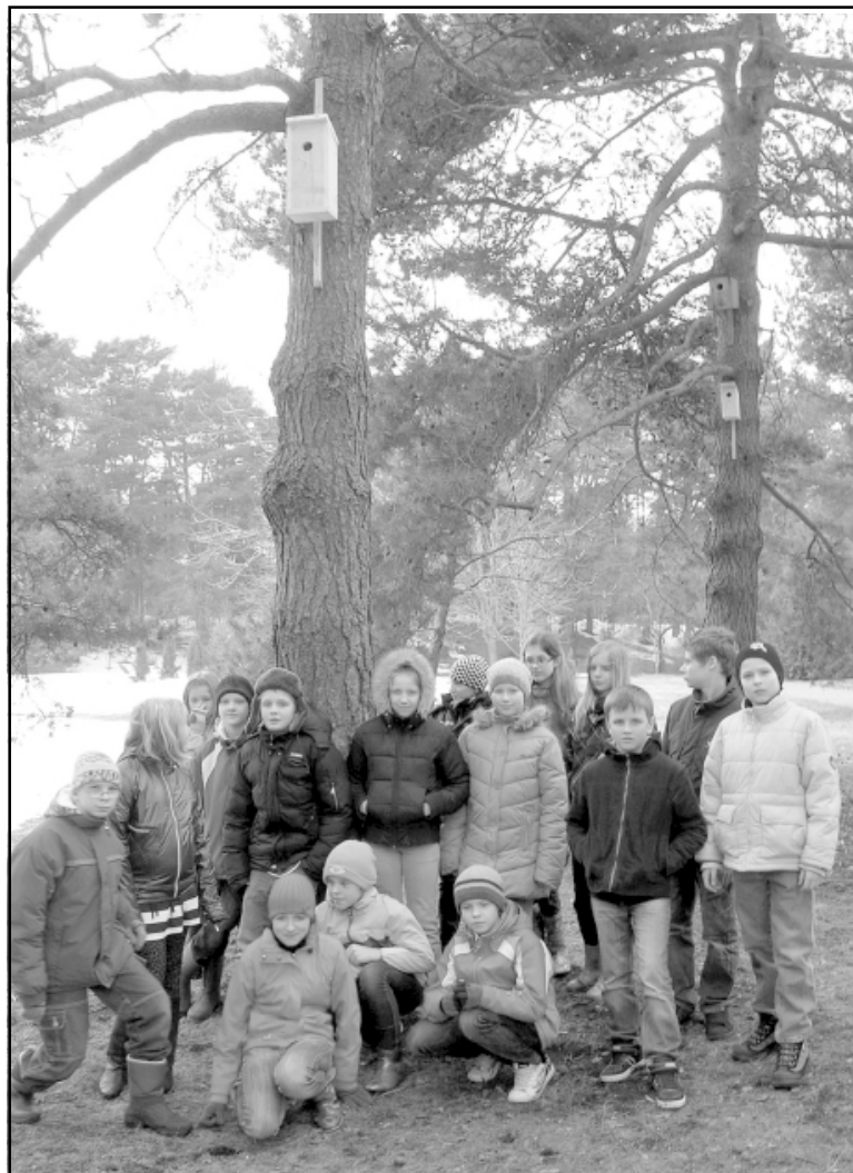
Skolēni ar prieku gaida saimniekus jaunajās mājās