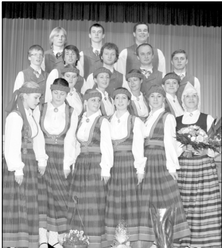
Randas dalībnieki ir priecīgi un apmierināti – tik daudz labu draugu sabraukuši Salacgrīvā

Aprīļa sākumā Salacgrīvas kultūras namā tradicionālajās Lustes dienās pulcējās vidējās paaudzes un jauniešu deju kolektīvi teju no visas Vidzemes - deju kolektīva Randa draugi, ar kuriem izveidojusies cieša sadarbība jau vairāku gadu garumā. Jautrajai draugu kopai piepulcējās arvien jauni kolektīvi no visas Latvijas.