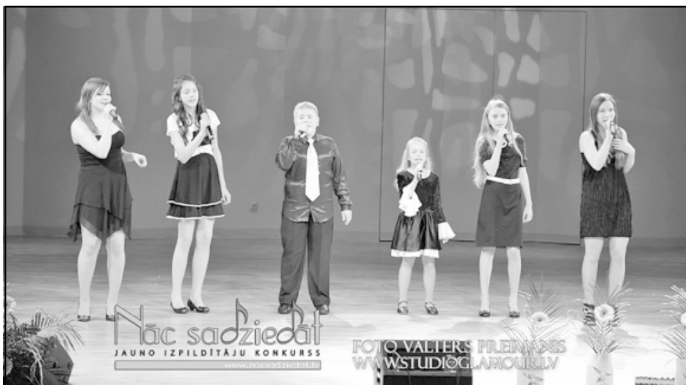
Sapņi ar spārnēm