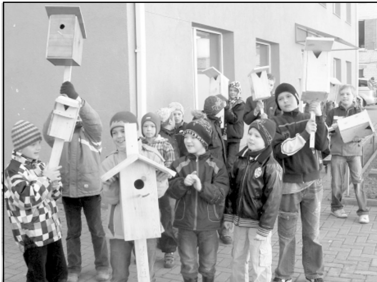
Salacgrīvas skolēni dodas uzstādīt jaunās mājas mūsu mazajiem brāļiem un māsām

Sarunā ar ornitologu skolēni uzzināja, kādā augstumā pareizi likt būri, kurās vietās to darīt labāk. Ļoti daudz par putniem, to īpatnībām uzzināt gribēja gan pirmklasnieki, gan trešklasnieki. Tika jautāts par gulbju sugām Latvijā, par mel-