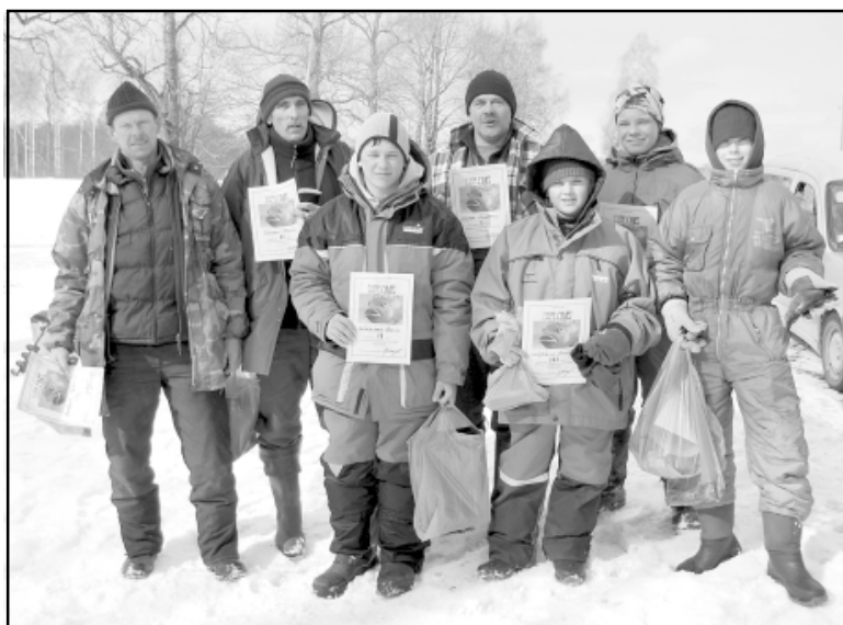
Pēc kārtīga darba un ārābūšanas makšķerētnieki var būt apmierināti - diena izdevusies!