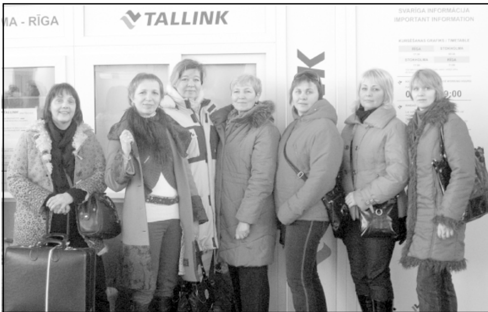
Salacgrīvas līnijdejoņājas mirkli pirms uzkāpšanas uz prāmja, lai dotos savā pirmajā līnijdeju kruīzā