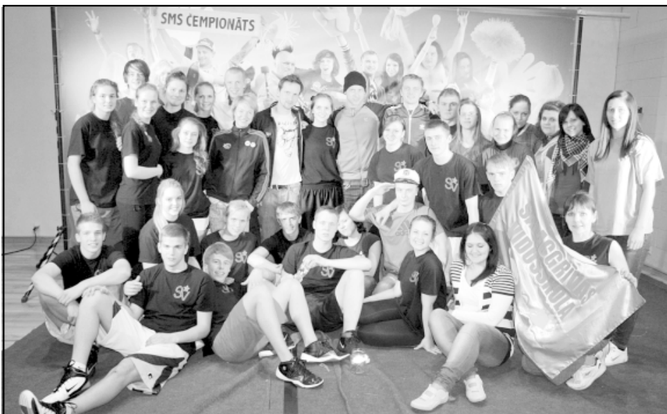
Salacgrīvieši kopā ar ZZ čempionāta organizētājiem

Lai gan Salacgrīvas vidusskolas 11. b klase neiegūva iespēju piedalīties ZZ lielajā finālā, bez balvām nepalika. Tika iegūta balva par labāko saukli. Tā kā salacgrīviešiem līdzī bi-