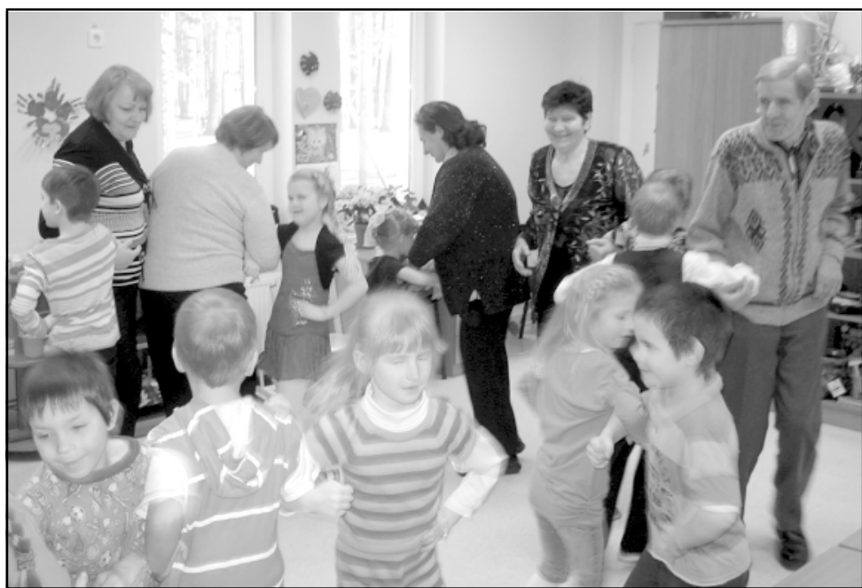
Pilnā Randa audzēkņi jaunā rotaļā kopā ar saviem vecvecākiem

Marta pēdējā dienā Ainažu bērnu dārzā Randa pulcējās ne tikai mazuli, bet arī viņu vecvecāki, jo notika Omīšu un Opīšu rīts. Iepazīnušies ar telpu jauko izkārtojumu un rotaļlietām, ar kādām bērni tagad spēlējas, viesi izdarīja secinājumu, ka kopš viņu bērnības izmaiņas ir lielas. Sekoja bērnu sagatavots koncerts, tika dziedātas jaunas un vi-