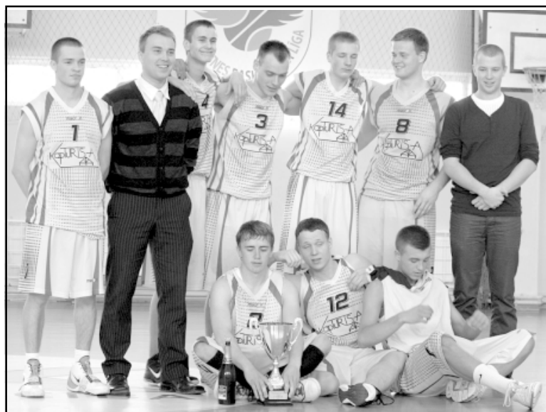
Kopturis-A/Salacgrīvas vsk. komanda pēc uzvaras

17. aprīlī ar finālspēli starp BK Silvars (Limbaži) un Kopturis-A/Salacgrīvas vsk. (Salacgrīva) noslēdzās Olimpiskā centra (OC) Limbaži 2. līgas turnīrs basketbolā. Šajā līgā par labākās godu cīnās 13 komandas no bijušā Limbažu rajona.