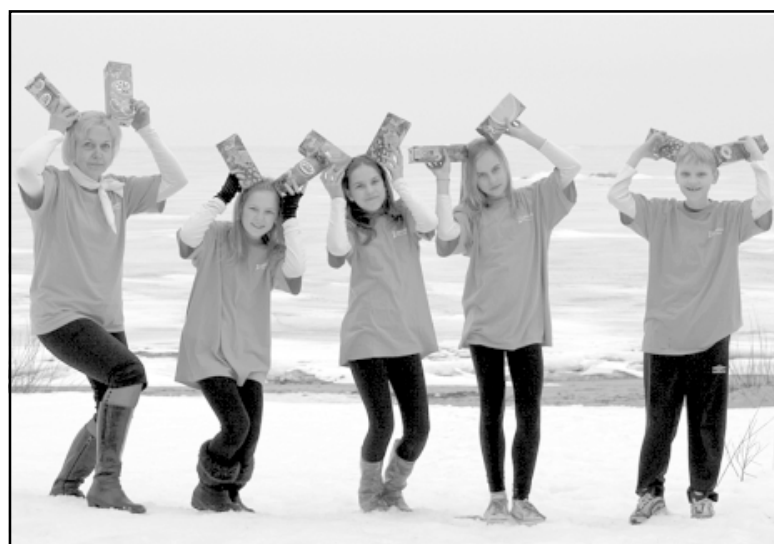
Pēc ikrīta sulas glāzes nedēļas garumā skolēni jutās spirti, mūndri un veselīgi!