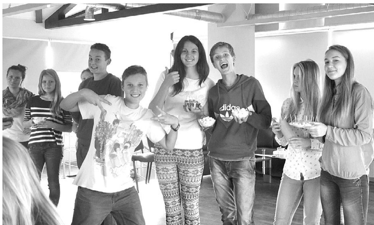
JIC Bāka telpās draudzības vakarā iepazīsti Latviju! satikās 13 jaunieši no Vācijas pilsētas Handevitas un 13 no Salacgrīvas pašvaldības

Sadarbībā ar Salacgrīvas vidusskolu 19. septembrī Jaunatnes iniciatīvu centra (JIC) Bāka telpās notika draudzības vakars Iepazīsti Latviju! , kurā satikās 13 jaunieši no Vācijas un 13 no Latvijas. Tas notika saskaņā ar Vācijas pilsētas Handevitas un Salacgrīvas pašvaldības noslēgto draudzības līgumu.