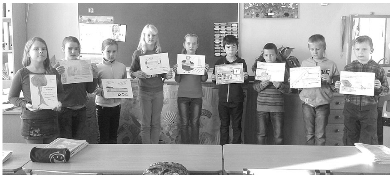
Liepupiešu pasaka Par koku, kas gāja ciemos uz «Kāpnēm» , aizceļoja uz Zemkopības ministriju, lai piedalītos konkursā Mūsu mazais pārgājiens