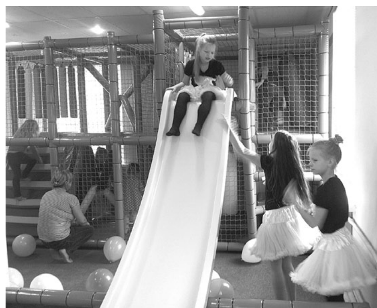
Tagad var laisties arī pa slīdkalniņu telpās