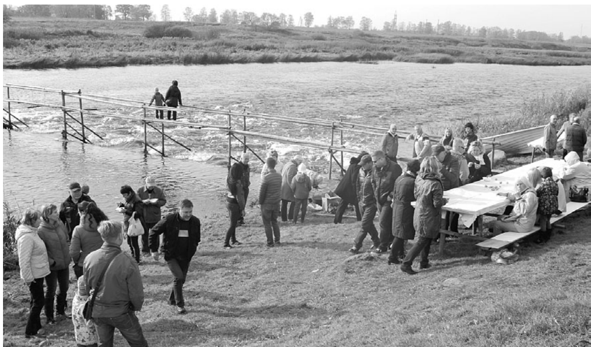
Apmeklētāji nogaršoja svaigi ceptus nēģus un zupu