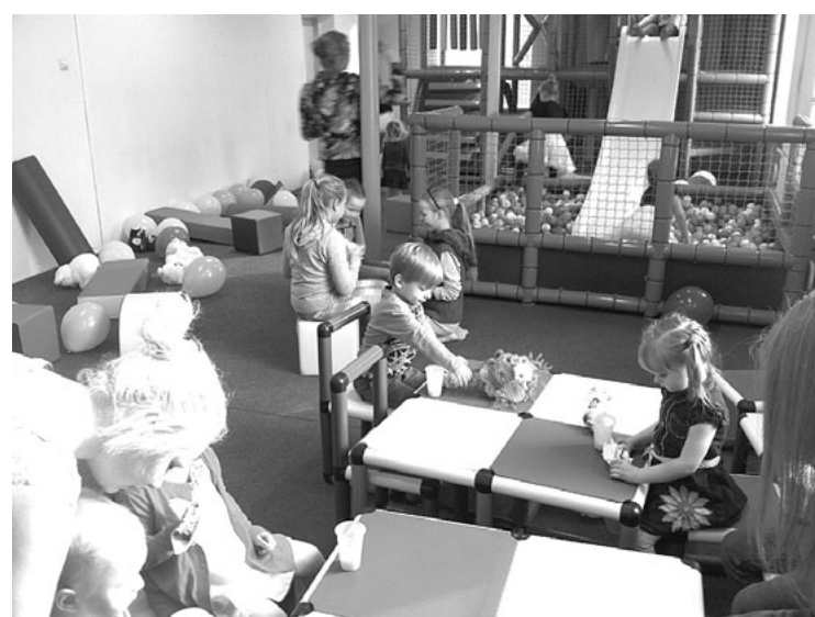
Bēdīs atpūtai un svētku kūkai