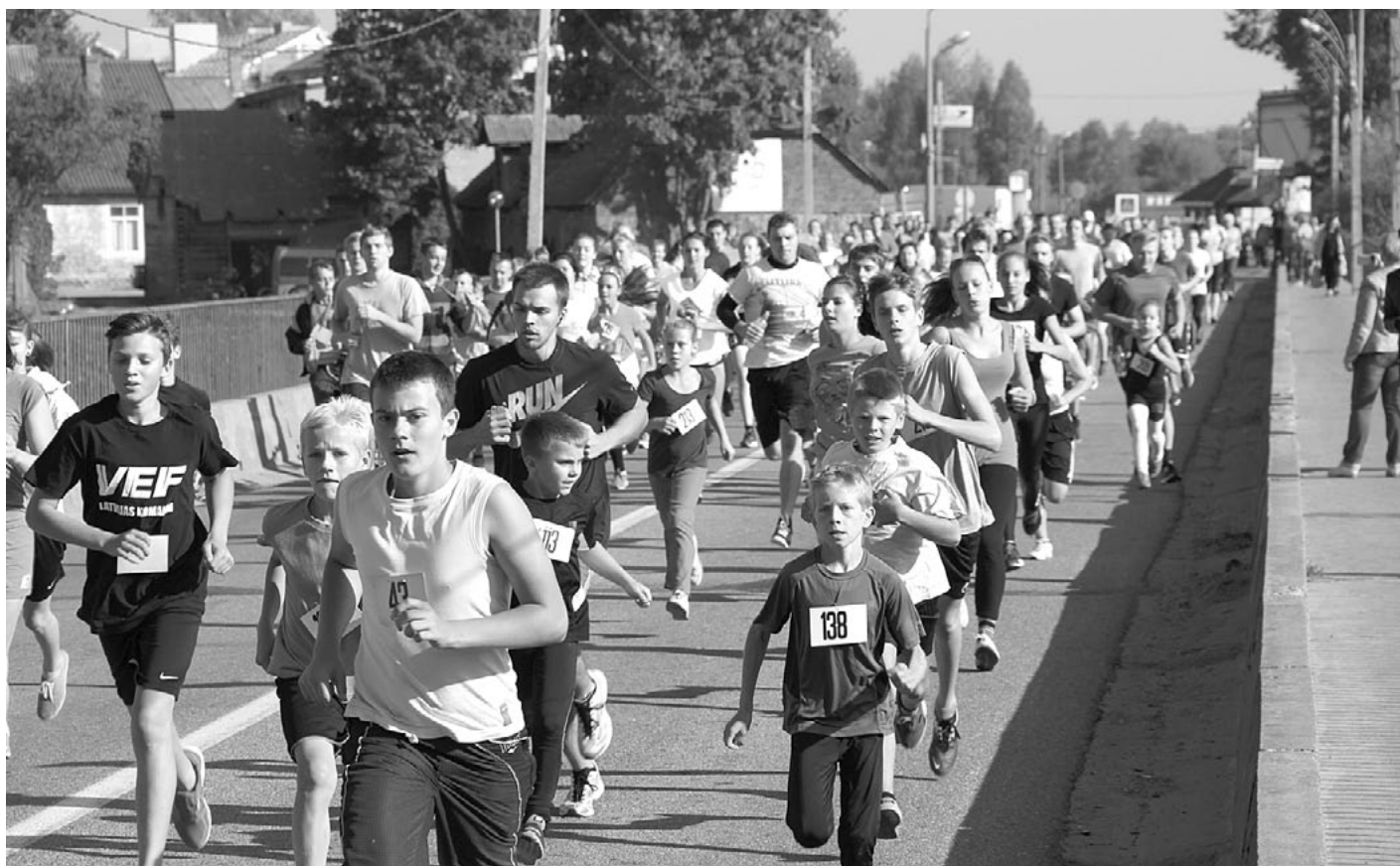
Šogad tradicionālajā skrējienā Trīs tilti piedalījās 172 sportisti

Siltais 20. septembra rīts daudzus sportotgribētājus pulcēja pie Salacgrīvas pilskalna, lai pulksten 11 sāktu 33. skrējienu Trīs tilti . 6,5 km garajā trasē devās 172 skrējiena dalībnieki, un droši var teikt, ka šogad skrējieni bija starptautisks, jo tajā piedalījās arī sadarbības pašvaldības no Vācijas - Handevitas - pārstāvji.