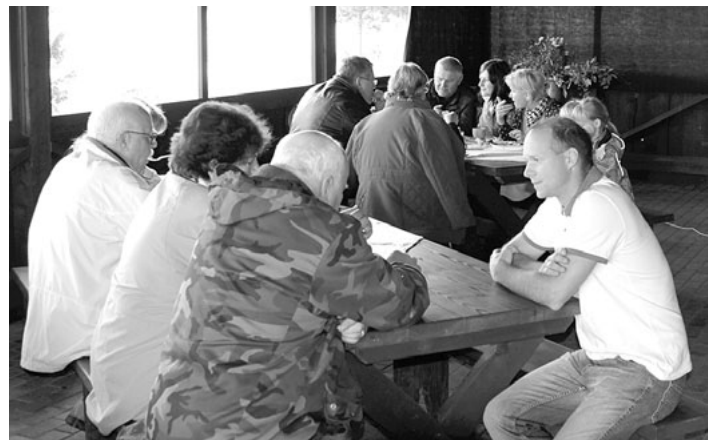
Vējavās varēja nobaudīt arī vidzemnieku gaumē kūpinātas jūras zivis