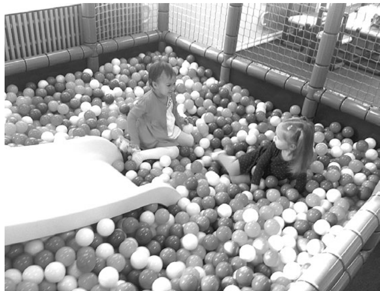
Rotaļas ne mirkli neapstājās