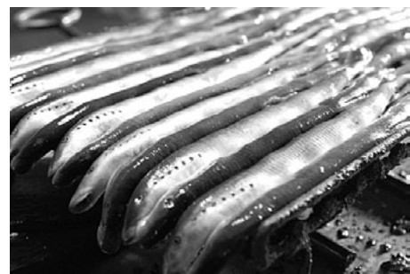
Pats svētku vaininieks - nēģis