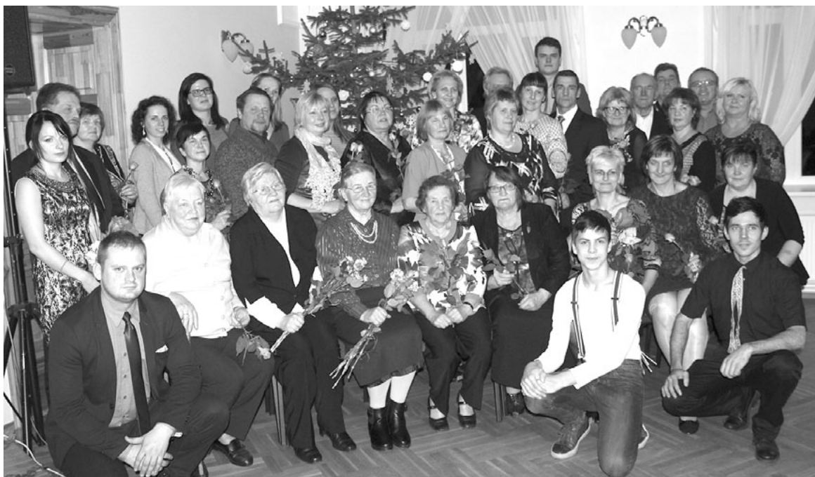
Šīgada Labo darbu balvas saņēmēji, kuri nesavtīgi ir palīdzējuši Liepupes pagasta iedzīvotājiem