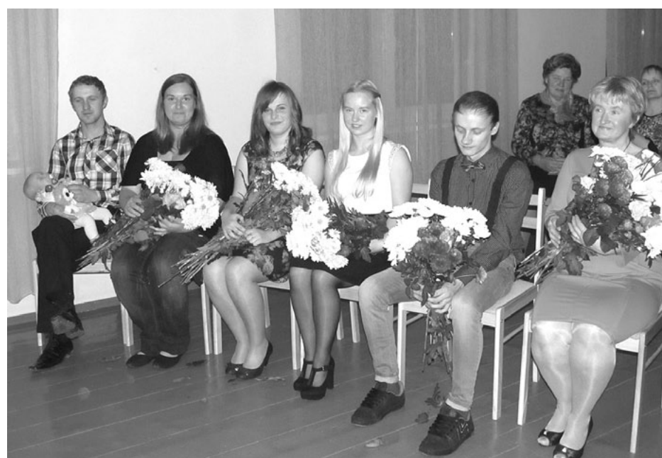
Lauvu tautas namā 5. novembra vakarā trīspadsmit sveču ziedu saziēdēja lielajā priedes zarā apaļo gadskārtu gaviļniekiem veltītajā pasākumā

Otrajā Adventa svētdienā pulcējāmies uz Ziemassvētku brīnumu gaidīšanas radošajām darbnīcām. Tās bija veselās trīs -