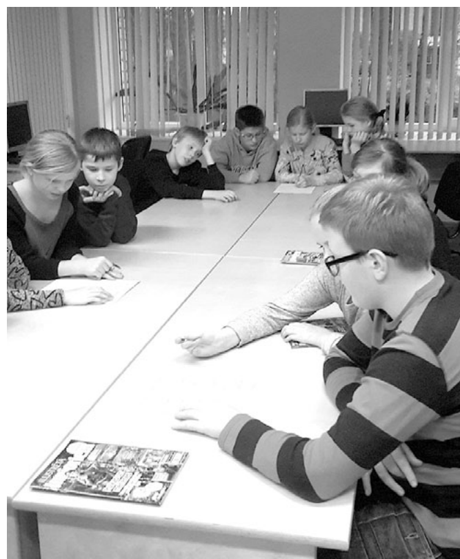
5. klases skolēni dalās domās un zināšanās par ziemeļvalstu autoru grāmatu varoņiem

Krišjāņa Valdemāra Ainažu pamatskolas skolotāja