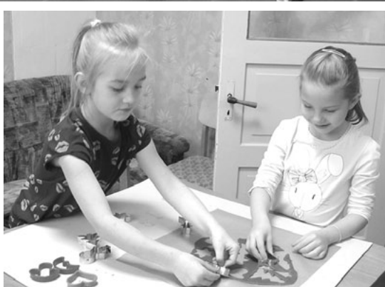
Piparkūku darbnīcā Lauvās tapa gardas jo gardas piparkūkas

Lauvās 13. decembrī viesojās dziesminieks Ēriks Loks, bet pasākumā Ar Ziemassvētku gaismu dvēselē... 26. decembra vakarā sumināsim 2015. gada Lauvu labos gariņus, neaizmirsīsim par mūsu mazajiem un izpriecešimies