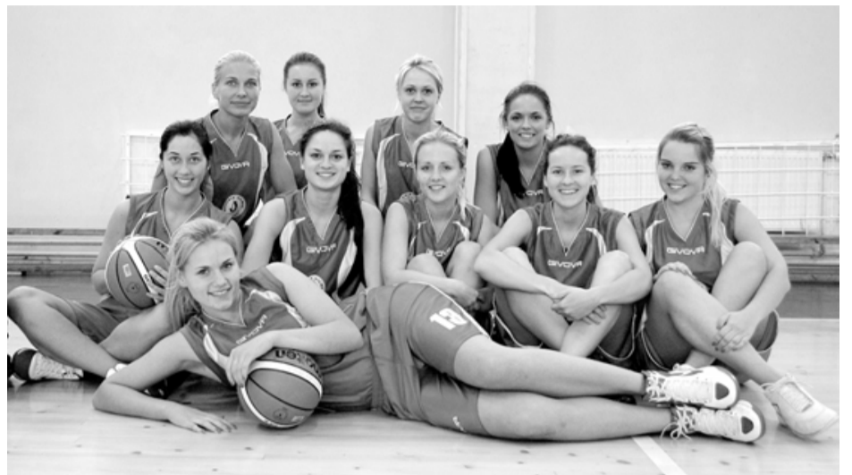
Salacgrīvas sieviešu basketbola komanda ir noskaņojusies uzvarām

Ziemeļvidzemes sieviešu basketbola līgas (ZVSBL) 2012./2013. gada sezona sākusies. Pateicoties Salacgrīvas novada domes atbalstam, tajā startējusi arī sieviešu basketbola komanda BK Salacgrīva .