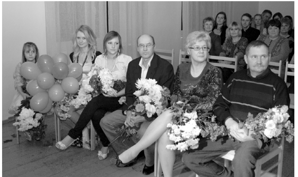
Lauvu puses šīgada jubilāri

Ābolu sēkļiņš sāk nogatavoties Un ar mani ir tāpat: Ar katru gada gredzenu atklātāk Sirds gatava parunāt.