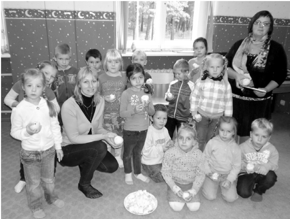
Mazie ainažnieki ceļo dzīvnieku pasaulē