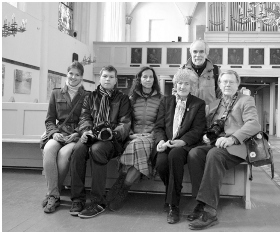
Fotobiedrības Salacgrīva biedri Straupes baznīcā kopā ar tās uzraudzi (otrā no labās)