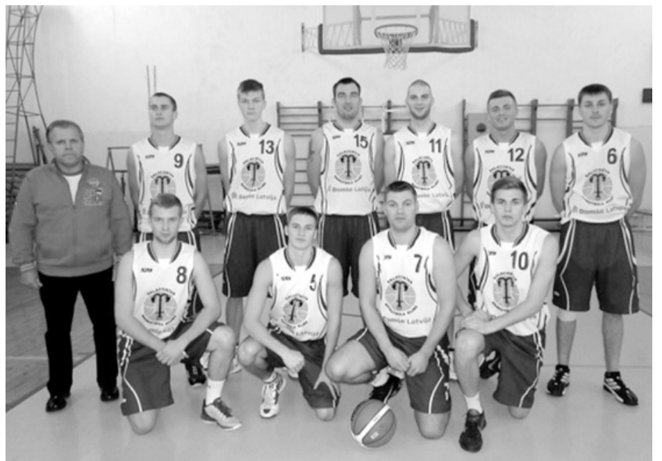
Basketbola klubs Salacgrīva sezonu uzsākot