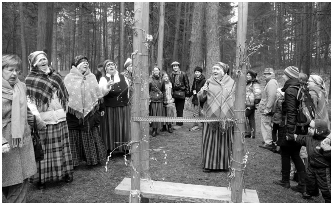
Folkloras kopa Cielava kopā ar rīdiniem un pilsētas viesiem iesvēta Lieldienu šūpoles Etnogrāfiskajā brīvdabas muzejā

Visas dienas garumā varēja šūpoties šūpolēs, krāsot olas sīpolu mizās, vizināties zirga mugurā, mēroties spēkiem koka un īsto olu ripināšanā, spēlēt senās