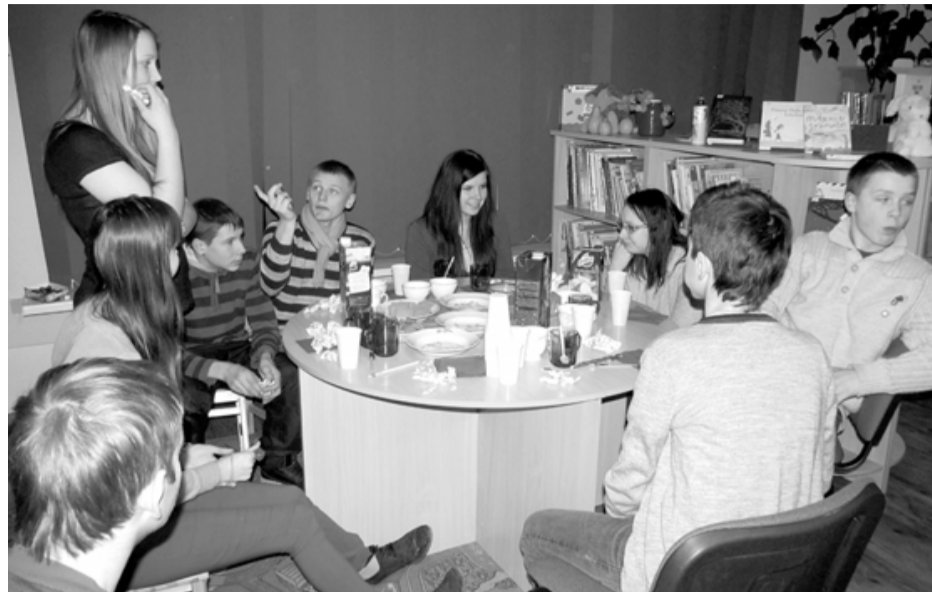
Jautra un interesanta bija pēcpusdiena Svētciema bibliotēkā