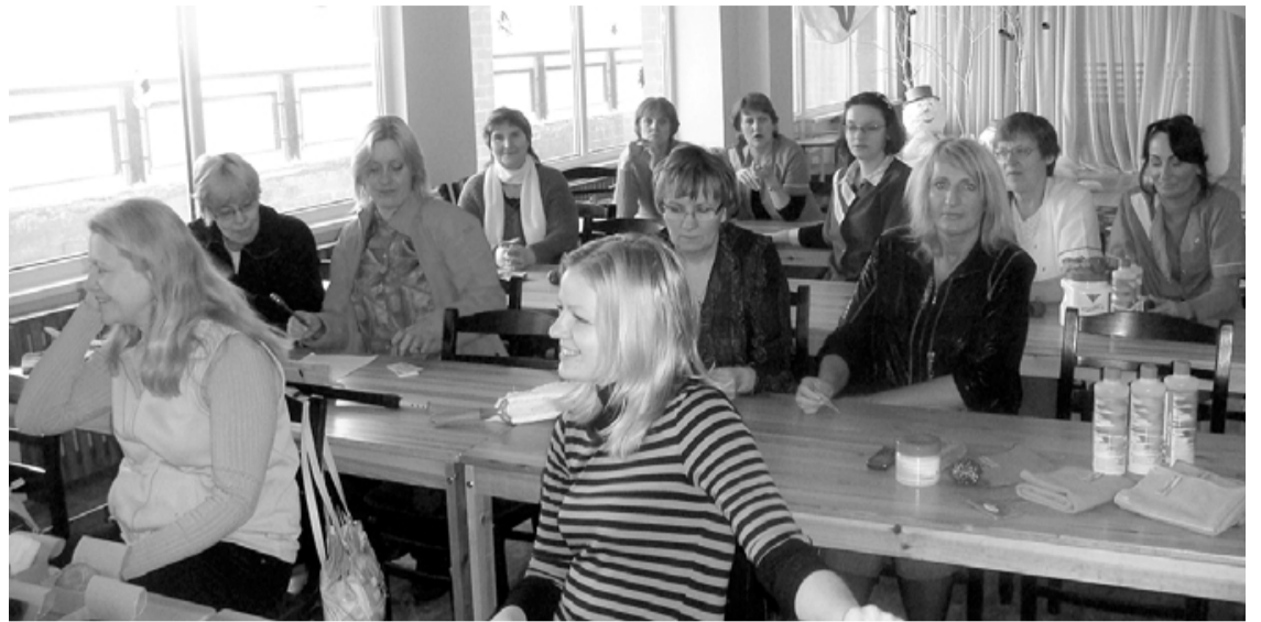
Februāra sestdienās PII Vilnītis skolotājas mācījās

Pēdējos gados pirmsskolas iestādēs nonāk aizvien vairāk bērnu ar dažādiem attīstības traucējumiem, no kuriem visbiežāk sastopamie ir skaņu izrunas un stājas traucējumi, kas ir savstarpēji saistīti. Lai tos laikus novērstu un bērnam nerastos problēmas ar izglītības standarta apguvi skolā, pirmsskolas izglītības iestādē Vilnītis licencēta jauna programma bērniem ar jauktiem attīstības traucējumiem. Ieviešot šo programmu, svarīgi atbilstoši sagatavot pirmsskolas skolotājas, jo darbā ar bērniem, kam ir dažādi attīstības traucējumi, jāizmanto īpaša metodika.