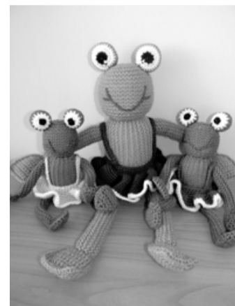
Jautrie var-dulēni sagaida ikvienu izstādes apmeklētāju

Visu martu bibliotēkas apmeklētāji var iepazīties ar Salacgrīvas novada izglītības iestāžu vēsturi. Šajā tematiskajā izstādē uz planšetēm izlikti materiāli no fotoalbuma, kas pagājušā gada nogalē izveidots, pateicoties kādreizējā Limbažu rajona Tautas izglītības nodaļas vadītāja, tūjiņa Jāņa Studera iniciatīvai un fanātismam. Interesanti var iepazīties ar plašāku materiālu klāstu gan digitālā, gan tradicionālā veidā