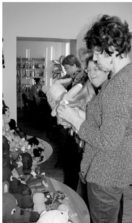
Svētciemā biedrības Mežābele dalībnieces apskatīja rotaļlietu izstādi un runāja par nākotnes plāniem

Pēc izstādes aplūkošanas aktīvajām un radošajām kluba dalībniecēm tika piedāvāts ieskatīties uzziņu grāmatās par dažādiem vaļaspriekiem un rokdarbiem. Pie tējas tases raisījās sarunas par turpmāko sadarbību. Tā kā aprīlī tradicionālajā Bibliotēku nedēļā Svētciemā būs vietējo rokdarbnieču jaunāko darinājumu izstāde, salacgrīvietes izteica vēlēšanos to papildināt arī ar saviem darbiem. Izstāde paredzēta aprīļa sākumā, tāpēc gaidīsim darbiņus jau marta beigās.