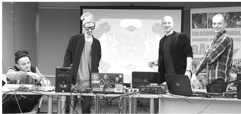
Puiši no Dirty Deal Audio rāda, kā top elektroniskā mūzika

Trīs stundu sarunas par elektronisko mūziku pagāja interesanti, un, lai iemūžinātu šo tikšanos, aktīvākie dalībnieki vienojās kopīgā bildē