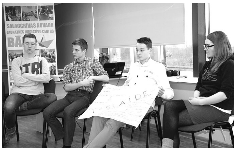
Kā Salacgrīvā izklaidēties? Tas bija viens no šī foruma jautājumiem

Forumā otrajā daļā dalībnieki, sadaloties grupās, kopīgi diskutēja un pierakstī-