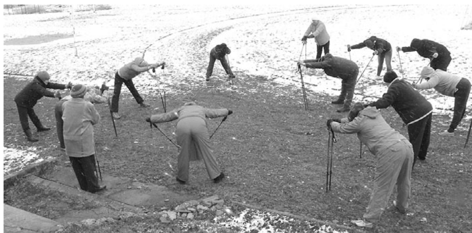
Korģenieši ir pārliecināti - tik laba lieta kā nūjošana ir jāturpina!