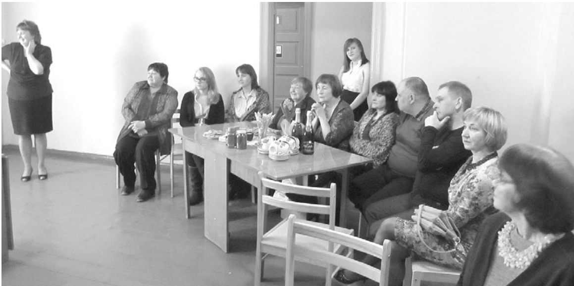
Biedrības Svētupes Lauva jubilejas sarīkojums

Svētupes krastā savas acis pavēruši vizuāli, upes vilnīšos šūpojas pīļu pāris un ievas tā negribīgi, bet plaucē zaļumu... Jā, šogad tāds agrs un pārsteigumiem bagāts pavasaris - te silda saulīte, te plosās vējš, te vēl sagriežas pār lauku sniegpuņķa vērpētes. Bet, spītējot dabas untumiem, Lauvu tautas namā arī šogad turpinās izziņāt un uzzināt gribošu, svētkus svinēt mīlošu iedzīvotāju sanāksmas.