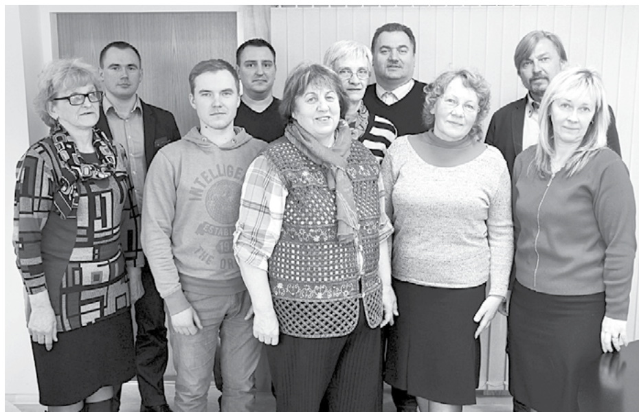
Ciemo vecākie, pārvalžu vadītāji, novada izpilddirektors un novada domes priekšsēdētājs pēc pirmās no jauna apstiprināto ciemo vecāko sanāksmes

Martā Salacgrīvas novada pilsētās un ciemos notika iedzīvotāju sapulces, kuru laikā domes priekšsēdētājs un pašvaldības darbinieki tikās ar iedzīvotājiem, informēja par novadā notiekošo, uzklaušīja iedzīvotāju jautājumus un vēlēja ciemu vecākos. Jauni ciemu vecākie ievēlēti Korģenē un Svētcimā, pirmo reizi vecāko ievēlēja Mērniekos. Savukārt Tūjā, Lauvās, Kuivižos, Vecsalacā un Lāņos darbu turpinās iepriekšējie ciemo vecākie.