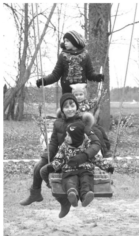
Ķerot Lieldienas, noteikti bija jāizšūpojas. Īpaši labi tas izdevās Svētcie- ma parkā