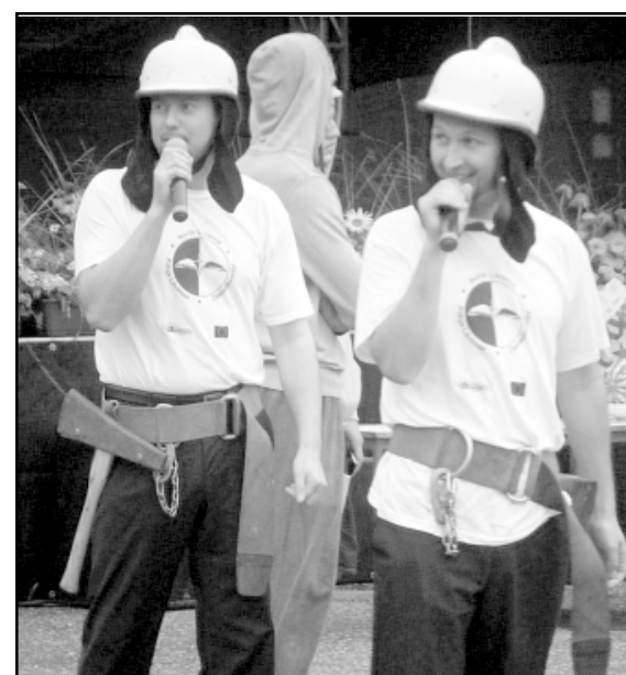
Savas spēka robežas varēja pārbaudīt ikviens Ziemeļlivonijas festivāla apmeklētājs