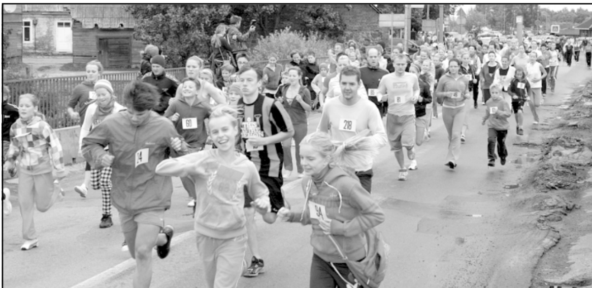
Vēl smaidiem sejā trasē dodas 132 skrējiena Trīs tilti dalībnieki

18. septembrī pie luterāņu baznīcas Salacgrīvā jau krietnu laiku pirms 11 bija jaušama rosība. Ņemot vērā draudīgos lietus mākonus un stipro vēju, laukumā pie pilskalna pulcējās sportotgribētāji.