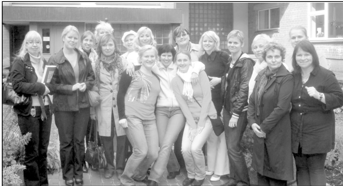
Pirms Igaunijas kolēģes dodas prom, vēl top kopīgs foto