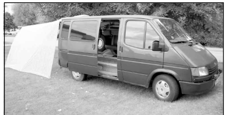
Firma Līva piedāvā transporta pakalpojumus ar īpaši aprīkoti autobusiņi

Savus pakalpojumus firma sniedz visā Vidzemē, īpaši izdevīgi tie ir Salacgrīvas novadā, jo nav jāmaksā papildu transporta izdevumi. - Esam vienīgā apbedīšanas firma