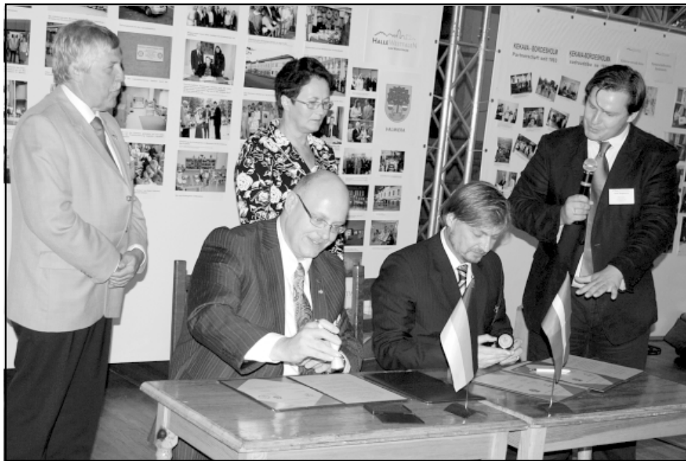
Handevitas un Salacgrīvas pašvaldības vadītāji paraksta abu pašvaldību atjaunoto sadarbības deklarāciju