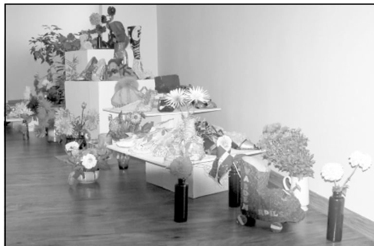
Izstāde Svētciema bibliotēkā