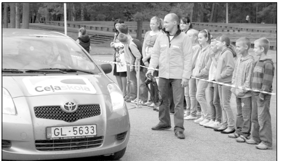
Katrs skolēns un arī skolotājas īpaši aprīkotā mašīnā varēja izmēģināt, kas notiek ar braucēju, ja viņš nav piesprādzējies