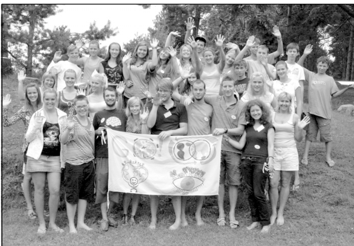
Nometnes Go global, go green dalībnieki saguruši, bet priecīgi - nometne ir izdevusies - TIEKAMIES nākamajā gadā!

nometnes dalībnieki devās ceļojumā pa plašo pasauli - ar savām valstīm viņus iepazīstināja brīvprātīgie, notika vakars Ungārijā, Itālijā, Lietuvā un Nīderlandē. Visbeidzot paši latvieši viesiem prezentēja savu valsti.