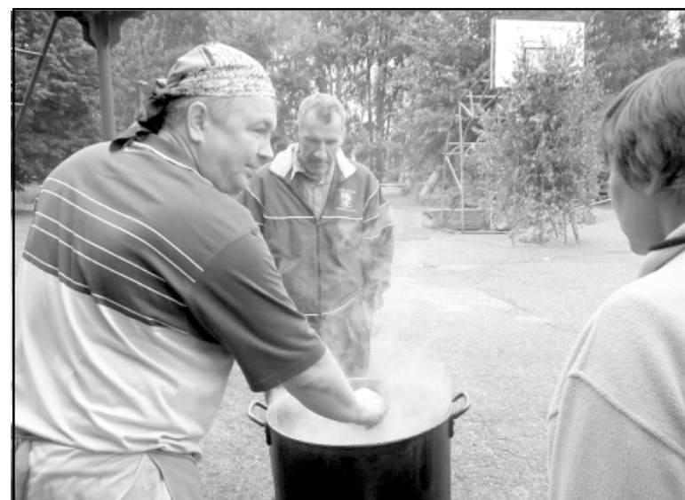
Turpat pilsētas laukumā prasmīgs pavārs gatavo Ziemeļlivonijas festivāla īpašo sautējumu