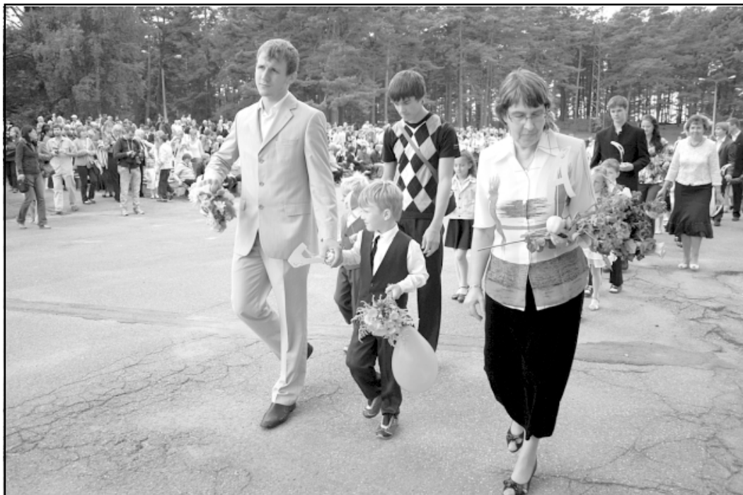
1. septembris Salacgrīvas vidusskolā - zvana skaņas aicina uz pirmo stundu šajā mācību gadā

Liepupē 12. septembrī darbību sākusi arī Salacgrīvas mūzikas skola. Savukārt 16. septembrī, pateicoties bijušajai Liepupes vidus-