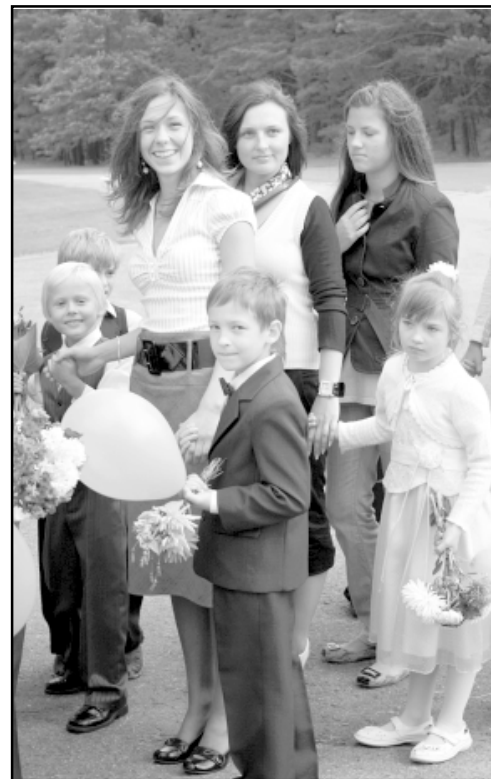
Svētki un satraukums par nezināmo ir gan mazajiem pirmklasniekiem, gan arī divpadsmitajiem