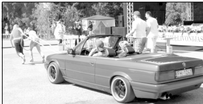
Spēka pārbaude, velkot auto. Nez vai tas ir grūti?