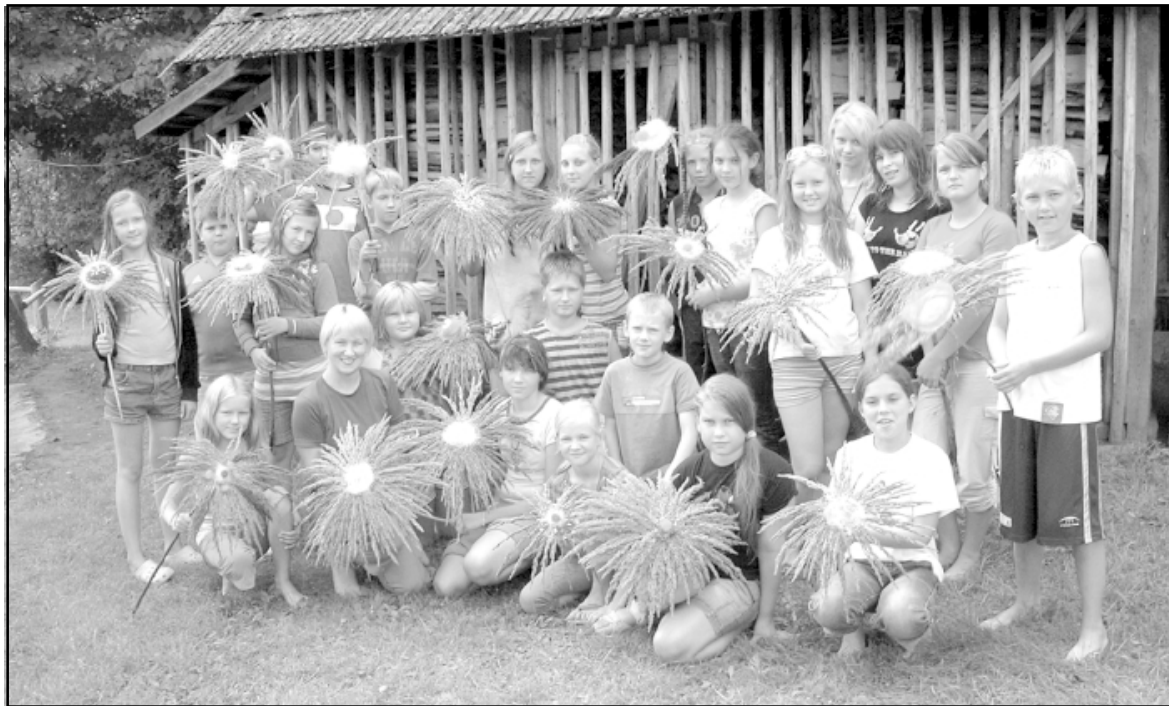
Rotājumi pagatavoti, atliek vien sapost Kraukļu pirts pagalmu

Vasara strauji tuvojas beigām, un mainīgie laikapstākļi vistiešāk liecina par rudens tuvošanos. Lai saistoši un interesanti izmantotu atlikušās vasaras brīvdienas un piedzīvotu jaутru kopābūšanu, 12. augustā pašvaldības iestādes Dienas centrs bērniem apmeklētāji no Lauvām un Salacgrīvas devās 2 dienu pārgājienā uz viesu namu Kraukļi .