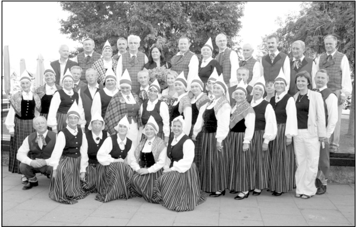
Saiva un Sagša pēc koncerta Nidā!