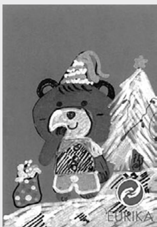
Līvas Grētas Sīlītes zīmētā apsveikuma kartīte Lāču brālis

Pārējos apsveikumus zīmēja un gatavoja skolēni paši - 1. - 4. klašu skolēni - katra klase pa 2, 5. - 12. klašu skolēni 3 apsveikuma kartītes no katras klases. Skola nosūtīja 52 apsveikumus sadarbības