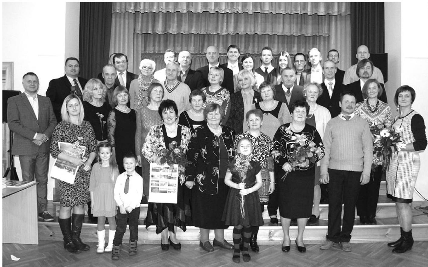
Balvas saņēmēju kopbildē nebūt nav visi nominanti