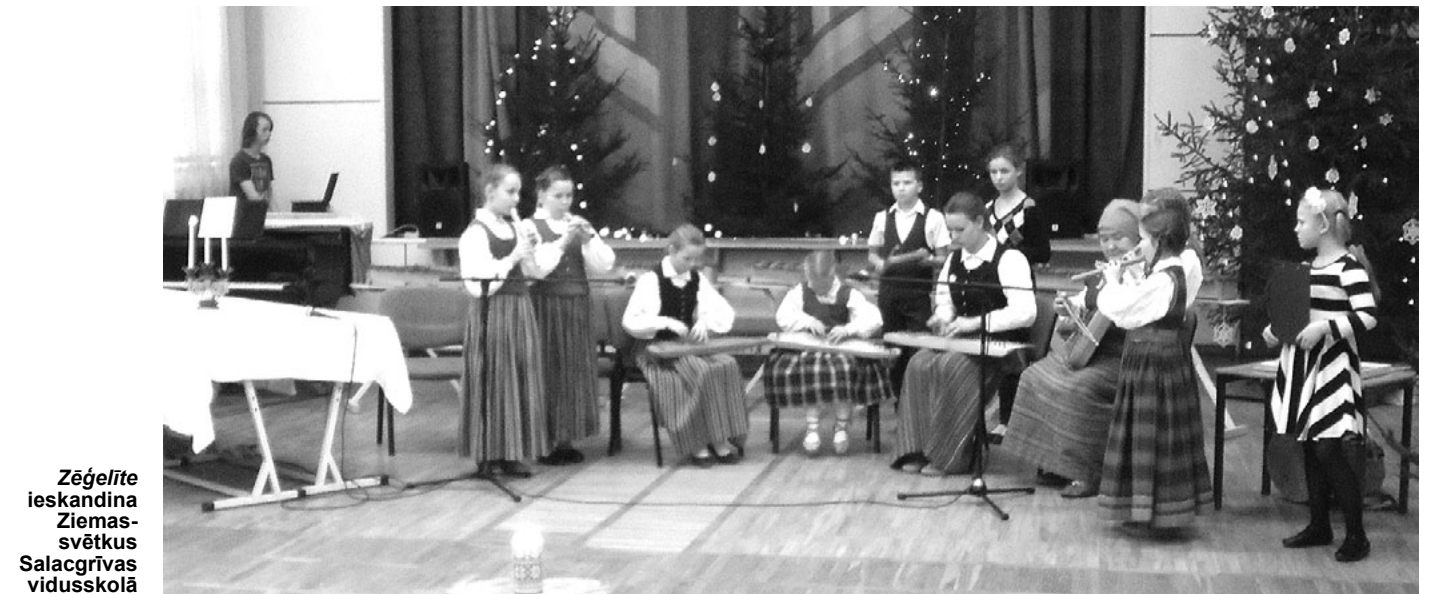
Zēģelīte ieskandina Ziemassvētkus Salacgrīvas vidusskolā