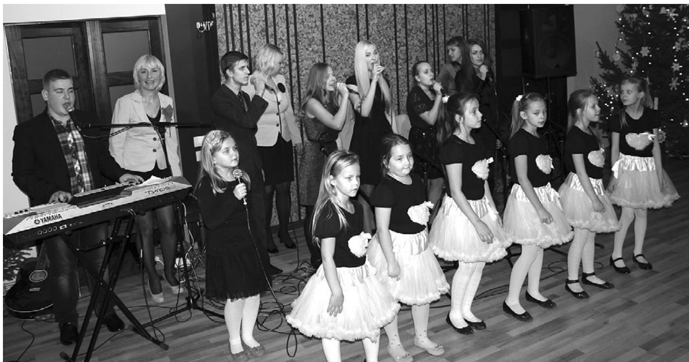
Nupat atklātā Svētcieņa saietu centra jauno zāli ieskandina Salacgrīvas kultūras nama popgrupas Adatiņas , Sapņi ar spārnēm un Dziedātprieks