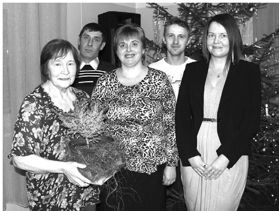
Lauvu labie gariņi pie svētku eglītes