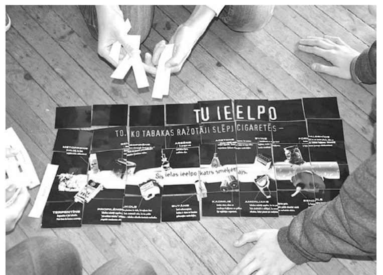
Skolēni noskaidro, kādas vielas satur cigarete

Skolēni bija sagatavojuši mājasdarbu par to, kas mudina jauniešus uzsākt smēķēt, aktīvi iesaistījās diskusijās, piedalījās dažādu uzdevumu veikšanā, paši izdarot secinājumus par smēķēšanas negatīvo ietekmi. Noslēgumā, atbildot uz jautājumiem par