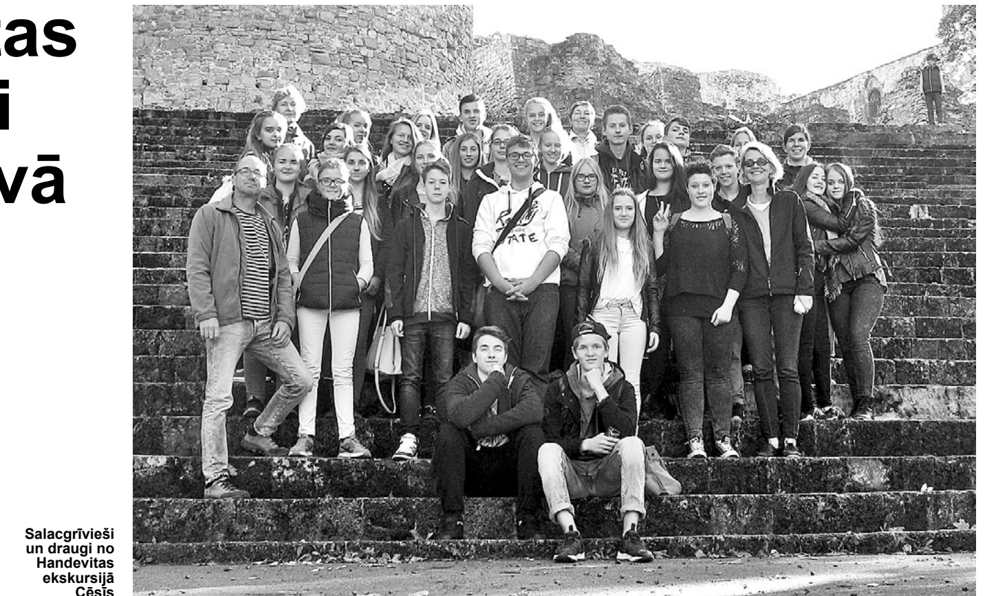
Salacgrīvieši un draugi no Handevitas ekskursijā Cēsīs

Programma bija gana saspringta un daudzpusīga. Ar mūsu skolēnu vecāku gādību vācu skolēni dzīvoja salacgrīviešu viesģimenēs, kurās pavadīja diezgan