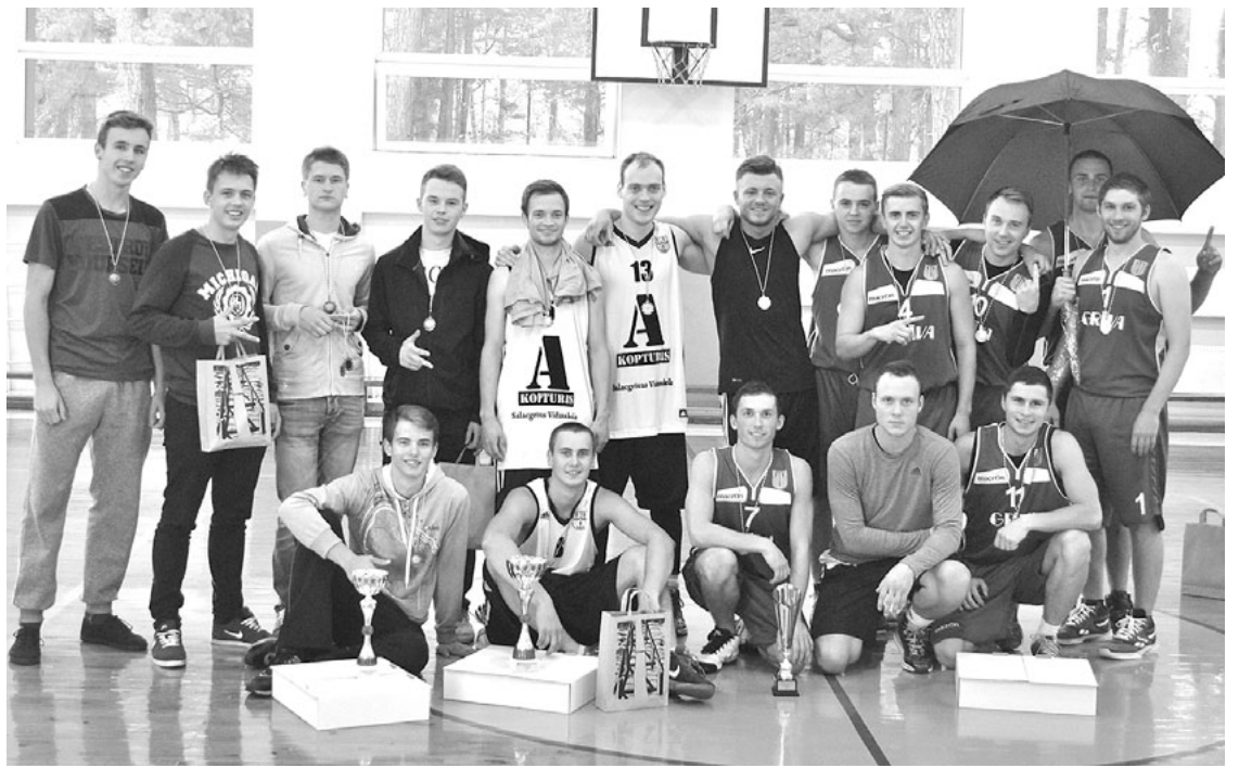
Lai arī vietas sadalītas un noskaidroti labākie, kopbildē visi smaidīgi - labs darbs padarīts...