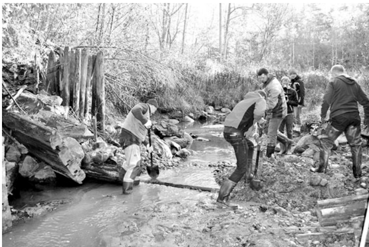
Fiksēts vēsturisks brīdis - pabeigta bijušā Norēnu dzirnavu dambja posma nojaukšana. Tā dēļ zivis nevarēja brīvi doties augšup pa Noriņas upi jau aptuveni 100 gadu

Šoruden Salacgrīvas novadā atjaunots Noriņas upes posms no bijušajām Norēnu dzirnavām līdz ietekai Salacā. Upes atjaunošana noslēdzās ar talku 15. oktobrī. Tajā piedalījās pārstāvji no Latvijas Dabas fonda, Dabas aizsardzības pārvaldes, kā arī citi dabas mīļotāji un interesenti. Talkas laikā tika pabeigta bijušā Norēnu dzirnavu dambja posma nojaukšana, tādējādi ļaujot lašveidīgajām zivīm migrēt uz nārsta vietām augšpus dambja. Šis bija vēsturisks brīdis, jo zivis dambja dēļ nevarēja brīvi doties augšup pa Noriņas upi jau aptuveni 100 gadu.