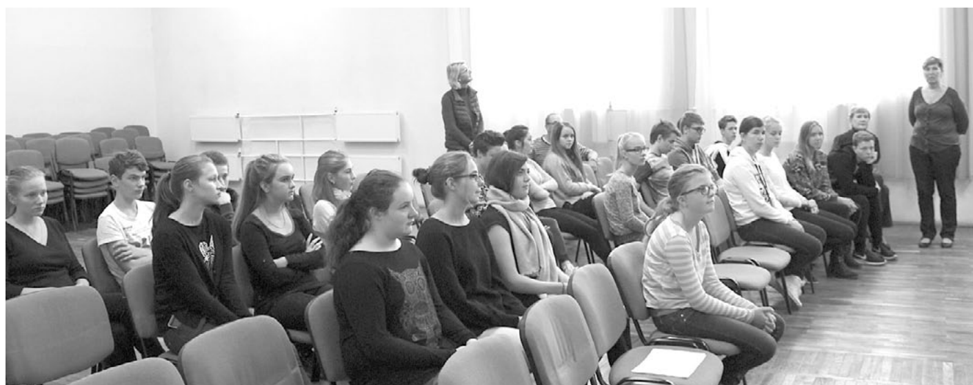
Pirmajā dienā projektā iesaistītie skolēni un skolotāji tikās ar skolas vadību, iepazīs un klausījās koncertu

grupās apkopēja viedokļus par pozitīvo projektā, visi uzsvēra jaunu draugu iegūšanu, jaunu pieredzi, uzlabojumu angļu valodā, pozitīvas emocijas, visur pieejamo Wi-Fi, izbaudītu ģimenes dienu, jaunus deju soļus. Par to, kas nepatika... Gandrīz vienīgais - bijis par maz laika kopā. Skolēni izteica arī priekšlikumus nākamajiem projektiem - piemēram, abām pusēm kopīgi plānot pasākumus, rīkot gan iepazīšanās, gan atvadu ballīti, ilgāku uzturēšanās laiku, vairāk stundu kopā ar latviešu skolēniem.