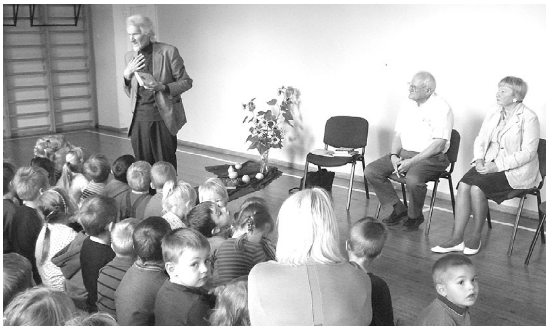
Dzejnieks Uldis Auseklis runā savus dzejoļus