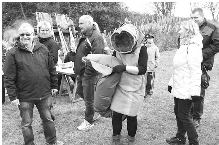
Šogad pirmo reizi Nēgu svētkus apmeklēja Nēgu karalis... Vai visiem izdevās ar viņu nofotografēties?