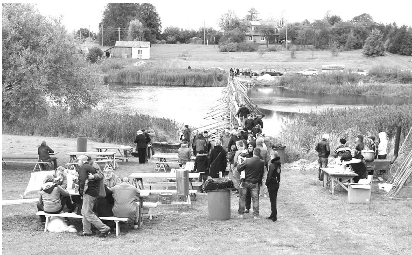
Pēc upes pārvarēšanas jauki varēja atpūsties un pamieloties ar ceptiem nēģiem un nēgu zupu trešajā tačī