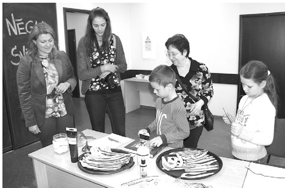
Kad lielā rosīšanās tačos pieklusa, jaunatnes iniciatīvu centrā Bāka ikviens varēja līdzņemšanai izkrāsot savu nēģi