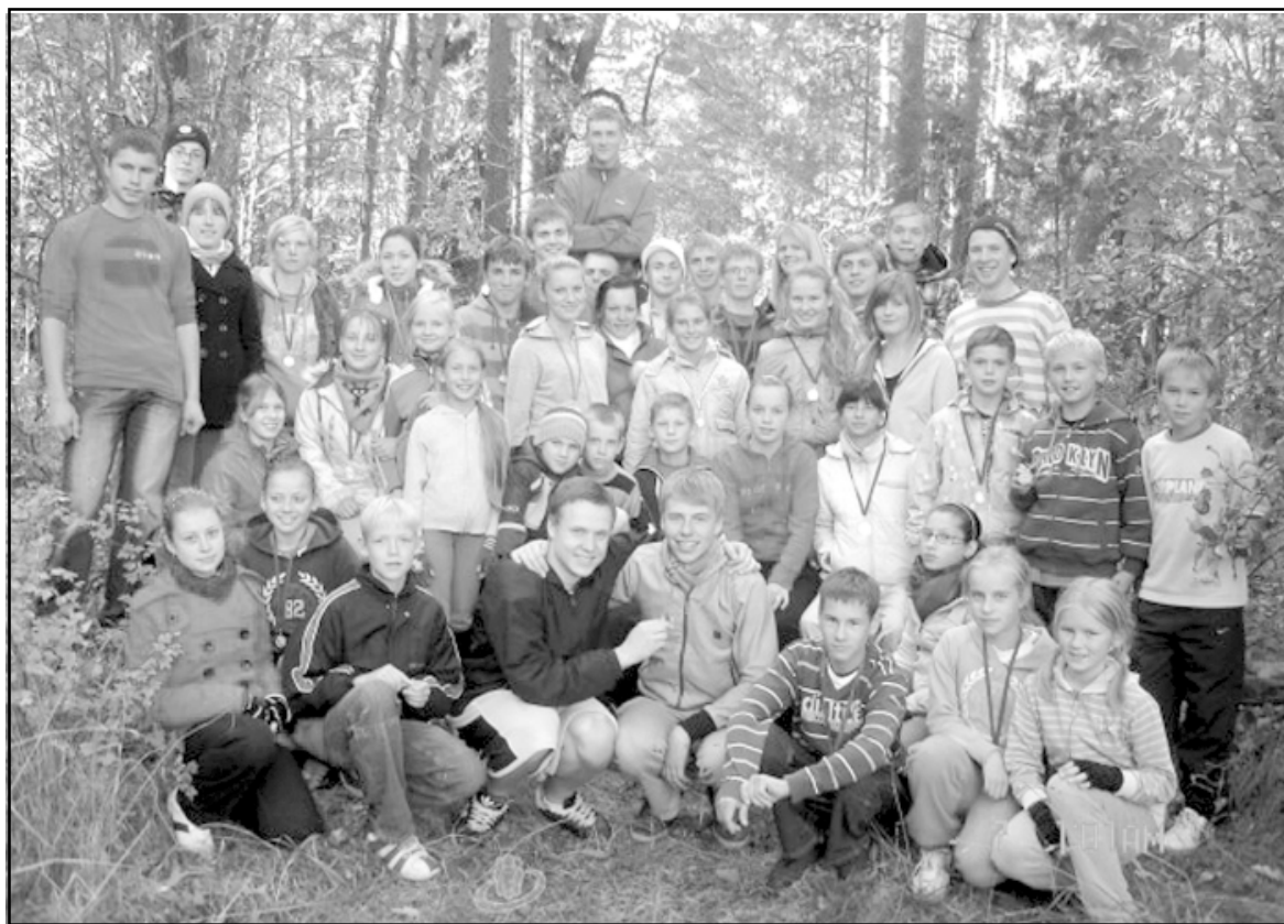
Visi krosa dalībnieki no Salacgrīvas

Rudenīgajā, bet patīkami saulainajā 6. oktobra rītā Lāņos risinājās ikgadējais Rudens kross. Parasti sabrauc skrietgribētāji gan no Salacgrīvas, gan Limbažu, gan Alojās novada. Šī reize nebija izņēmums. No Salacgrīvas vidusskolas vien bija 41 sportists - 19 meiteņu un 22 zēni.