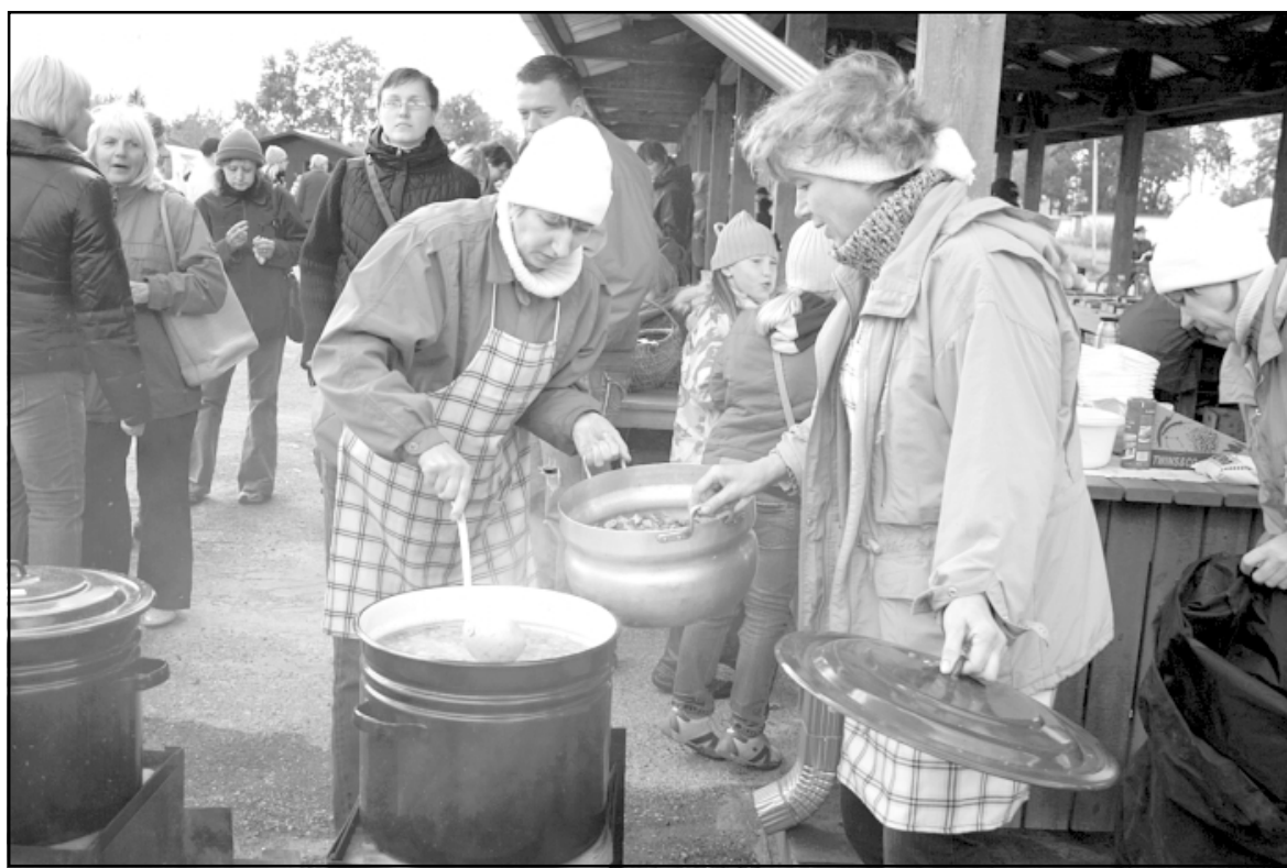
Vēl tik mazliet jāpaciešas, un zupa būs gatava