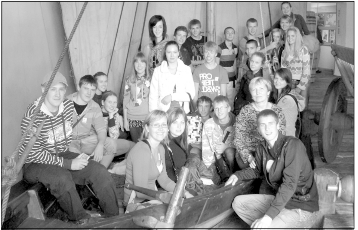
Salacgrīviešu delegācija Vikingu muzejā Rībes pilsētā