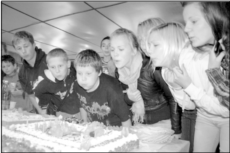
Jaunie airētāji pūš svečītes savā jubilejas tortē

26. septembrī Salacgrīvas airēšanas bāzē savu 11. gadskārtu svinēja Salacgrīvas airētāji, kuriem šī sezona bijusi īpaši veiksmīga.