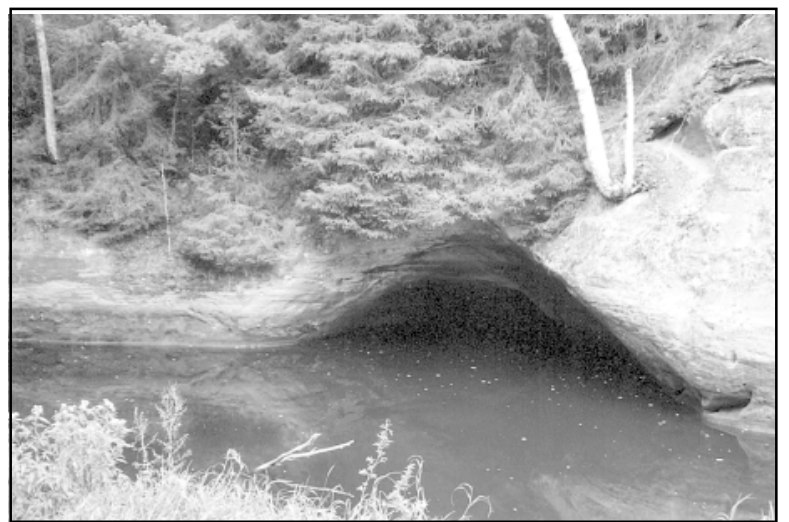
Spoguļu klints Svētupe krastā

giem atspīdumiem ūdenī, bet mans fotoobjektīvs nevarēja izspraukties cauri krūmu džungļiem. Sajūsminājos par milzīgajiem ozoliem Svētupe krastos, bet pie tiem nokļūt gandrīz vai nav iespējams. Es lasīju, ka atrodos Ziemeļvidzemes biosfēras rezervātā, un man radās jautājums, vai rezervātā nav jābrūpējas par šādu izcili skaista dabas veidojuma kopšanu. Pasaules tūrists ir pieradis pie katra izcila dabas objekta orientēties pēc zīmēm un paskaidrojumiem. Vai nebūtu jauki, ja bultiņas parādītu ceļu arī uz Spoguļu un Drūmo klinti, ja tūrists varētu izlasīt informāciju par koka kapličiņu un par koka būvju attīstības vēsturi Latvijas laukos?