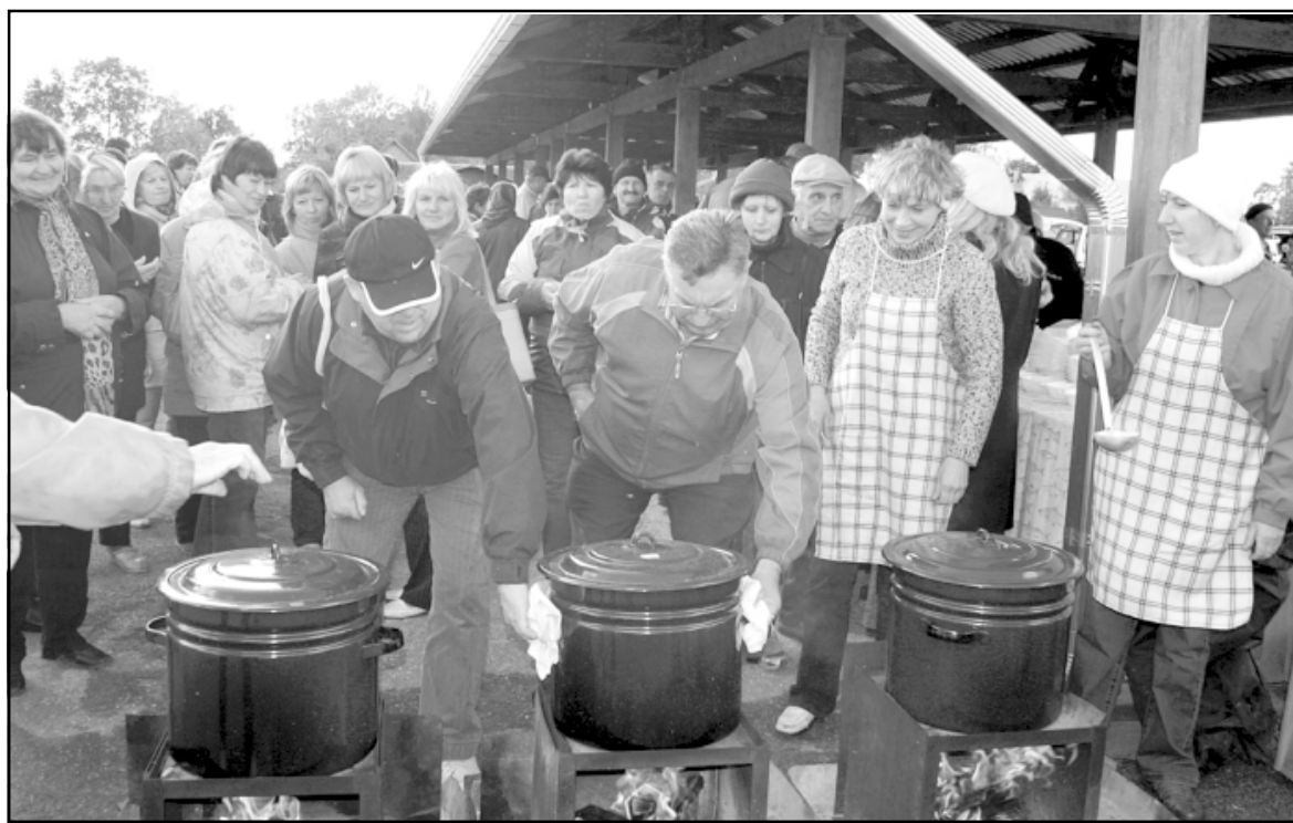
Trīs zupas katli izvārtī - tūlīt ikviens varēs nogaršot!