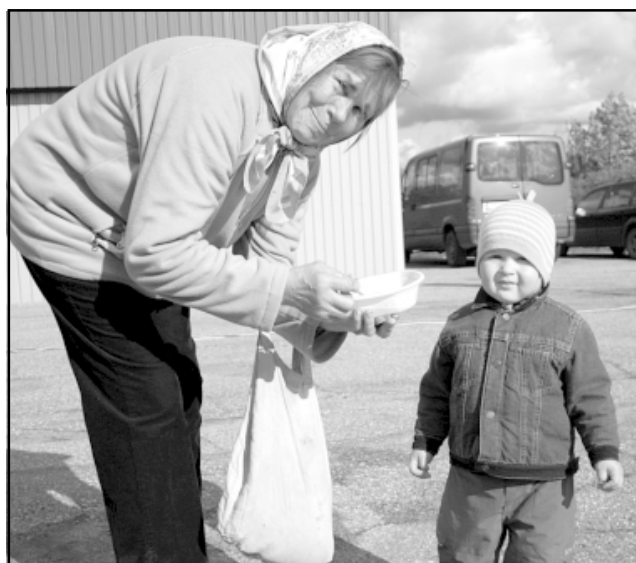
Nēģu zupa garšoja gan lieliem, gan maziem!

Nēģu tirgū varēja ne vien izgaršot un nopirkt nēģus, bet arī iemēģināt spējas rokdarbos un uzzināt ne vienu vien rokdarbnieču noslēpumu