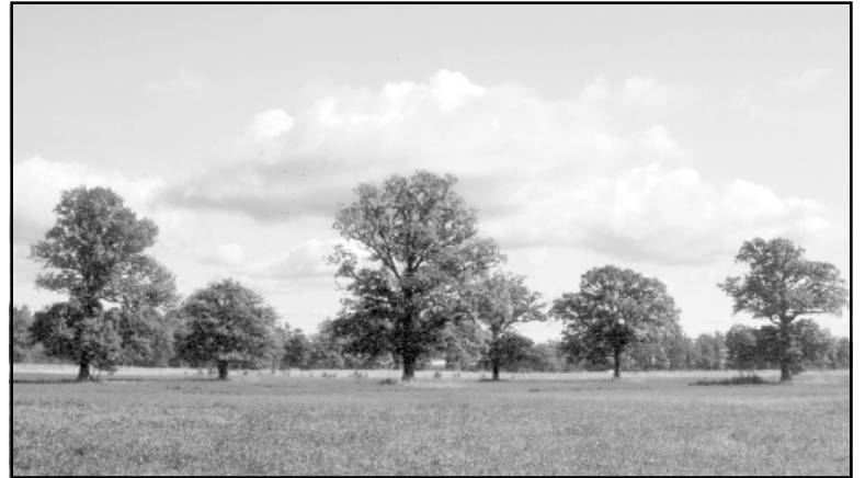
Svētozoli laukā pie Svētciema

Stundām ilgi klīdu pa Svētupe krastiem, jo man kā fotogrāfei gribējās iemūžināt šo izcili skaisto kanjonu, ko veido sarkanīgi smilšainie klinšu atsegumi ar brīnišķī-