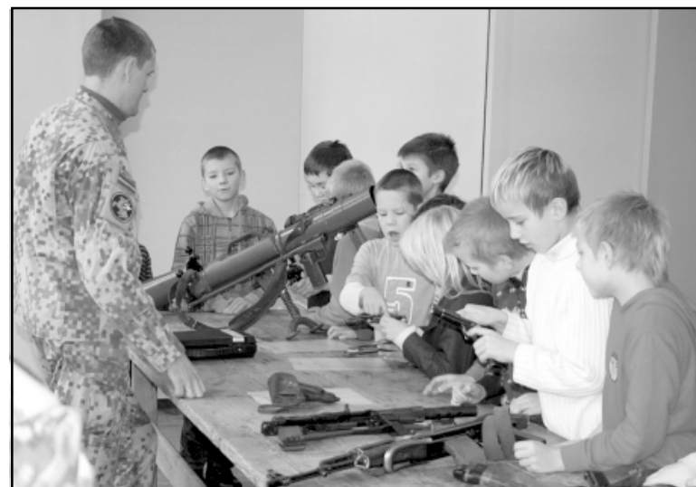
Kamēr meitenes turpat blakus skatīja jaunākās grāmatas, puīši ļoti uzmanīgi iepazīna zemessardzes ierocus