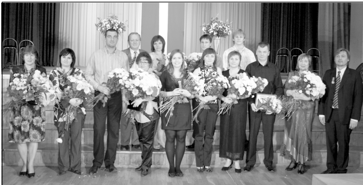
Gada salacgrīviešu kopbilde šogad šāda! Kāda tā būs 2011. gadā?