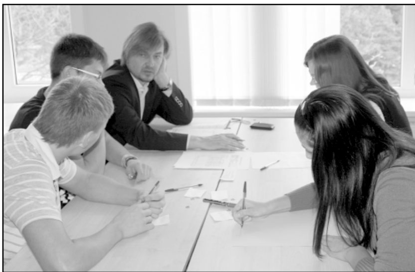
Salacgrīvas vidusskolā ar jauniešiem debatēja arī novada domes priekšsēdētājs Dagnis Straubergs

2. jaunieši un cerības: • ko jaunieši cer sagaidīt no vietējām pašvaldībām; • ko jaunieši sagaida no vietējās sabiedrības; • ko pašvaldība cer sagaidīt no jauniešiem;