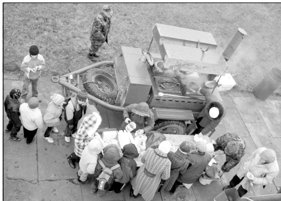
Katrs festivāla dalībnieks nogaršoja lauku virtuvē vārīto biežputru un karsto piparmētru tēju

jiem: Salacgrīvas novada domei, Latvijas Nacionālajai bibliotēkai, tās Bērnu literatūras centram, Salacgrīvas novada deputātu apvienībai Par laukiem, pilsētu un jūru , izdevniecībām Zvaigzne ABC , Jumava , Antēra , Pētergailis , Annele , Kontinents , Lietusdārzs , Liels un Mazs , Madris , Nordik/Tapals , Lauku Avīze , Atēna , AvotsPr , AS Brīvais vilnis , SIA Baņķis , veikals Sedums , Lienes konditorejai, Rīgas starprajonu zvejnieku kooperatīvā