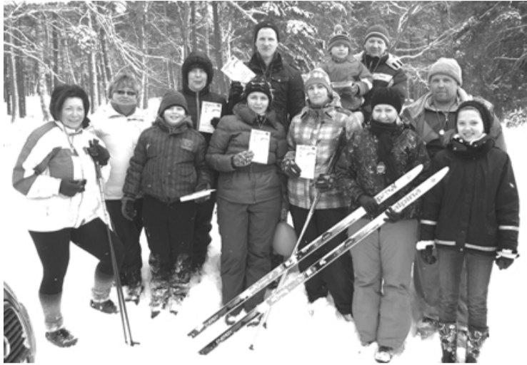
Šajās sacensībās uzvarētāji ir visi!

Marts ir pirmais pavasara mēnesis, tāpēc laikapstākļi sagādāja dažādus pārsteigumus gan sestdien karnevālā, gan svētdien biatlonā. Biatlonā cīņa par medaļām notika 3 grupās - bērniem, sievietēm un vīriešiem. Visi bija priecīgi, neviens nesūdzējās par ļoti mainīgajiem laikapstākļiem. Traise patiešām bija smaga, bet mēs no grūtībām nebaidāmies. Uzva-