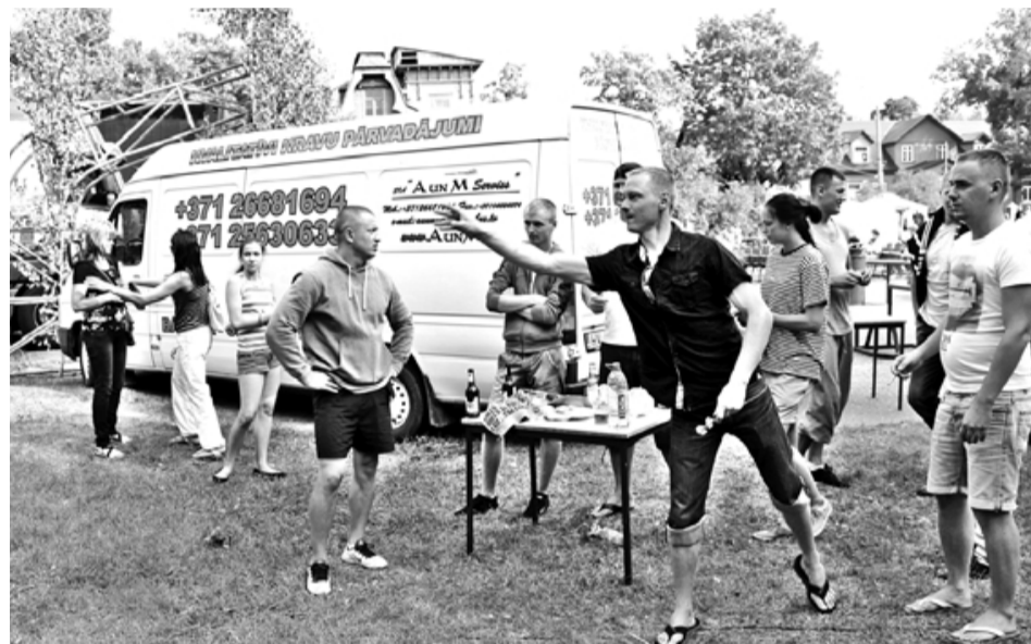
Visas dienas garumā laukumā pie Veides pils varēja piedalīties spēka un veiklības sacensībās, arī šautriņu mešanā