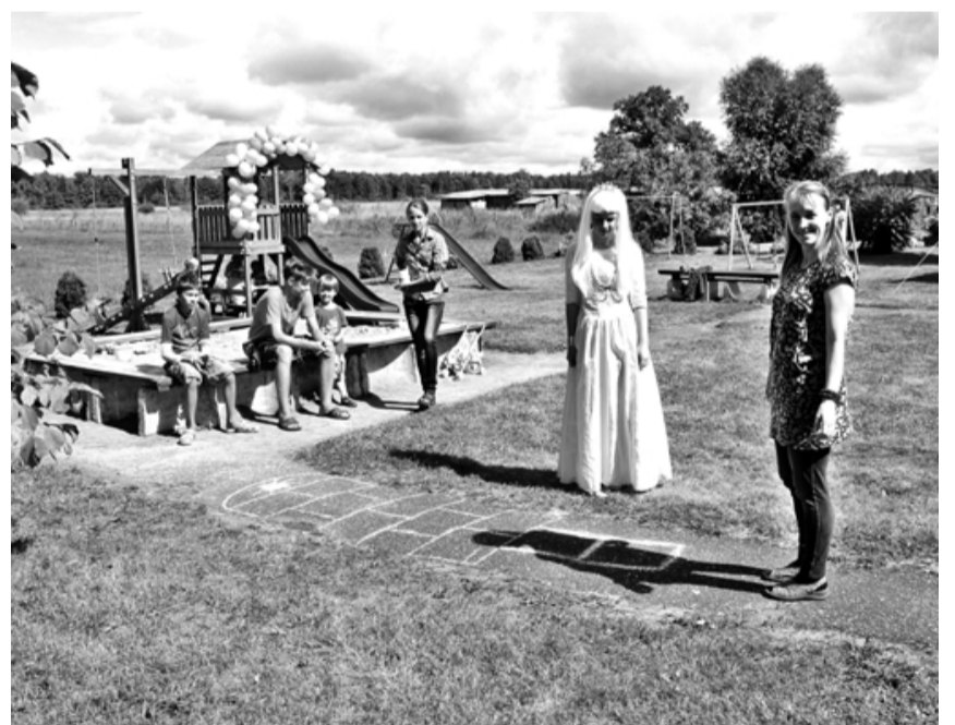
Bērnu svētki Rīgas ielā 6 šoreiz veltīti rotaļu namiņa un labiekārtotā laukuma atklāšanai