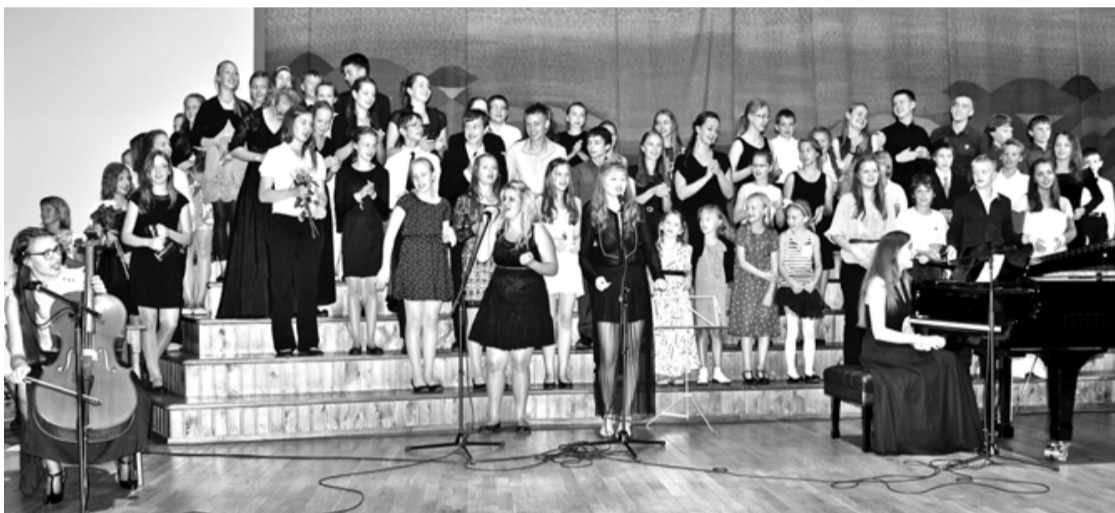
Meistarklašu audzēkņi koncerta vakarā saviem pedagogiem, vecākiem un koncerta klausītājiem bija sagatavojuši īpašu pārsteigumu - pašu sacerēto Salacgrīvas klasiskās mūzikas festivāla dziesmu

26. jūlijā Salacgrīvā ar skanīgu un krāšņu koncertu sākās jau IV Starptautiskais klasiskās mūzikas festivāls. Šogad klasiskās mūzikas svētki Salacgrīvā nozīmīgi ar to, ka atklāšanas koncertā pirmo reizi publikai skanēja festivāla labvēļu dāvātais Tallinas klavieru fabrikā tapušais koncertflīģelis.