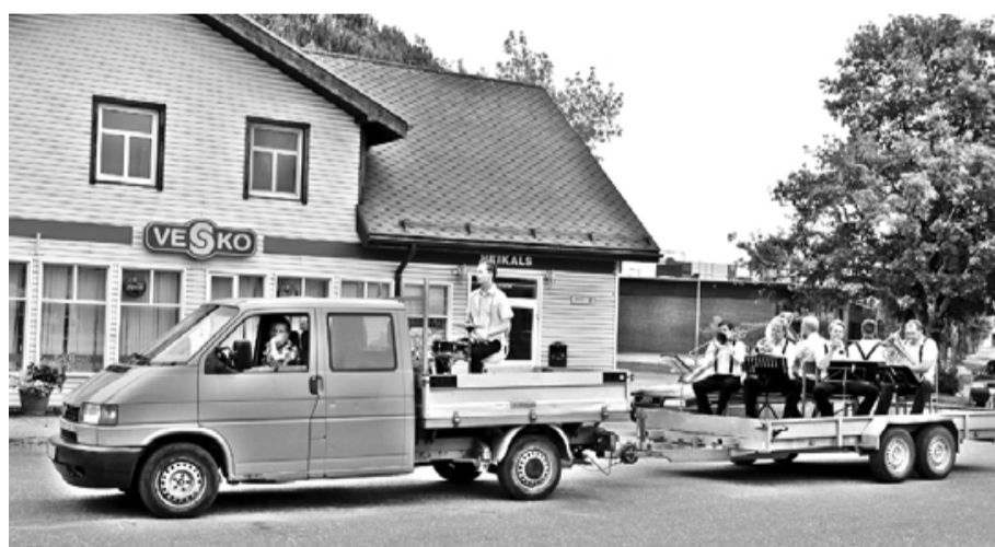
Salacgrīviešus svētku rītā modināja pūtēju no grupas All Remember