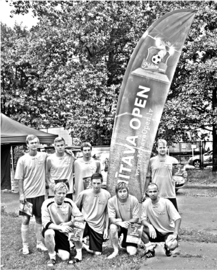
Sprints A komanda futbola čempionātā Mītava Open

Jau piekto gadu pēc kārtas notika amatieru futbola čempionāts Mītava Open , un otro reizi tajā piedalījās arī biedrības Sprints A komanda. Šoreiz tā startēja čempionāta 6. posmā, kas notika 10. augustā Rīgā, Alberta stadionā.