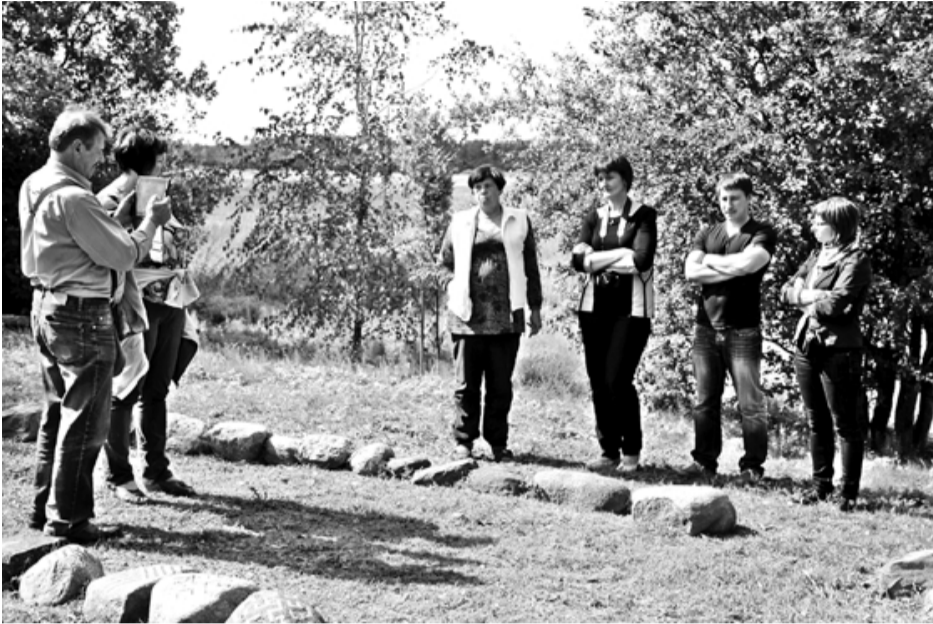
Zeltiņos vērtēšanas komisija apskatīja sakopto seno latviešu tradīciju svinēšanas vietu. Kas zina, varbūt nākamās saulgrīžas varētu sagaidīt Zeltiņos!