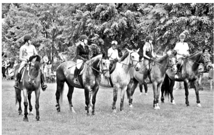
Skatītājus priecēja jātnieku kluba Fenikss dalībnieki