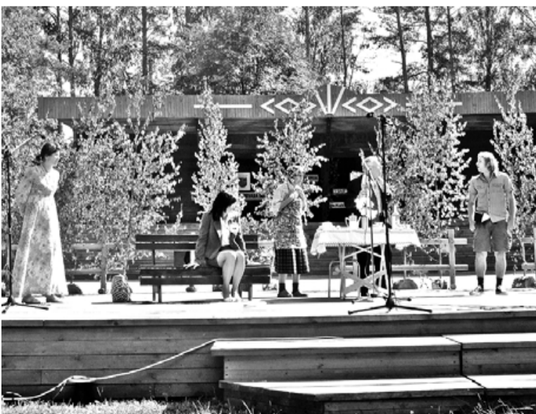
Salacgrīviešu brīv-dabas izrāde strenčniešiem patika