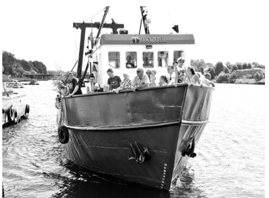
SIA «Baņķis» šogad svētku svinētājiem bija sarūpējis īpašu pārsteigumu - vizināšanās ar kuģiņiem bija par brīvu