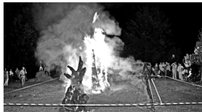
Kārja īles un ainažnieku veidotās ugunsskulptūras kā varena lāpas apliecināja - šis festivāls beidzies, sākam gaidīt nākamo!

Dienas aktivitātes kā varens vilnis vēlās pār Ainažiem, lai nedaudz rimtos pēc pl. 17, bet jau 20 turpinātos ar vēl lielāku spēku, jo uz skatuves kāpa Cēsu karmīnkrašas karoga