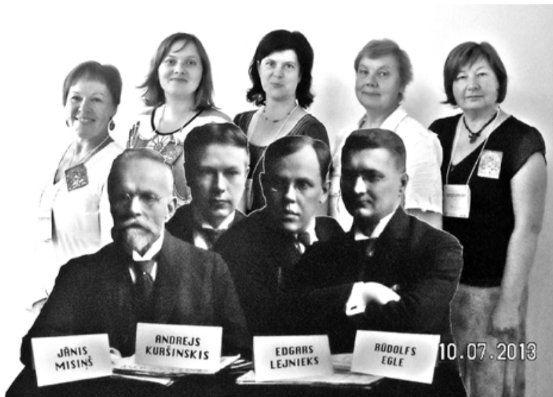
Salacgrīvas novada bibliotekāri Latvijas bibliotekāru biedrības Vidzemes nodaļas saietā - konferencē

Pašā vasaras vidū - 10. un 11. jūlijā - jau 16. gadu pēc kārtas notika Latvijas bibliotekāru biedrības Vidzemes nodaļas saiets-konference. Šoreiz saimnieku lomā bija Valmieras novada bibliotekāri. Konference ar nopietno nosaukumu Latviešu pilsoniskās sabiedrības un nacionālās izglītības sākums Gaujas krastos Valmierā pulcēja vairāk nekā 100 bibliotekāru. Viena no saieta galvenajām aktivitātēm bija personiskās pilnveides meistarklases, kas notika Valmieras pievārtē viesu namā Gaujas priedes . Pēc izlozes katram bibliotekāram bija iespēja piedalīties 1 no 6 meistarklasēm.