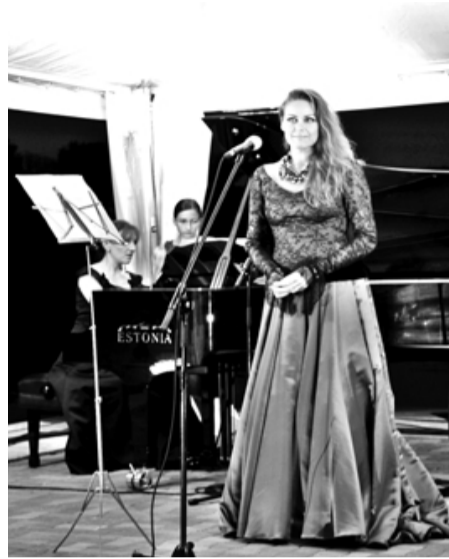
Ar ovācijām apmeklētāji sagaidīja koncerta goda viesiņu - operdziedātāju Kristīni Opolais