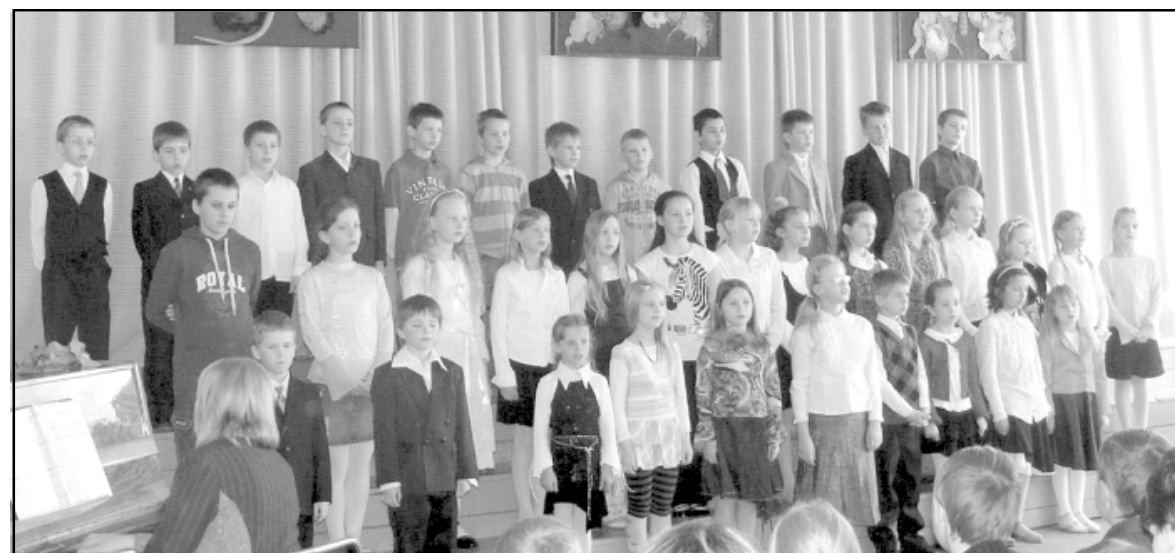
Māmiņdienas koncerts Liepupes vidusskolā

7. maijā Liepupes vidusskolā notika Mātes dienai veltīts dziedātāju gada atskaites koncerts, kurā uzstājās sākumskolas koris, 2. - 3. klašu meiteņu vokālais ansamblis, 2. - 3. klašu zēnu vokālais ansamblis, 6. klases meiteņu vokālais ansamblis, 6. klases zēnu vokālais an-