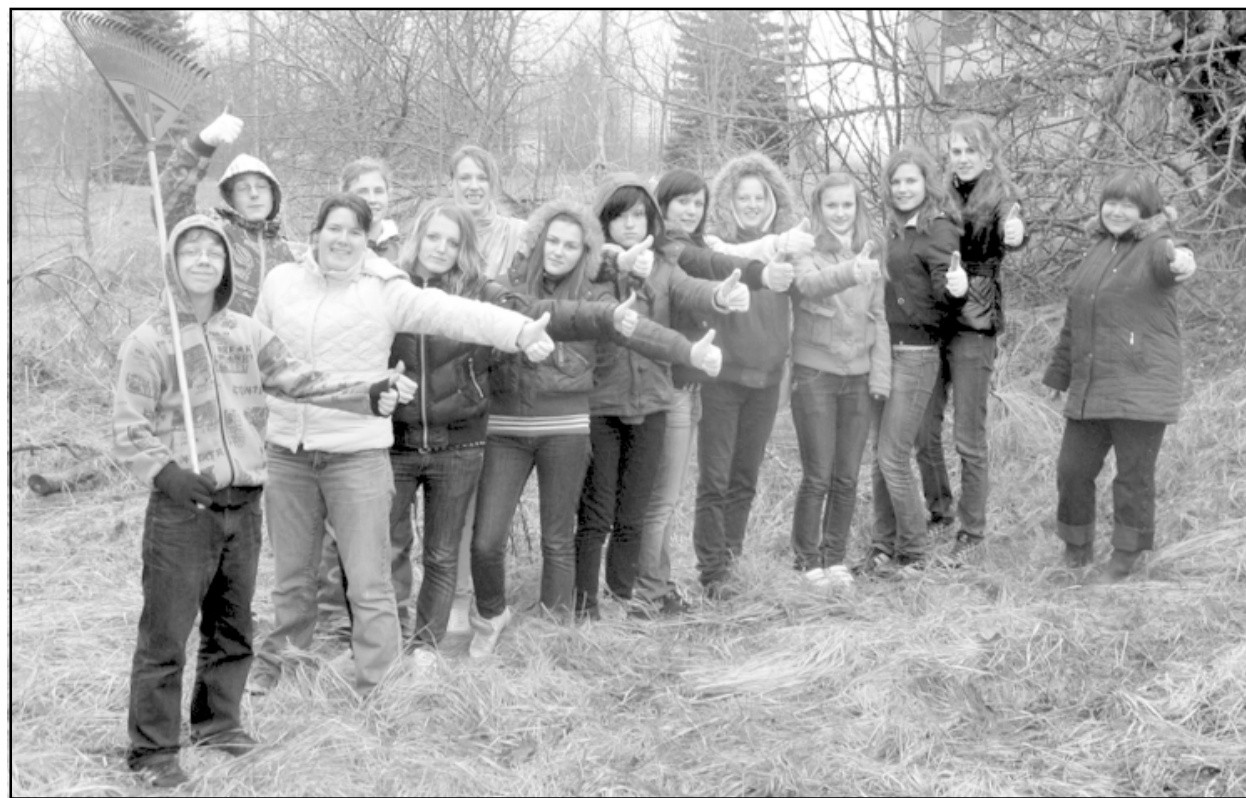
Liepupes vidusskolas skolēni apmierināti - labs darbs paveikts!

22. aprīlī viss Liepupes vidusskolas kolektīvs - gan skolotāji, gan skolēni - devās Lielajā talkā, kur sakopa gan skolas, gan pagasta teritorijas. Katrai klasei tika iedalīts savs maršruts.