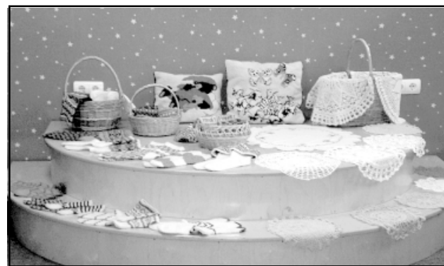
Rokdarbu izstāde Ainažu bibliotēkā

Rūta Lepiksone, Ainažu bibliotēkas vadītāja