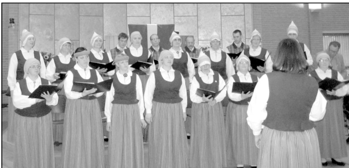
Holandiešu draugiem dzied jauktais koris Krasts

Vairāk nekā trīs stundu koncerts pagāja negaidīti ātri un izraisīja patiesas emocijas gan Holandes kristīgā vīru kora varenā sastāvā, gan kristīgā jauktā kora Credo dziedātāji , gan kora Krasts , īpaši a cappella snieguma dēļ. Holandiešiem nav izteiktas pašdarbnieku dejojāšu tradīcijas, tāpēc deju grupa Jūrmalnieks tika uzņemta īpaši mīļi.