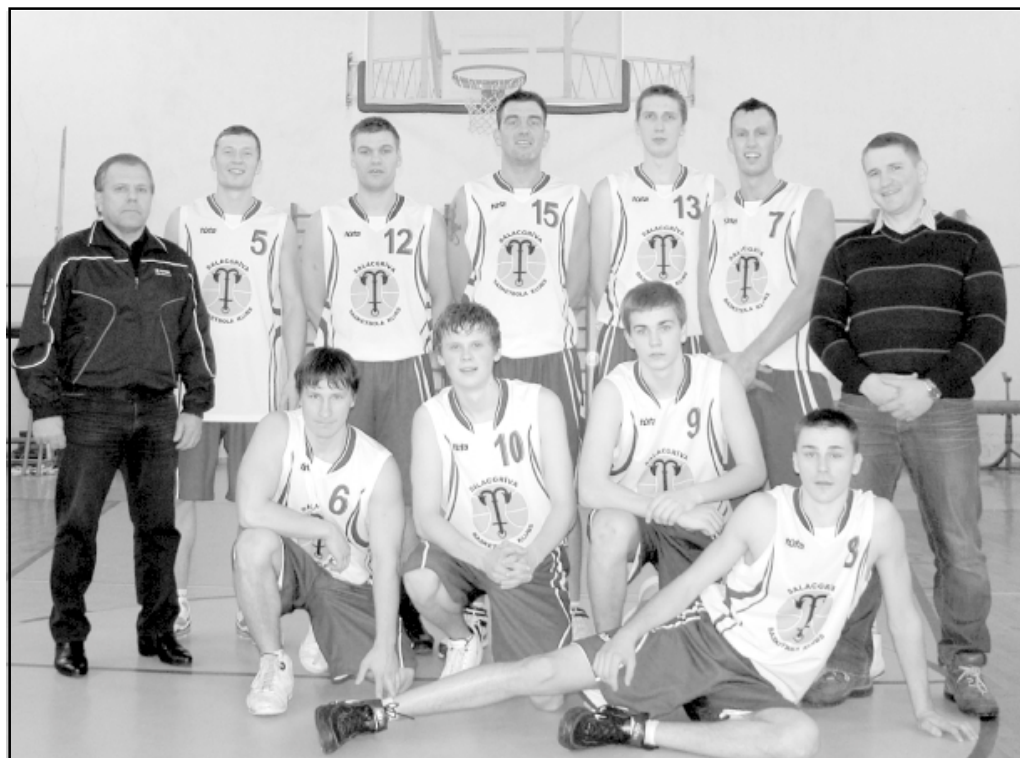
Basketbola komanda Salacgrīva ir gandarīta par sezonā paveikto