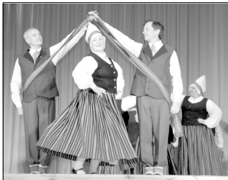
Dejo Limbažu seniori «Sagša»