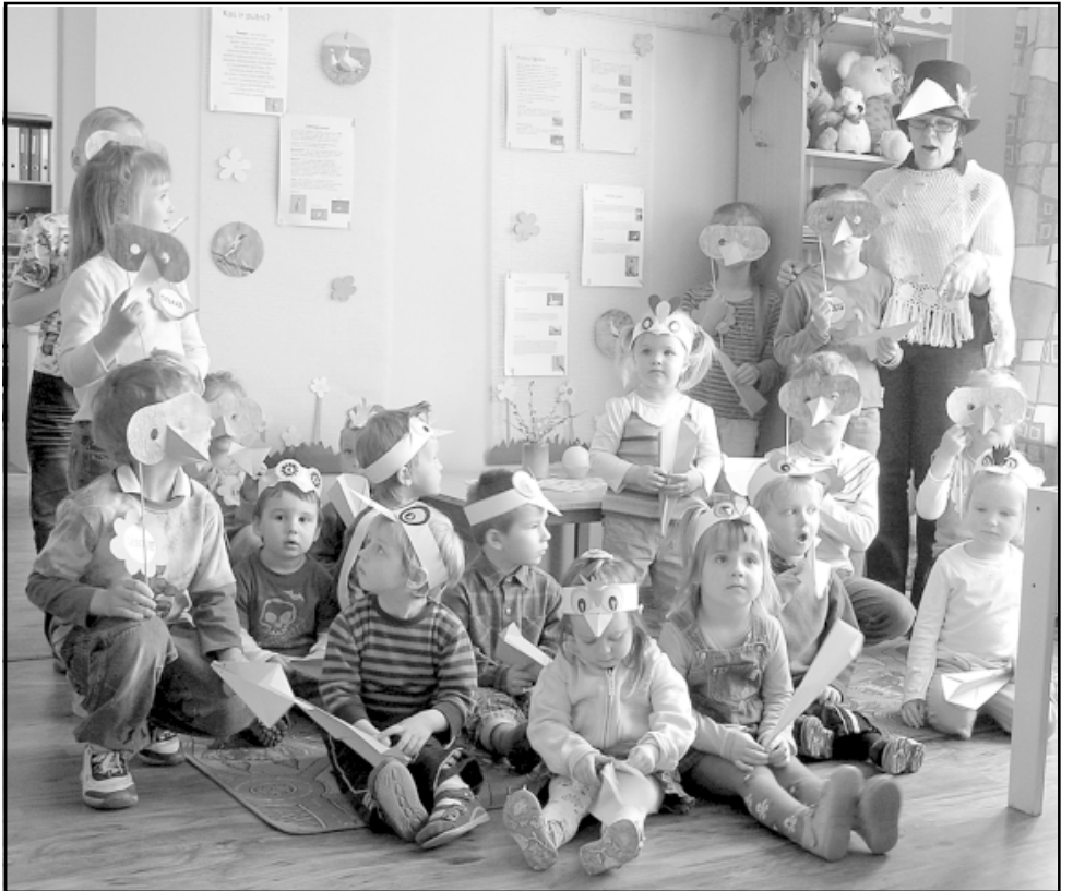
Svētciema bibliotēkā viesojas Snīpēni

No 19. līdz 23. aprīlim visā Latvijā bija Bibliotēku nedēļa. Tās aizsākumi meklējami 1996. gadā, kad UNESCO 23. aprīli pasludināja par Pasaules grāmatu un autoritātes aizsardzības dienu, kad visā pasaulē cildina grāmatas un to lasīšana. Šīs nedēļas laikā daudz plašāk tiek runāts par bibliotēku darbu, to aktualitātēm un problēmām, tiek rīkoti dažādi pasākumi.