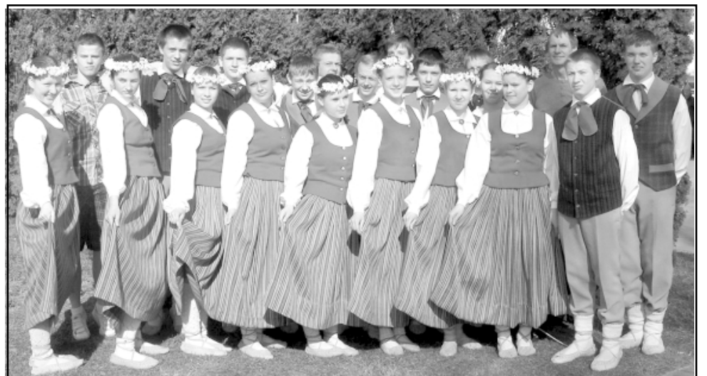
7. - 9. klašu deju kolektīvs