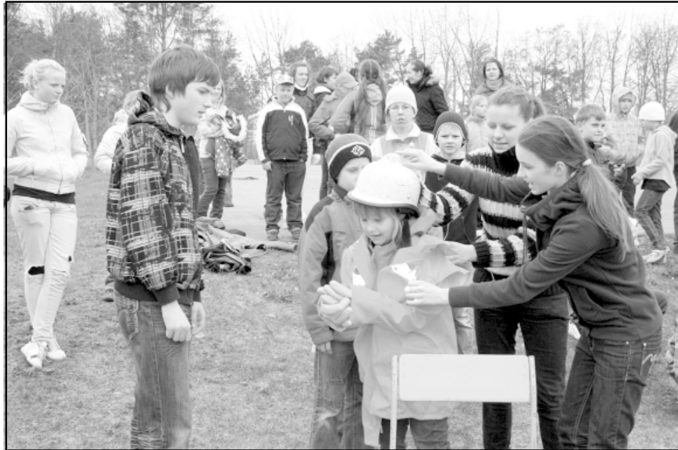
BUB atvērtās durvju diena Ainažu pamatskolā bērniem ļoti patika