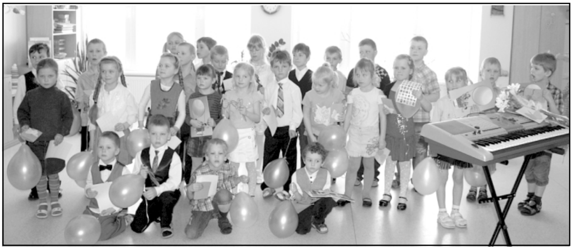
Pavasara pasākums Randā

Sarīkojums bija izdevies jauks, draudzīgs un atraktīvs. Bērniem šī diena bija pozitīvu emociju pārpil-