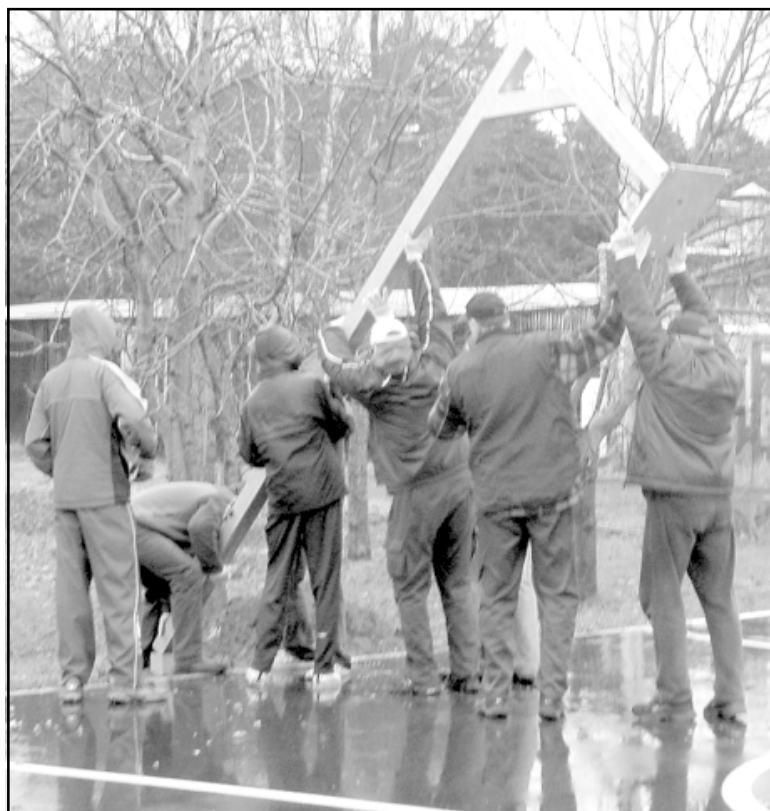
Ainažos pie skolas tiek uzstādīts basketbola grozs