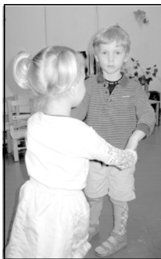
Dejo mazie pelēni