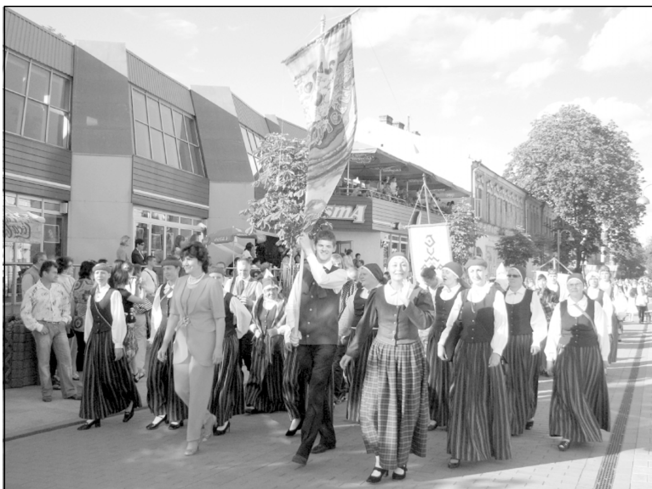
Liepupes koris Pernigēle dziesmu svētkos Daugavpilī