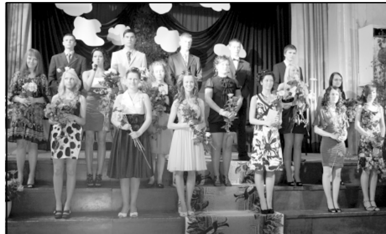
Krišjāņa Valdemāra Ainažu pamatskolas beidzēji

Salacgrīvas novada domes priekšsēdētājs, sveicot absolventus, teica: - Mēs zināmā mērā esam vienaudži, jo tieši pirms 9 gadiem