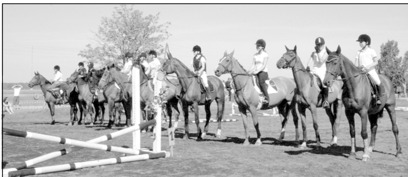
Vadības maršruta dalībnieku parādē