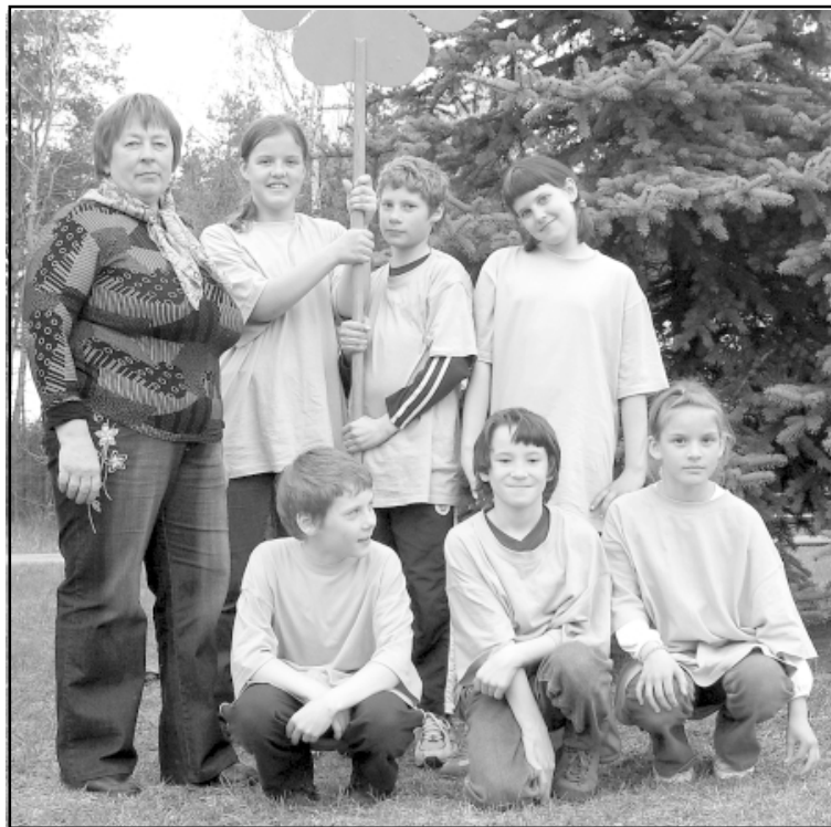
Mazpulcēni sporta spēlēs Ķekavā