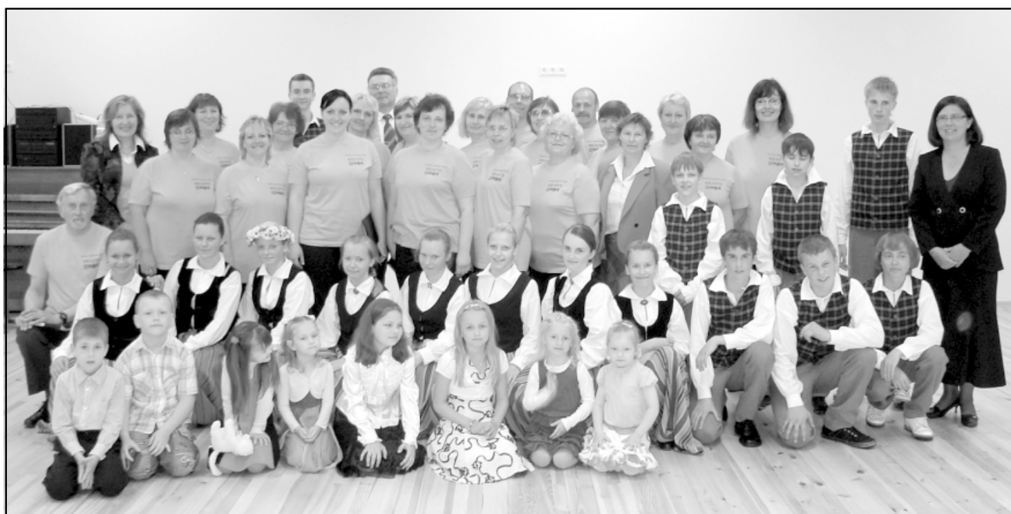
Ainažu pašdarbnieki pēc koncerta slimnīcā