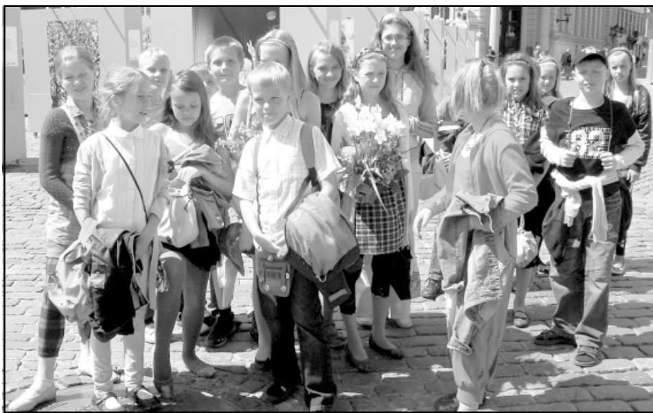
Salacgrīvas vidusskolas 4.a klase Doma laukumā

Salacgrīvas vidusskolas 4.a klase devās uz Rīgu, lai piedalītos jaukā pasākumā, kas bija balva pēc nopietna Latvijas radio raidījuma 1, 2, 3 - ejam meklēt konkursa. Raidījumā katru svētdienas rītu tiek stāstīts par kādu talantīgu Latvijas sākumskolas klasi. Konkursā bija jāpiedalās visai klasei, jāizvēlas 1 no 2 piedāvātajiem teikumiem - Ja es būtu prezidents, tad... vai Pasaule kļūtu labāka, ja... - un tas jāpabeidz. Asprātīgāko un interesantāko atbildi autori ieguva iespēju ciemoties vasaras ballītē Latvijas Radio.