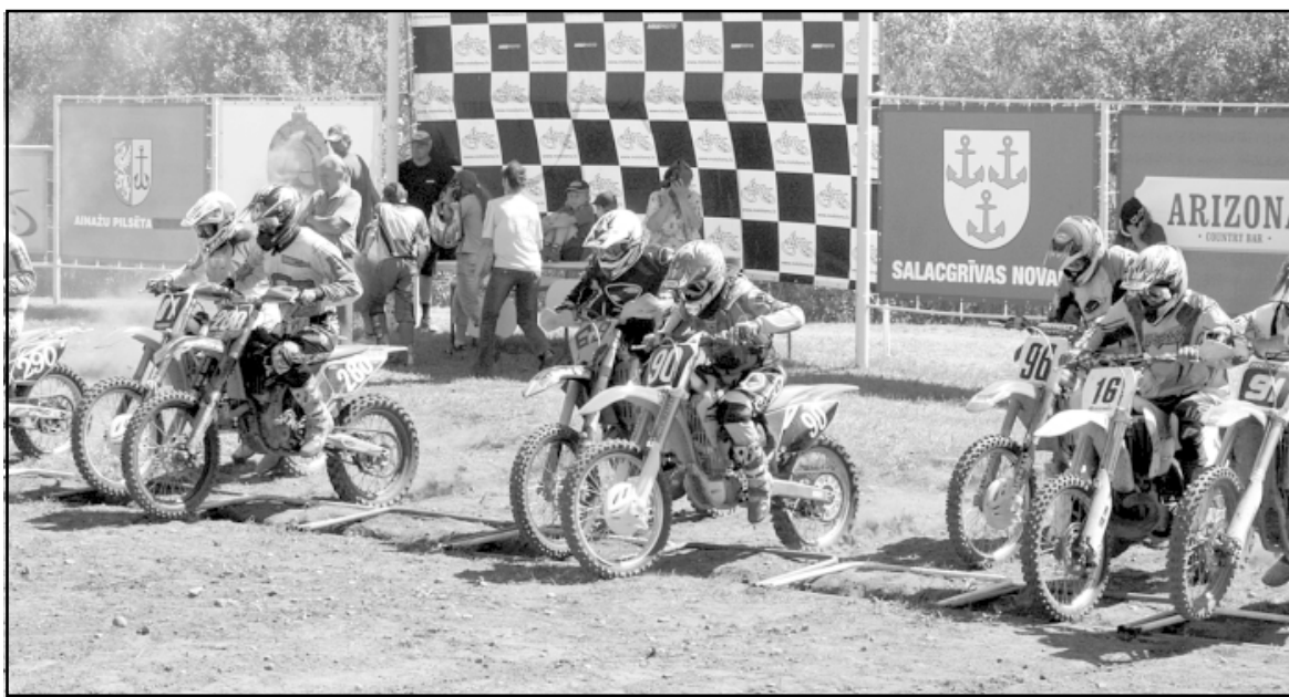
Braucēji dodas trasē