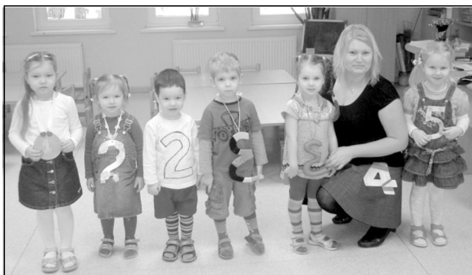
Mazie cipari Ainažu Randā