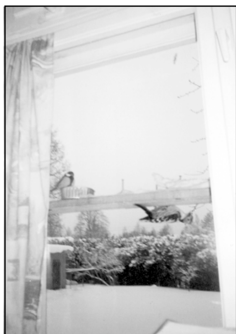
Lielā zīlīte un dižraibais dzenis

Pie ēdamgaldā knābā pelēkā vai purva zīlīte. Pārāk līdzīgas ir šīs sugas māsas. Daļa rudenī aizceļojot, daļa paliekot ziemot. Ļoti kustīgs, nīprš putnelis. Atlido cita zīlīte. Spārni un aste zilā krāsā, tā graciozi groza galviņu ar burvīgu zilu cepurīti. Pa koka stumbru lodā zaļā dzīlna. Tā ir sīļa lieluma. Iespējams, ka dzīvo kādā no veco liepu dobumiem, jo šo skaisto putnu redzu bieži. Reizēm tā uztupstas uz barības dēlīša, bet lielu interesi neizrāda. Var redzēt, ka putnam patīk doties ceļojumā pa koka stumbru gan ar galvu uz augšu, gan leju... Kad atlido dzīlnīte, izdodas vērot putnu sadzīvi. Ja laiks ir ļoti auksts, dzīlnīte