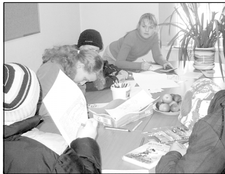
Žūrija ļoti rūpīgi izvērtēja visas vērtēšanai ieteiktās grāmatas