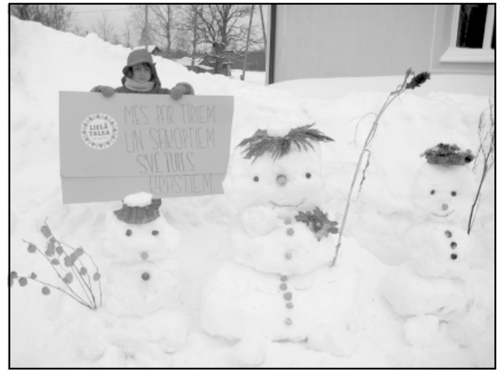
Sniegavīri pie Lauvu tautas nama vēl ilgi priecēs lielos un mazos

Ja jau svētku diena, tad bez cienasta neiztikt. Kopīgi pagatavojām arī ēdamus sniegavīrus - mazus, bet saldus vīriņus. Garšoja labi! Dienas otrajā pusē lējam svences, lai sil-