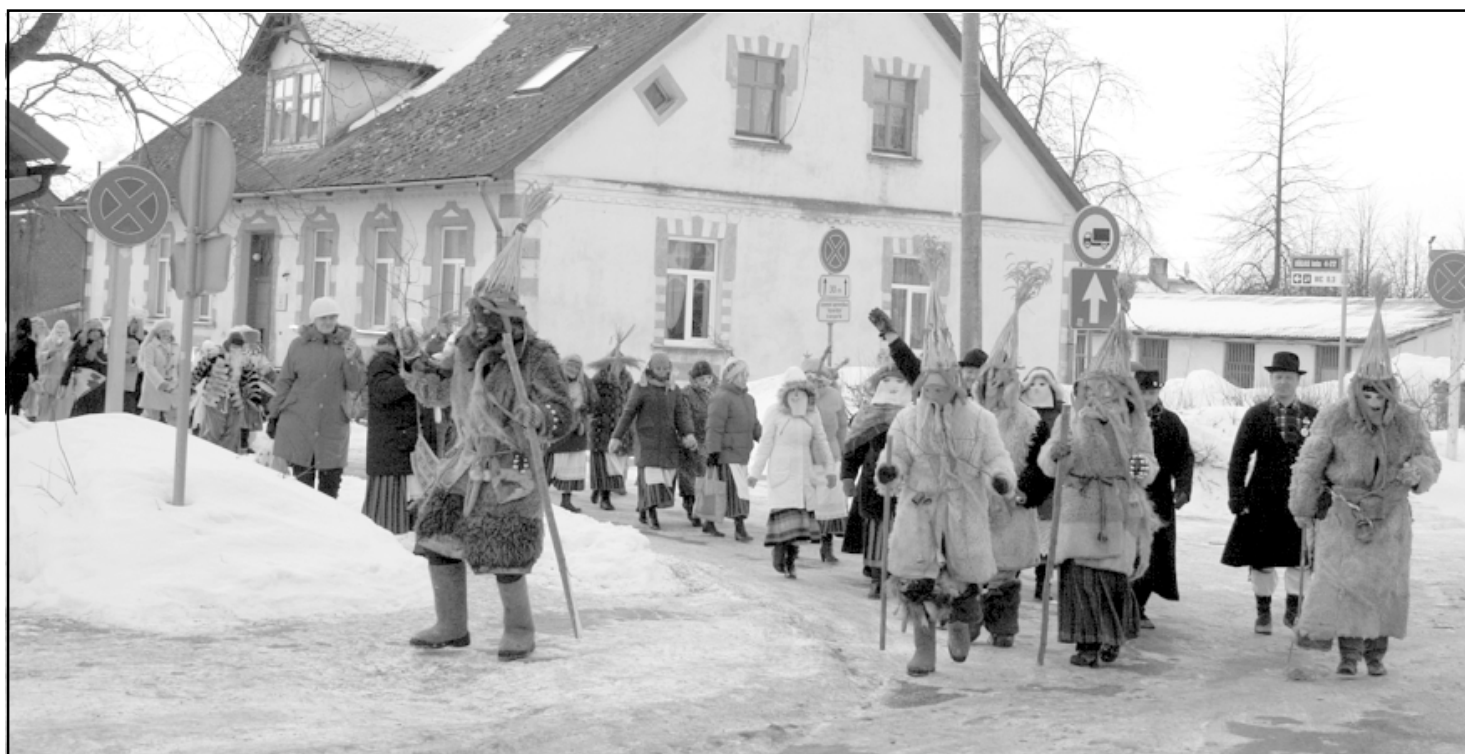
Masku festivāla gājiens, izdimdinot Salacgrīvu, no pilsētas bibliotēkas pa Rīgas ielu dodas uz pilskalnu

Drīz pēc tam, jau 6 vakarā, Salacgrīvas kultūras nams rībēja bezgala - īpaši jau sākumā, jo maskas sanāca ar apduļļinošu troksni un uzbūra īsto svētku sajūtu. Tas nebija