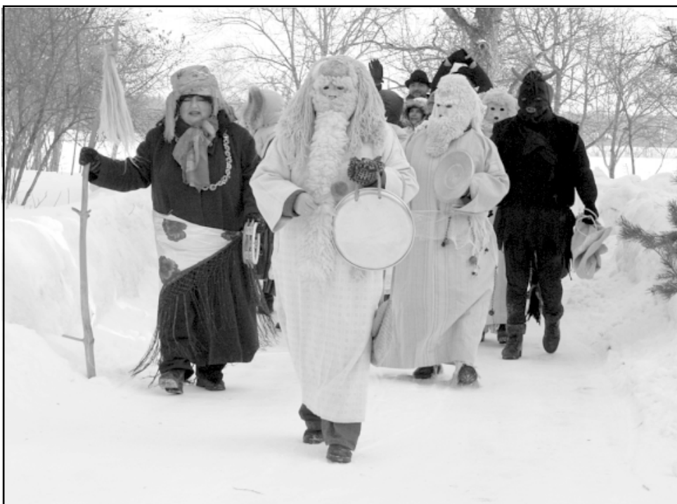
Masku festivāla izdarības notika arī Silmaļos , kur maskas cienāja ar siltu tēju un pelēkajiem zirņiem