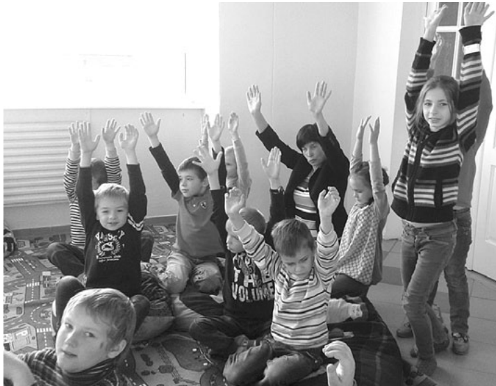
Mazie liepupieši kopā ar skolotājām atceras tautasdziesmu vārdus un prot tās atainot ar kustībām