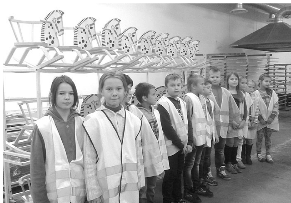
Liepupes skolēni ceļā, kur top šūpulzirdziņi