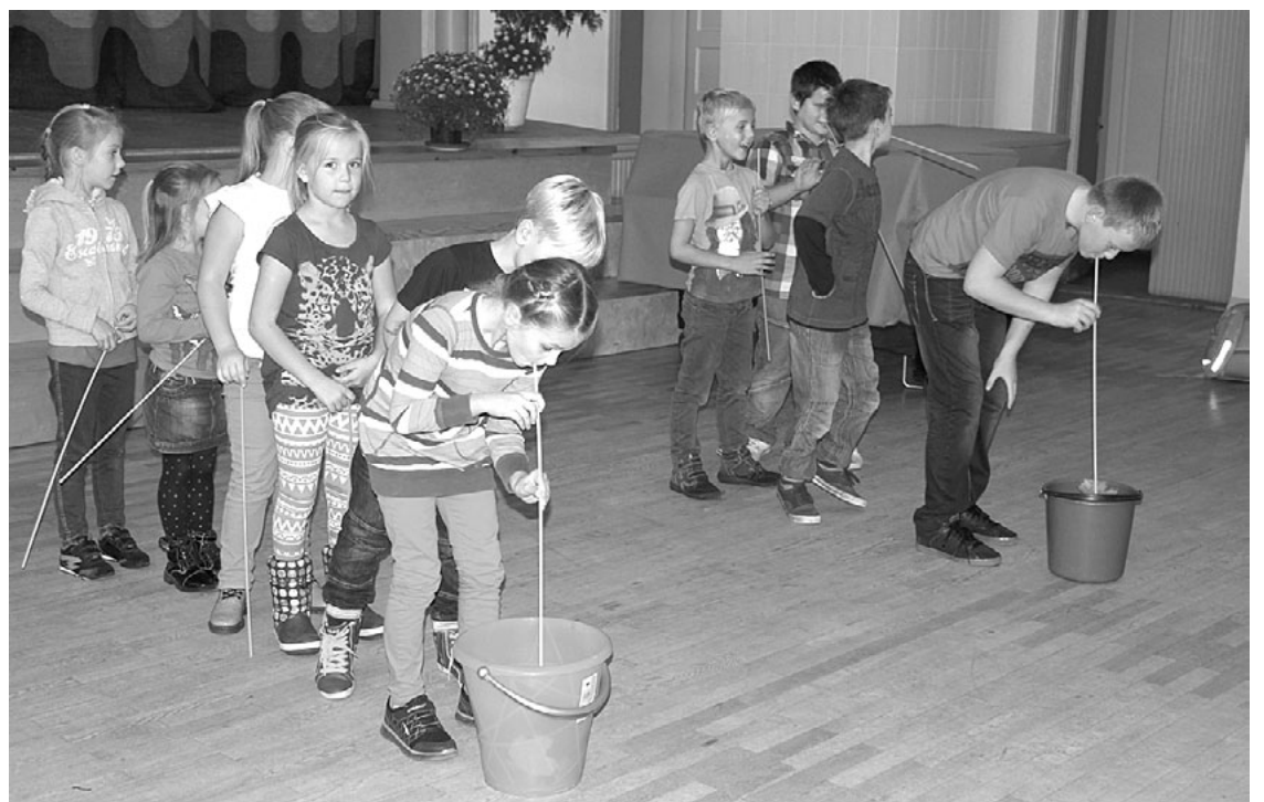
Nemaz nav tik viegli bez roku palīdzības ar salmiņu pārvietot rudens lapas