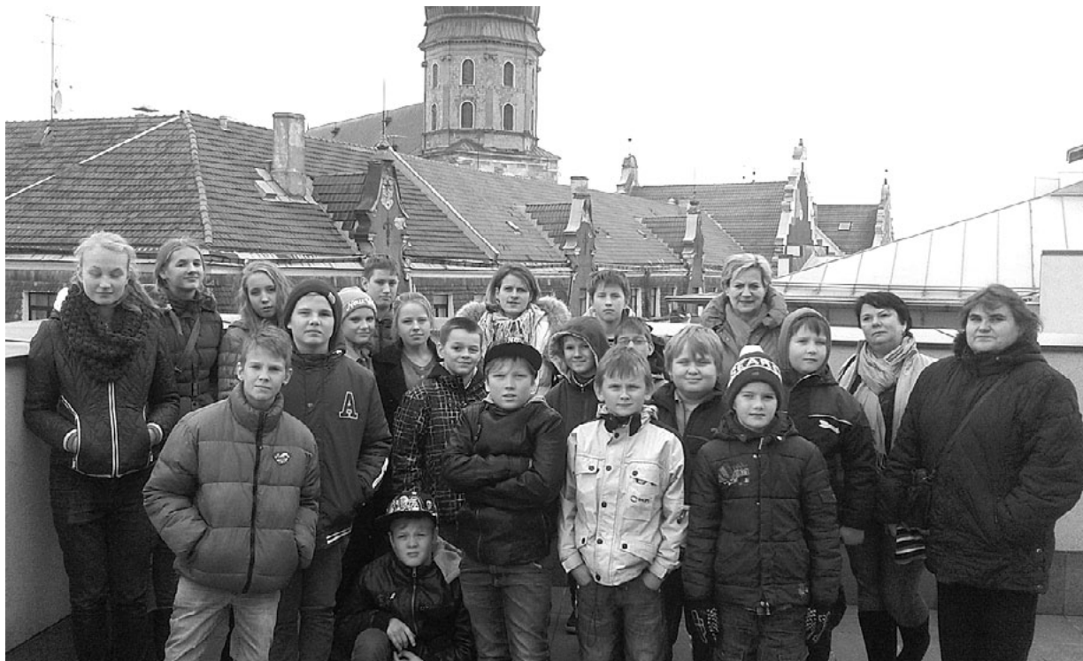
Vecākie audzēkņi ar interesi iepazīs Rīgas domes ēku