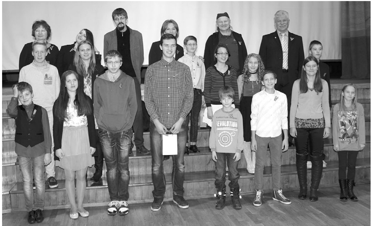
6. Vidzemes patriotiskās dzejas festivāla uzvarētāji kopā ar viesiem

Festivāla krusttēvs, kinorežisors Jānis Streičs diemžēl nevarēja piedalīties festivāla atklāšanā, bet viņa atsūtītais videoveiciens iepriecināja visus dalībniekus. - Esmu dedzīgs šī pasākuma atbalstītājs, kopš tas izveidojies, un visos festivālos esmu bijis kopā ar jums. Ar satraukumu gaidu šo dienu, lai ieelpotu jūsu gaisu, sagaidītu jaunību no visas Latvijas. Sveicu jūs valsts svētkos, kas šodien Salacgrīvā sakrīt ar dailes svētkiem, ar mākslu, ar poēziju. Raiņa lugā «Uguns un nakts» Spīdola saka Lāčplēsim: „Tu spēks, es daile, mēs saderam kopā, mūsu mērķis ir viens - pilnība!“. Šodien tā pilnība ir Salacgrīvā, jūs to nesat mums!