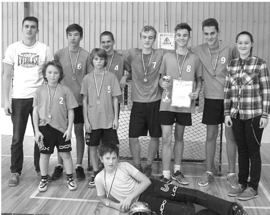
Limbažu, Salacgrīvas un Alojās novada vispārīgizglītojošo skolu sacensībās florbolā Liepupes komandai sudrabs. Apsveicam!

4. novembrī Vidrižu sporta hallē pirmo reizi notika Limbažu, Salacgrīvas un Alojās novada vispārīgizglītojošo skolu sacensības florbolā. Sacentās 1998. - 2000. g. dzimušie jeb 8. - 9. klašu skolēnu komandas - 4 zēnu un 2 meiteņu.