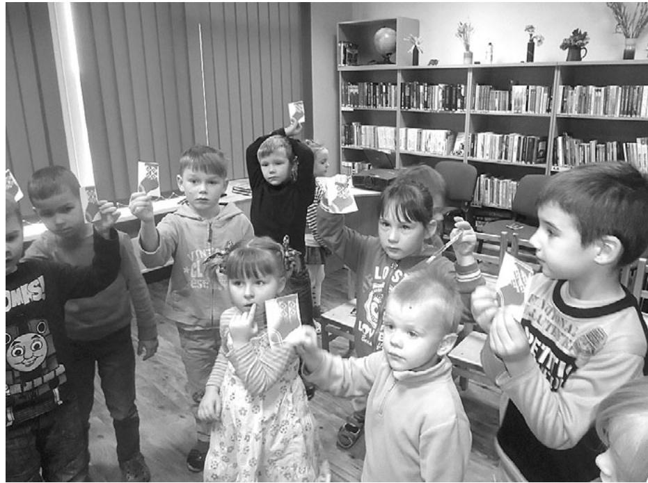
Rīta stundas mazie viesi Svētciema bibliotēkā meklē troļļu paslēptās zeķītes

Toties Rīta stunda vēl nebeidzās. Visas sarunas klausījās un šķelmīgi vēroja zem lielā ekrāna paslēpušies troļļēni. Un tad jau arī viņi tika rādīti kā filmu zvaigznes! Tik dažādi un teiksmaini kā pati Norvēģija! Mazie varēja sekot braucienam pa Troļļu ceļa serpentīnu, līdz varēja ieraudzīt troļļu atstātās pēdas - sakrūtās akmeņu piramīdas. Un kalnu galotnes sniedzās mākonos, un no tiem atkal iznirst troļļis... Bērni uzzināja, ka arī troļļim ir bail. Vai zināt,