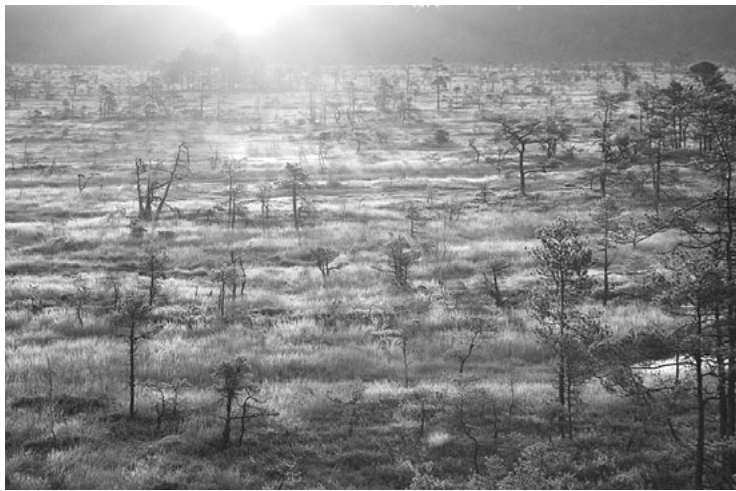
1. vieta un 2015. gada Salacgrīvas novada kalendāra vāka bilde, tās autors - korģenietis Rolands Ūdris

- Es neesmu fotogrāfs, - par sevi saka salacgrīvietis V. Menniks, kurš tagad dzīvo un strādā Rīgā. - Brīvajos brīžos vienkārši tāpat "knipsēju." Konkursā piedalos