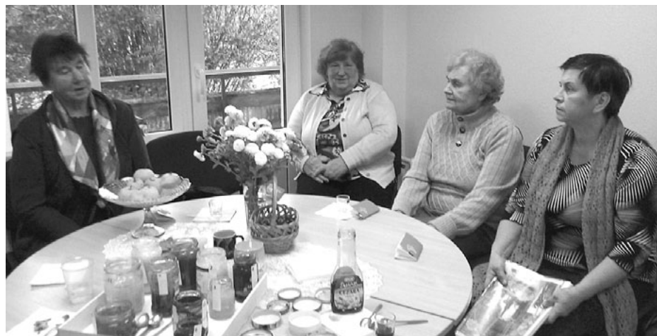
Kad pagaršots no visām burciņām, klāt grūtais izšķiršanās brīdis - kura tā labākā...