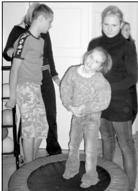
Prieks valdīja, Salacgrīvas bērniem cemojoties pie Rīgas 2. speciālās internātpamatskolas skolēniem

Tikšanās ar internātpamatskolas bērniem aizritēja ļoti patīkami. Sākumā gan visi bija klusi un mierīgi, mēģinot saprast, kas tagad