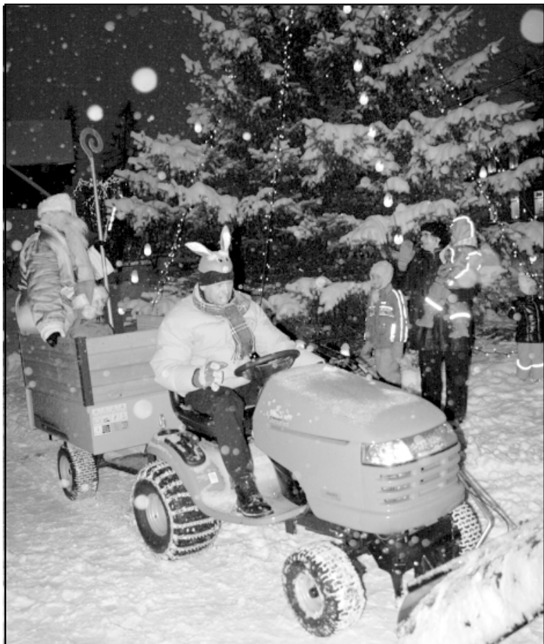
Ziemassvētku vecītis uz egles iedegšanu Ainažos bija atbraucis ar savu sniega mašīnu

Trešajā Adventē Salacgrīvas novadā iedegza pilsētas egles Ainažos un Salacgrīvā. Ainažos šī diena bija īpaša, jo pēc egles iedegšanas cilvēki devās uz kultūras namu, lai grieztu lenti un svinīgi atklātu izremontēto kultūras namu.