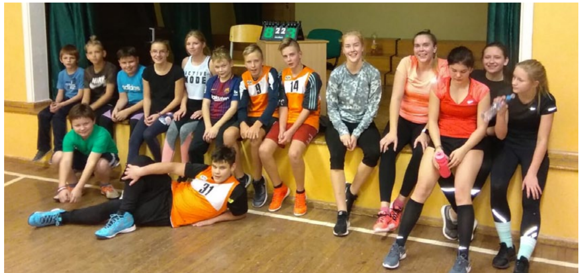
Pēc kopīgas spēles tapa kopbilde

15. novembrī Ainažos norisinājās draudzības spēle basketbolā starp Krišjāņa Valdemāra Ainažu pamatskolas un Salac-