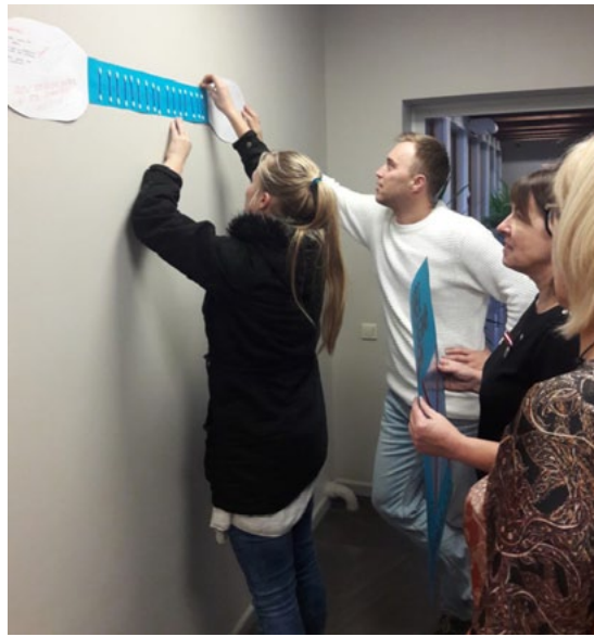
Plakāti Salacgrīvas novada domē

Domāsim par sevi, dabu un nelietosim vienreizējās plastmasas izstrādājumus!