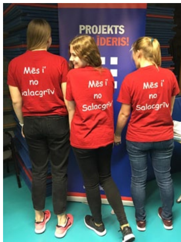
Salacgrīvas vidusskolas jauniešu spēļu naktī Ledlauži

Esi līderis! ir visas Latvijas skolu projekts, kas jau 18 gadu dod iespēju skolēniem iegūt daudzpusīgas zināšanas uzņēmējdarbībā un personības attīstībā. Arī Salacgrīvas vidusskola ir šajā projektā – skolēniem no 7. klases ir iespēja piedalīties tajā pēc brīvprātības principa.