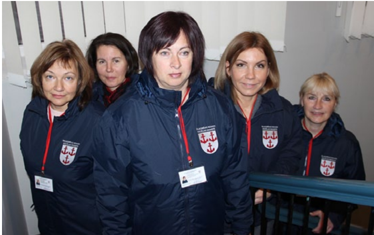
Salacgrīvas novada Sociālajam dienestam jauni formastērpi

Salacgrīvas novada Sociālā dienesta darbinieki turpmāk pie saviem klientiem dosies vienādi tērpti. Viņus varēs pazīt pēc tum-