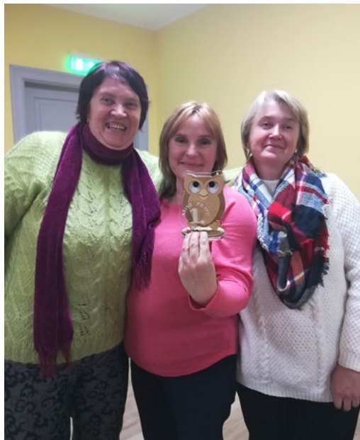
Krustvārdu mīklu minēšanas čempioni

Lauvu tautas nams, valsts svētkus gaidot