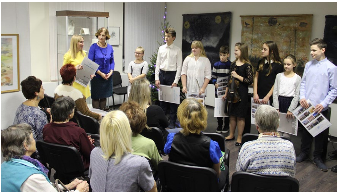
Salacgrīvas mūzikas skolas audzēkņu koncerts priecēja muzeja apmeklētājus