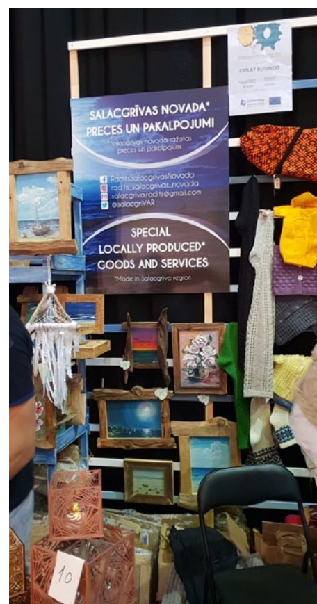
Salacgrīviešu stends Helsinkos

Šī informācija atspoguļo autora viedokli un Igaunijas-Latvijas programmas vadošā iestāde neatbild par tajā ietvertās informācijas iespējamo izmantošanu. Project: Est-Lat 48 «Estonian and Latvian entrepreneurs cooperation platform»