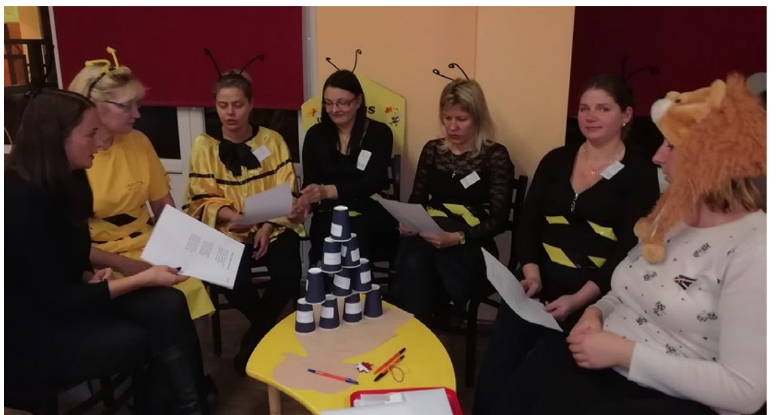
Ģimeņu simtgades viktorīna

Izglītojoši emocionālā vakara gaitā grupu komandas pārrunāja, ar ko raksturīga jaunā paaudze, cik liela vērtība ir bērns un cik nozīmīgi ir sadarboties pirmsskolai ar ģimeni, lai izaudzinātu krietnu cilvēku. Spriedām, kādas vērtības aktualizēsīm,