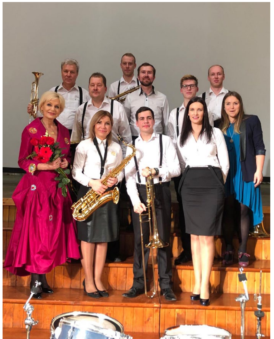
All Remember ar draugiem jubilejas reizē