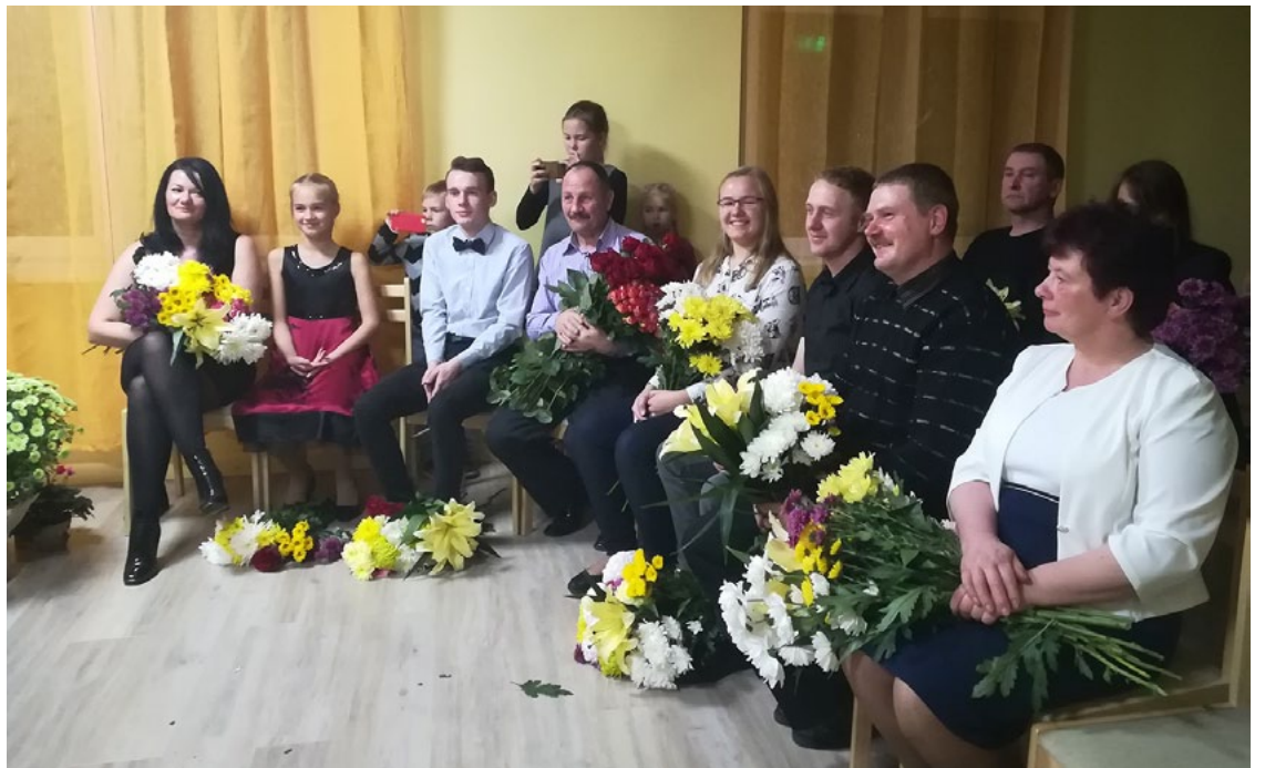
Šī gada jubilāri