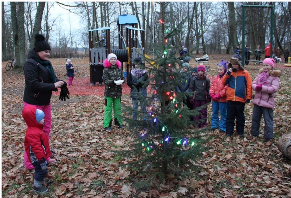
Svētciemā šogad rotāta arī mazā eglīte. Lai aug!

15. decembrī Svētciema muižas parkā pirmsvētku noskaņās pulcējās lieli un mazi, lai kopīgi svinētu svētkus. Lielā svētku egle jau bija izrotāta un izgaismota, bet šajā pēcpusdienā, dziedot kopīgu dziesmiņu, iedegās lampiņas parkā iestādītajā eglītē. Pēc pāris gadiem svētciemiešiem vairs nebūs jāmeklē egle mežā, varēs rotāt pašu stādīto.