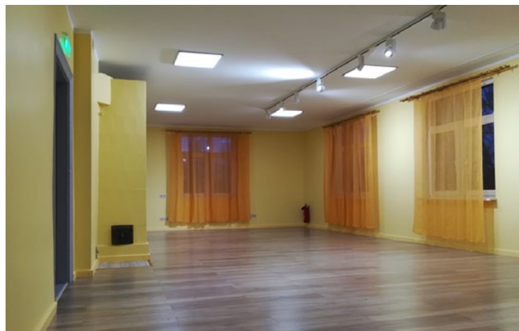
Lauvu tautas nama izremontētā zālīte