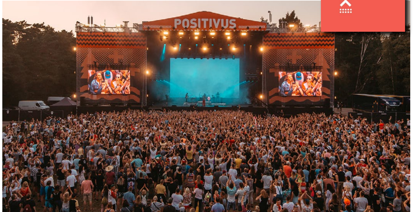
Positivus festivāls Salacgrīvā

Nākamajā vasarā Positivus festivālā sagaidīsim alternatīvo britu rokgrupu The 1975 . Grupa pazīstamību izpelnījās 2013. gadā, izdodot savu pirmo debijas albumu The 1975 , kas ar tās hitiem Chocolate un Sex iekaroja Lielbritānijas albumu topu virsotni. Turpinot komerciāli veiksmīgus panākumus, arī grupas nākamais albums I Like It When You Sleep, for You Are So Beautiful Yet So Unaware of It ar hitiem Somebody Else un The Sound iekaroja ne tikai Lielbritānijas topus, bet pieteica sevi arī ASV, pārdodot tur vairāk nekā 350 000 albumu kopiju, kā arī tika nominēti prestižajai Mercury