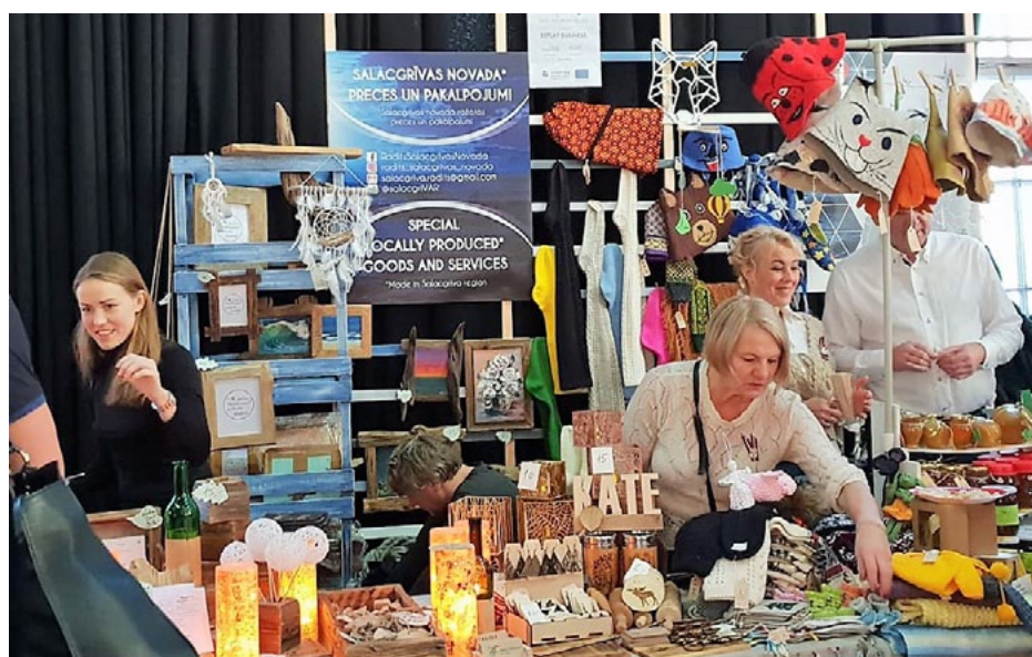
Salacgrīvas uzņēmēji gadatirgū Martin Markkinat 2018